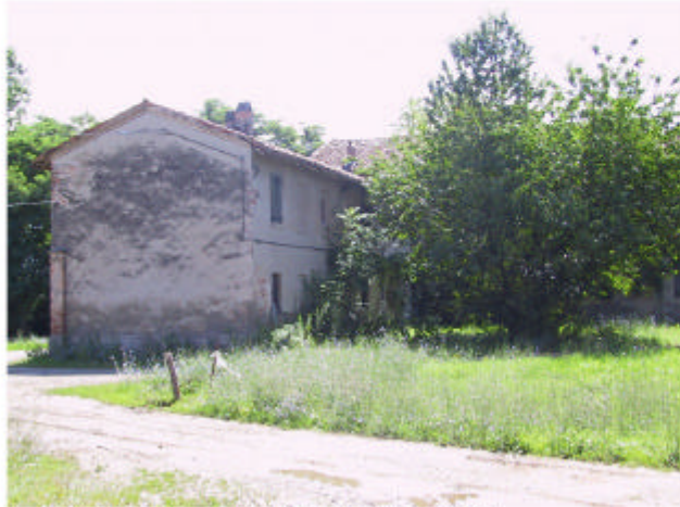
1. Edificio 7a. Fronti ovest e sud.