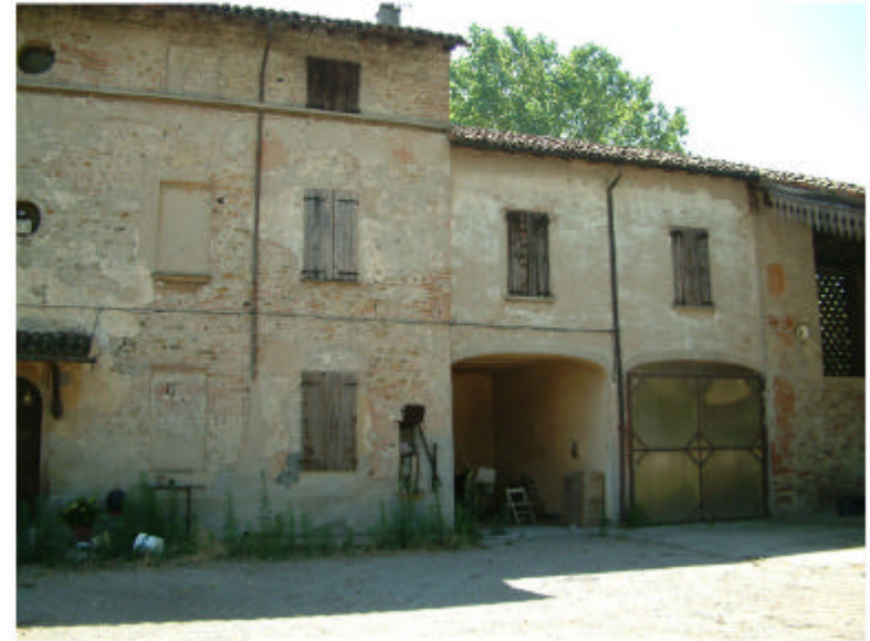
2. Fronte ovest