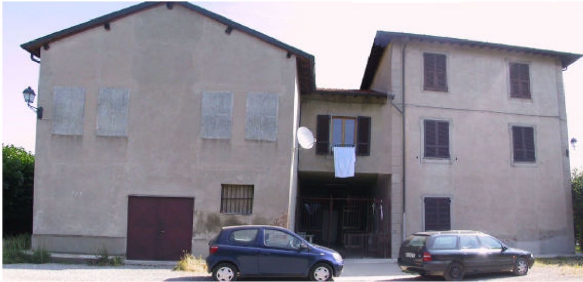
1. Edificio 1. Fronte sud-ovest.