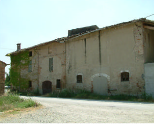
1. Edificio 1, parti 1b, 1c e 1d. Fronte nord