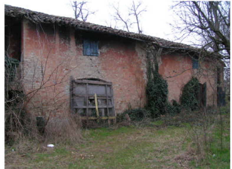
6. Edificio 1d. Fronte ovest