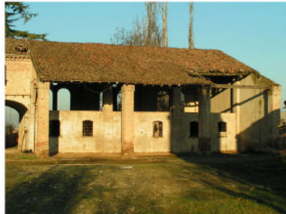
5. Edificio 2. Fronte sud-ovest