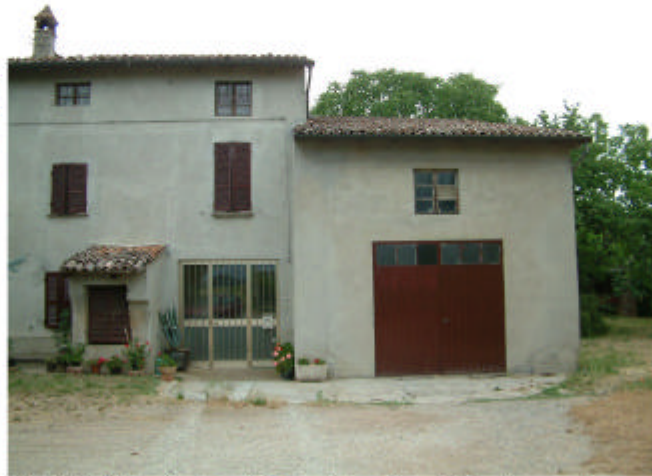
2. Edificio 1, parti 1a, 1b e 1c. Fronte sud.