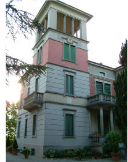
6. Edificio 3.