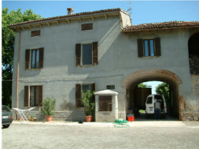
1. Edificio 1, parti 1a e 1b. Fronte sud.