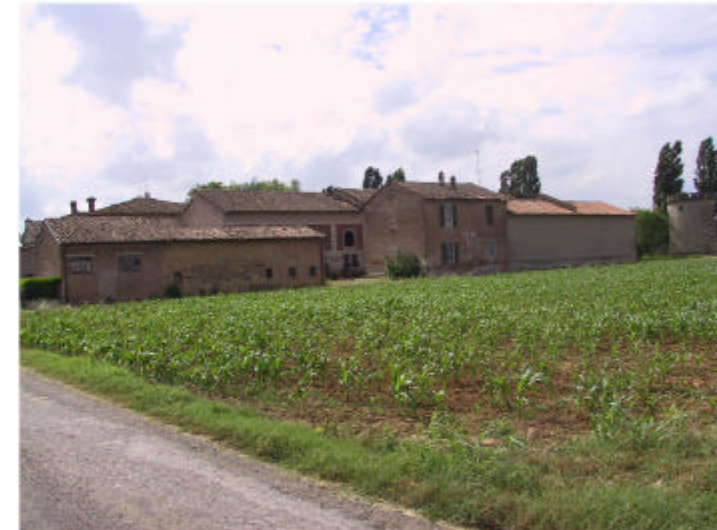
12. Vista del complesso da Nord. Edifici 5 e 6.