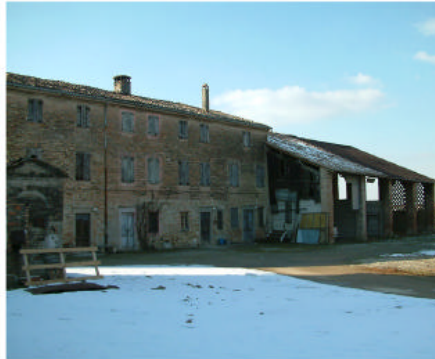
10. Edificio 2. Fronte est