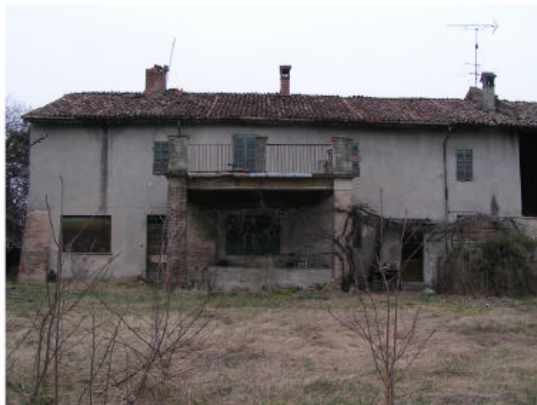
3. Edificio 1a. Fronte sud