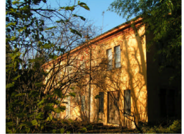
3. Edificio 1. Fronte sud-ovest