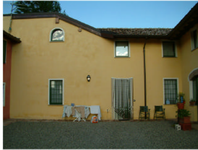
2. Edificio 1, parte 1b. Fronte ovest.