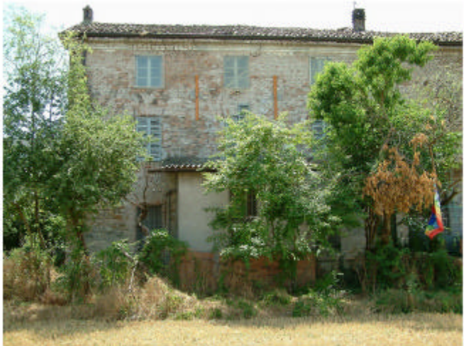
4. Edificio 1, parti 1a, 1b. Fronte nord