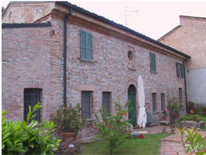
7. Edificio2, parte 2e. Fronte Nord-Est.