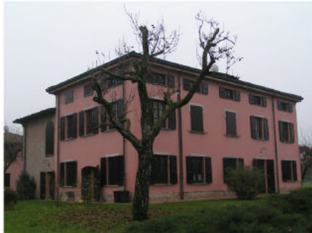
1. Edificio 1. Fronte nord-ovest