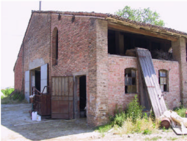
1. Edificio 1d. Fronti ovest e sud.