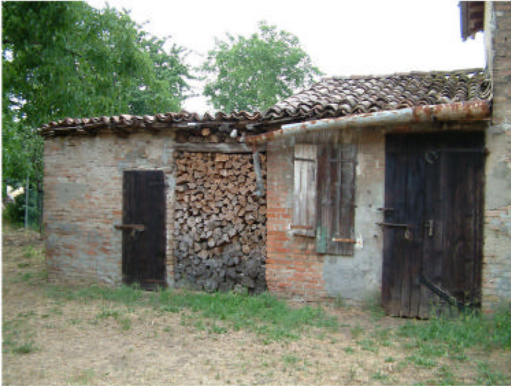
7. Edificio 3, parte 3a. Fronte ovest