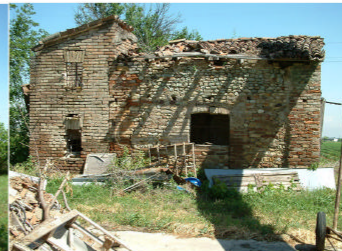
6. Edificio 3. Fronte sud