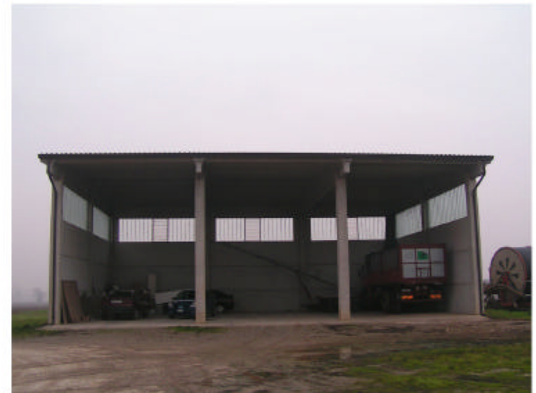
4. Edificio 2