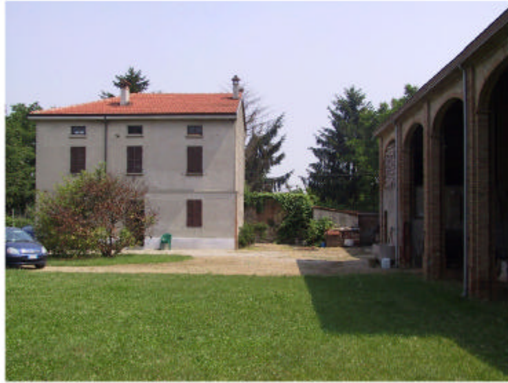
1. Edificio 1. Fronte sud.