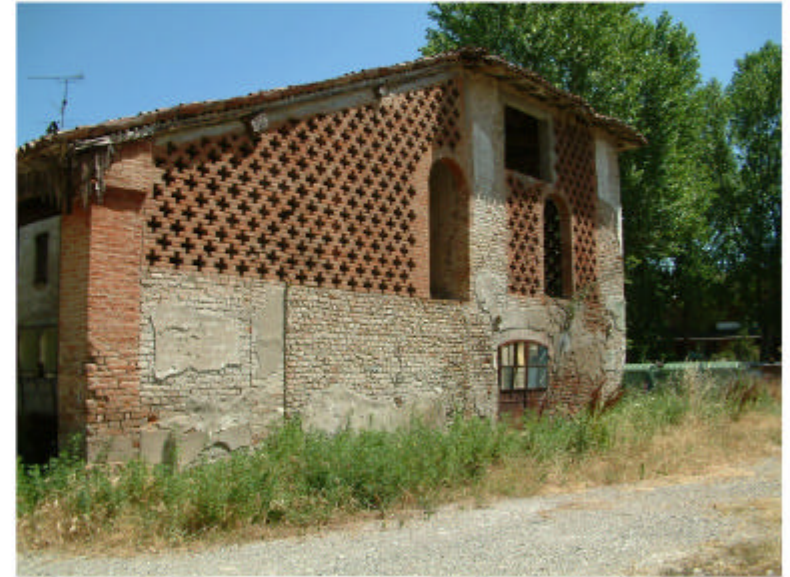
6. Fronte sud.