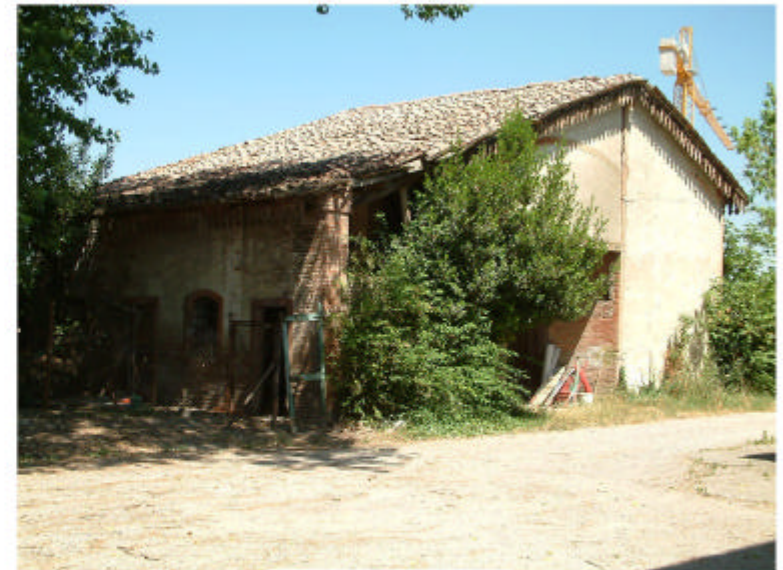
8. Fronte sud-est,