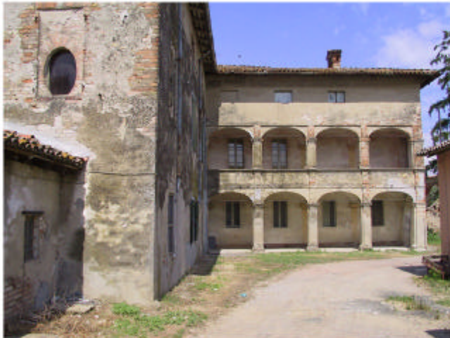
4. Edificio 1. Fronti nord-est e sud-est.