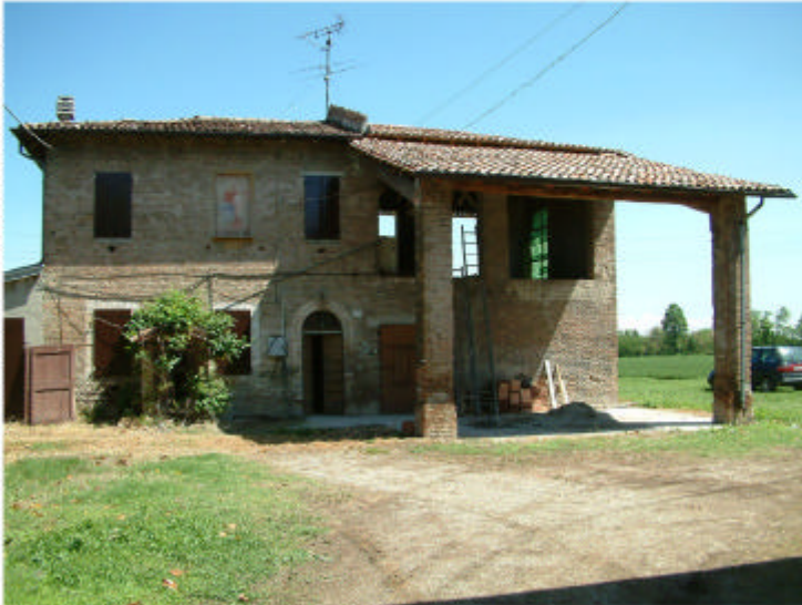
1. Edificio 1. Fronte sud.