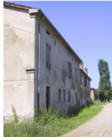
11. Edificio 4. Fronte nord.