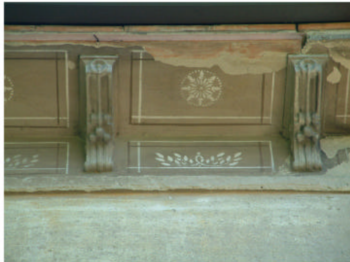
4. Edificio 1, parte 1a. Cornicione a mensole.