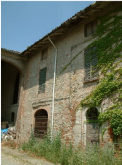
7. Edificio 1, parti 1c e 1b. Fronte sud