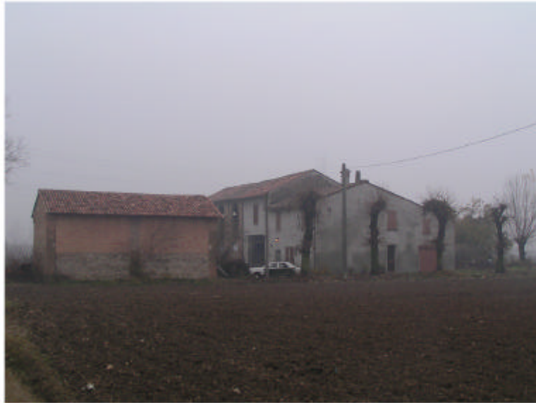
1. Vista generale da est