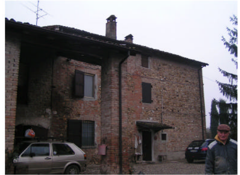
2. Edificio 1a. Fronte ovest