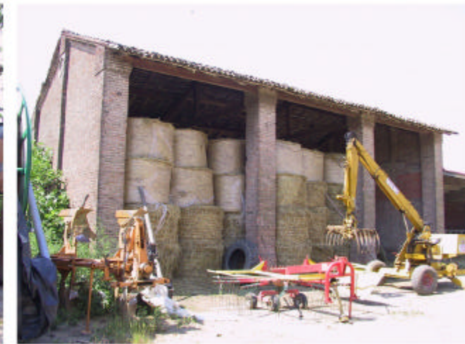
6. Edificio 3a. Fronte nord.