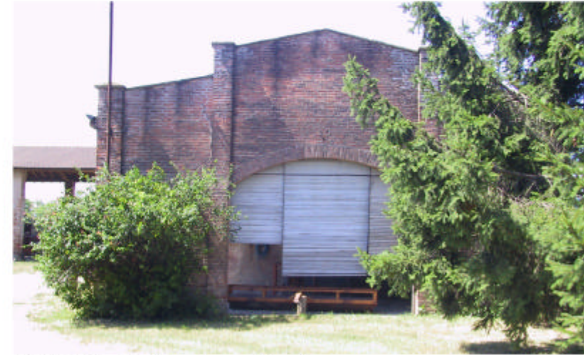
8. Edificio 2. Fronte nord-est.