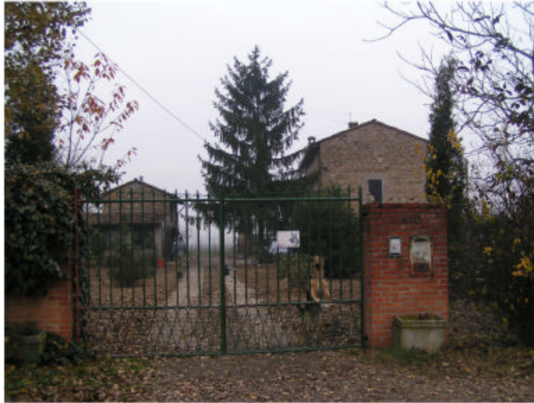
1. Ingresso da sud