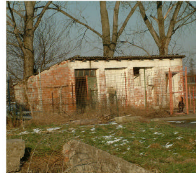
17. Edificio 8. Fronti ovest e sud