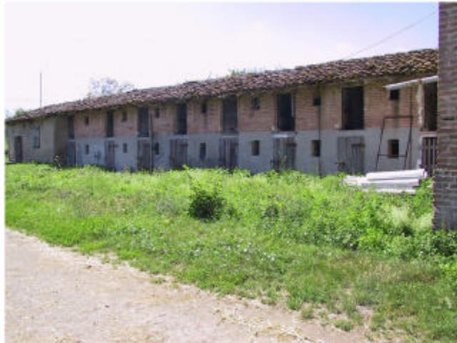
4. Edificio 3d e 3c. Fronte nord.