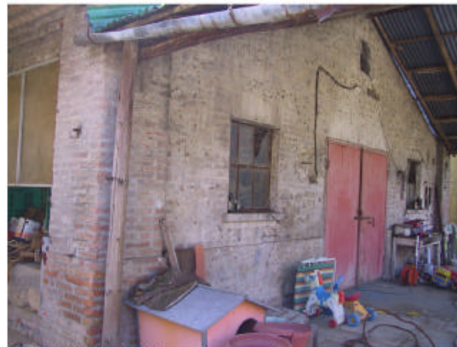
10. Edificio 3. Fronte ovest.