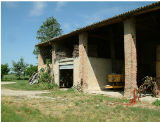
4. Edificio 3. Fronte sud.