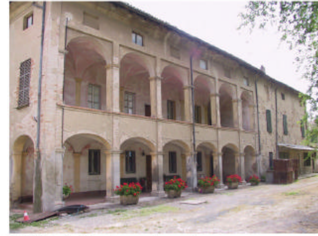
3. Edificio 1. Fronte sud-ovest.