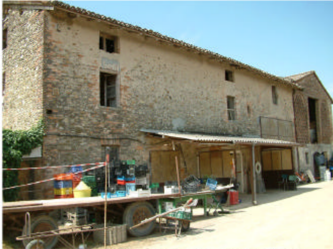
1. Edificio 1, parti 1a, 1b e 1c. Fronte nord