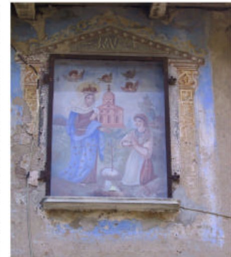
6. Edificio 2, parte 2a. Dipinto.