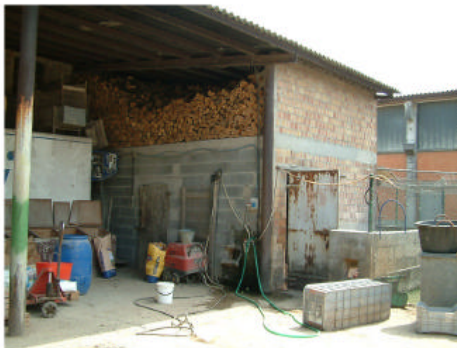
5. Edificio 1, parte 1e. Fronti ovest e sud