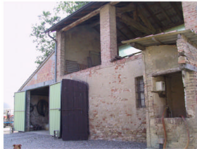
5. Edifici 2a e 2c. Fronte nord-ovest.