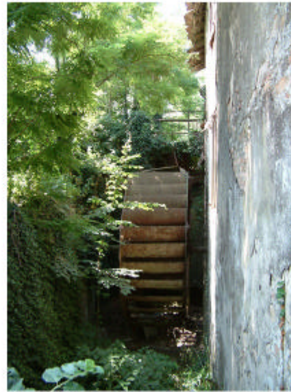
2. Edificio 1, parte 1a. Ruota.