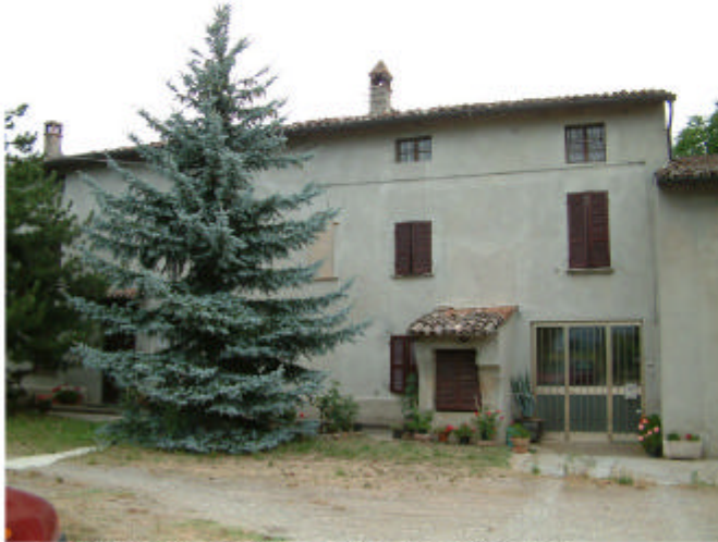
1. Edificio 1, parti 1a, 1b. Fronte sud