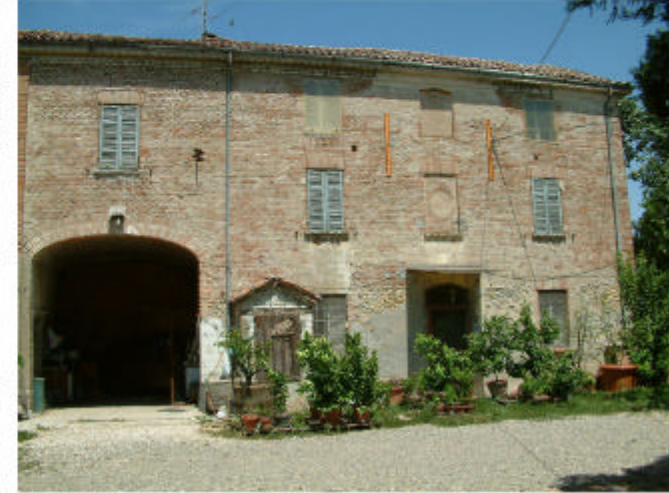
3. Edificio 1, parti 1b, 1c. Fronte sud.