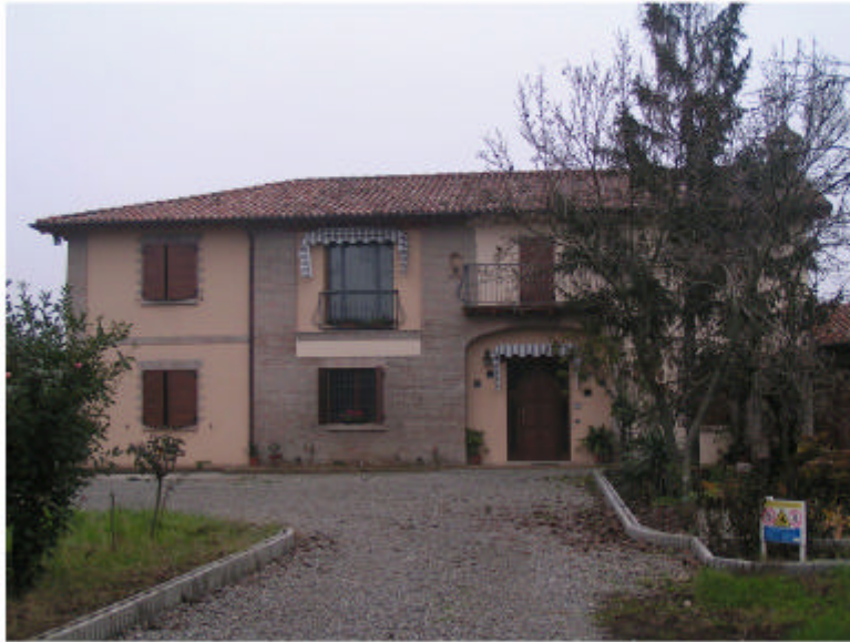
1. Edificio 1a. Fronte sud-est