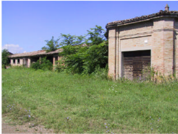
13. Edificio 1. Fronte est.