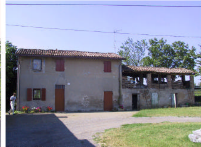
3. Edificio 2. Fronte nord.