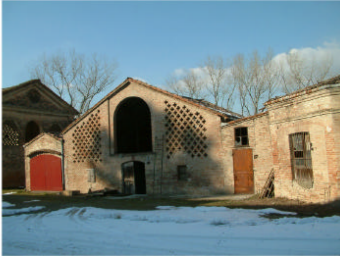
12. Edificio 3c, 3b, 3a. Fronte sud