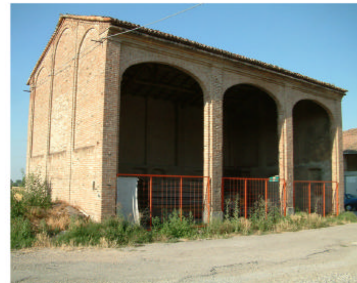
9. Edificio 3. Fronti ovest e sud.