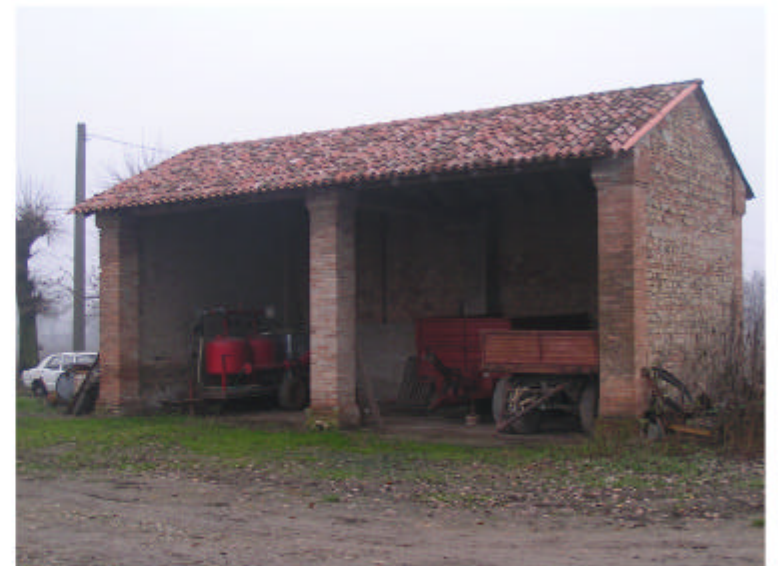
4. Edificio 2. Fronte ovest