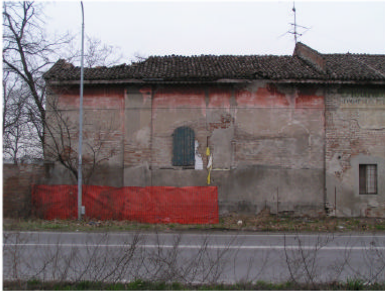
1. Edificio 1b. Fronte nord