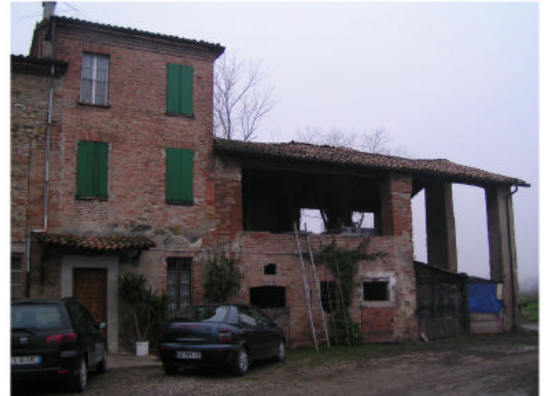
2. Edificio 1b-1c. Fronte nord