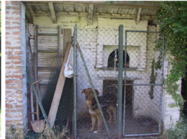
6. Edificio 2. Fronte nord-ovest.