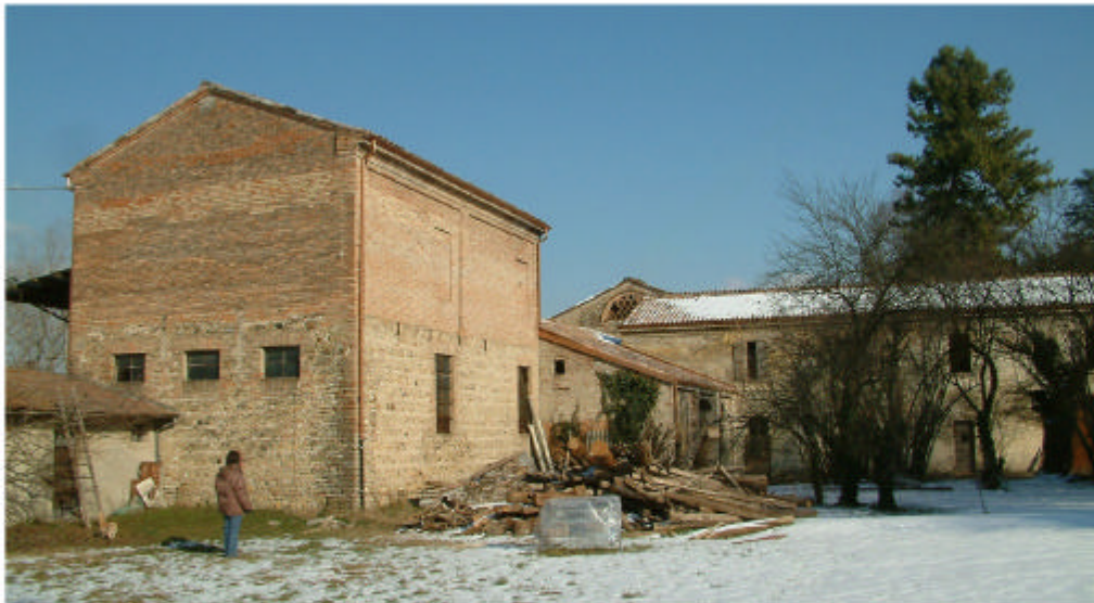
4. Edificio 1q, 1p, 1o, 1e. Fronti sud e ovest