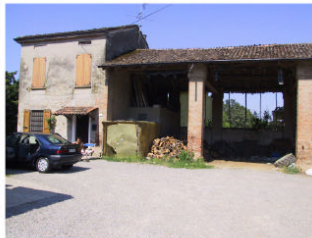
4. Edifici 2a e 2b. Fronte est.