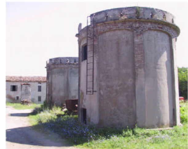
18. silos e pozzo nella corte.