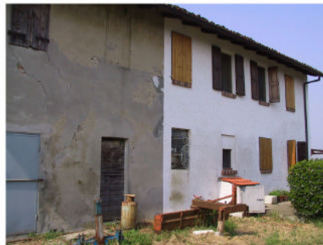
5. Edificio 1a. Fronte nord-est.