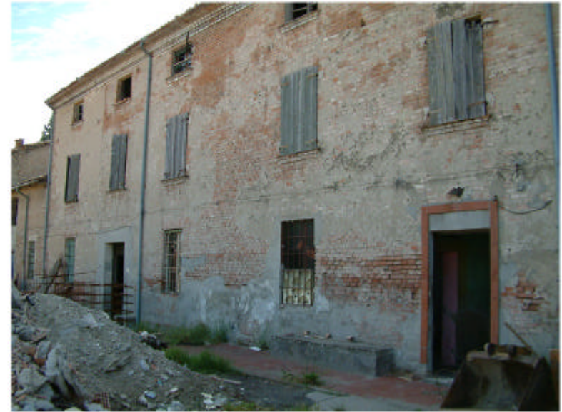
2. Edificio 1c