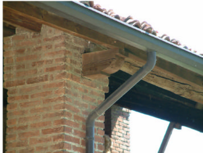
5. Edificio 1, parte 1c. Mensola reggigronda.