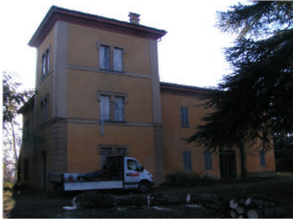
1. Edificio 1. Fronte nord-est