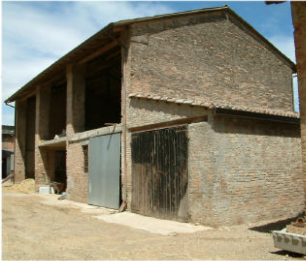
7. Edificio 2 Fronti sud ed est