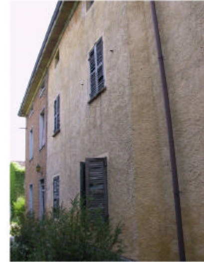
3. Edifici 2a e 2b. Fronte nord-ovest.