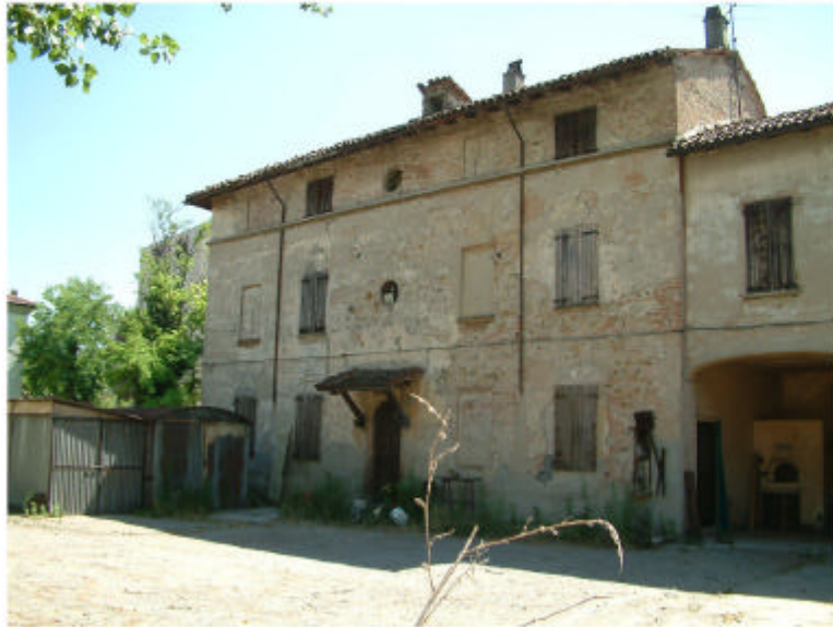
1. Fronte ovest