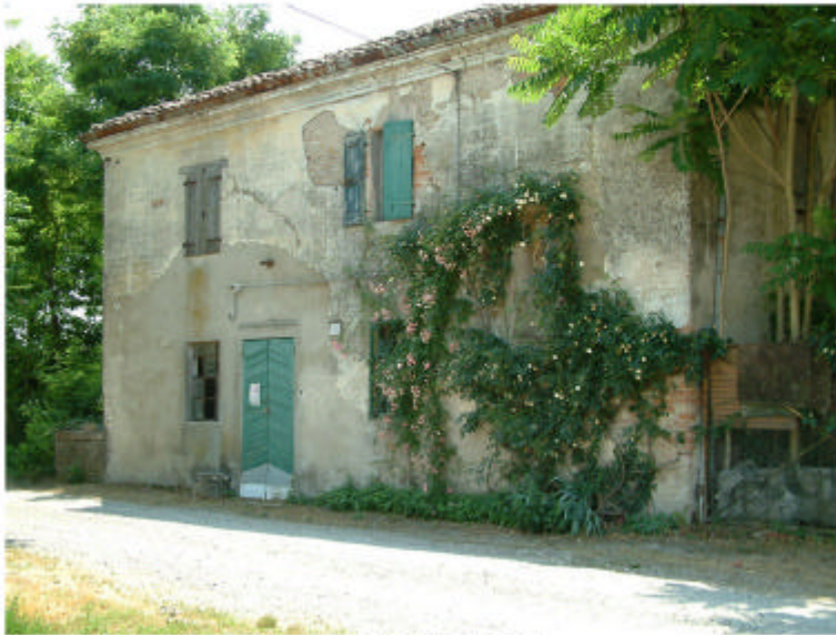
1. Edificio 1, parte 1a. Fronte nord