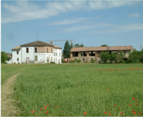
1. Vista del complesso da Sud-Ovest