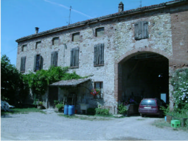
1. Edificio 1, parti 1a, 1b. Fronte sud