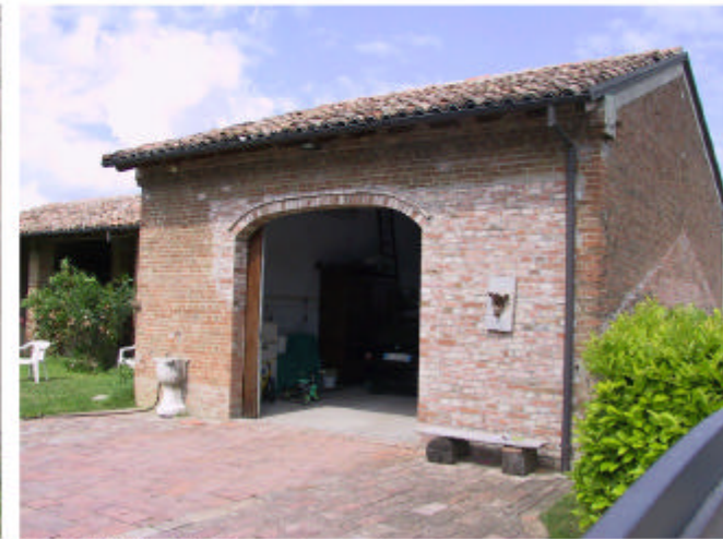
9. Edificio 6. Fronte nord-est.