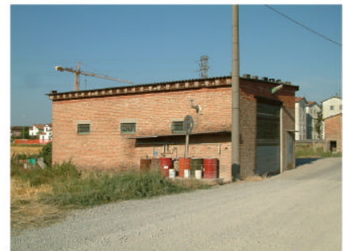
12. Edificio 5. Fronti ovest e sud.