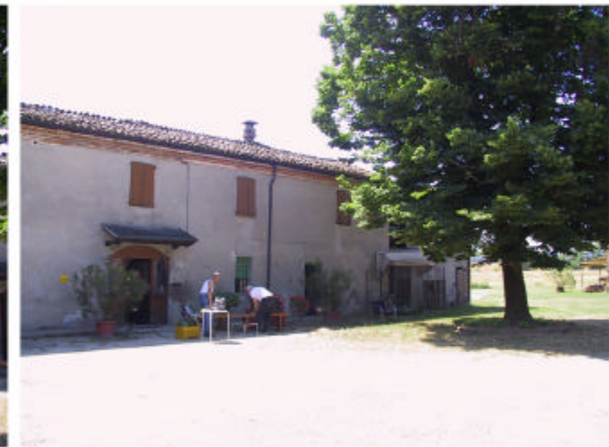
6. Edificio 1, parti 1b e 1c. Fronte nord-ovest.