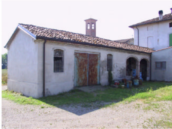
6. Edificio 1d. Fronti est e nord.