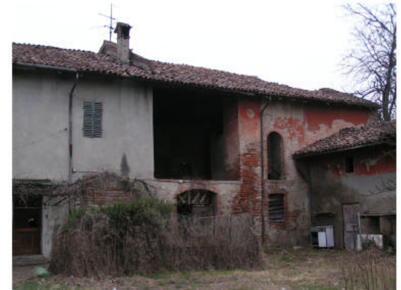
4. Edificio 1b. Fronte sud