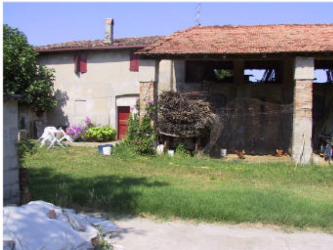
4. Edificio 1, parti 1a, 1b e 1c. Fronte ovest.