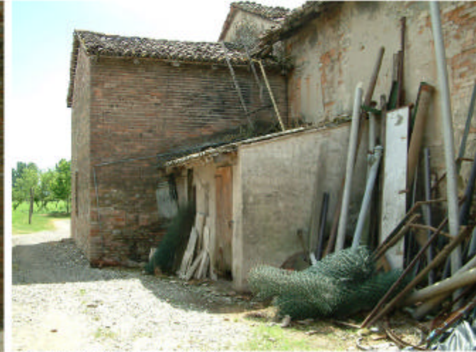
3. Edificio 1, parti 1f, 1g e 1e. Fronte nord.