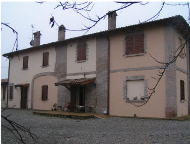
3. Edificio 1a. Fronte nord-est