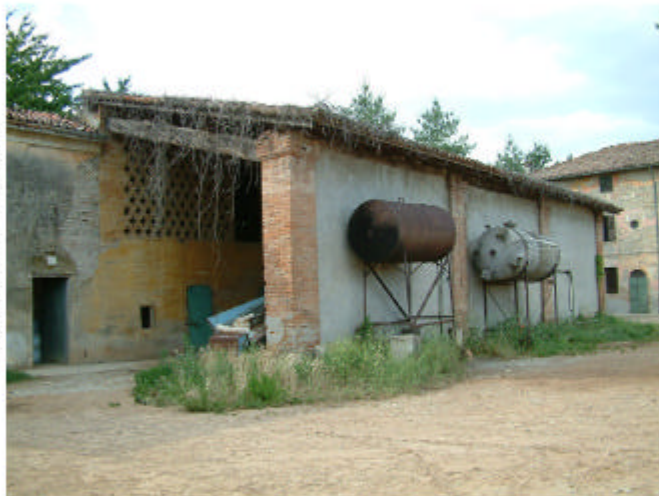
10. Edificio 3, parte 3b. Fronte sud-est.