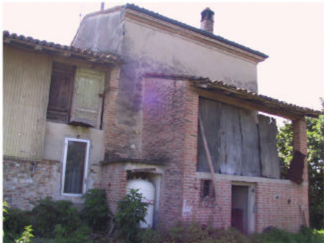
9. Edifici 2a, 2b, 2c. Fronte ovest.