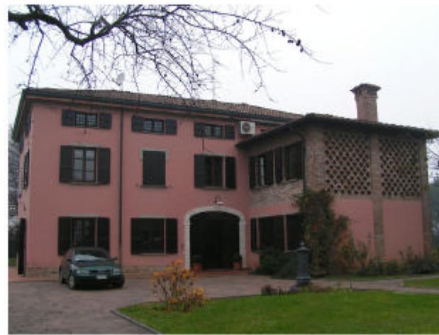
2. Edificio 1. Fronte est