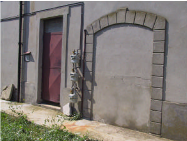
4. Edificio 1. Particolare vecchio ingresso stalla.