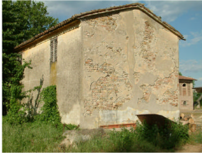
8. Edificio 3, parte 3a. Fronti nord-ovest e sud-ovest.