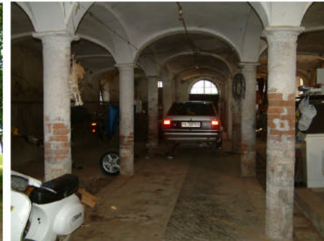
6. Edificio 1, parte 1c. Interno.