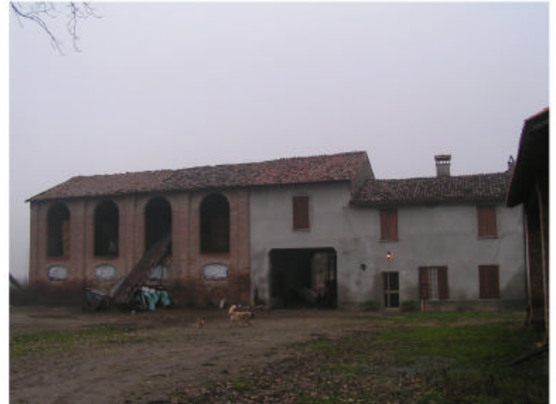
2. Edificio 1. Fronte sud