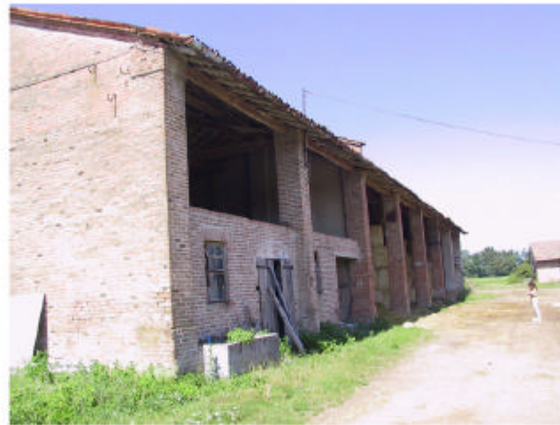
5. Edificio 3b e 3a. Fronte nord.