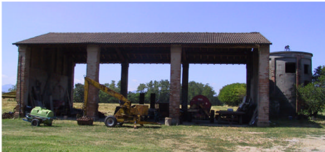
9. Edificio 3. Fronte nord-est.