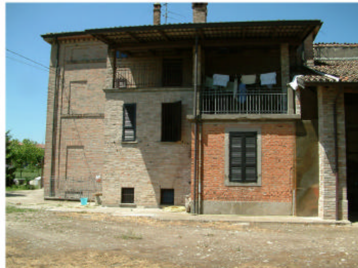
4. Edificio 1, parte 1a. Fronte est.