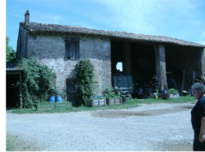
3. Edificio 2. Fronte ovest.