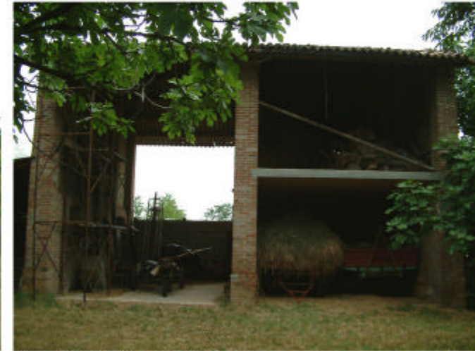
3. Edificio 2. Fronte sud.