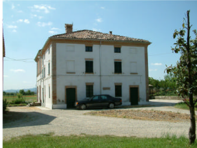
2. Edificio 1, parte 1b. Fronte nord.