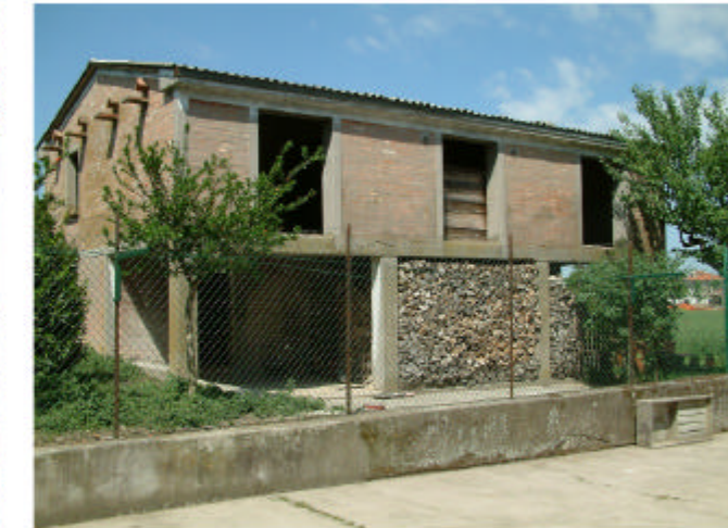
6. Edificio 4. Fronti sud ed est.