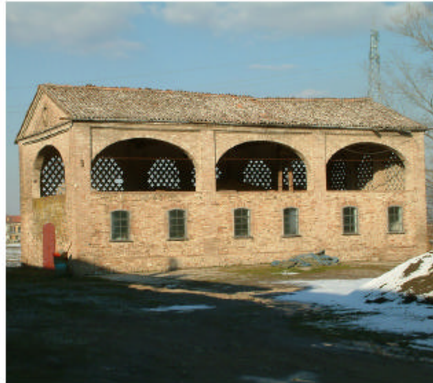
16. Edificio 5. Fronti ovest e sud