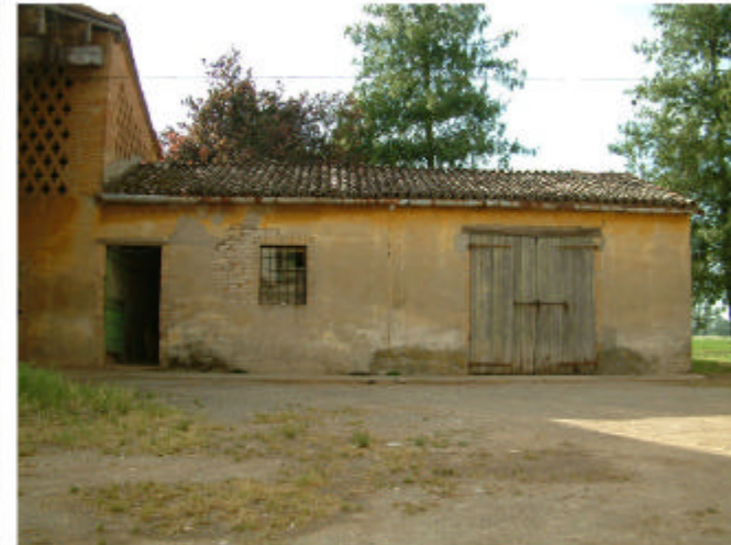
12. Edificio 3, parte 3c. Fronte sud-est