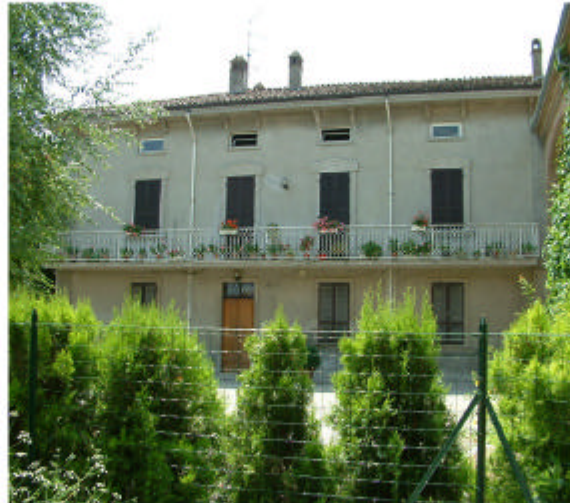
5. Edificio 1, parte 1a. Fronte nord