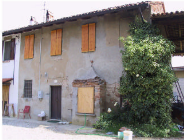
2. Edifici 1a e 1b. Fronte sud-ovest.