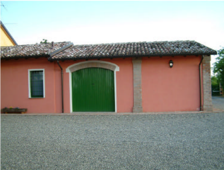
4. Edificio 1, parte 1c. Fronte nord.