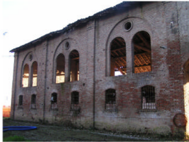
7. Edificio 2. Fronte nord-est