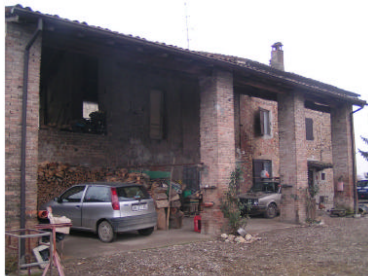
3. Edificio 1b. Fronte ovest