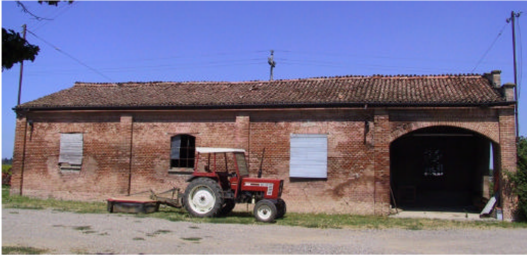
7. Edificio 2, Fronte sud-est.