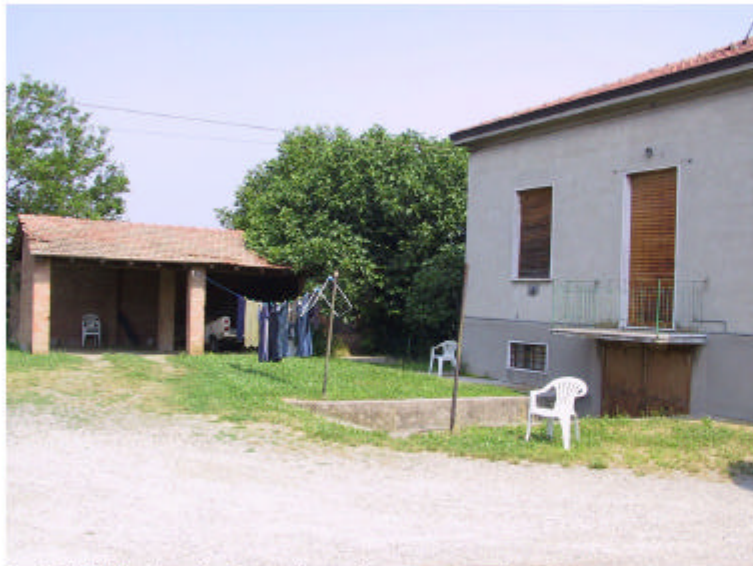
3. Edifici 4 e 1. Fronti sud-est e sud-ovest.