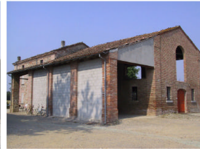
3. Edificio 1. Fronti sud-est e nord-est.