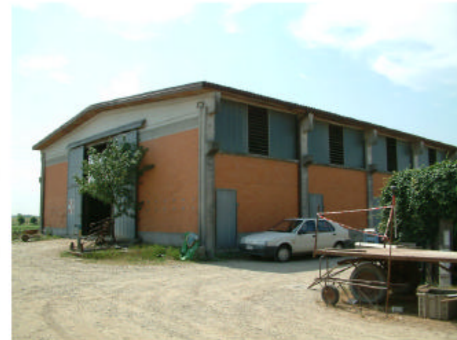
6. Edificio 2. Fronti nord e ovest.