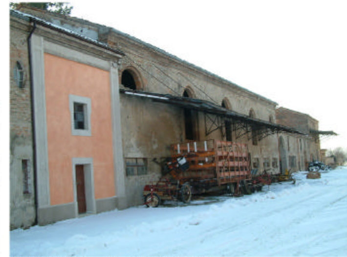
8. Edificio 1i, 1l. Fronte nord