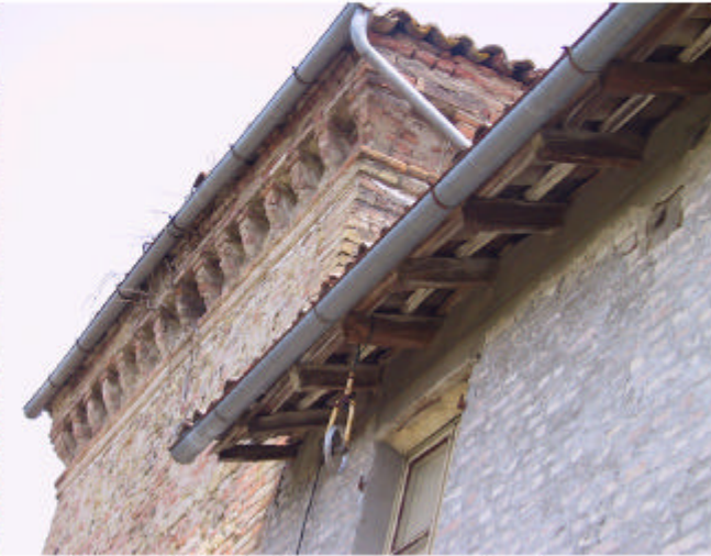
3. Edificio 1. Cornicione della torre.