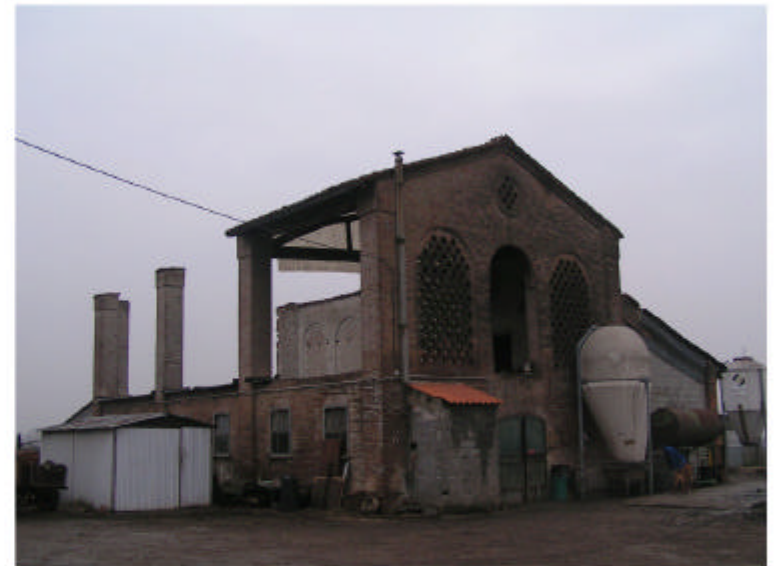
4. Edificio 2. Fronte sud-est