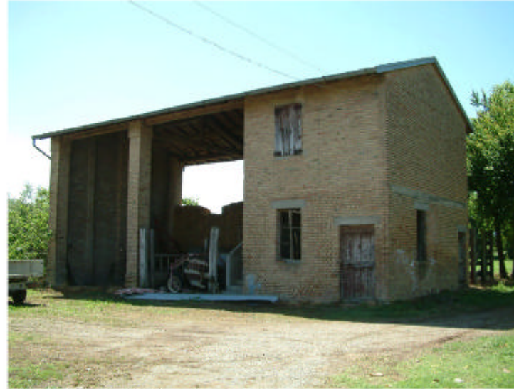
2. Edificio 2. Fronte nord.