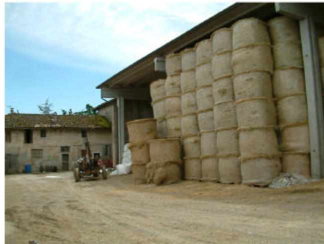
5. Edificio 1, parti 1c e 1d. Fronti ovest e nord