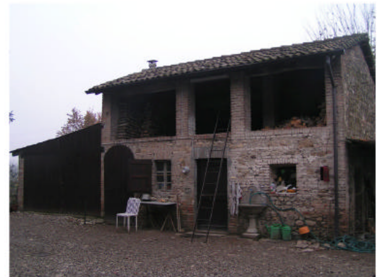
4. Edificio 2. Fronte est