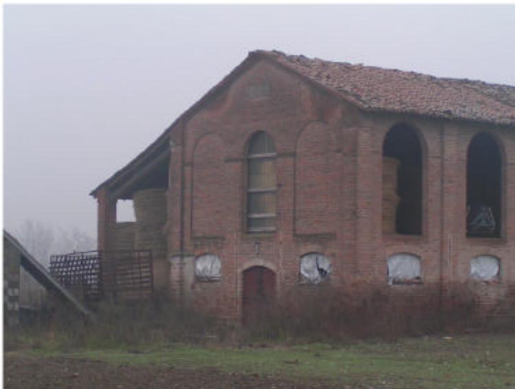
3. Edificio 1. Fronte ovest