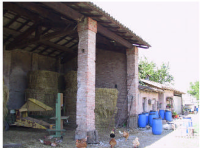
4. Edificio 2. Fronte nord-est.