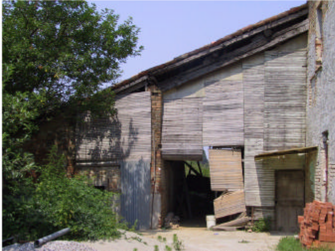
1. Edificio 1, parti 1d e 1e. Fronte sud-est.