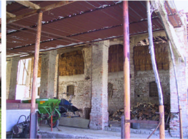
8. Edificio 1c. Fronte nord.