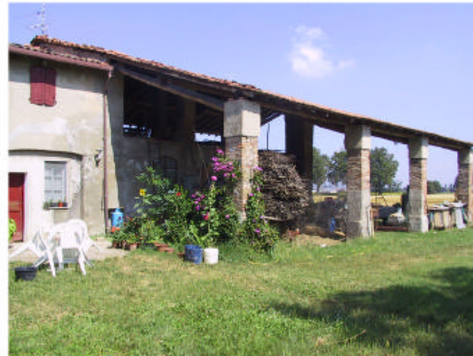
5. Edificio 1, parti 1b, 1c e 1d. Fronte ovest.