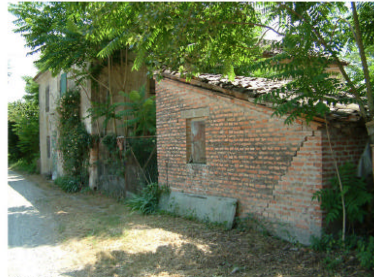
3. Complesso visto da Nord-Ovest