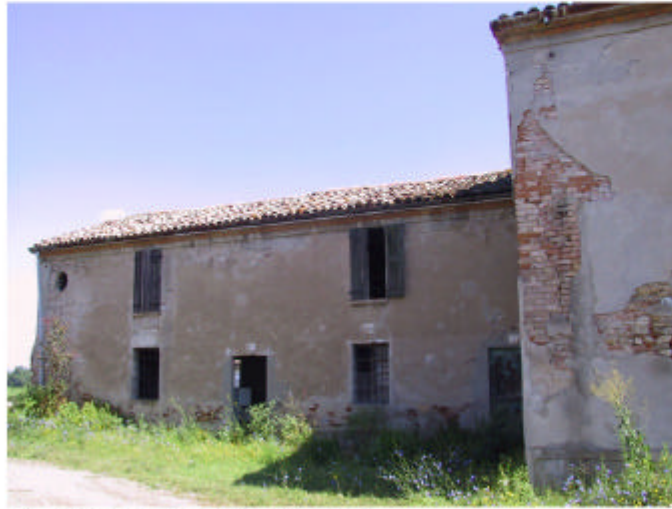
7. Edificio 4a. Fronte sud.