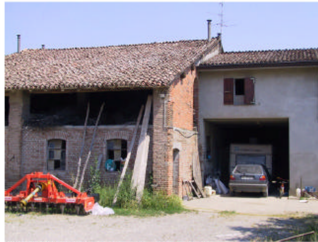
2. Edifici 1d e 1c. Fronte sud.