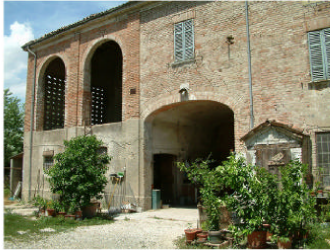
2. Edificio 1, parti 1a e 1b. Fronte sud.