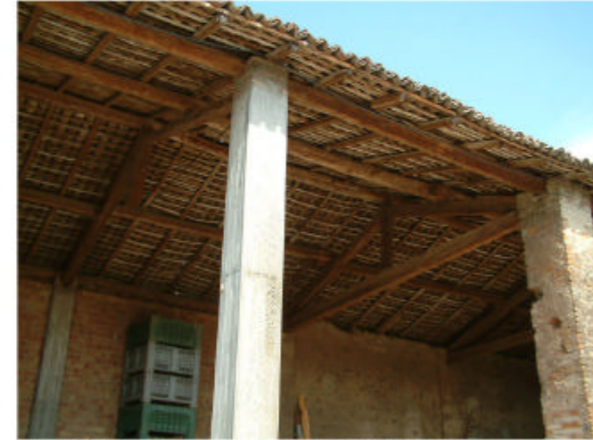
3. Edificio 1, parte 1d. Copertura.