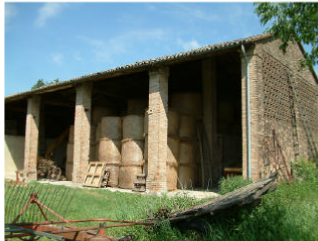
5. Edificio 3. Fronte sud.