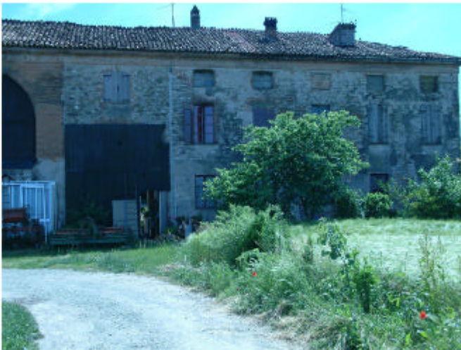
5. Edificio1, parti 1b e 1a. Fronte nord