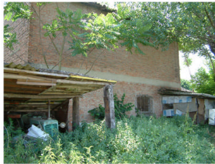
5. Edificio 2, parte 2b. Fronte ovest.