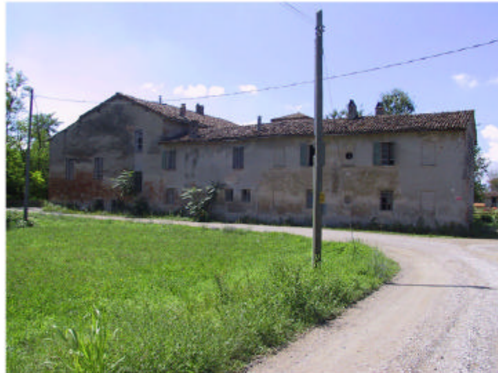
10. Edificio 7. Fronte nord.