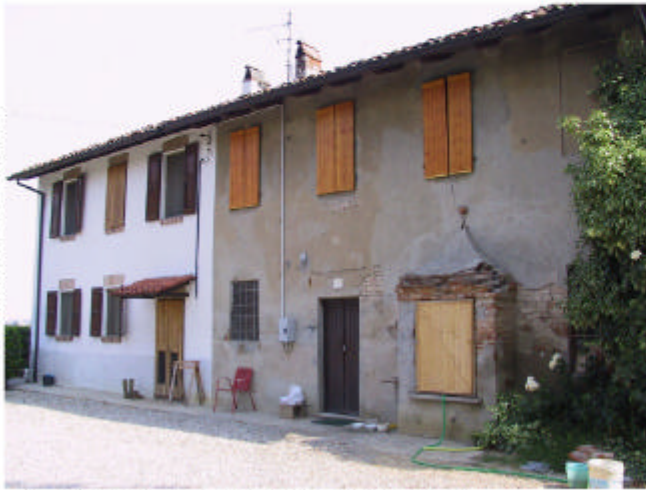
1. Edificio 1a. Fronte sud-ovest.