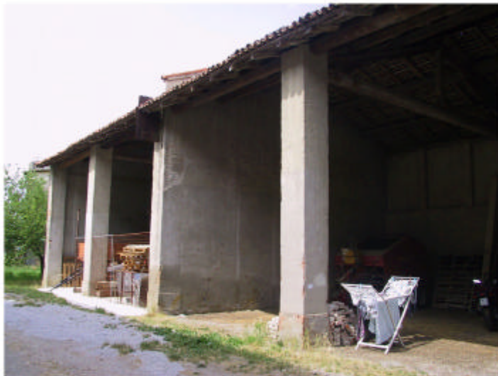
10. Edificio 5. Frontenord-est.