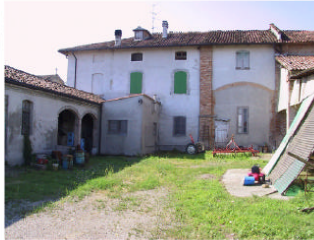
8. Edifici 1c. Fronti nord.