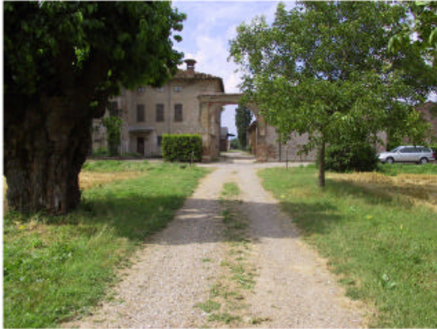
1. Ingresso al complesso da Nord-Est.