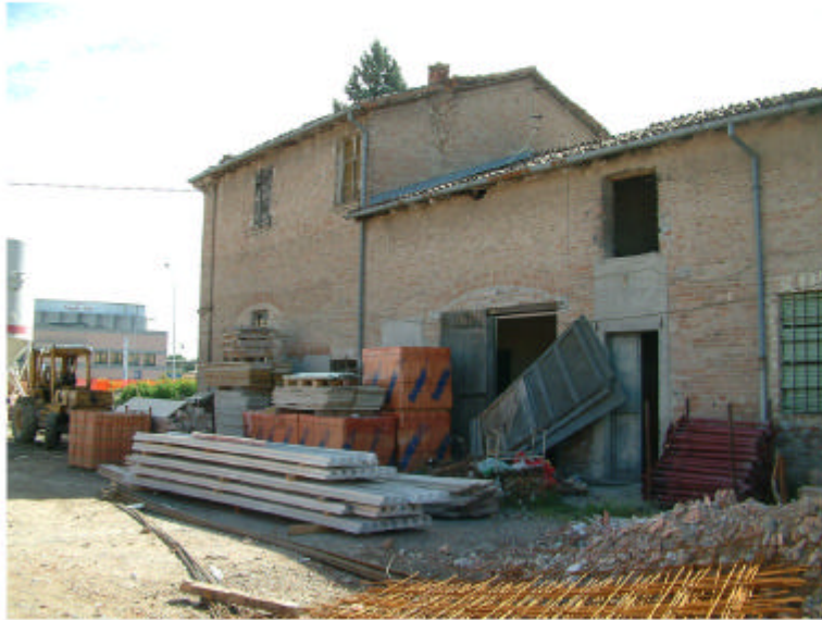
1. Edificio 1a-1b