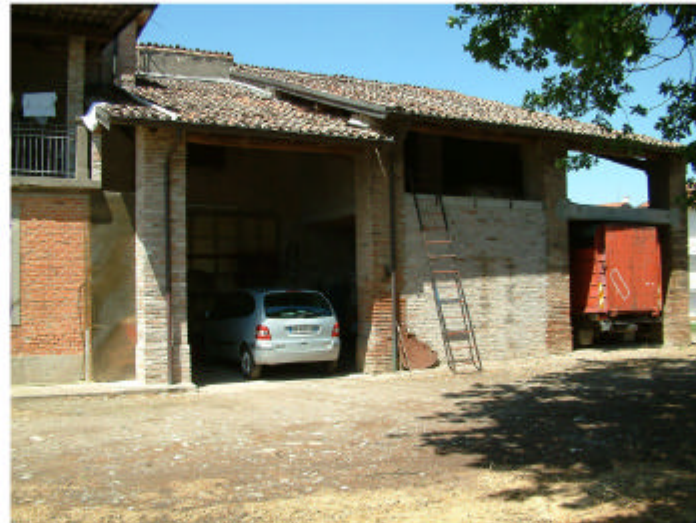
5. Edificio 1, parte 1b. Fronte est.