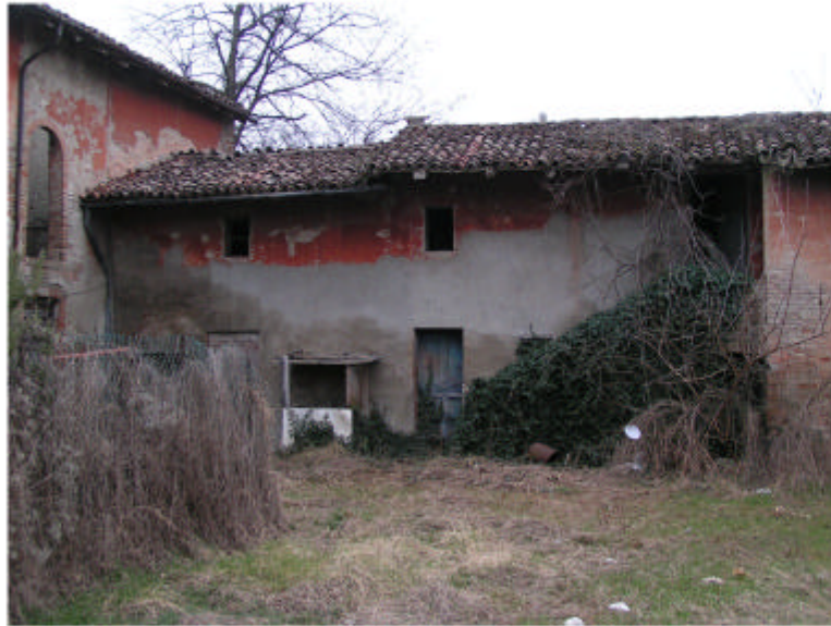
5. Edificio 1c. Fronte ovest