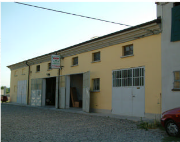
10. Edificio 4, parte 4b. Fronte est.