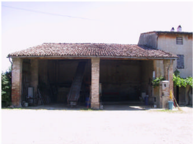
4. Edificio 1, parte 1d. Fronte sud-ovest.