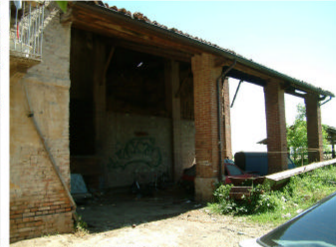
3. Edificio 1, parti 1b e 1c. Fronte sud.