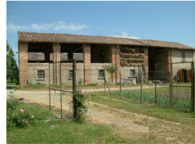
3. Edificio 2. Fronte sud.