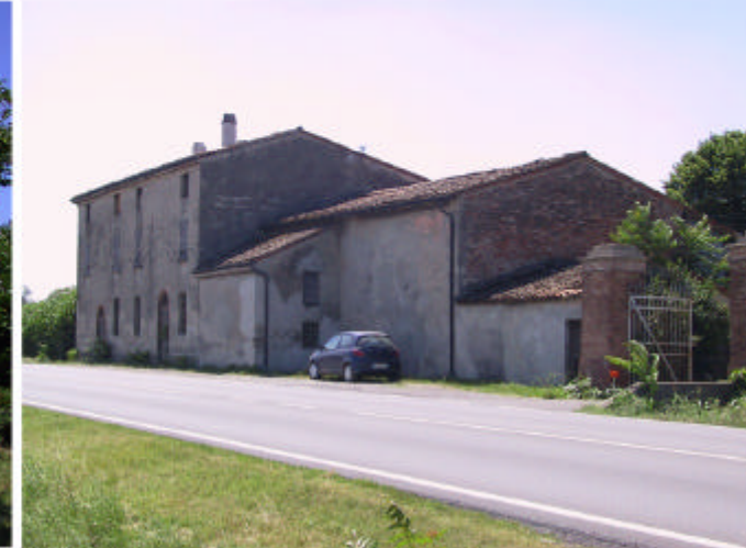
3. Edificio 1. Fronte nord-est.