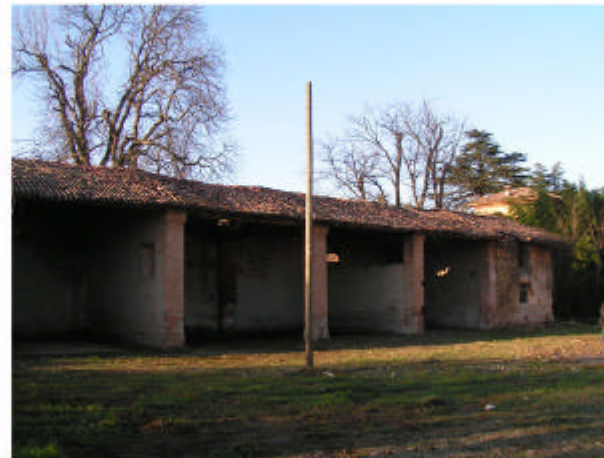
11. Edificio 3. Fronte est