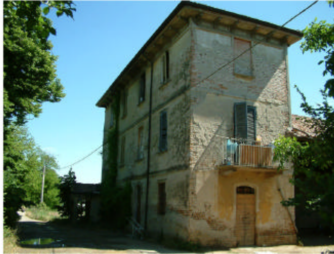
2. Edificio 1, parte 1a. Fronti ovest e sud.