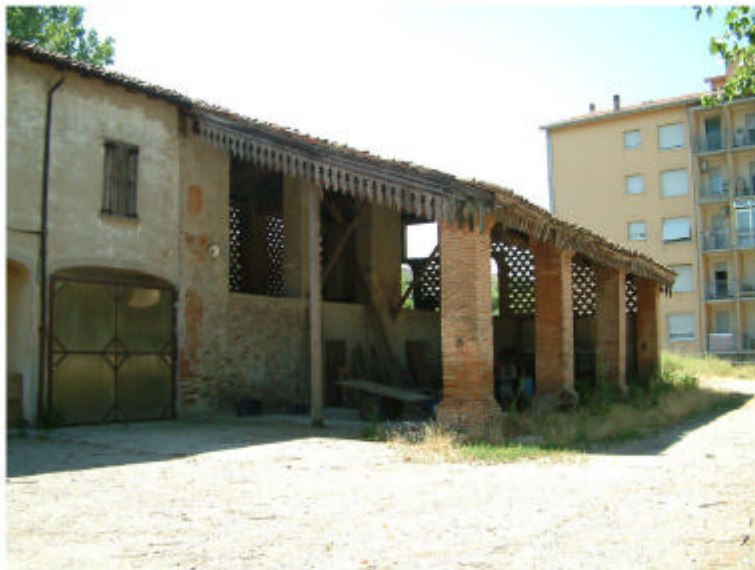
3. Fronte ovest