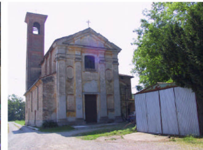
11. Chiesa. Fronte ovest.