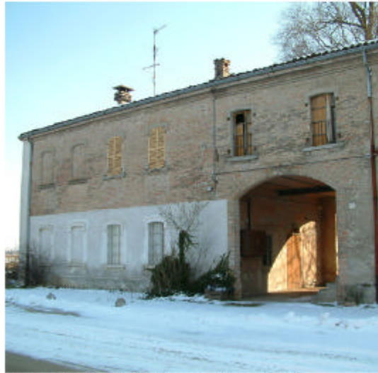
6. Edificio 1f, 1g. Fronte nord