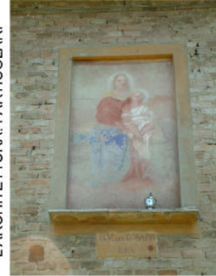
3. Edificio 1, parte 1a. Dipinto.