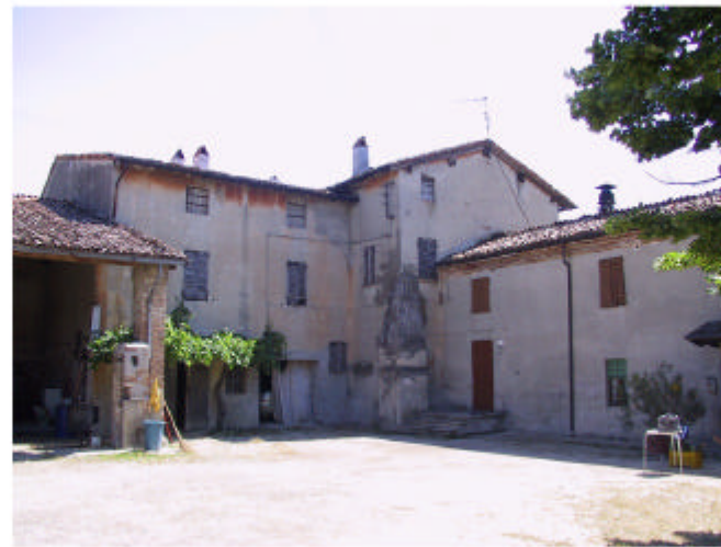
5. Edificio 1, parti 1d, 1a, 1b. Fronti sud-ovest e nord ovest.