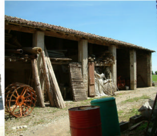
9. Edificio 3. Fronte sud.