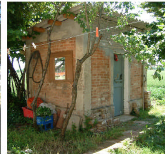
6. Edificio 3. Fronti ovest e nord