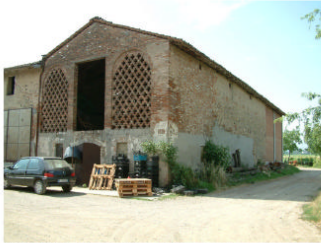
2. Edificio 1, parti 1c e 1d. Fronti nord e ovest.