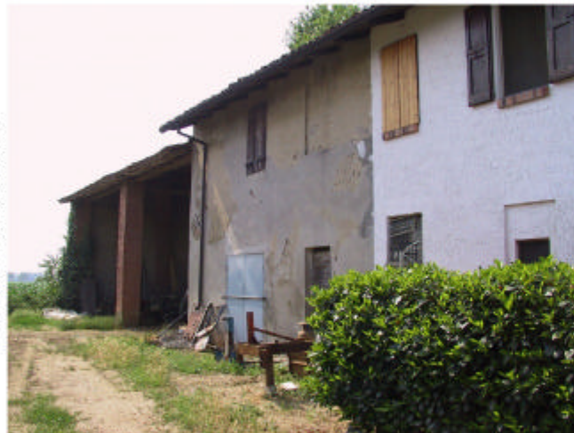
4. Edifici 1a e 1b. Fronte nord-est.