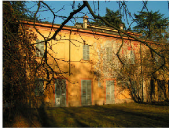
2. Edificio 1 Fronte ovest