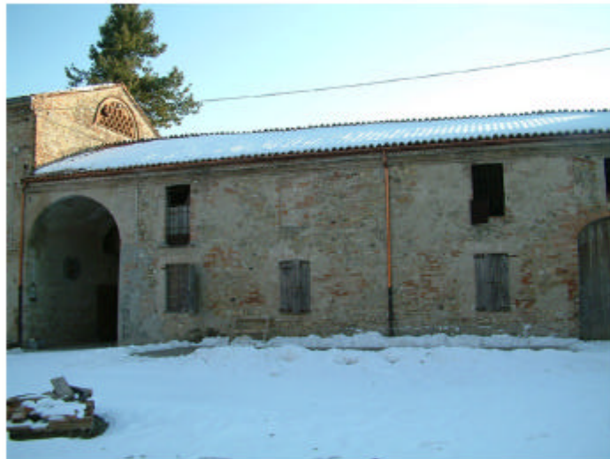
9. Edificio 1m, 1n, 1o. Fronte nord