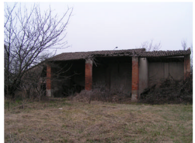
8. Edificio 2