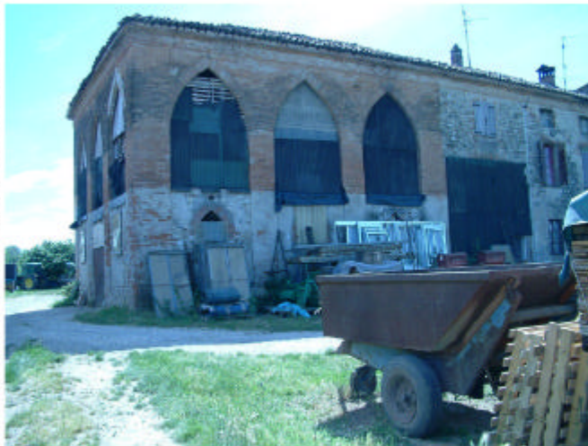
4. Edificio 1, parte 1c. Fronti est e nord.