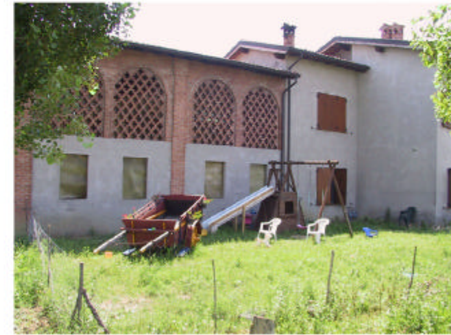
3. Edificio 1. Fronte nord-ovest.