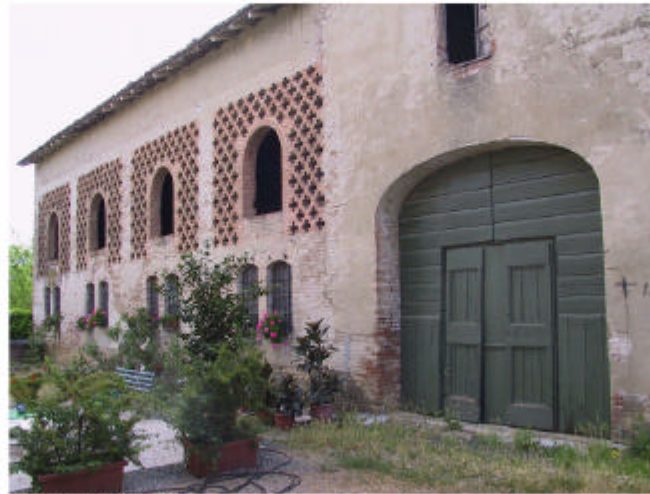
8. Edificio 2, parte 2c. Fronte nord-ovest.