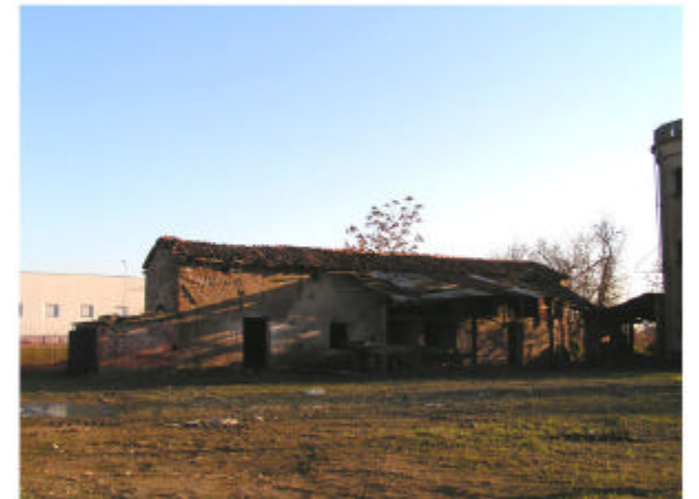
12. Edificio 4. Fronte est