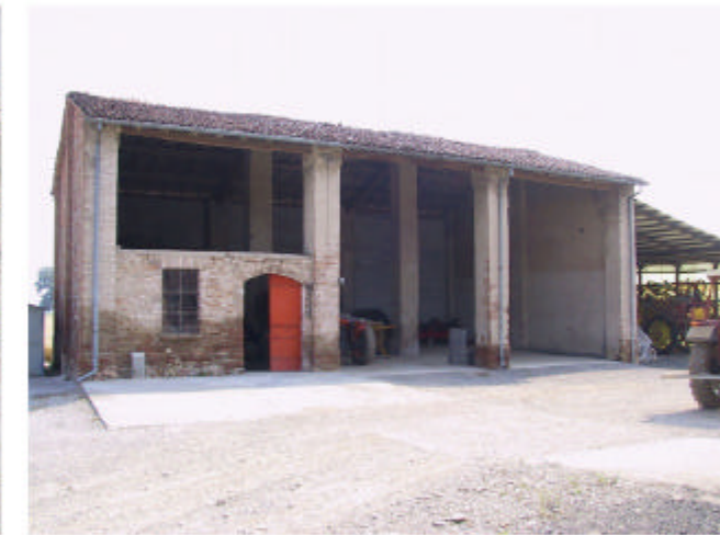
6. Edificio 3. Fronte sud-ovest.