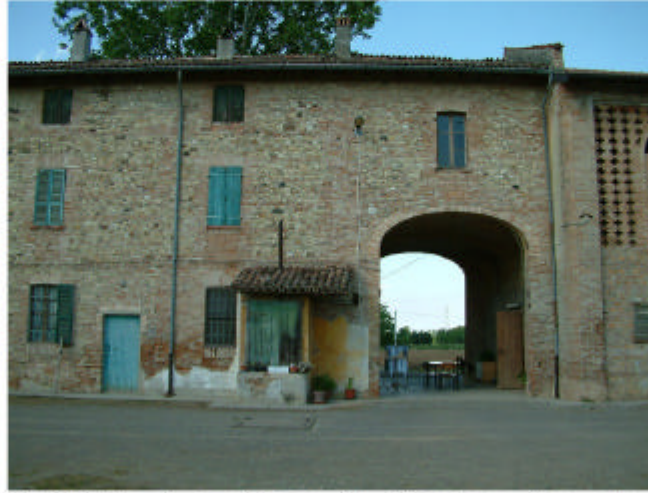
2. Edificio 1, parti 1a e 1b. Fronte sud-ovest.