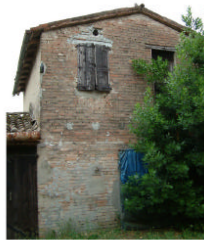
8. Edificio 3, parte 1b. Fronte ovest