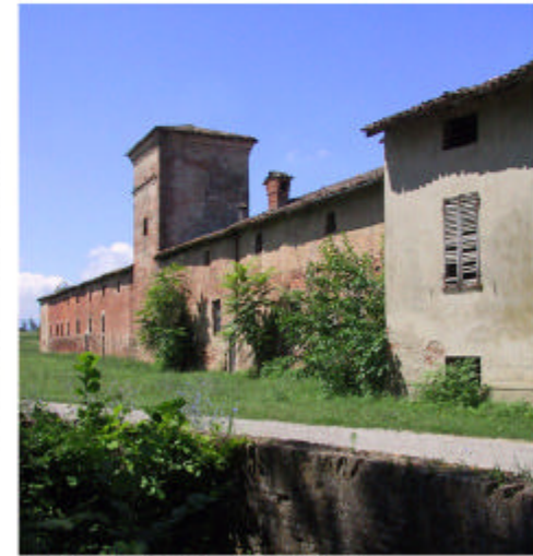
9. Edificio 7. Fronte est.