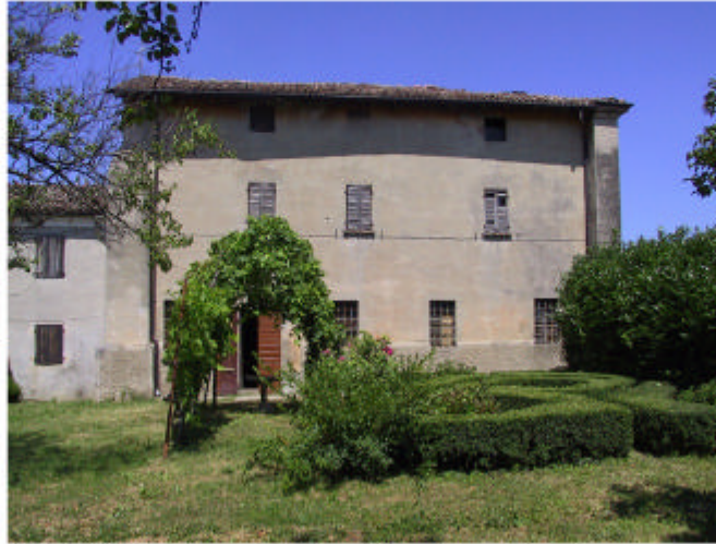
2. Edificio 1, parte 1a. Fronti sud-est.