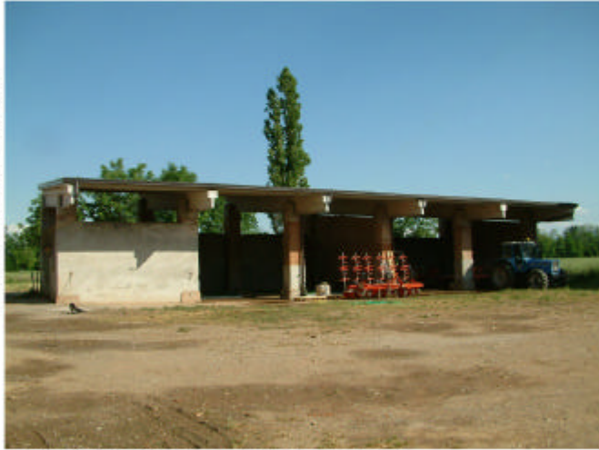
7. Edificio 2. Fronte nord-ovest.