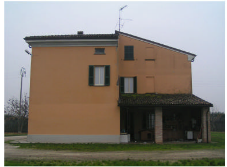
2. Edificio 1. Fronte nord