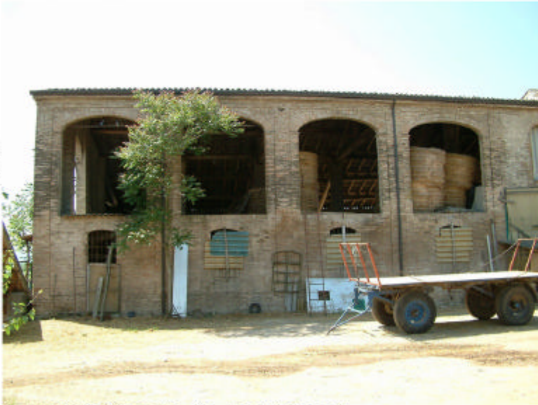
1. Edificio 1, parte 1c. Fronte nord.