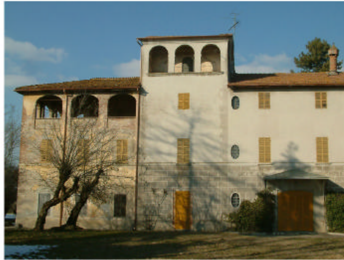
2. Edificio 1c, 1b, 1a. Fronte sud