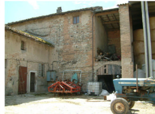
6. Edificio 1, parti 1a, 1b, 1d. Fronte ovest