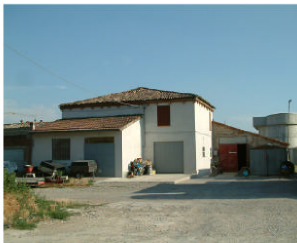
11. Edificio 4, parti 4a e 4c. Fronte nord