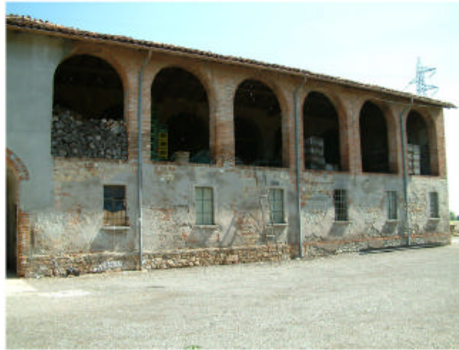
2. Edificio 1, parte 1c. Fronte sud.