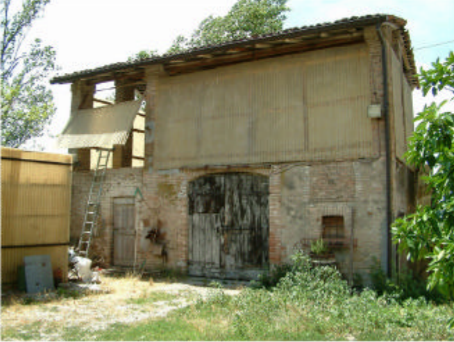
1. Edificio 2. Fronte est