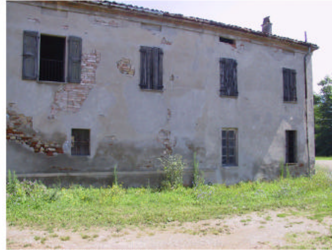
8. Edificio 4b. Fronte sud.