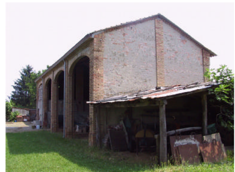
4. Edificio 2. Fronti ovest e sud.