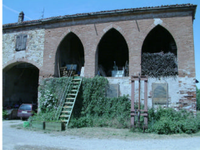
2. Edificio 1, parti 1b e 1c. Fronte sud.