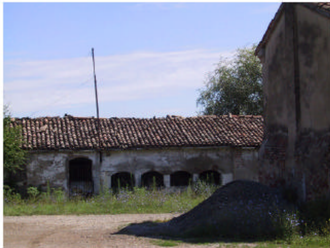
16. Edificio 5. Fronte sud.