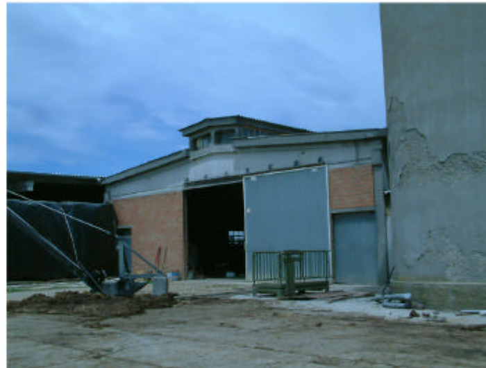
11. Edificio4. Fronte sud