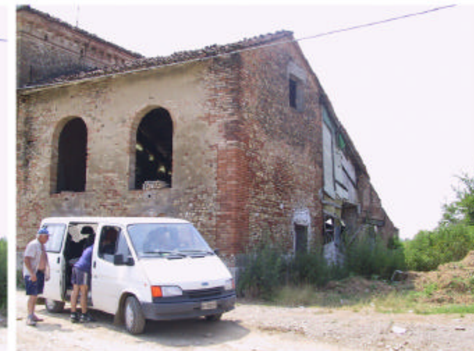
6. Edificio 1, parti 1c, 1d, 1e. Fronti nord-est e nord-ovest.