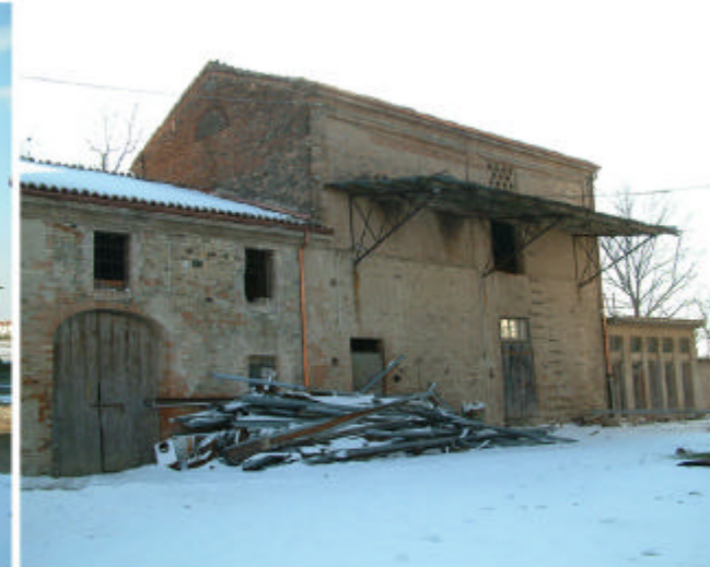
11. Edificio 1o, 1p, 1q. Fronte nord