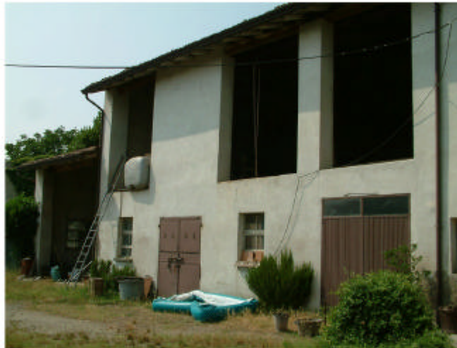
5. Edificio 1, parti 1e e 1d. Fronte sud