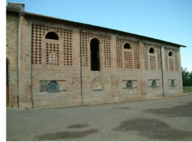
3. Edificio 1, parte 1c. Fronte sud-ovest.