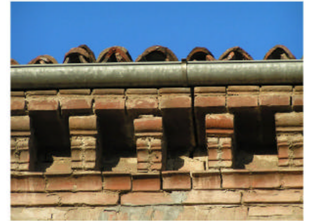
9. Edificio 2. Cornicione sottogronda abitazione