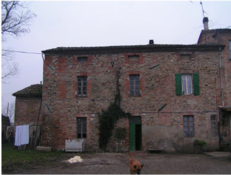
1. Edificio 1a. Fronte nord