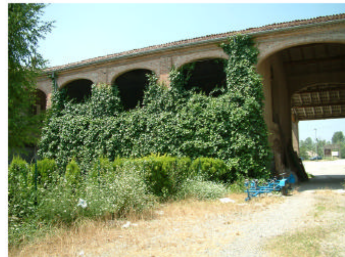
6. Edificio 1, parti 1g e 1e. Fronte est.