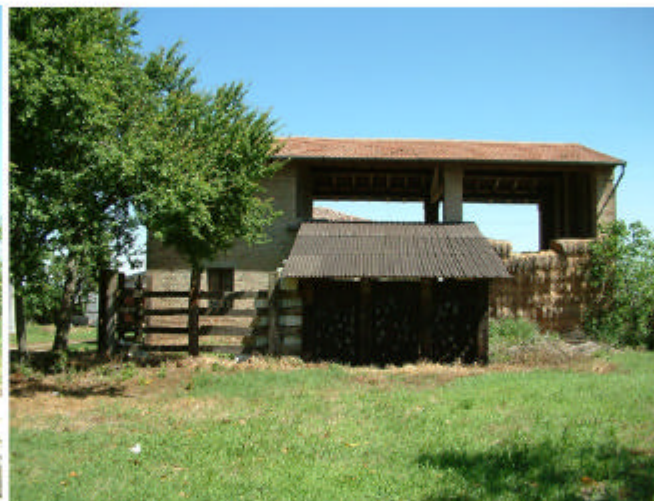
5. Edificio 2. Fronte sud.