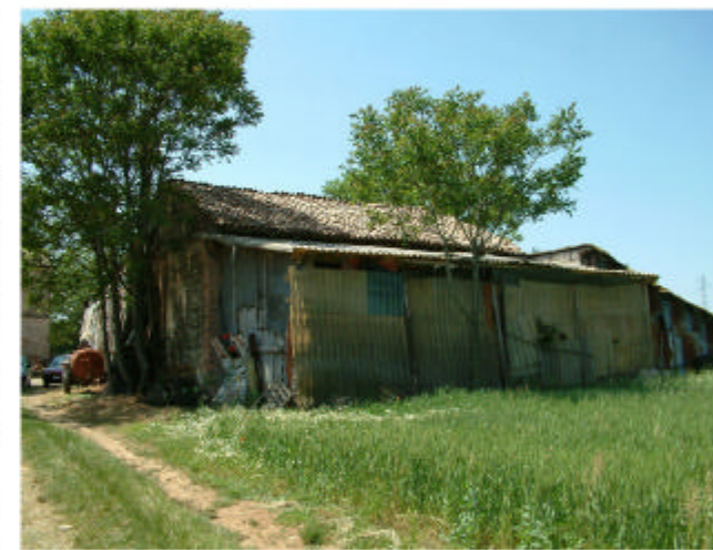
6. Edificio 3. Fronti est e nord.