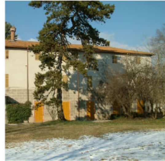
3. Edificio 1a. Fronte sud