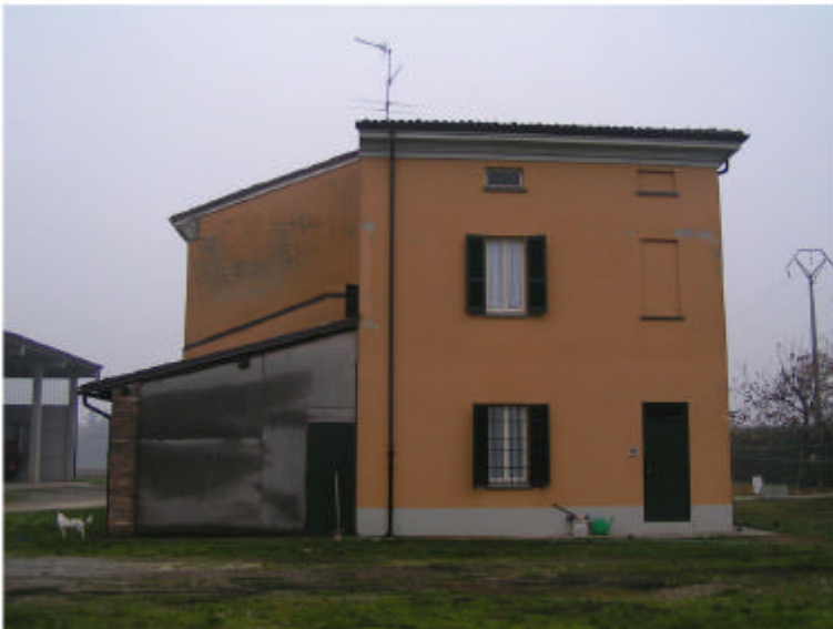
3. Edificio 1. Fronte ovest