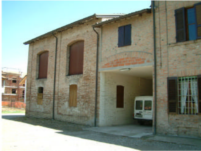
1. Edificio 1, parti 1c e 1b. Fronte ovest.