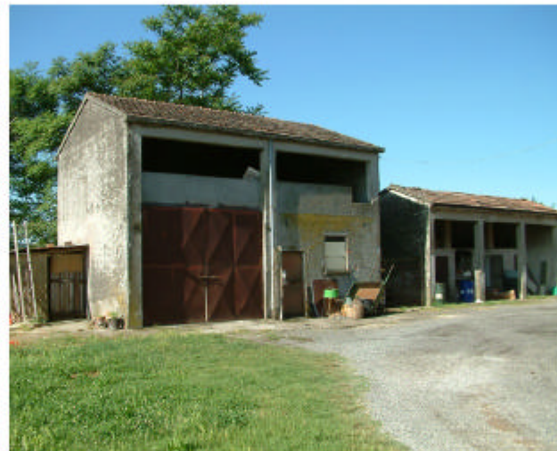
5. Edifici 3 e 4. Fronti est e nord.