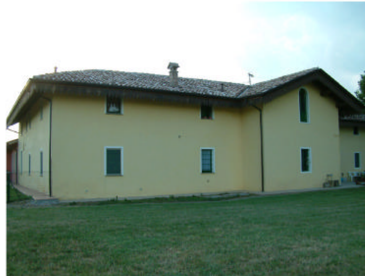
5. Edificio 1, parte 1b. Fronte est.