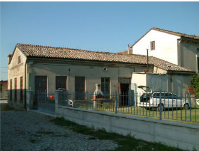
4. Edificio 1, parti 1i e 1a. Fronte sud.