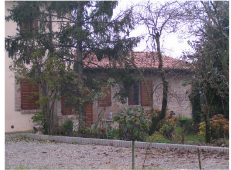
2. Edificio 1b. Fronte sud-est