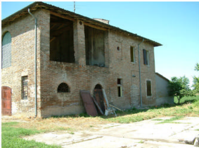
4. Edificio 1. Fronte nord.