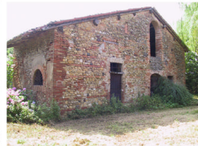
6. Edificio 3. Fronti nord-est e sud-ovest.