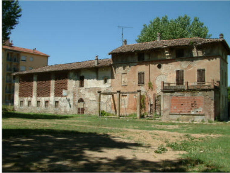
5. Fronte est