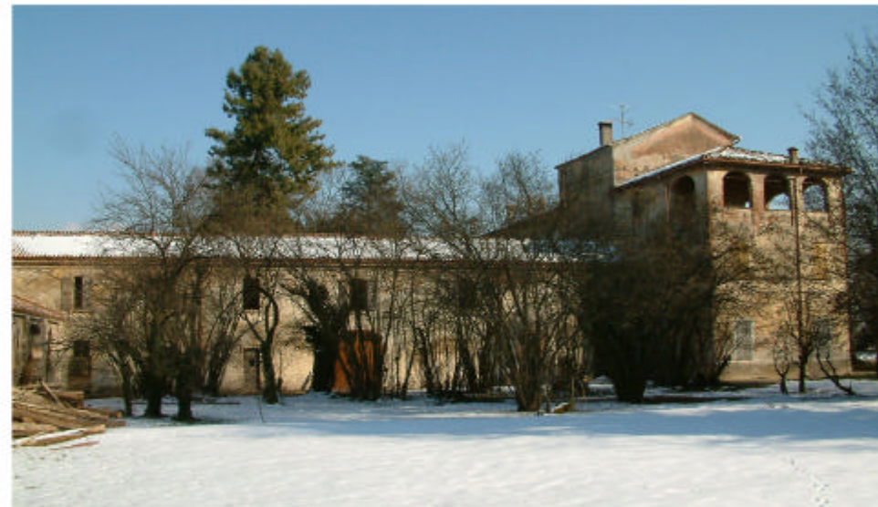
5. Edificio 1e, 1c. Fronte ovest