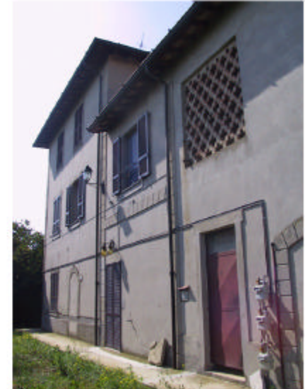
2. Edificio 1. Fronte nord-est.