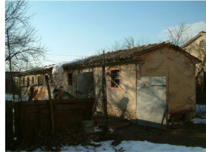
14. Edificio 7. Fronti sud ed est