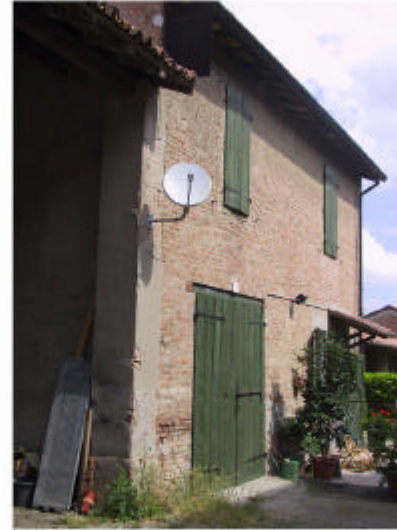
11. Edificio 5, parte 5b. Fronte nord-est.