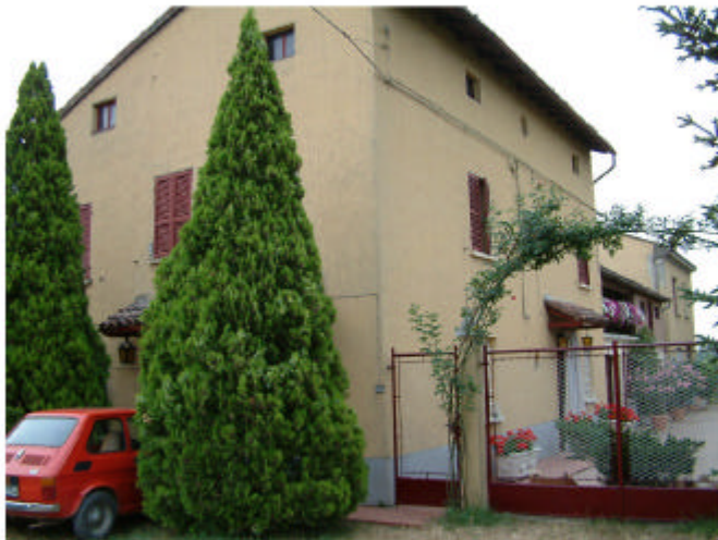
10. Edificio 4. Fronti ovest e sud.