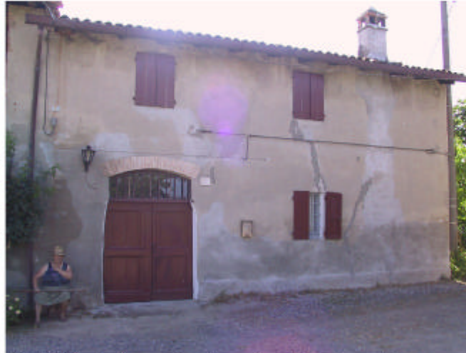
2. Edificio 1, parte 1b e 1a. Fronte est.