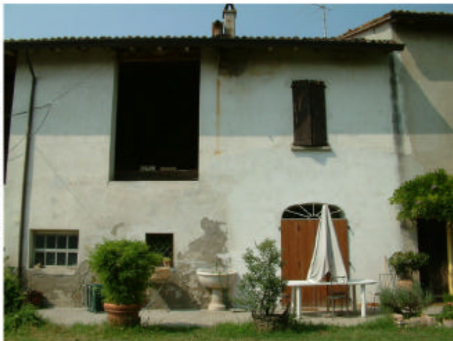
4. Edificio 1, parti 1c e 1b. Fronte sud.