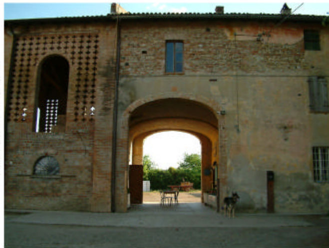
4. Edificio 1, parte 1b. Fronte nord-est.