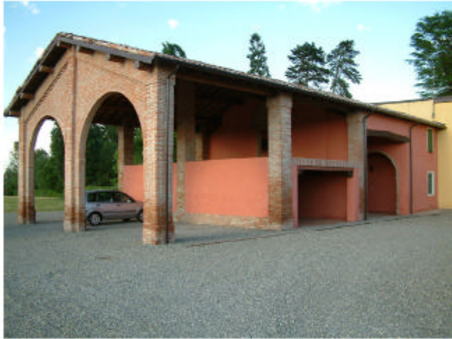
1. Edificio 1, parte 1a. Fronti ovest e sud.