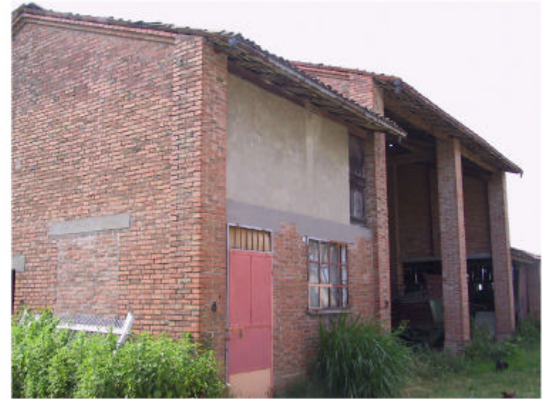
2. Edificio 3. Fronti nord-est e nord-ovest.