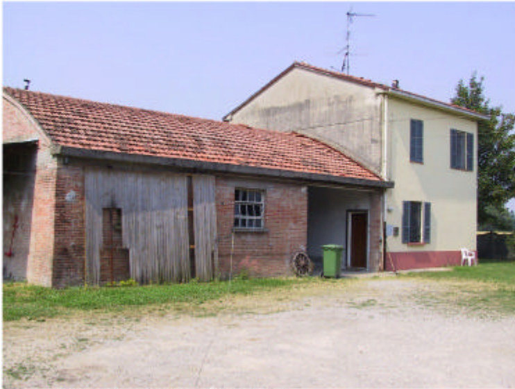
1. Edificio 2. Fronte nord-est.