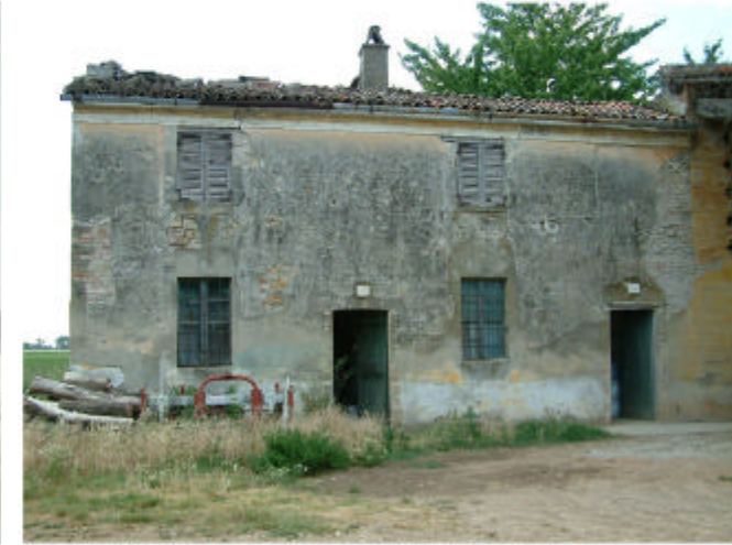
9. Edificio 3, parte 3a. Fronte sud-est.