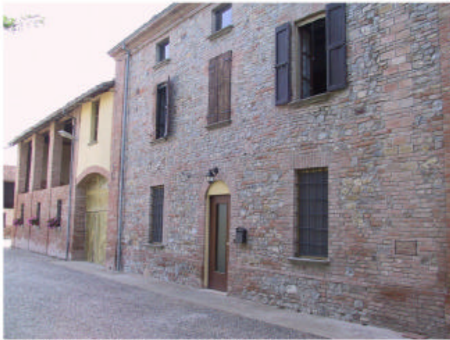
1. Edificio 1. Fronte nord-ovest.