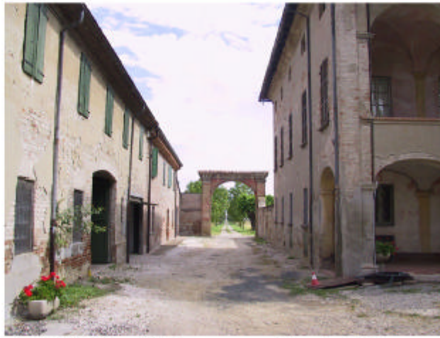
2. Edifici 1 e 2. Ingresso visto dall'interno.