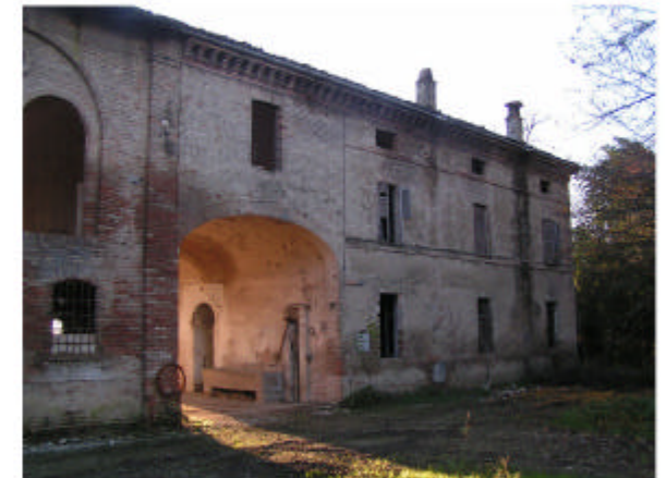
6. Edificio 2. Fronte nord-est