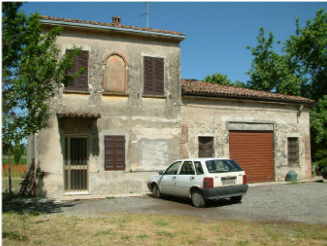
4. Edificio 2. Fronte est.