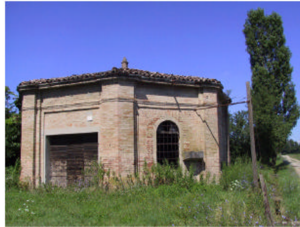
14. Edificio 1a. Fronte est.