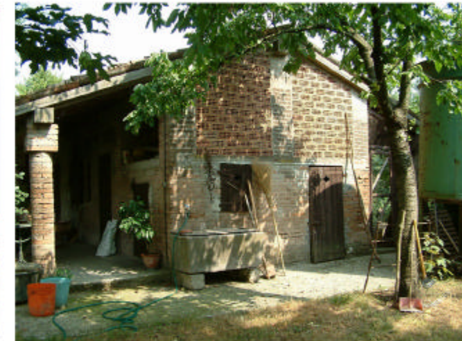
6. Edificio 3. Fronte ovest.