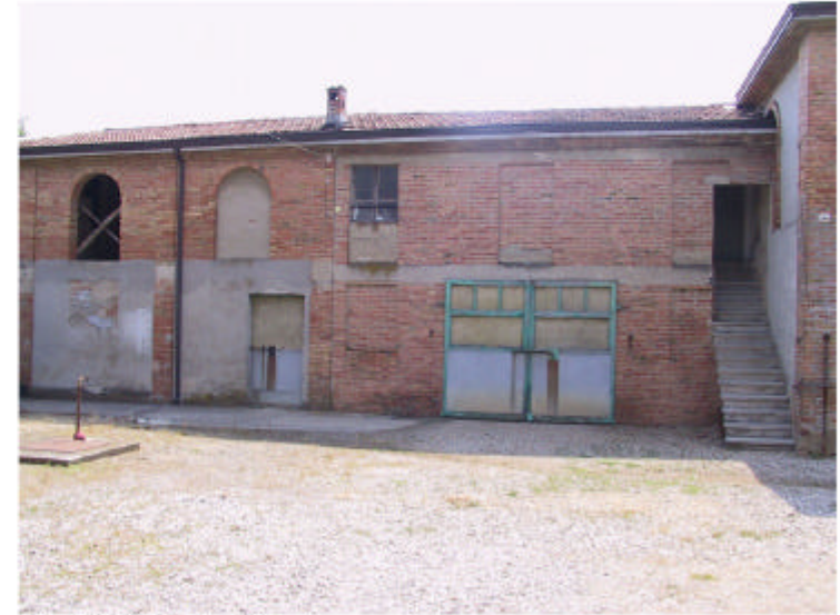
2. Edificio 2. Fronte ovest.