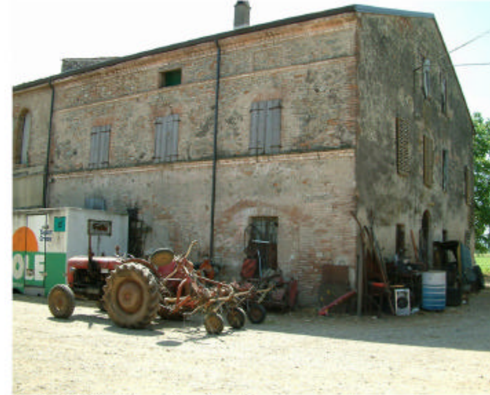
3. Edificio 1, parte 1a. Fronte nord.