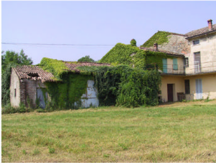
1. Edificio 2. Fronte nord-est.