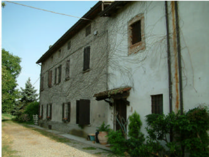
1. Edificio 1, parti 1a e 1b. Fronte nord