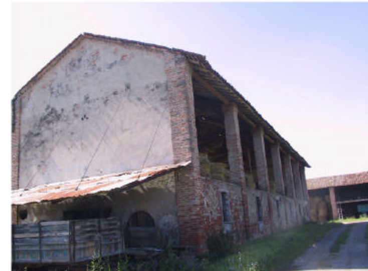
12. Edificio 2. Fronte ovest.