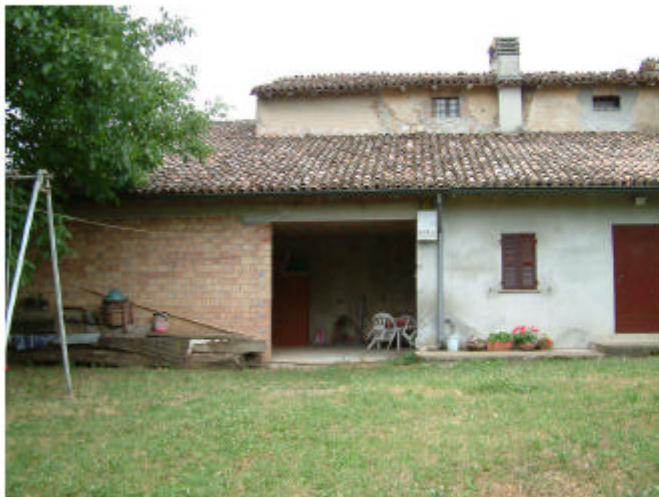
4. Edificio 1, parte 1d. Fronte nord.