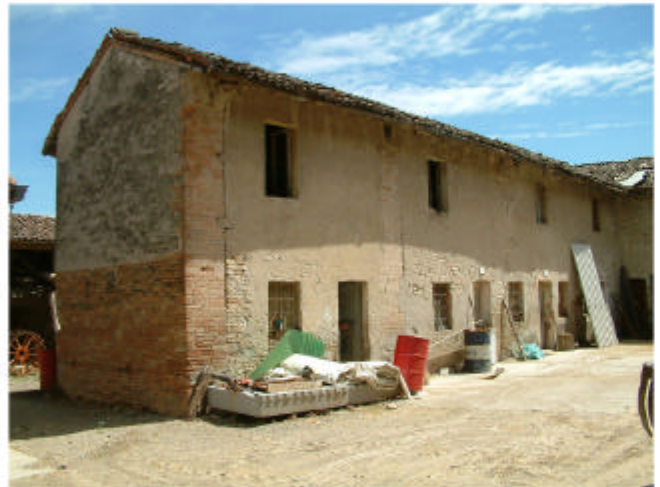
4. Edificio 1, parte 1e. Fronti ovest e sud.