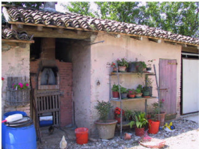
5. Edificio 2b. Fronte nord-est.