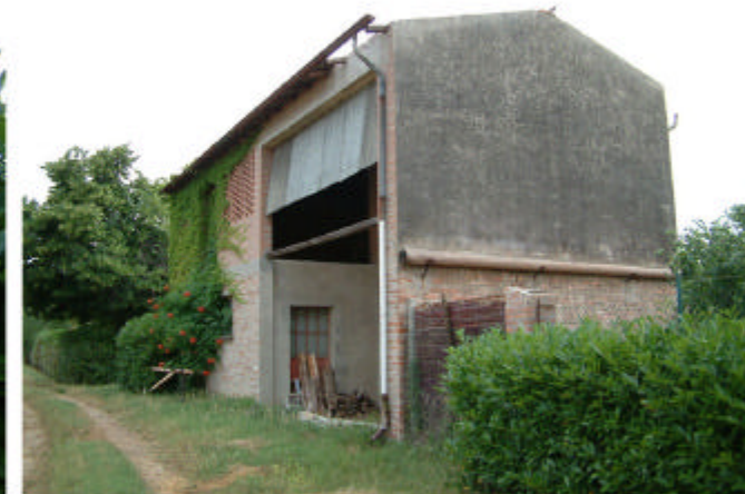
12. Edificio 7. Fronti sud es est.