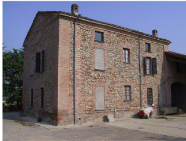
2. Edifici 1a e 1b. Fronte sud-est.