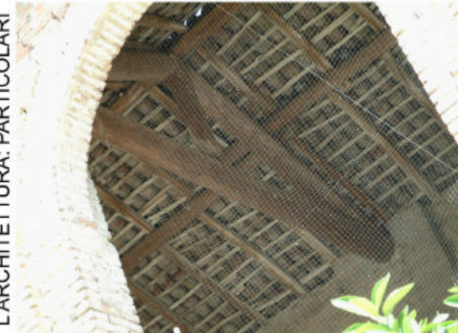
6. Edificio 1, parte 1a. Particolare copertura.