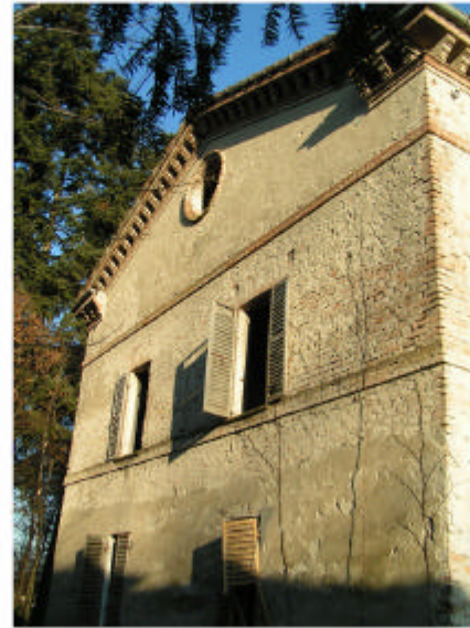
8. Edificio 2. Fronte ovest