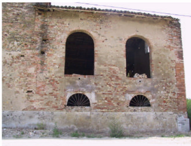
5. Edificio 1, parte 1c. Fronte nord-est