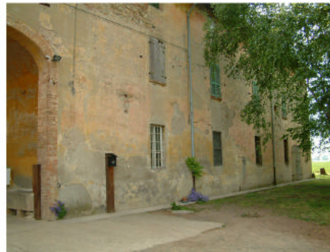
5. Edificio 1, parte 1a. Fronte nord-est.