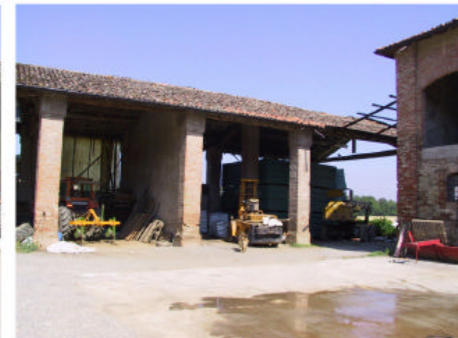
5. Edificio 2b. Fronte est.