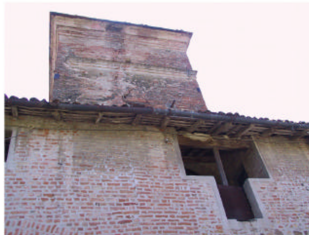
17. Edificio 7d. Particolare della torre.