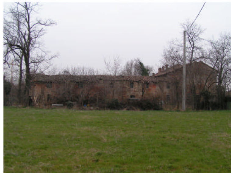
7. Edificio 1c-1d. Fronte est