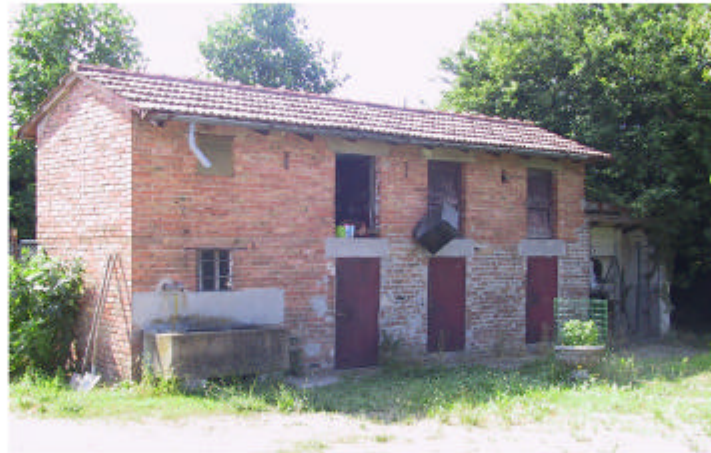
5. Edificio 2. Fronte nord-ovest.