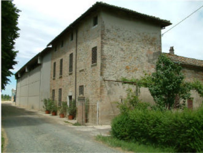
1. Edificio 1, parti 1a, 1b, 1c e 1d. Fronti sud ed est