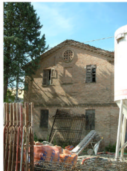
4. Edificio 1a