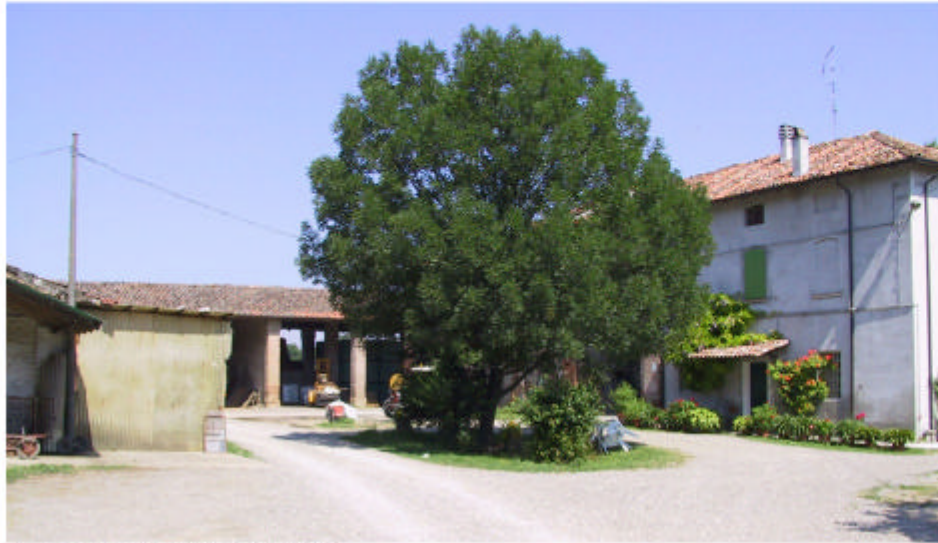
1. La corte vista da Est.