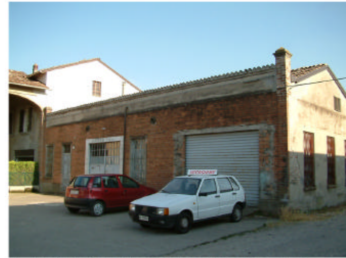
3. Edificio 1, parte 1i. Fronti nord e ovest.