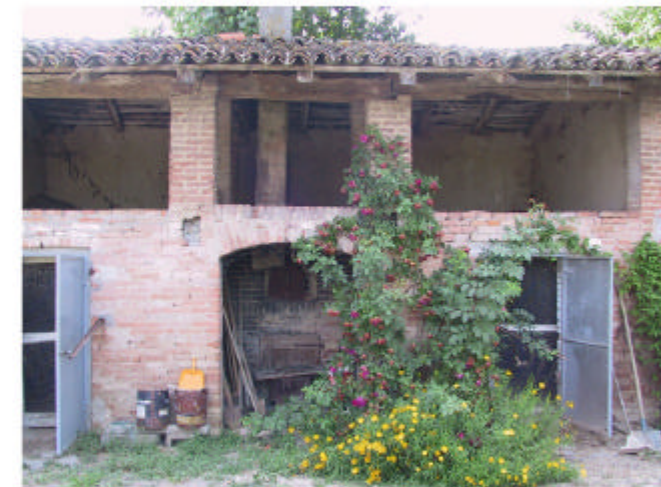
6. Edificio 2. Fronte nord-ovest.