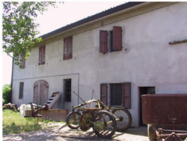
4. Edifici 2a, 2b, 2c. Fronte ovest.