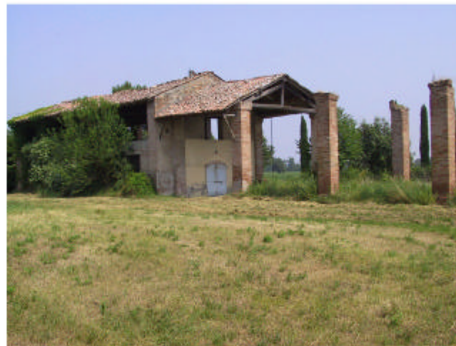
5. Edificio 1. Fronte sud-ovest.