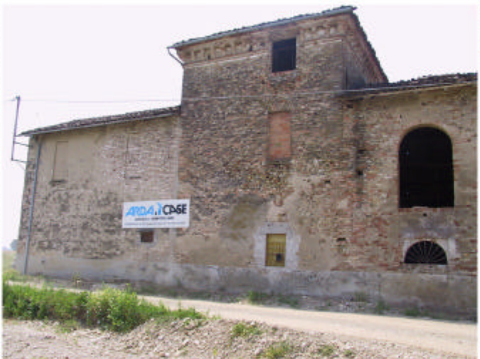
4. Edificio 1, parti 1a, 1b. Fronte nord-est.