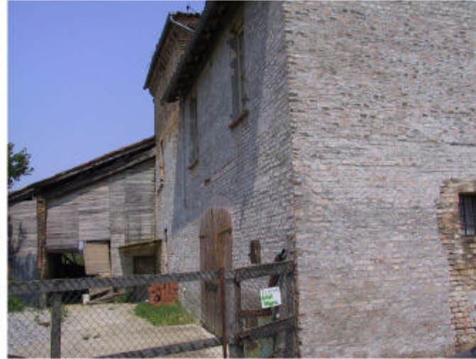
2. Edificio 1. Fronte sud-ovest.