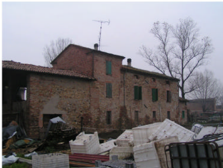
3. Edificio 1. Fronte sud