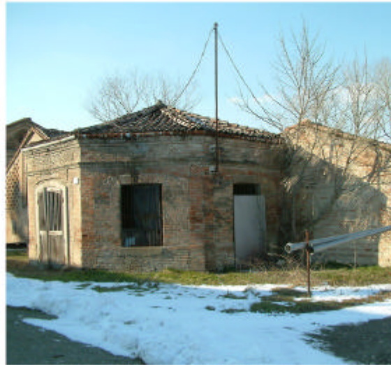
13. Edificio 3a. Fronte sud-est