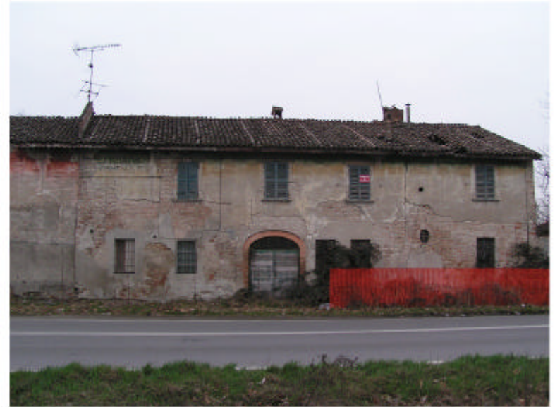
2. Edificio 1a. Fronte nord