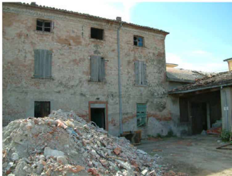
3. Edificio 1c