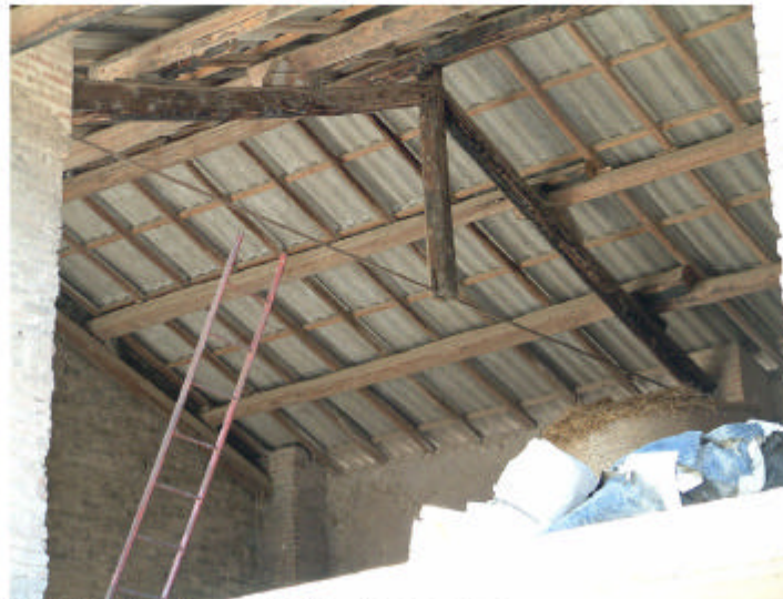
8. Edificio 2, parte 2a. Copertura.