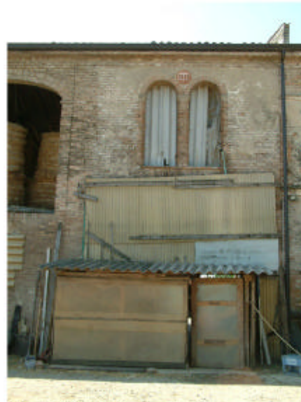
2. Edificio 1, parte 1b. Fronte nord.