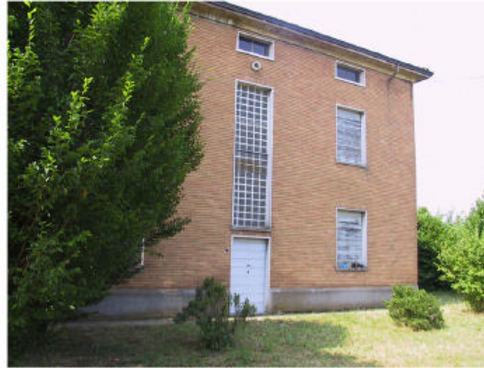
2. Edificio 2b. Fronte nord-est.