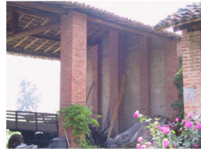
3. Edificio 1b. Fronte sud-ovest.