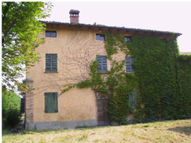
4. Edificio 2a. Fronte sud-ovest.