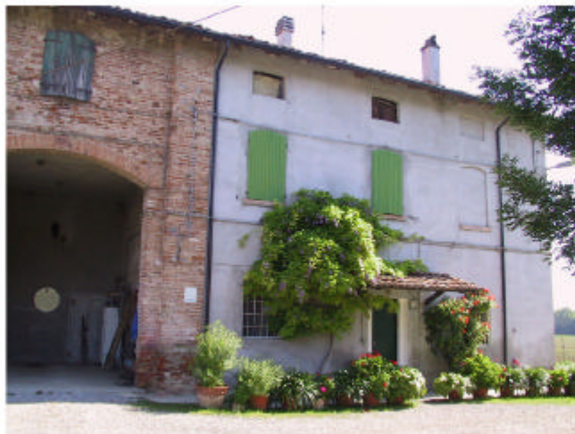
3. Edificio 1a e 1b. Fronte sud.