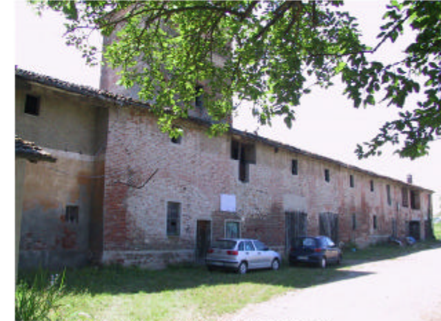
3. Edificio 7d e 7e. Fronte ovest.