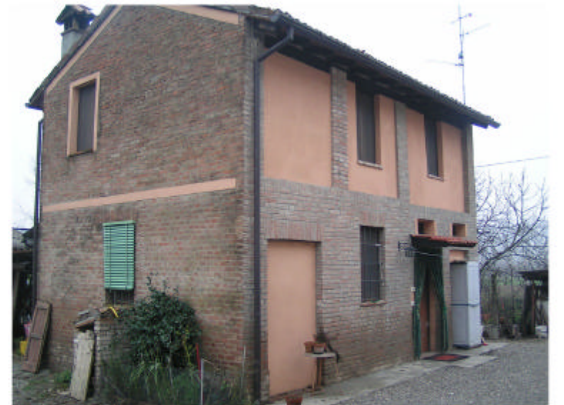
4. Edificio 2. Fronte nord-est