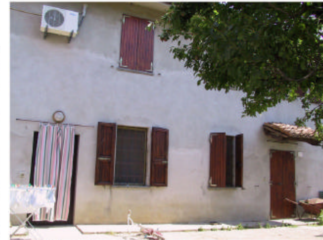
3. Edificio 1a e 1b. Fronte sud.