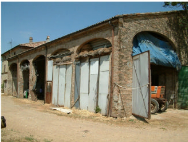
4. Edificio 1. Fronte sud.