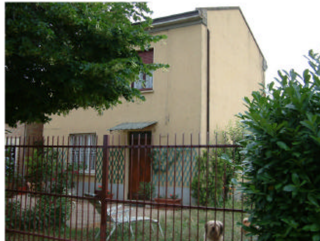
11. Edificio 6. Fronte sud