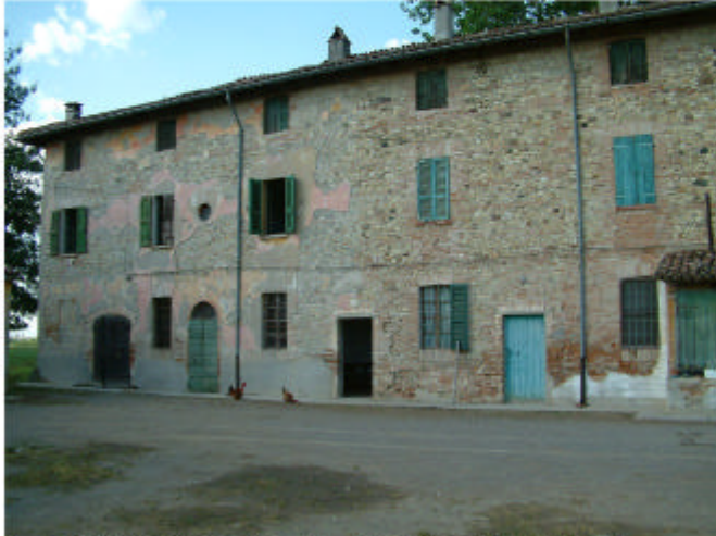
1. Edificio 1, parte 1a. Fronte sud-ovest.