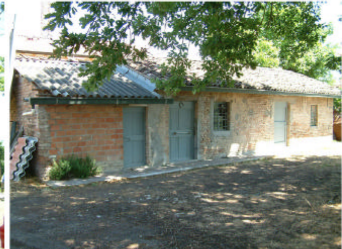
3. Edificio 2. Fronte sud.