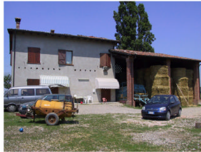
2. Edifici 1a e 1b. Fronte sud-est.