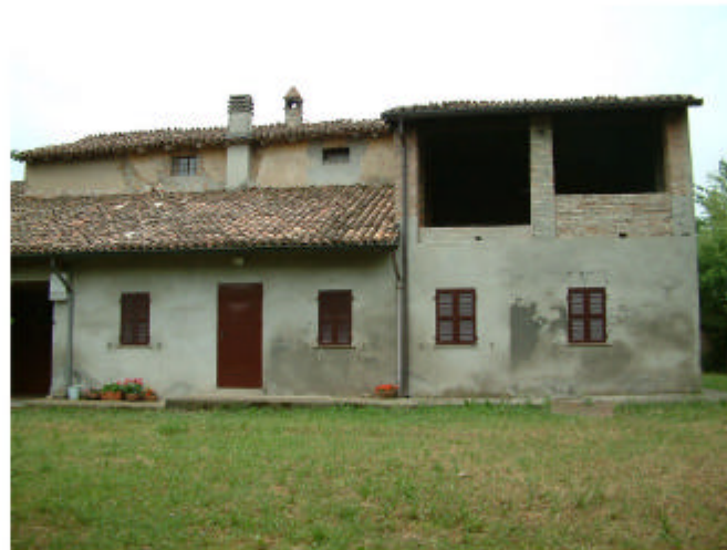
5. Edificio 1, parti 1d e 1e. Fronte nord