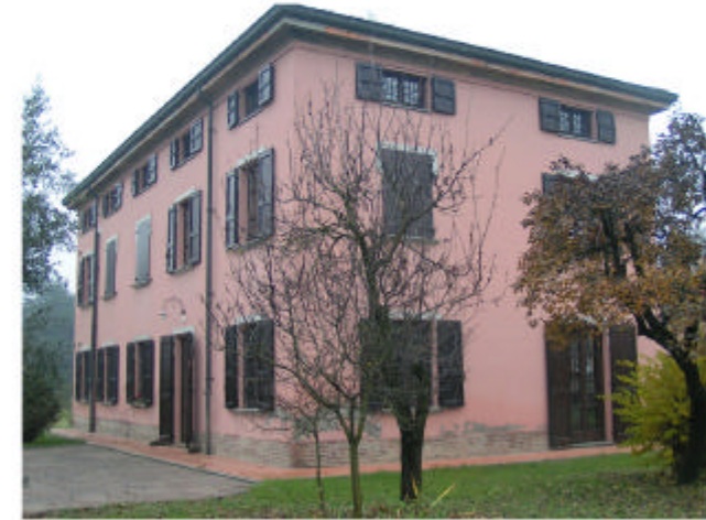
3. Edificio 1. Fronte sud-ovest