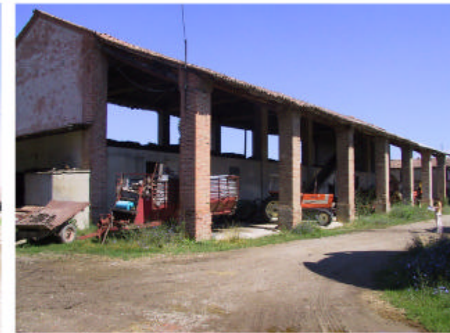
6. Edificio 2. Fronte est.