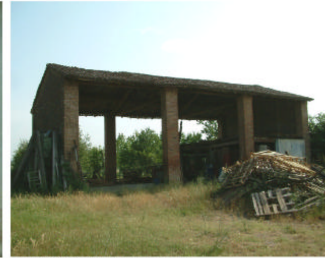
3. Edificio 2. Fronte nord