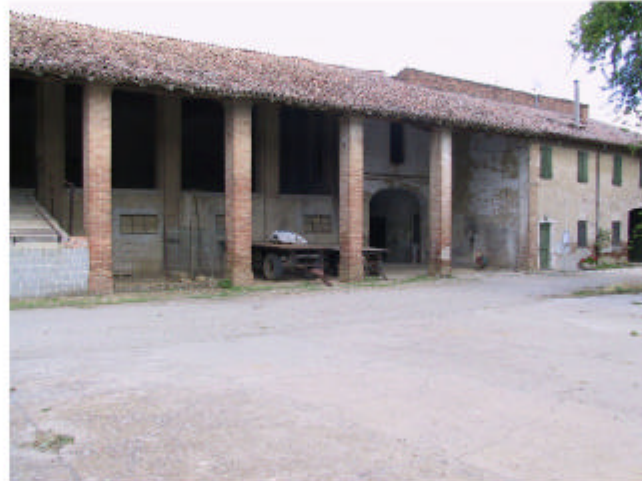
5. Edificio 2, parti 2a e 2b. Fronte nord-est.