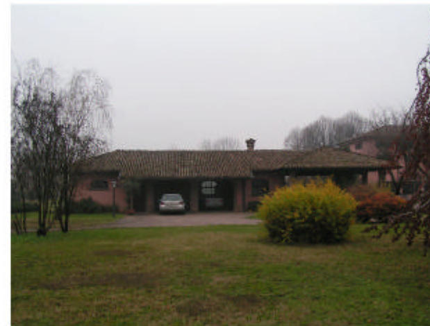
5. Edificio 3. Fronte est