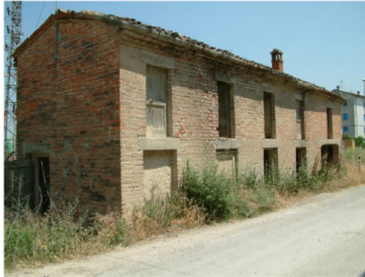
8. Edificio 2. Fronte sud