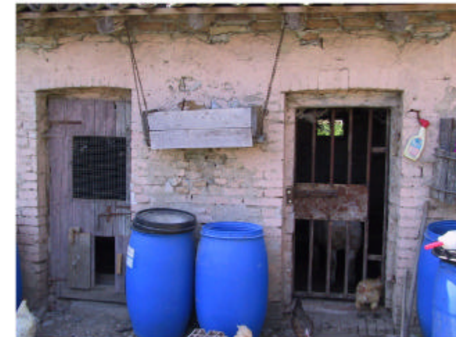
6. Edificio 2b. Fronte nord-est.