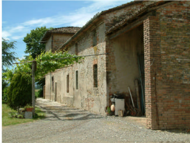
2. Edificio 1, parti 1a, 1d, 1f. Fronte est.