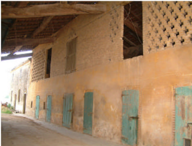
11. Edificio 3, parte 3b. Fronte sud-est.