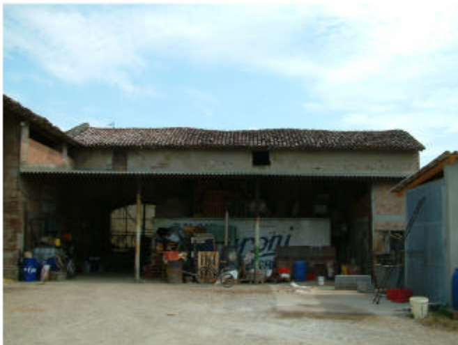
4. Edificio 1, parti 1a, 1b, 1c e 1e. Fronte sud.