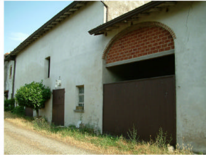
2. Edificio 1, parti 1c, 1d e 1e. Fronte nord.