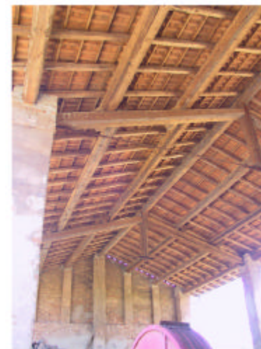
10. Edificio 3. Particolare copertura.