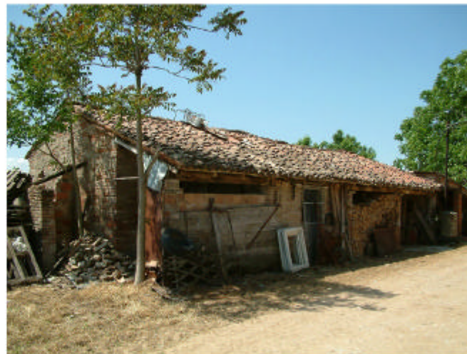
5. Edificio 2. Fronte nord.