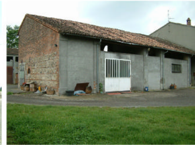
3. Edificio 1, parte 1c. Fronti est e nord.