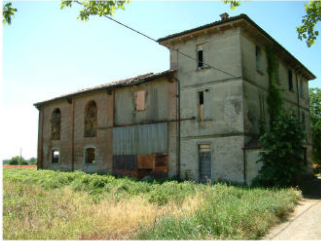
1. Edificio 1. Fronte nord.