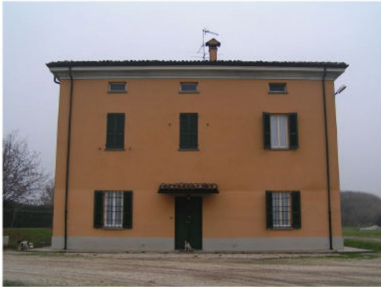
1. Edificio 1. Fronte est