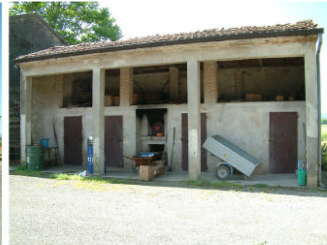
6. Edificio 4. Fronte nord