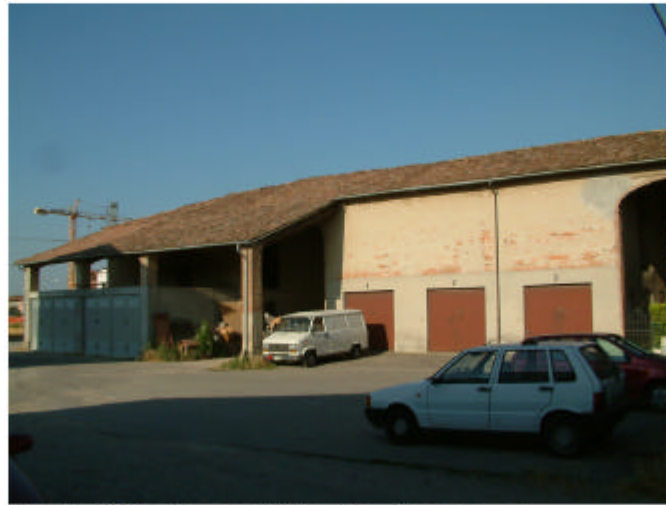
2. Edificio 1, parti 1f e 1g. Fronte est.