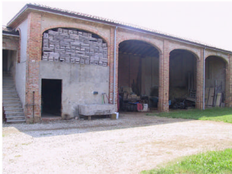
3. Edificio 2. Fronte ovest.