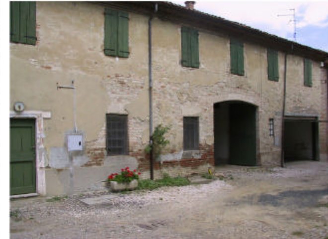
6. Edificio 2, parte 2d. Fronte nord-est.