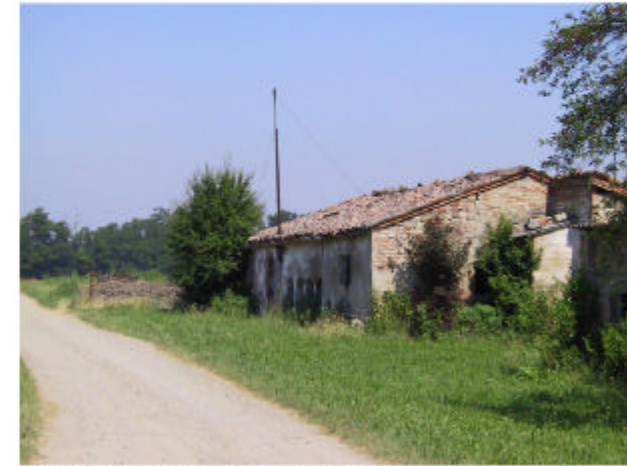
15. Edificio 5. Fronti sud e ovest.