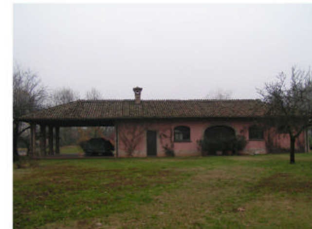
6. Edificio 3. Fronte ovest