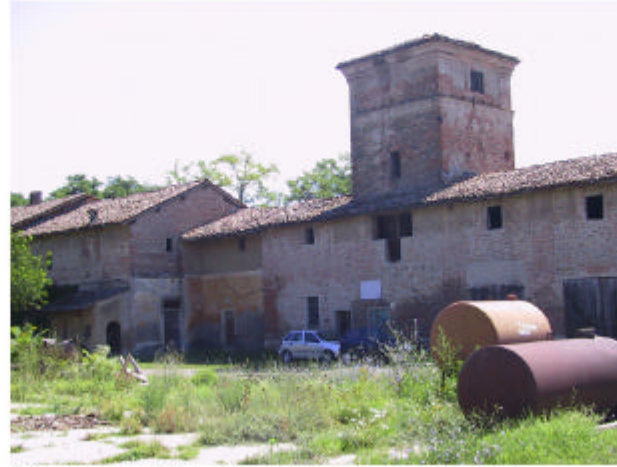
2. Edificio 7b, 7c e 7d. Fronte ovest.