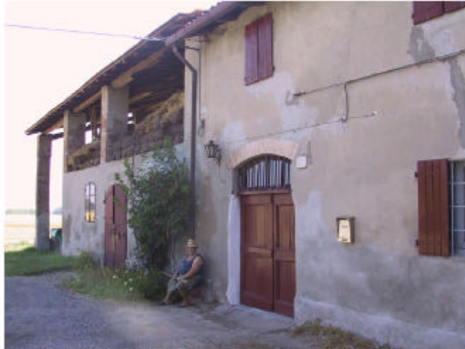
1. Edificio 1, parti 1b, 1c e 1d. Fronte est.