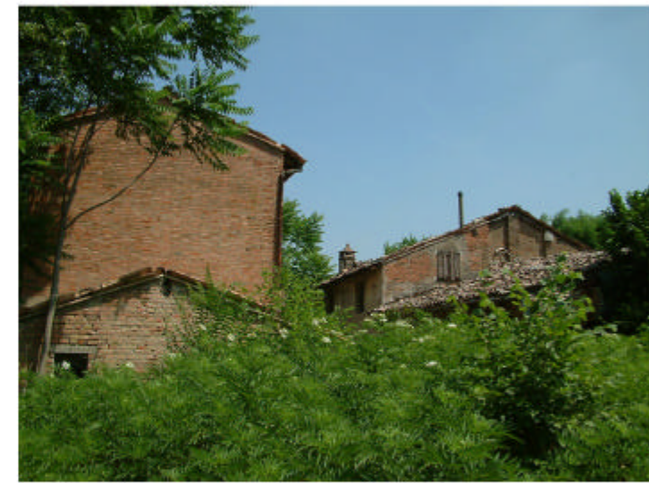
6. Complesso visto da Sud.