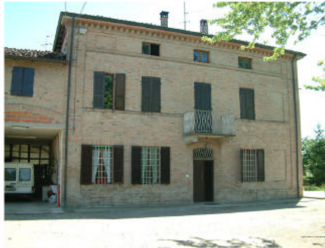
2. Edificio 1, parte 1a. Fronte ovest.