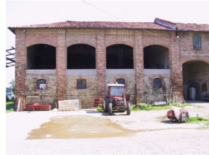
2. Edificio 1c. Fronte sud.