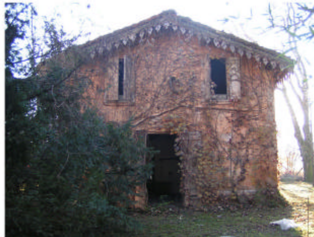
10. Edificio 3. Fronte nord-est