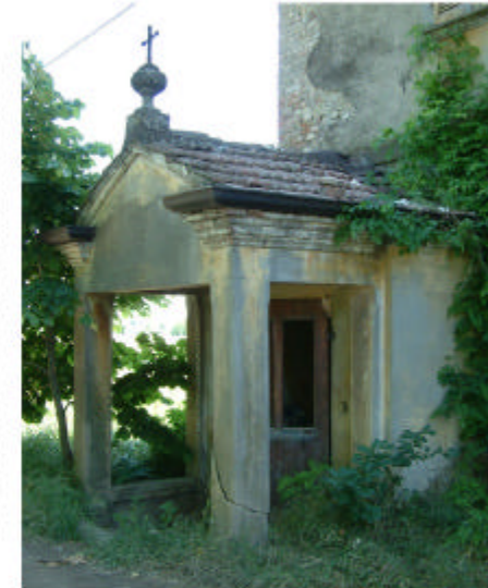
6. Edificio 2.