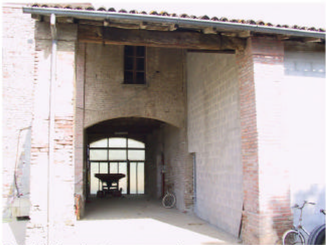
4. Edificio 1b. Fronte sud-est.