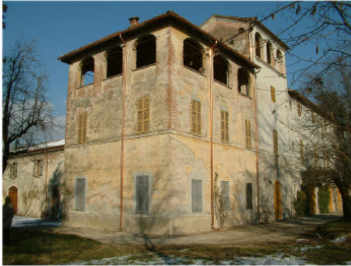
1. Edificio 1c, 1b. Fronti ovest e sud