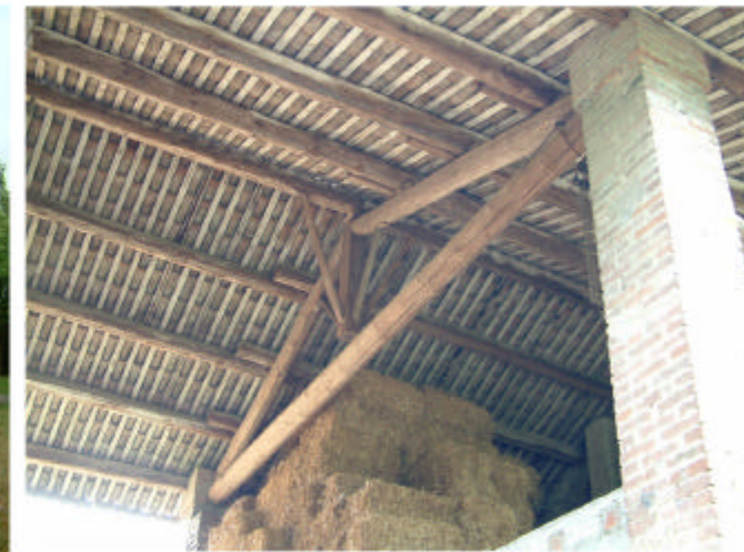
6. Edificio 2. Copertura.