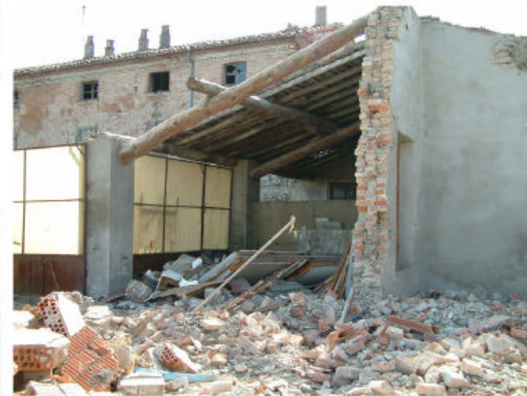
5. Edificio 1e