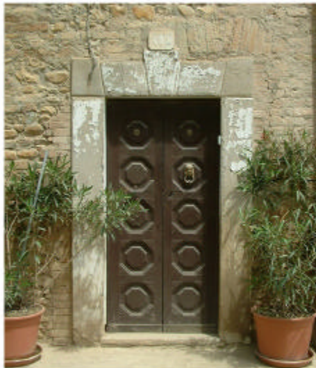
10. Edificio 1, parte 1a. Ingresso.