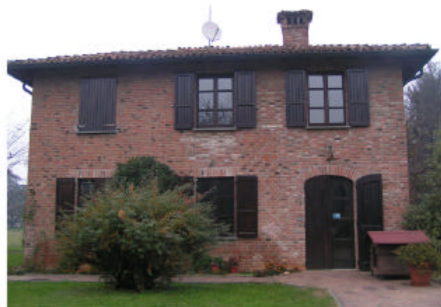
4. Edificio 2. Fronte sud