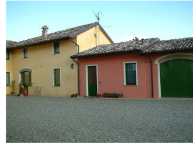
3. Edificio 1, parti 1b e 1c. Fronte nord.