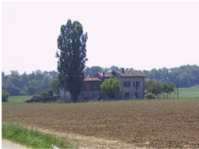
1. Complesso visto da Nord-Ovest.