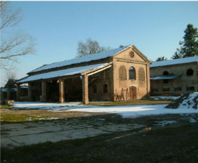
15. Edificio 4. Fronti nord e ovest