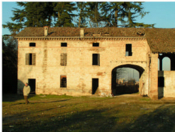
4. Edificio 2. Fronte sud-ovest