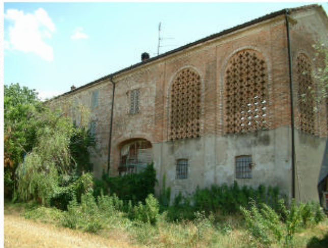
5. Edificio 1, parti 1b e 1a. Fronti nord e ovest