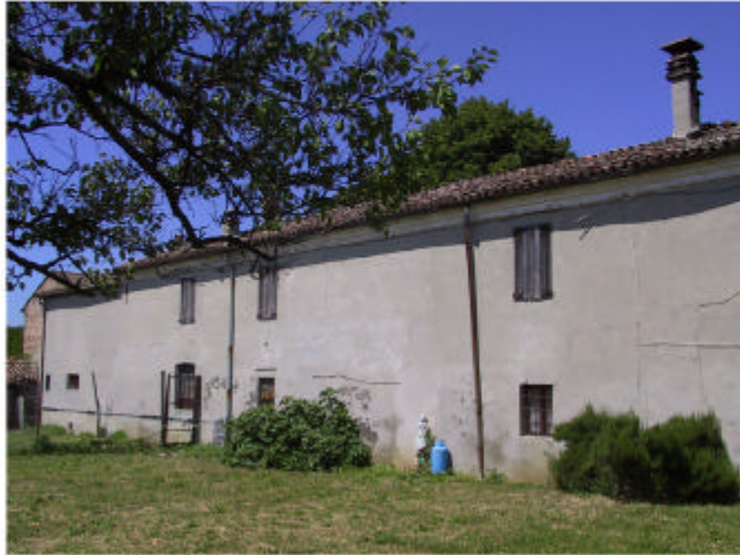
1. Edificio 1, Parti 1b e 1c. Fronte sud-est.