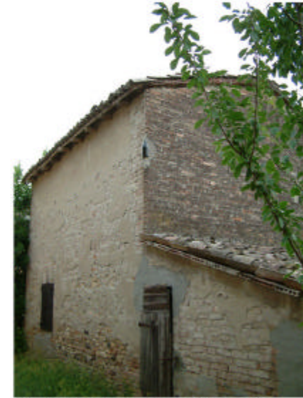
9. Edificio 3, parti 3b e 3c. Fronti sud ed est.