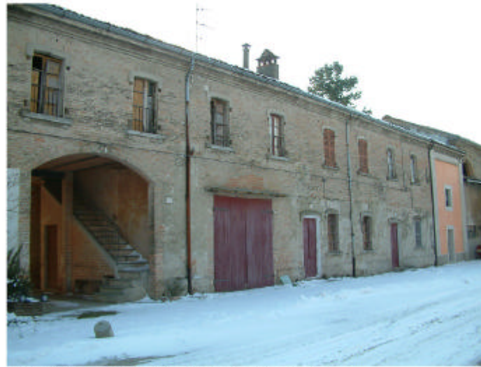
7. Edificio 1g, 1h, 1i. Fronte nord