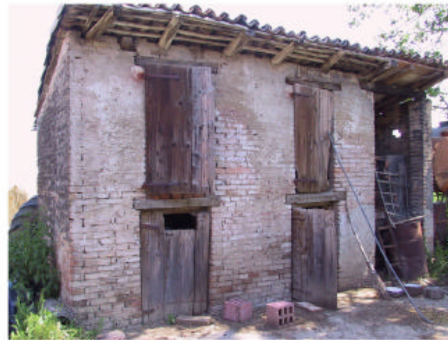
5. Edificio 2. Fronte sud.