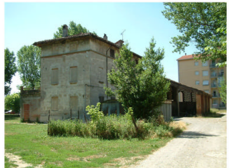
4. Fronte nord