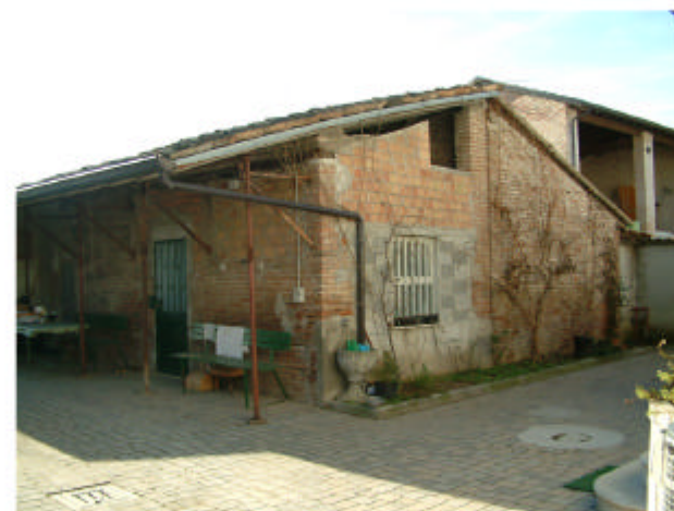
5. Edificio 3. Fronti est e nord