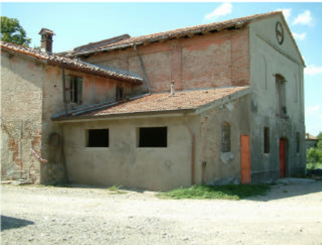
4. Edificio 1, parti 1d, 1e, 1f. Fronti sud ed est