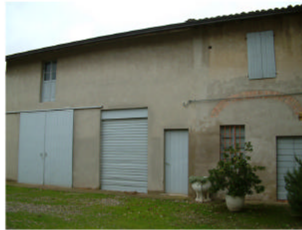
2. Edificio 1a. Fronte est