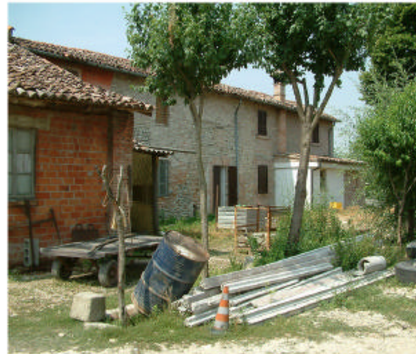
5. Edificio 1. Fronte nord.