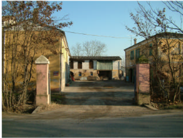
1. Accesso da Ovest