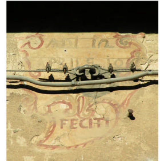
5. Edificio 1. Scritta