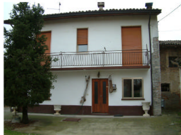
16. Edificio 12a. Fronte sud