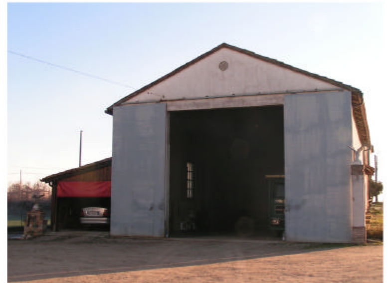
10. Edificio 3. Fronte ovest