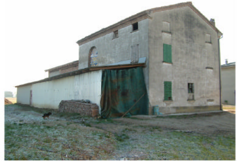
2. Edificio 1. Fronti nord e ovest