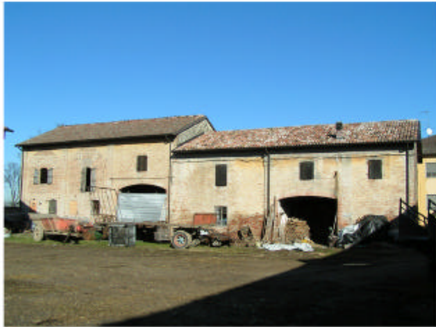
1. Edificio 1. Fronte sud