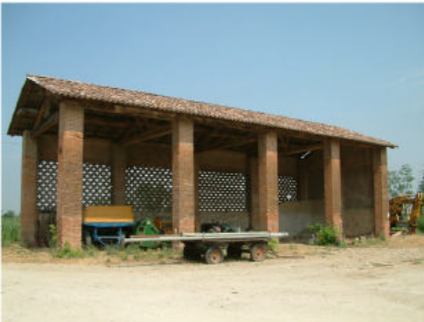
16. Edificio 2. Fronti sud ed est.