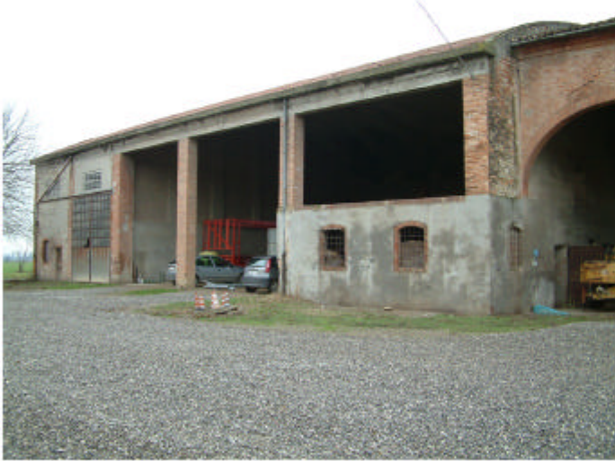
7. Edificio 2, parte 2d. Fronte sud.