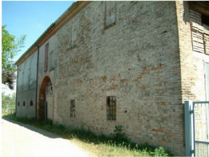
1. Edificio 1, parti 1f e 1g. Fronte nord