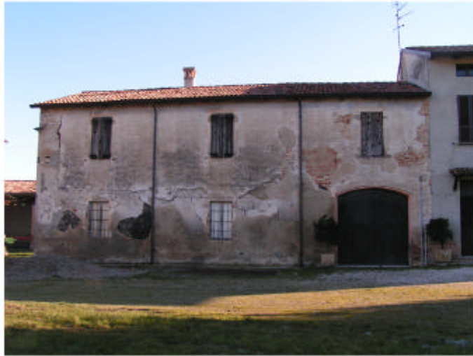
1. Edificio 1c, 1d. Fronte ovest