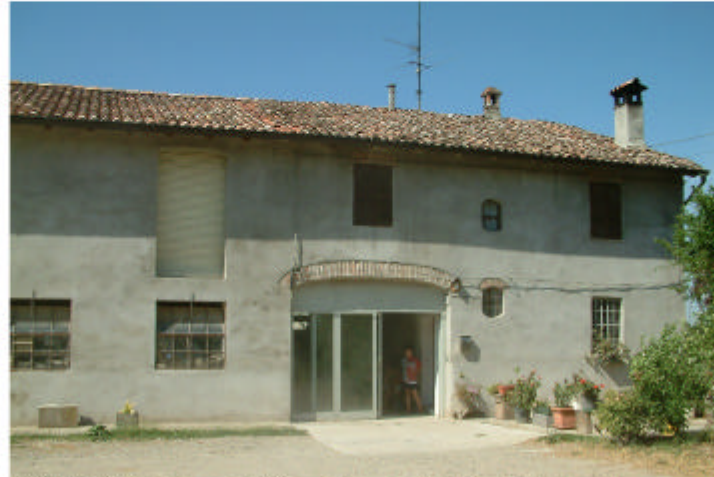
2. Edificio 1, parti 1a, 1b, e 1c. Fronte sud.