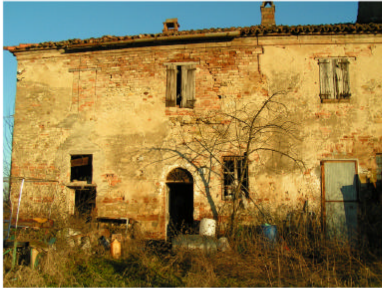
1. Edificio 1, parte 1a. Fronte ovest