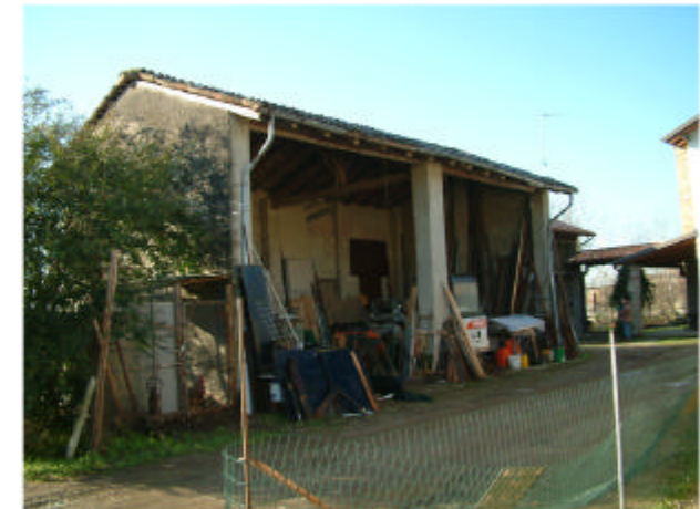
6. Edificio 4. Fronti est e nord