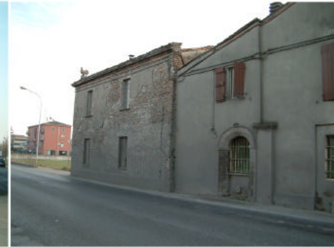
3. Edificio 2, parti 2e e 2d. Fronte nord.