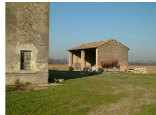
6. Edificio 3. Fronte sud-est