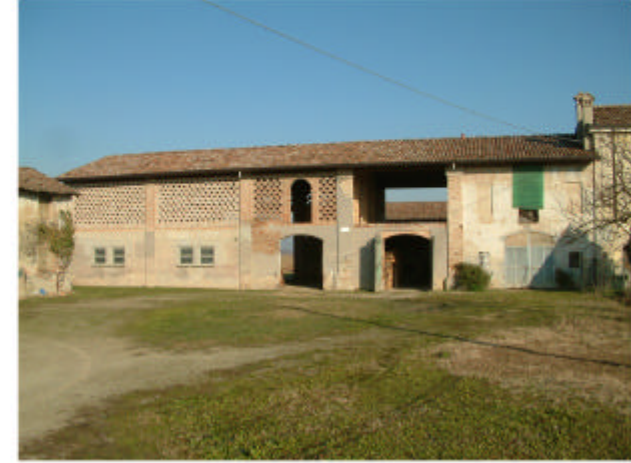
3. Edificio 1b-1c-1d. Fronte sud