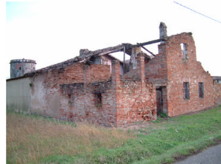
12. Edificio 5. Fronti ovest e sud