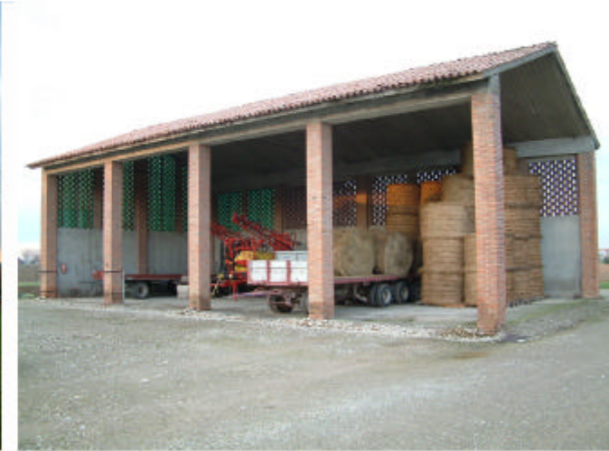
9. Edificio 4. Fronte sud