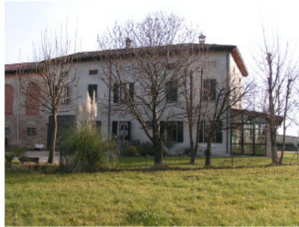
2. Edifici 1a-1b. Fronte ovest