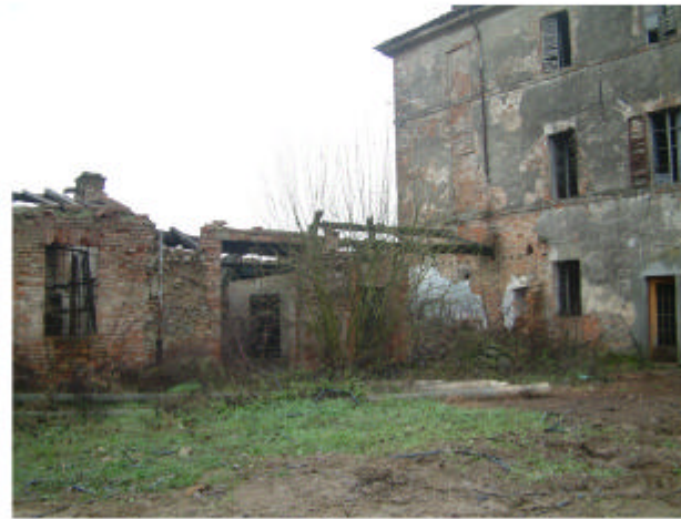
2. Edificio 1h. Fronte ovest