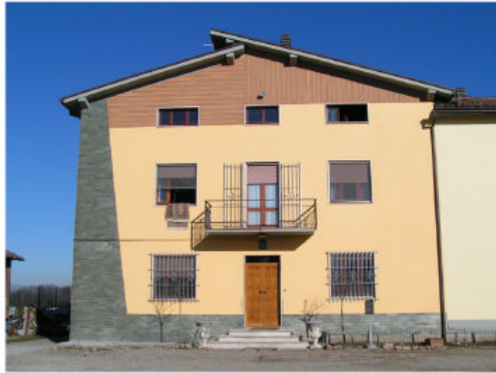
1. Edificio 1a. Fronte sud