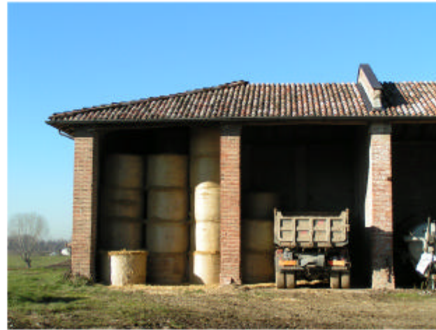
2. Edificio 2. Fronte est