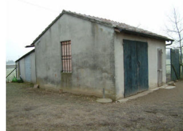
6. Edificio 3. Fronti nord e ovest