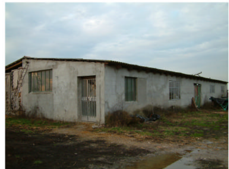
4. Edificio 3. Fronti sud ed est