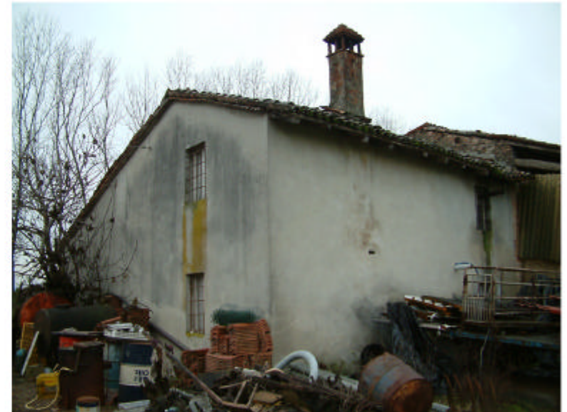
2. Edificio 1. Fronte est