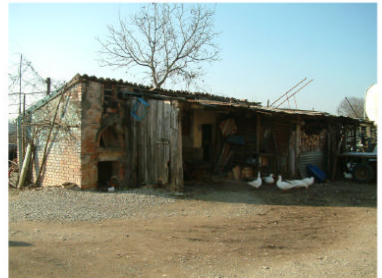
4. Edificio 2. Fronti est e nord