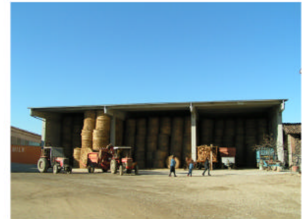
6. Edificio 4. Fronte est