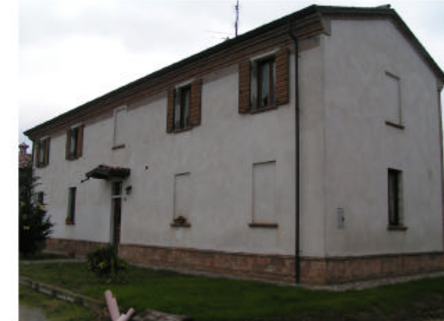
6. Edificio 5. Fronte est