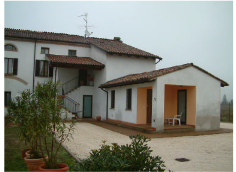
2. Edificio 1d. Fronte sud-ovest