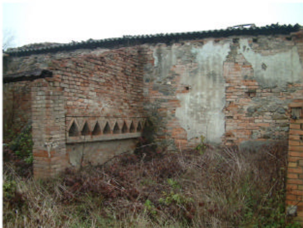
10. Edificio 1h. Interno pollaio