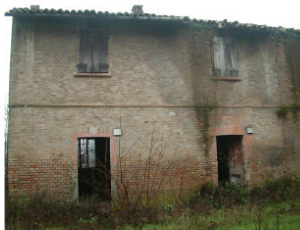
11. Edificio 2a. Fronte nord