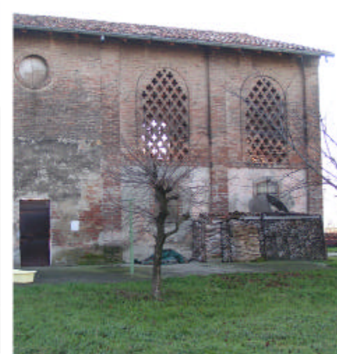
7. Edificio 1, parti 1c e 1d. Fronte nord.