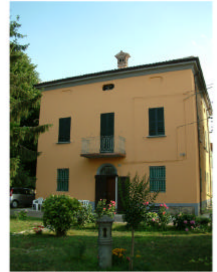
3. Edificio 4. Fronte nord.