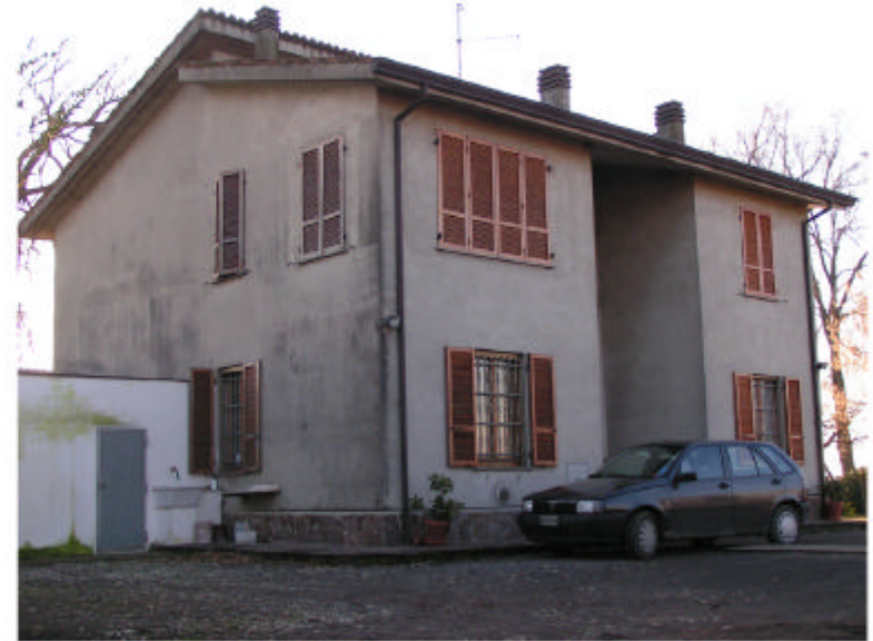
2. Edificio 1a. Fronte nord-est