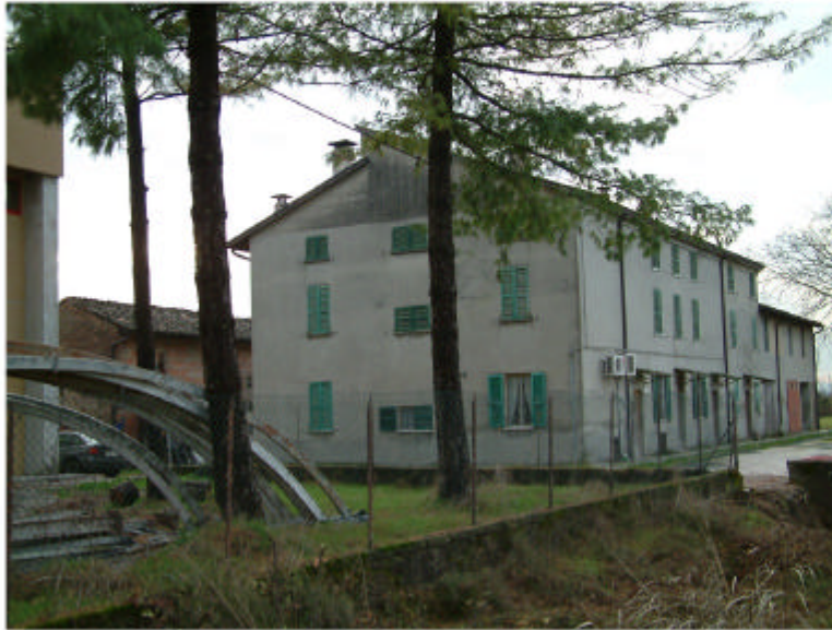
1. Edificio 1. Fronte nord-est