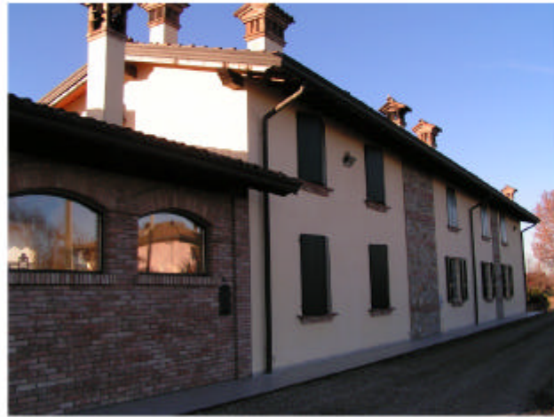
1. Edificio 1. Fronte nord