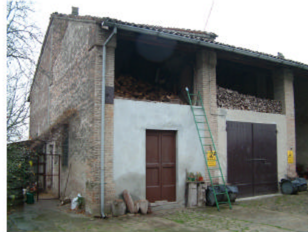
5. Edificio 2. Fronte nord