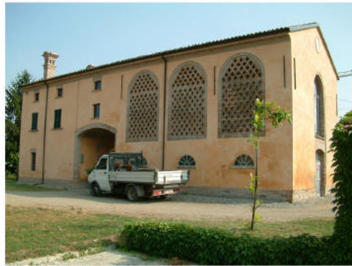
2. Edificio 1. Fronte nord.