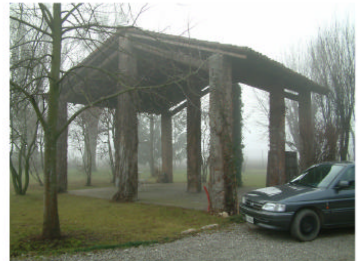
6. Edificio 2