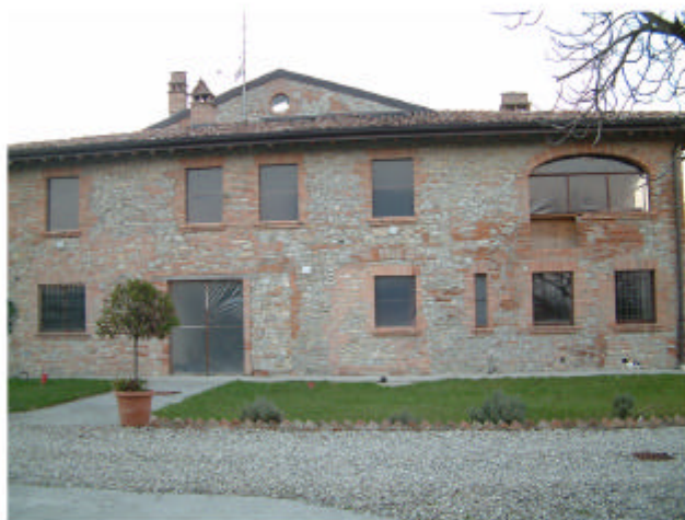
4. Edificio 1c. Fronte est