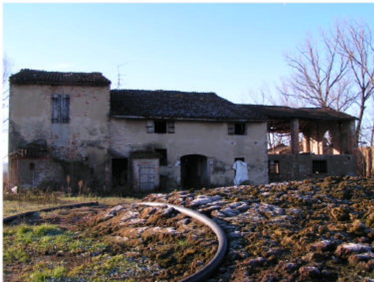
3. Edificio 1. Fronte nord