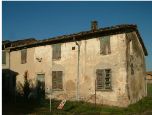
5. Edificio 3c. Fronte sud