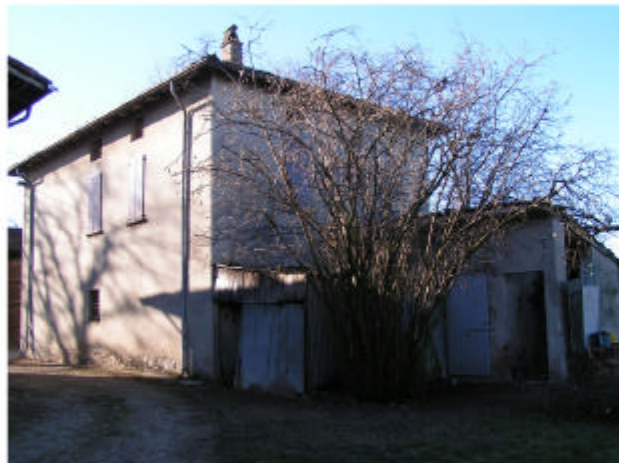
4. Edificio 2. Fronti est e nord