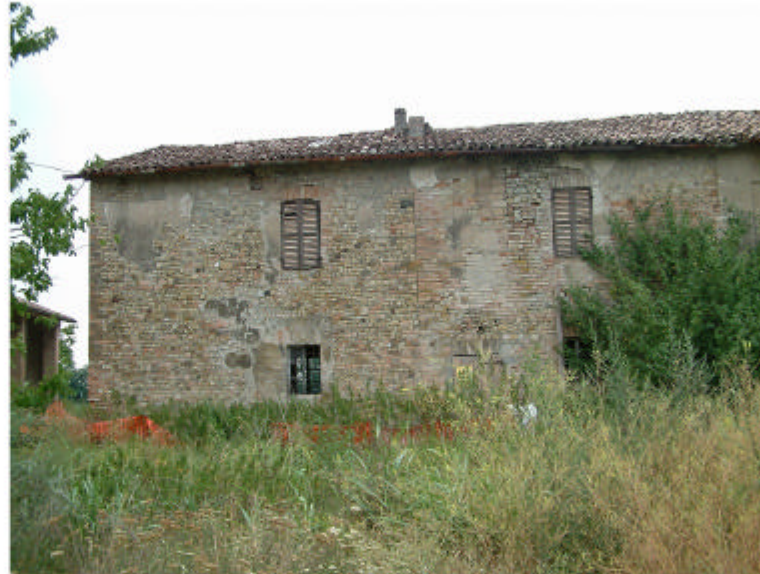
5. Edificio 3; parte 3a. fronte est