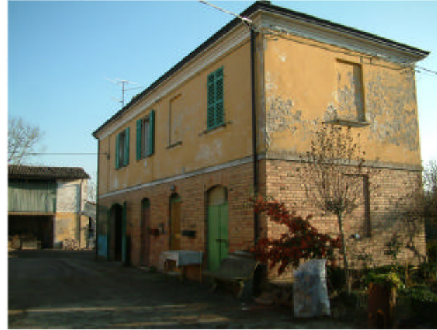
2. Edificio 1. Fronte nord-ovest