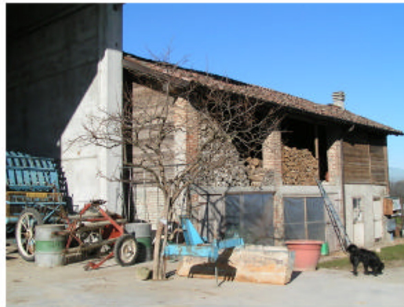
5. Edificio 3. Fronte est