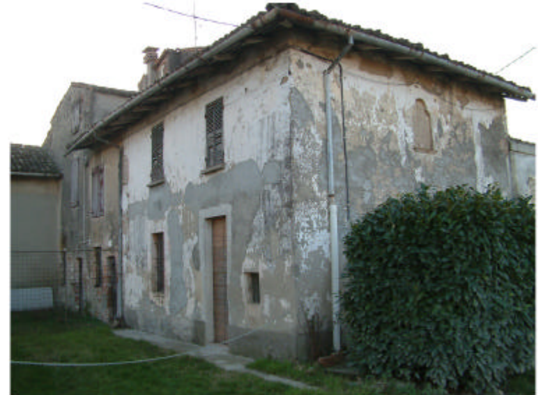
5. Edificio 1d. Fronti est e nord