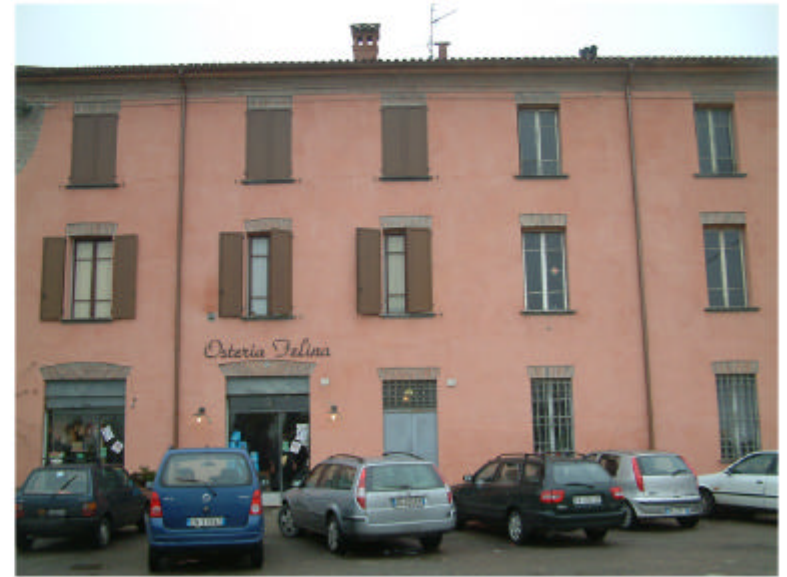
2. Edificio 1a. Fronte nord