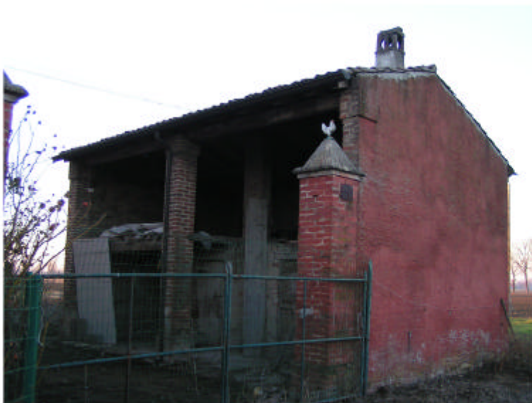
3. Edificio 2. Fronte sud. Visione dell'accesso in primo piano