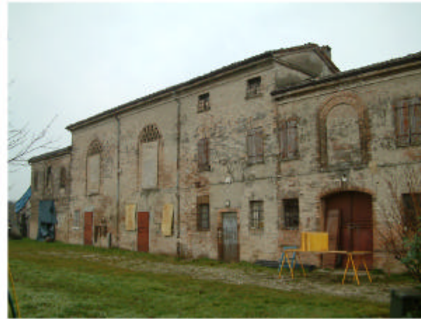
2. Edificio 2. Fronte est