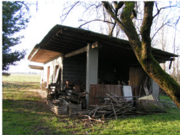
4. Edificio 2