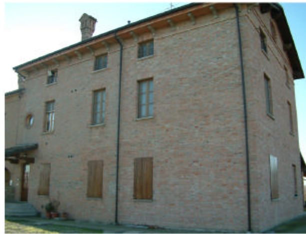
2. Edificio 1a. Fronte nord-est