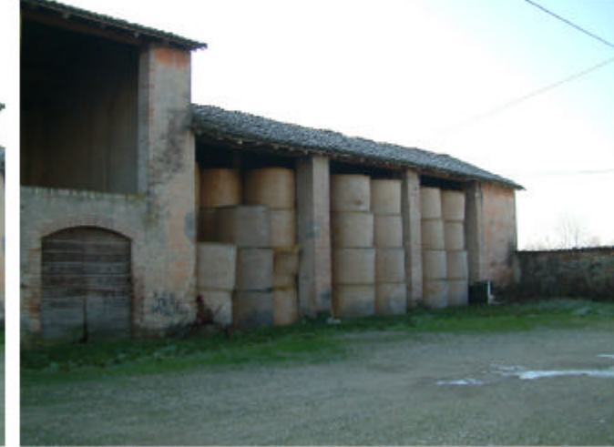
3. Edificio 2, parte 2d. Fronte nord.