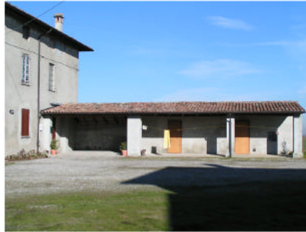
2. Edificio 1, parte 1d. Fronte sud