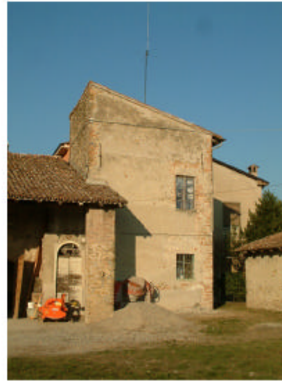
2. Edificio 1, parte 1c. Fronte sud