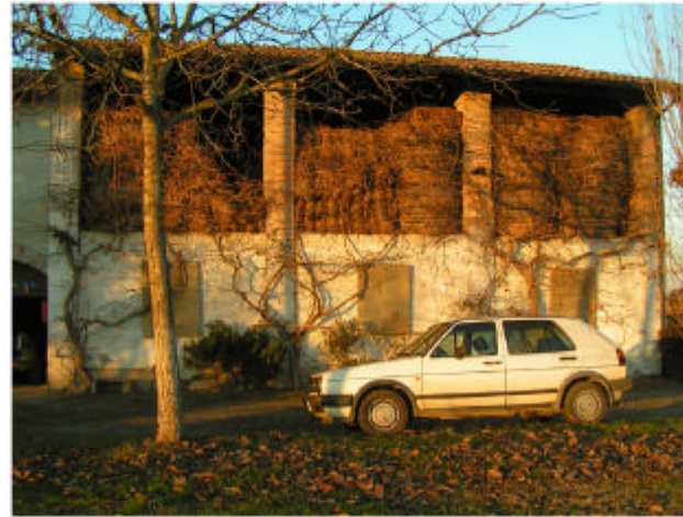
2. Edificio 1, parte 1c. Fronte sud