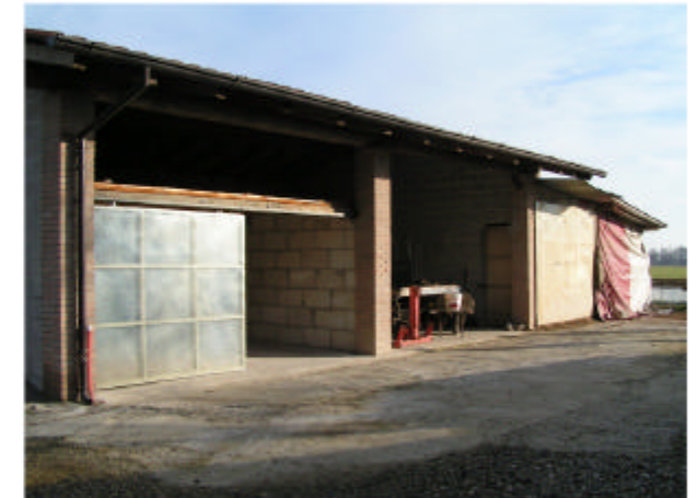
6. Edificio 3. Fronte sud