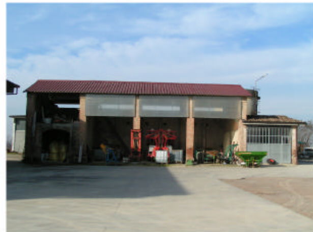
4. Edificio 2. Fronte sud-est