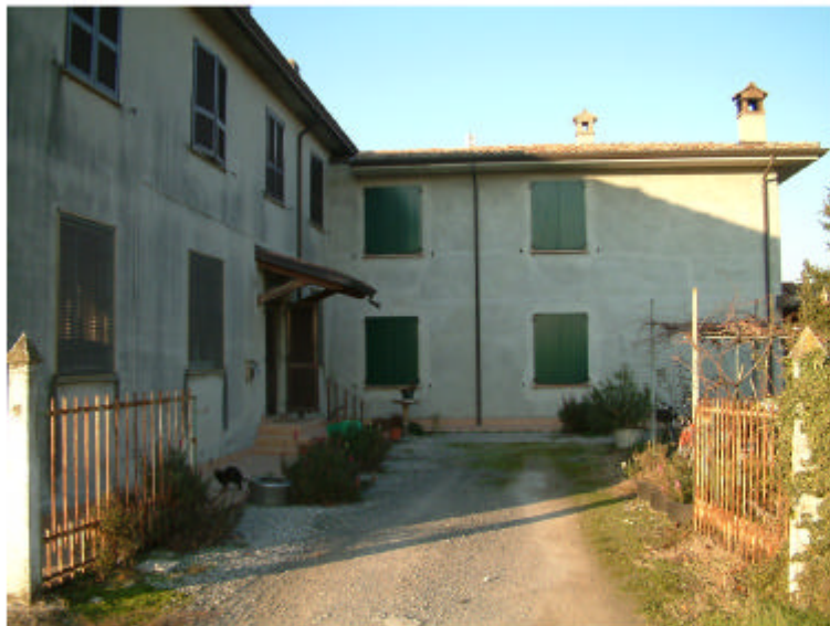
3. Edificio 1c,1d. Fronti est e sud