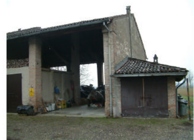
6. Edificio 2. Fronte nord