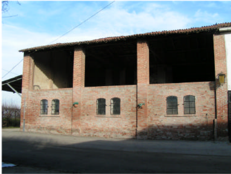
1. Edificio 1, parte 1a. Fronte sud