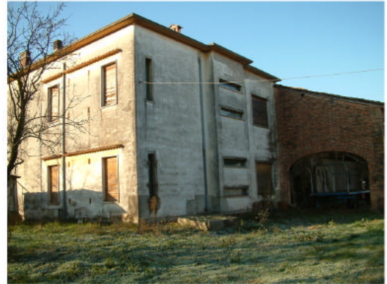
2. Edificio 1. Fronti est e nord