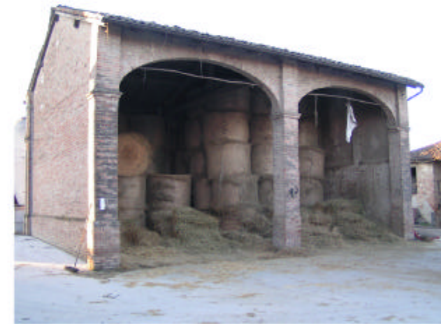
15. Edificio 7. Fronte est