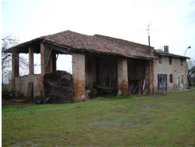
1. Edificio 1. Fronte sud