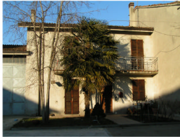
8. Edificio 4d. Fronte sud