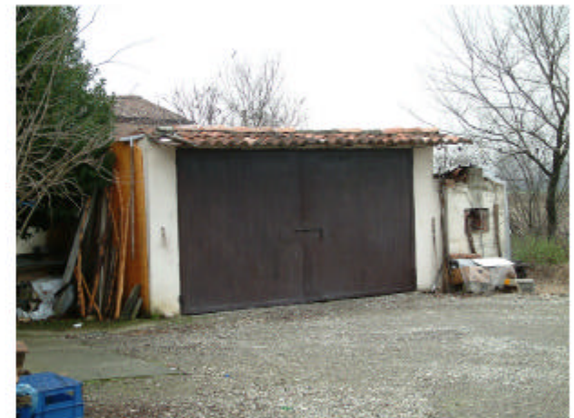
24. Edificio 17. Fronte est