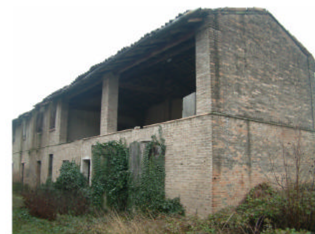
12. Edificio 2b-2c. Fronte nord