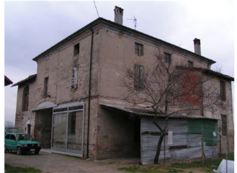
2. Edificio 1. Fronti ovest e sud