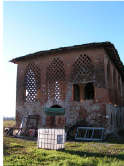
7. Edificio 2. Fronte est