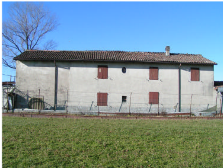
3. Fronte est