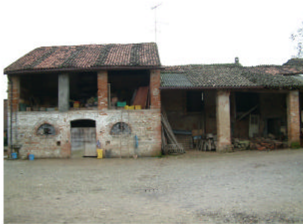
19. Edificio 12c-12e. Fronte nord