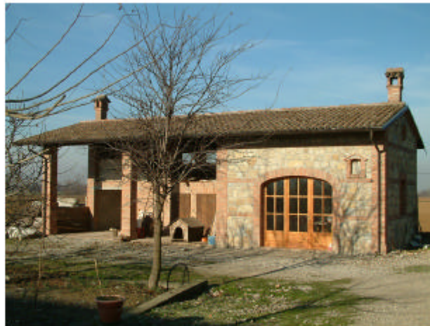
5. Edificio 2. Fronte sud-est