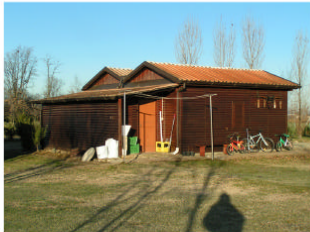
4. Edificio 2.