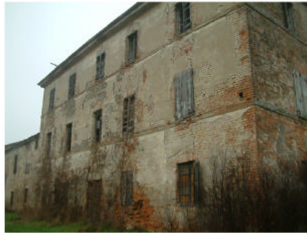
8. Edificio 1g. Fronte sud