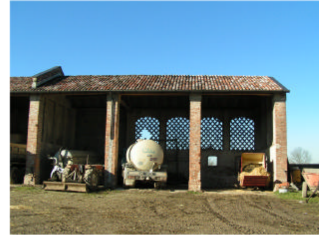
3. Edificio 2. Fronte est