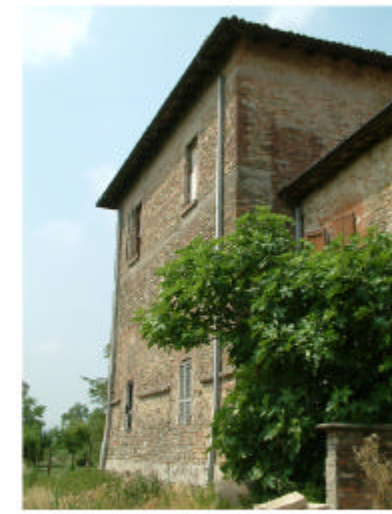
7. Edificio 1, parte 1h. Fronte est