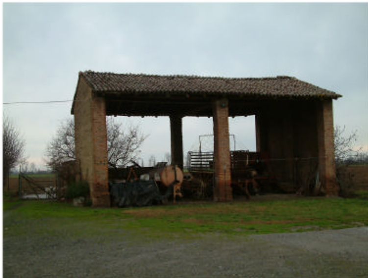
7. Edificio 2. Fronte sud