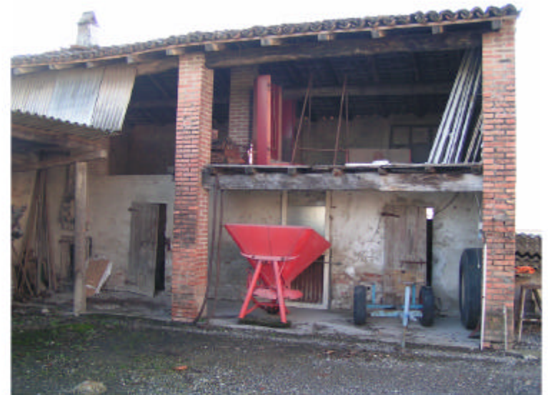
4. Edificio 2. Fronte ovest