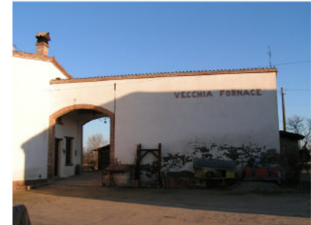
6. Edificio 1d-1e. Fronte sud