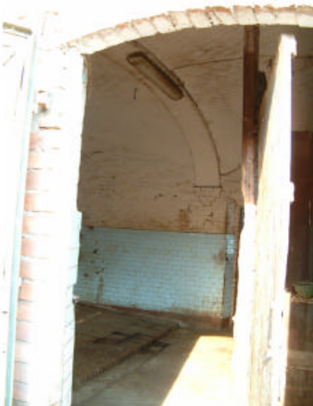
4. Edificio 1, parte 1c. Interno.