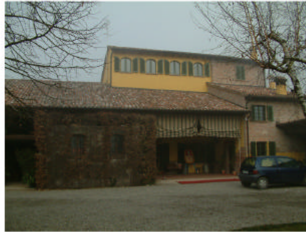
2. Edificio 1b-1c. Fronte sud