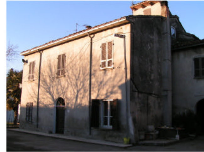
9. Edificio 4e. Fronte sud