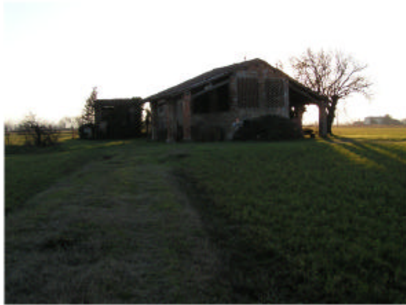
1. Vista da Nord-Est