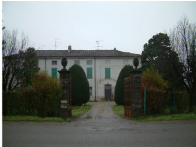
1. Accesso da nord