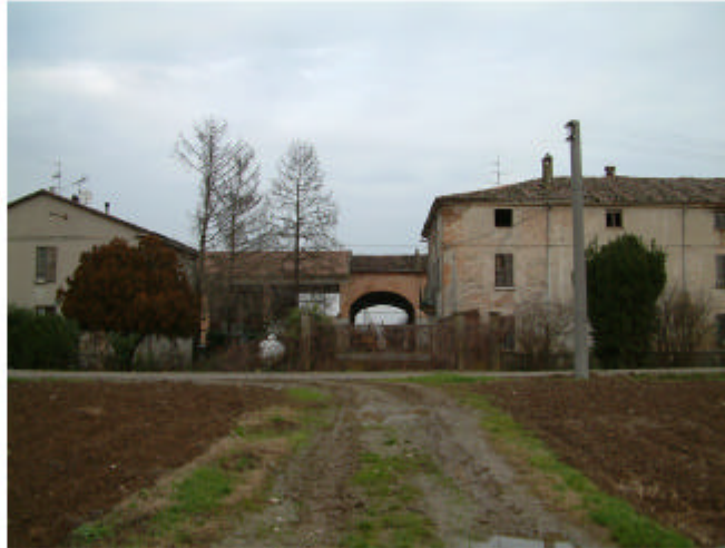
2. Edifici 4 e 1. Fronte sud.