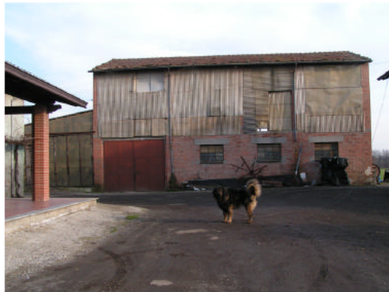
3. Edificio 2. Fronte ovest