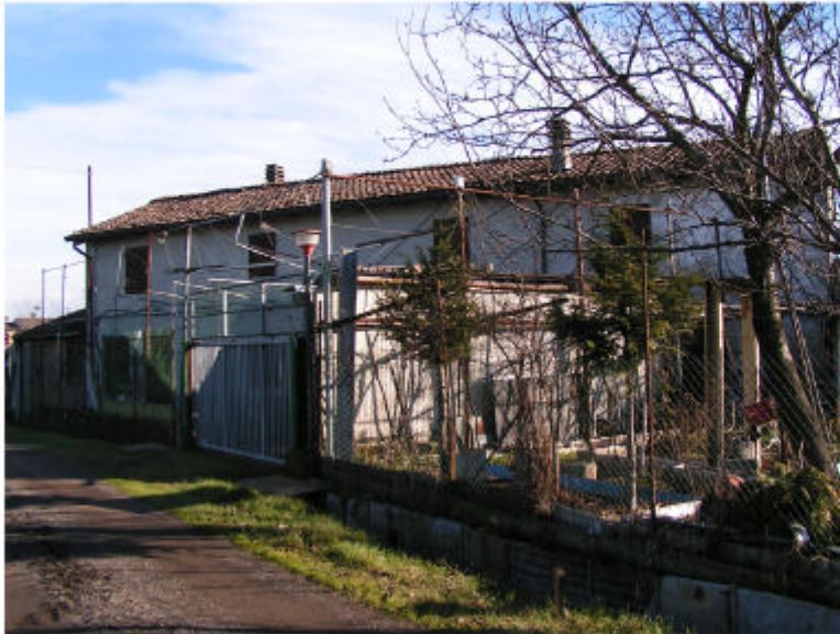
1. Fronte ovest