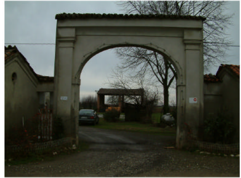
2. Accesso principale