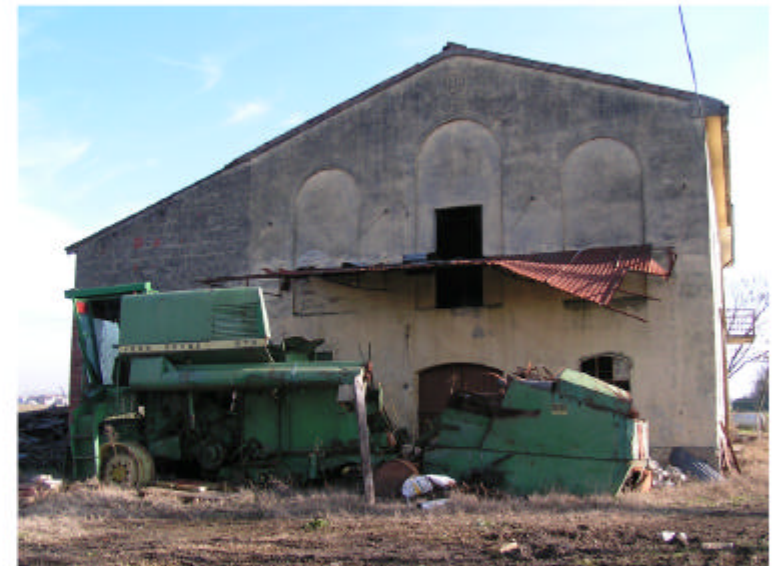
4. Edificio 1. Fronte ovest