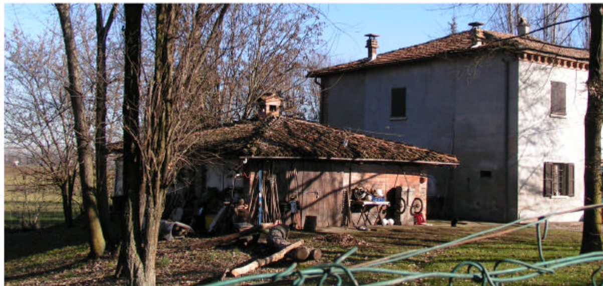
2. Edifici 1 e 2. Fronti ovest e sud