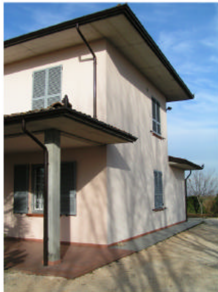
2. Fronte ovest