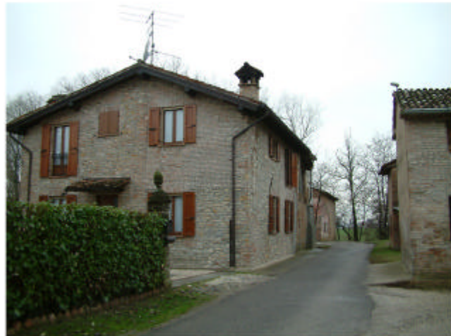
4. Edificio 3c. Fronte nord-est