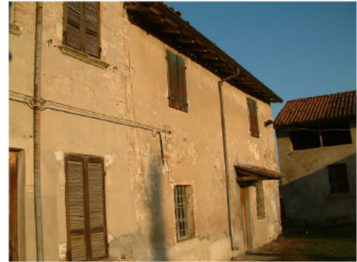
3. Edificio 1b. Fronte sud