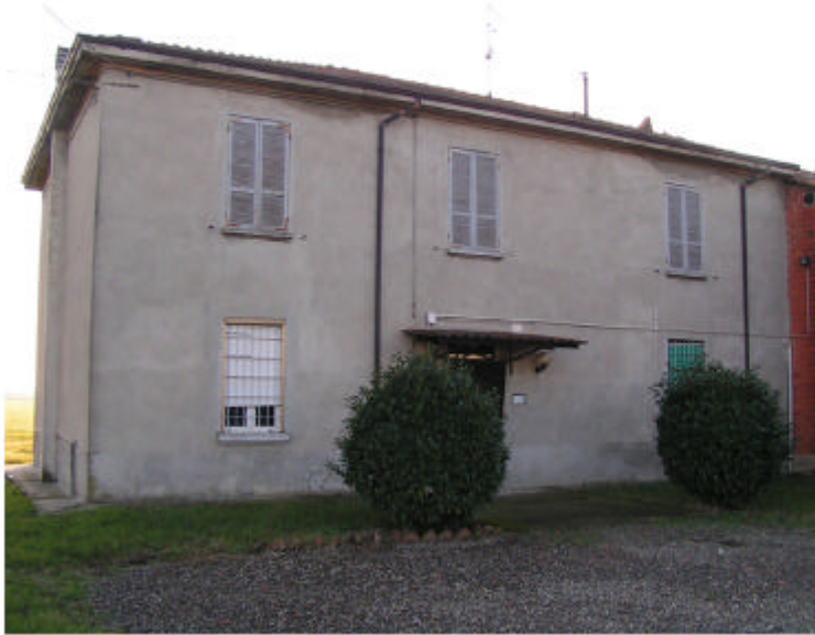
1. Edificio 1a. Fronte nord