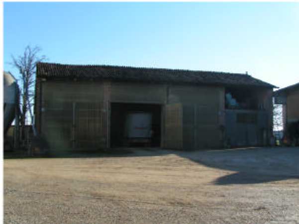
4. Edificio 2. Fronte ovest