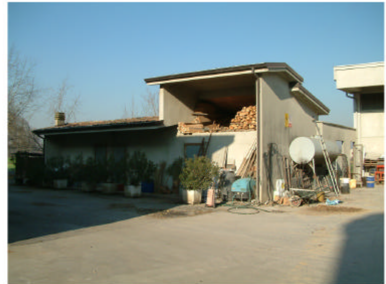
4. Edificio 2. Fronte sud