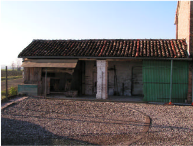
1. Edificio 2, parte 2b. Fronte est.