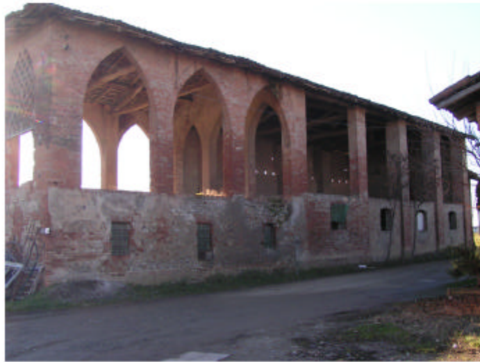
6. Edificio 2. Fronte nord