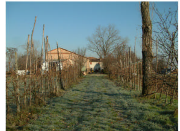
3. Visione da Sud