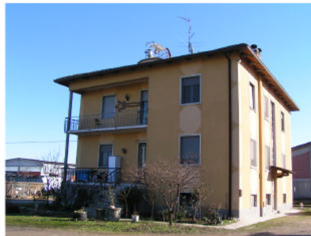
5. Edificio 4. Fronti sud ed est