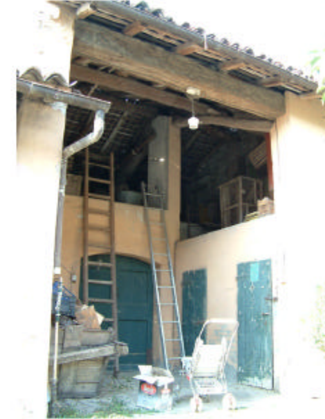
6. Edificio 2, parte 2a.