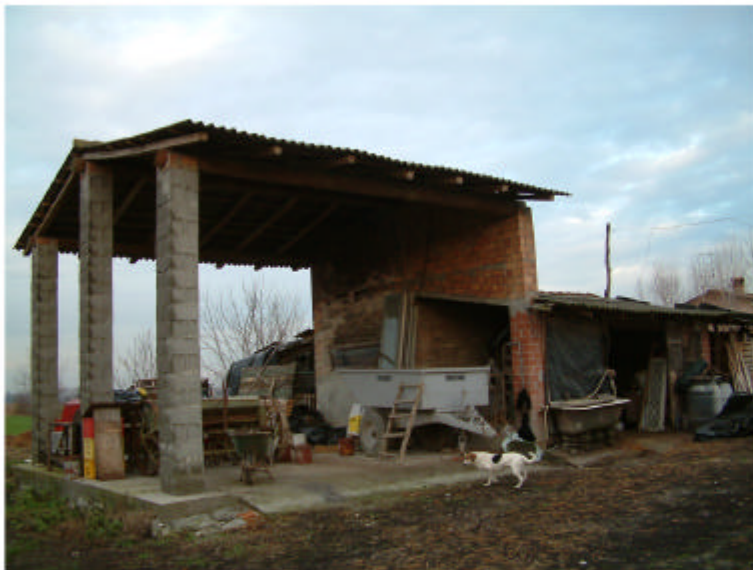
3. Edificio 2. Fronti ovest e sud