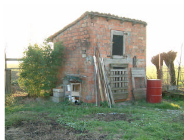
5. Edificio 3. Fronti est e nord