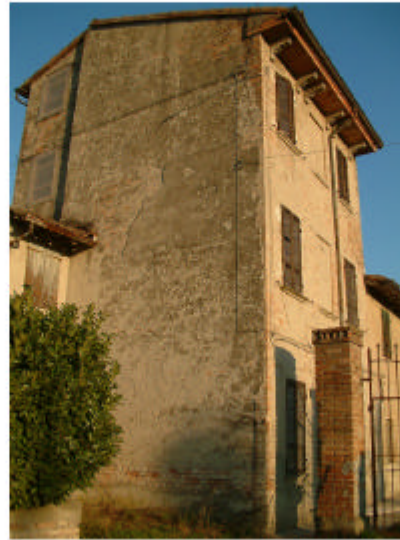
2. Edificio 1a. Fronti ovest e sud