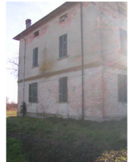
3. Fronte nord