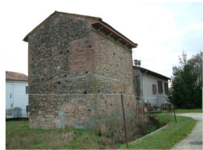
3. Edificio 2. Fronti est e nord