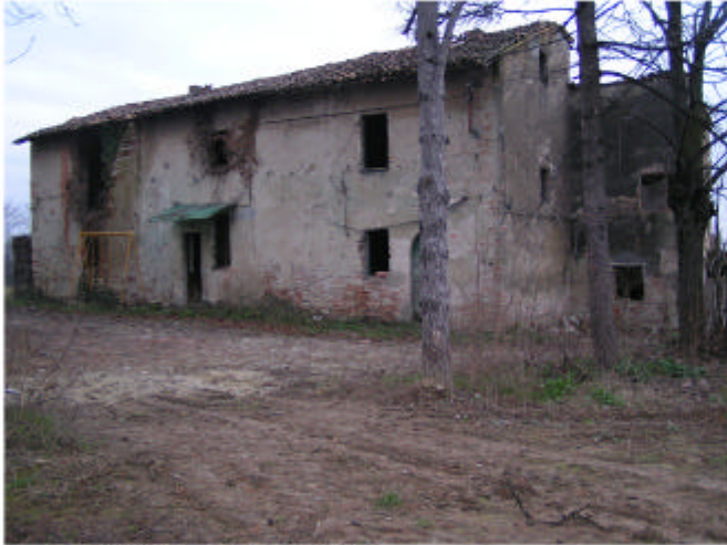
1. Edificio 1. Fronte est.