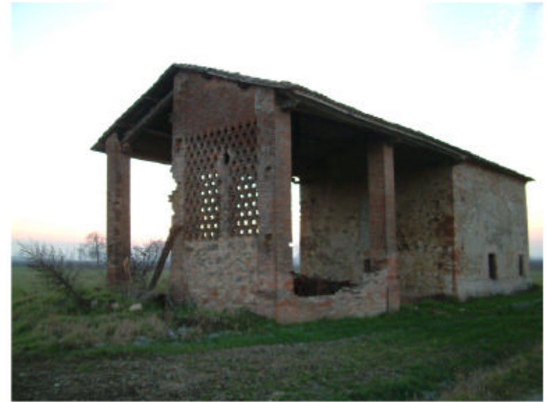
2. Edificio 1. Fronti est e nord