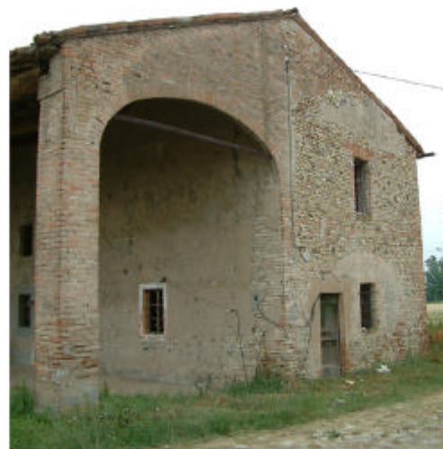
11. Edifici 3, parte 3a. Fronte sud