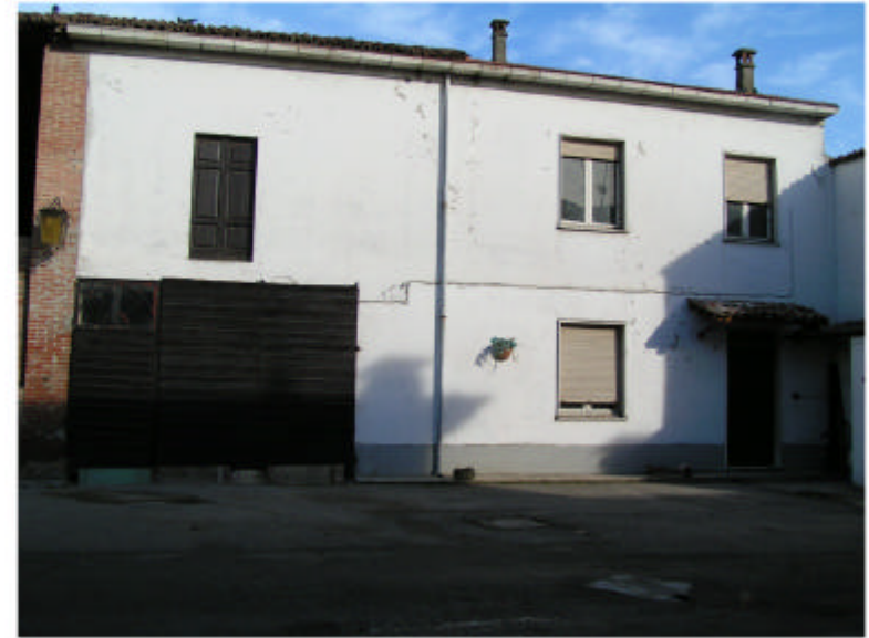
2. Edificio 1, parti 1b, 1c. Fronte sud