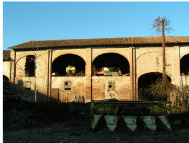
8. Edificio 3c-3d. Fronte est