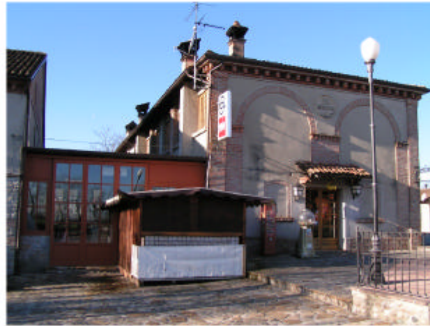
2. Edifici 1b-1c. Fronte nord-est