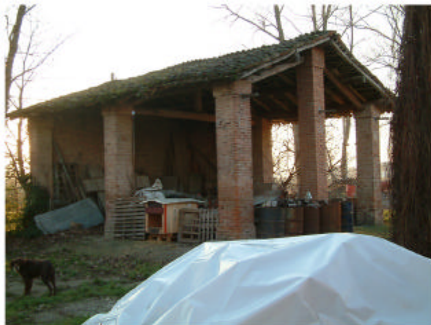
4. Edificio 2. Fronti est e nord