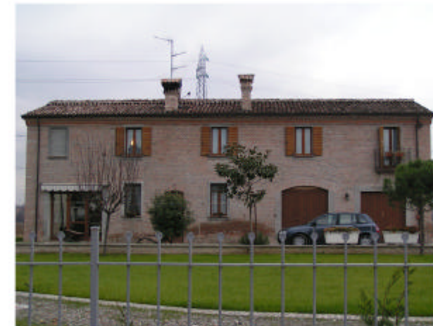
5. Edificio 5. Fronte ovest