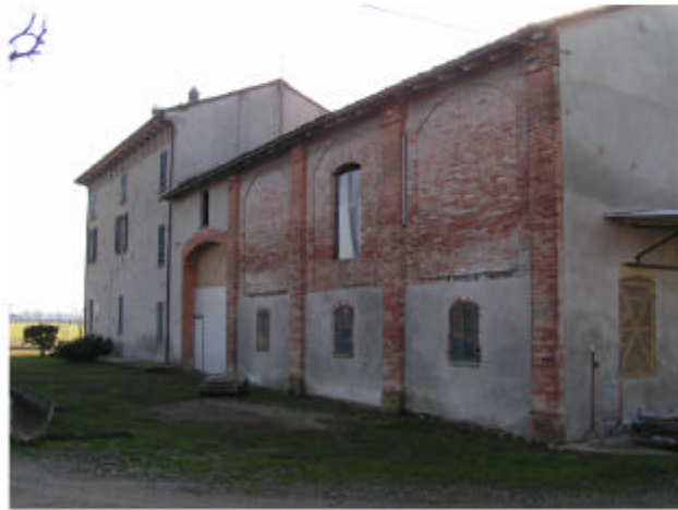
1. Edificio 1. Fronte nord-est