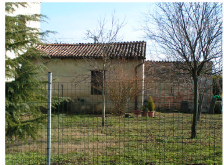
4. Edificio 1c. Fronte ovest