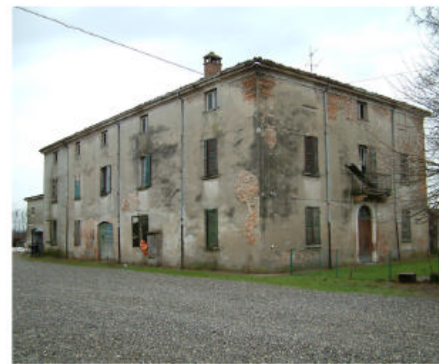
11. Edificio 1, parte 1a. Fronti nord e ovest.