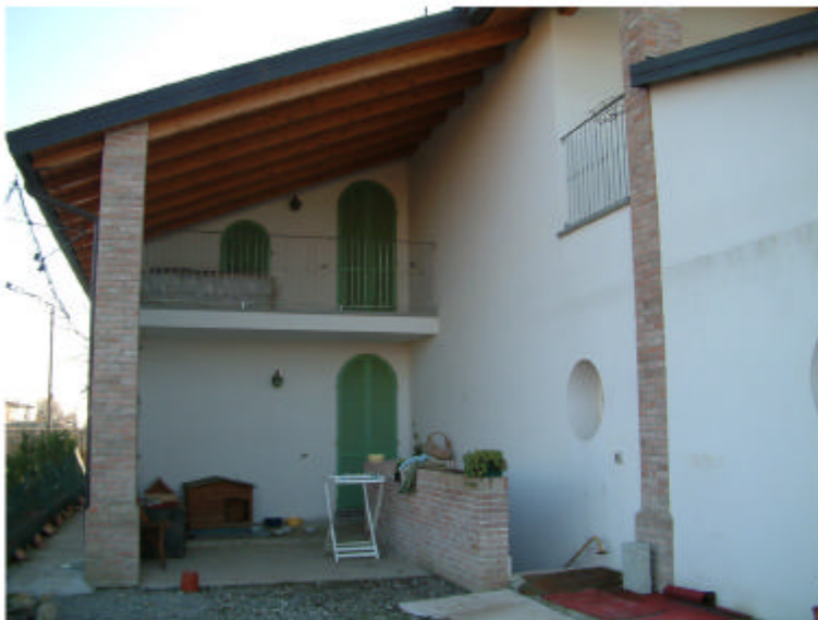
3. Edificio 1c. Fronte ovest