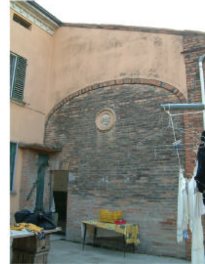
3. Edificio 1, parte 1b. Fronte est.