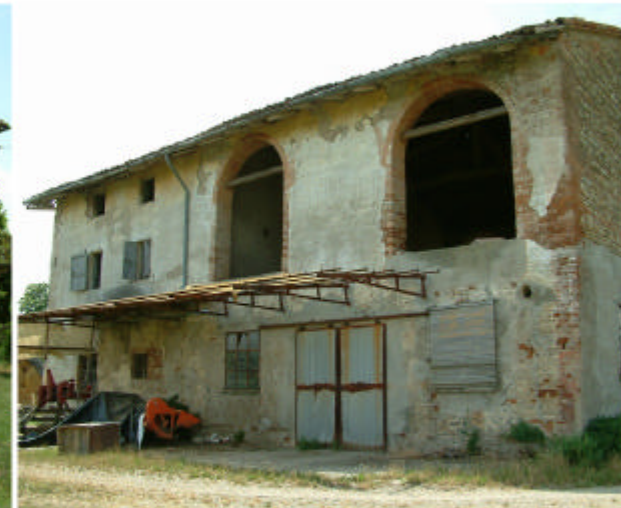
6. Edificio 1, parti 1c e 1d. Fronte nord