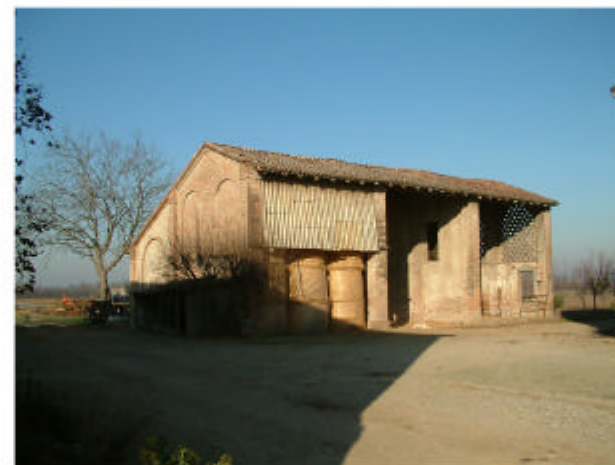
5. Edificio 3. Fronte sud-est