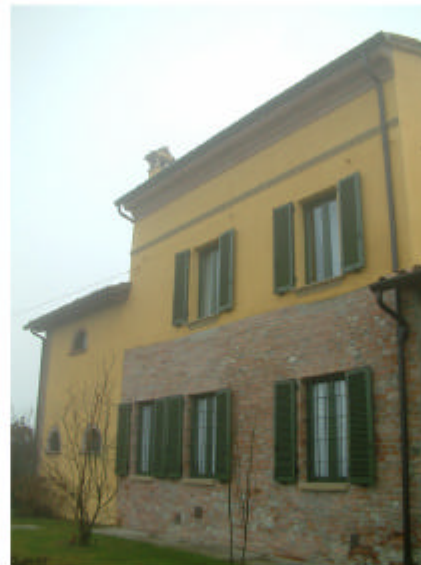
5. Edificio 1c. Fronte nord