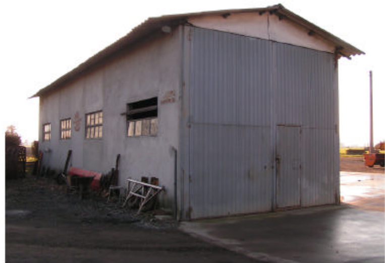
3. Edificio 3. Fronte ovest