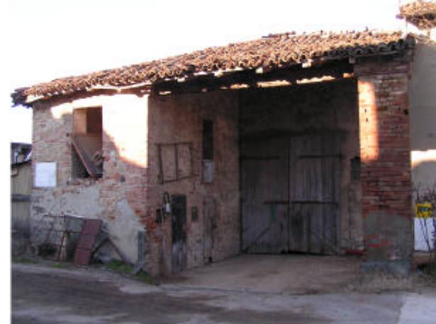
5. Edificio 4a. Fronte sud