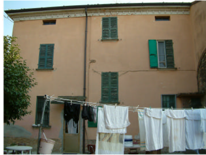
2. Edificio 1, parte 1a. Fronte nord.