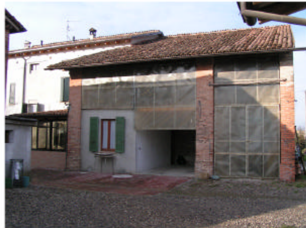
4. Edificio 1c. Fronte est