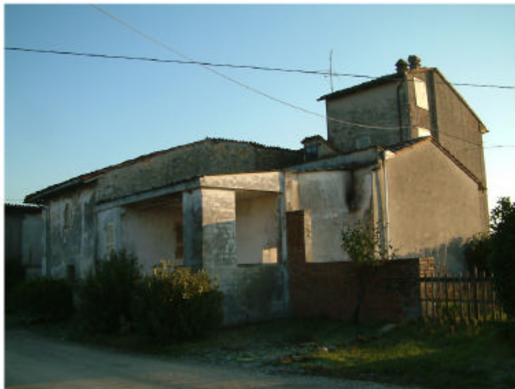
4. Edificio 1d-1e. Fronti nord e ovest