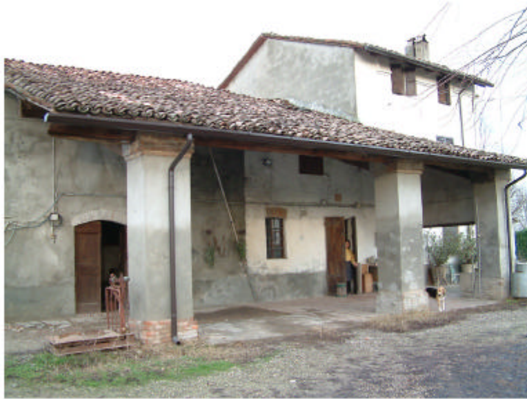
1. Edificio 1. Fronte sud