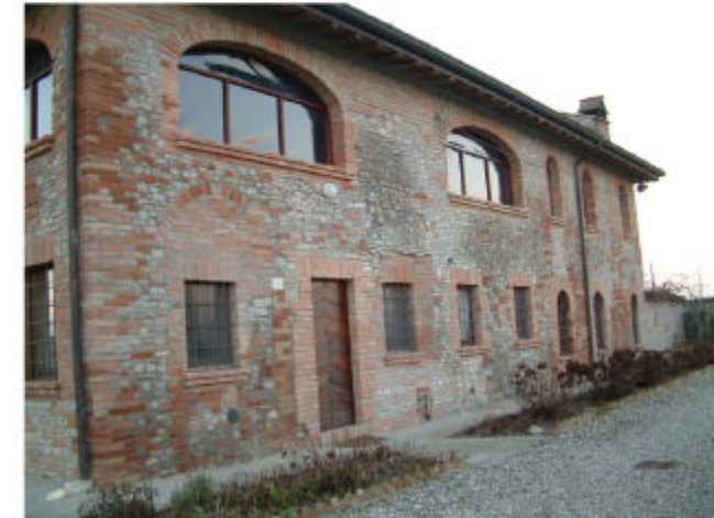
3. Edificio 1b-1c. Fronte nord