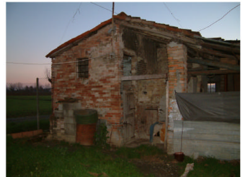
4. Edificio 2. Fronte nord