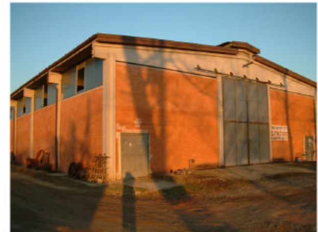
6. Edificio 4. Fronti ovest e sud