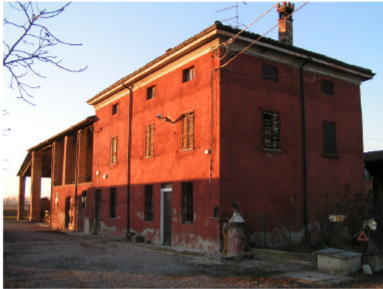
1. Edificio 1. Fronte sud