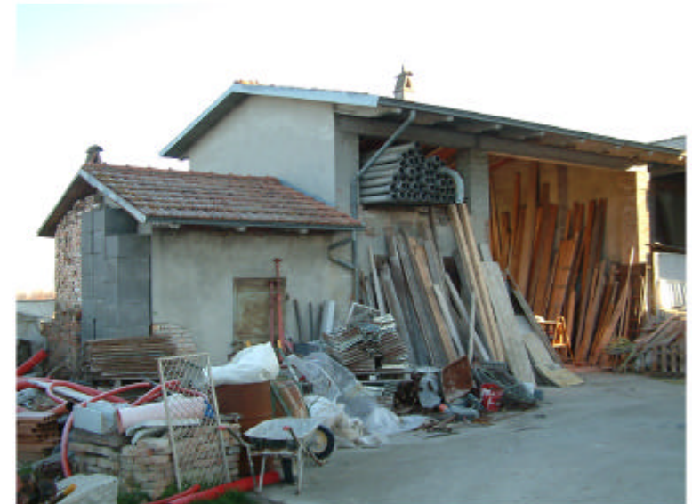
4. Edificio 3. Fronte sud