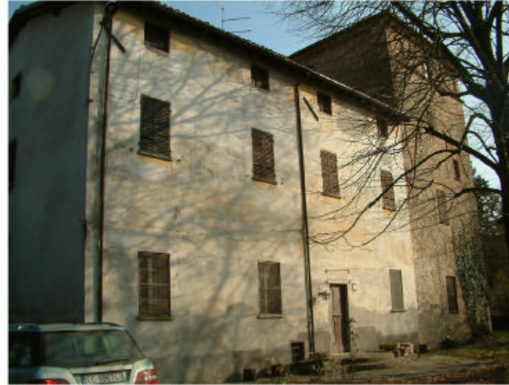
8. Edificio 4, parti 4a e 4b. Fronte ovest.