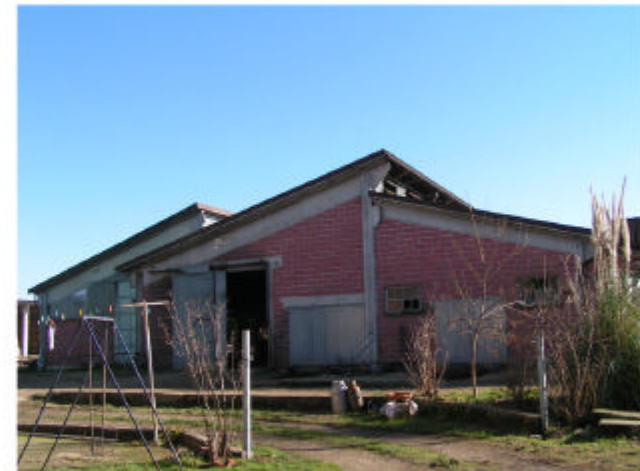
6. Edificio 5. Fronte ovest