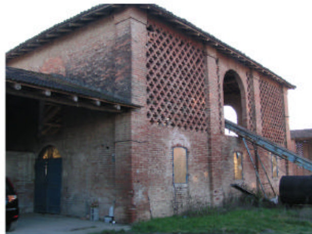
4. Edificio 3. Fronte nord