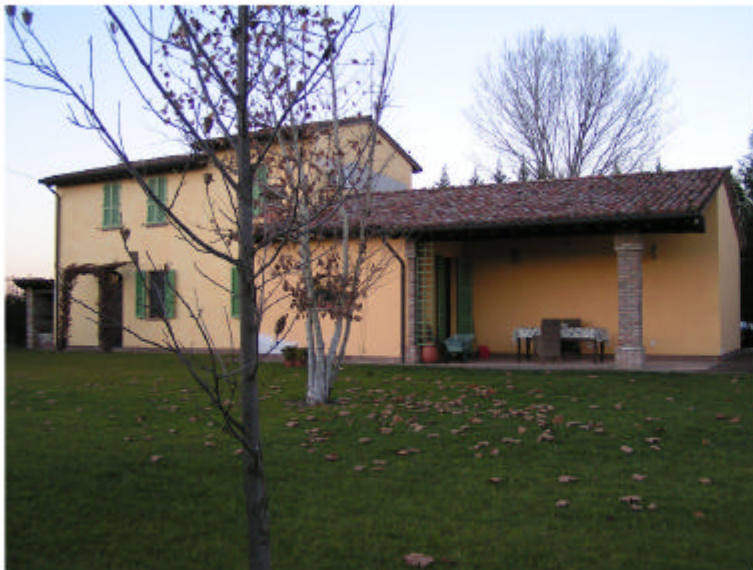
3. Edificio 1. Fronte sud