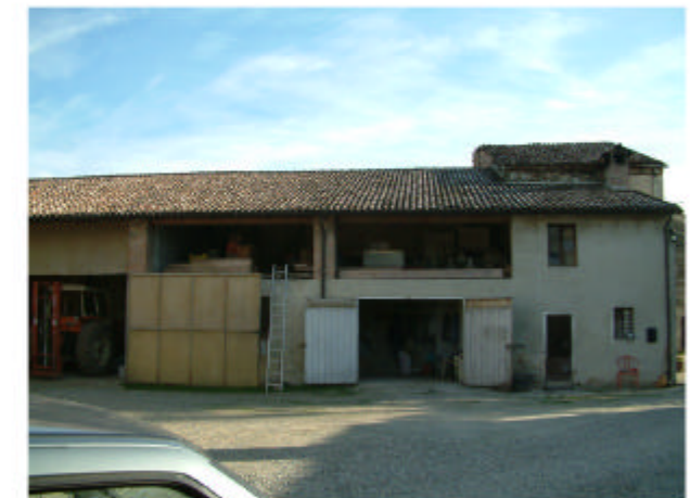
6. Edificio 2, parti 2c, 2d. Fronte ovest