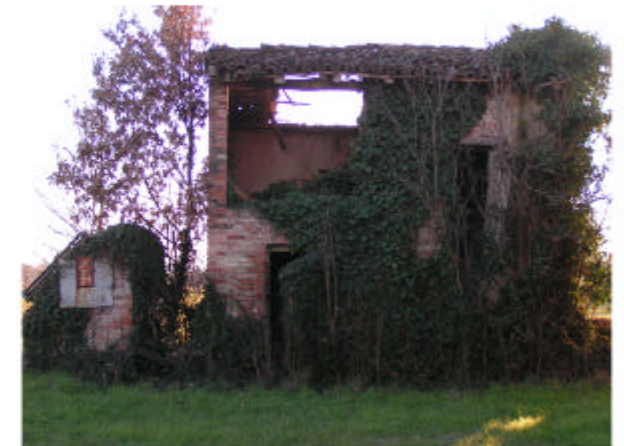
6. Edificio 2. Fronte nord