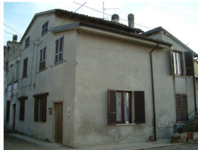
10. Edificio 2, parti 2g, e, 2h. Fronti nord e ovest.