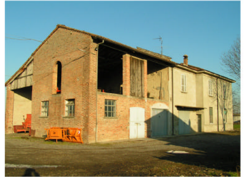
2. Edificio 1. Fronti ovest e sud