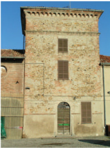
4. Edificio 1, parte 1a. Fronte sud.