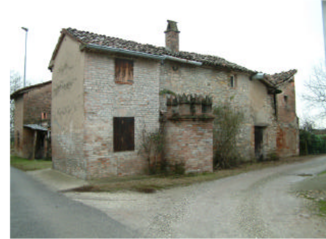
15. Edificio 11. Fronte est