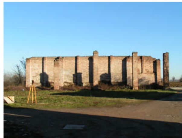
10. Edificio 4. Fronte ovest