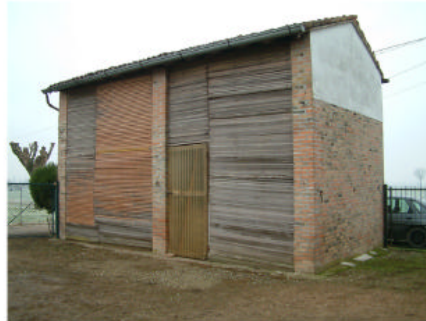
5. Edificio 2. Fronti est e nord