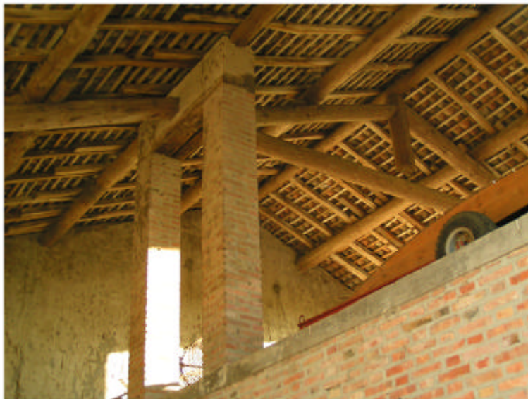
3. Edificio 1, parte 1b. Sistema di copertura