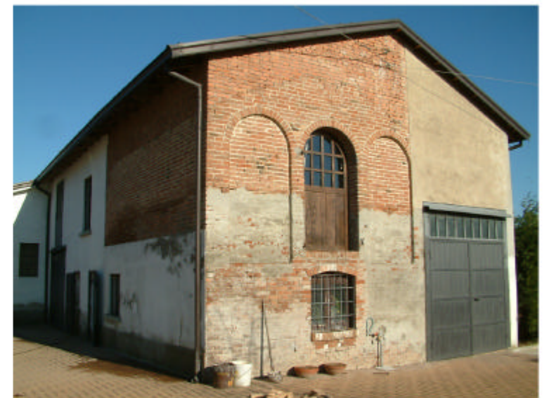
4. Edificio 2c. Fronte sud-ovest