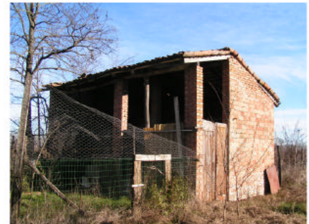
12. Edificio 7. Fronti ovest e sud