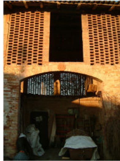
2. Edificio 1b. Fronte sud