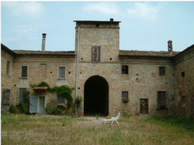
11. Edificio 1, partl 1b, 1g e 1a. Fronte sud