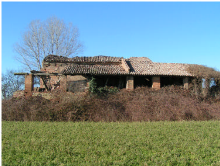
3. Edificio 1. Fronte est