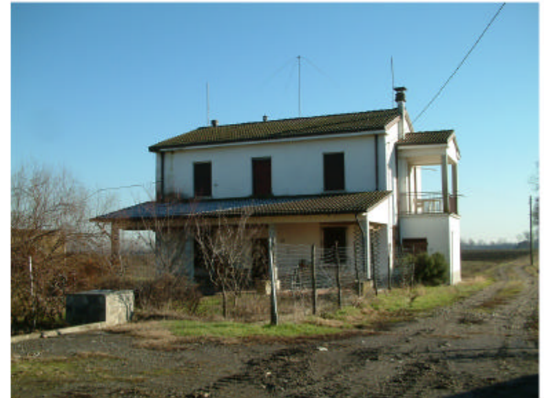
2. Edificio 2. Fronte ovest