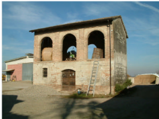
10. Edificio 4. Fronte sud