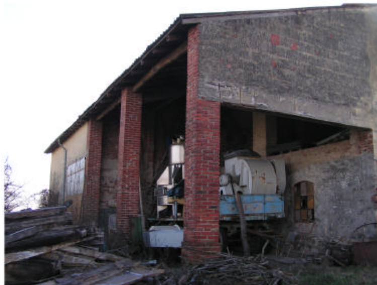
3. Edificio 1. Fronte nord