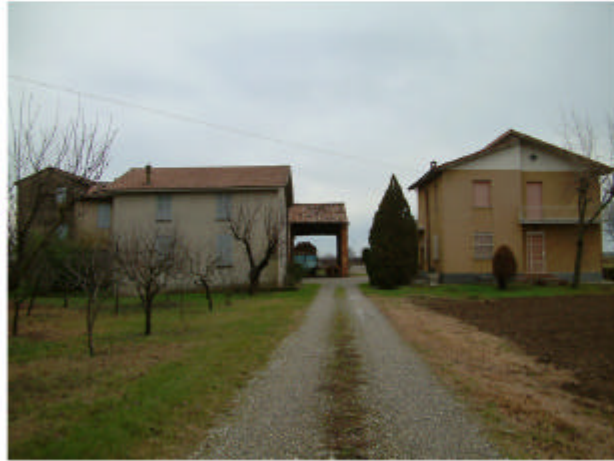
1. Accesso da ovest