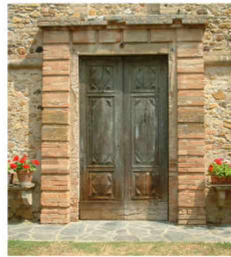
6. Edificio 1, parte 1h. Ingresso.