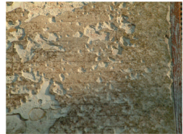
3. Edificio 1. Trattamento intonaco della torre