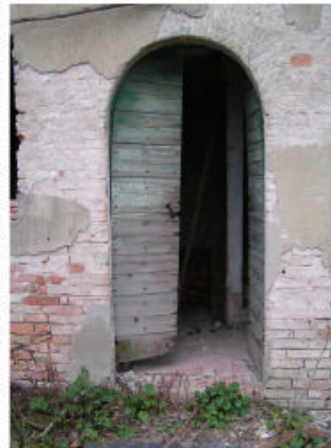
6. Edificio 1, parte 1a. Ingresso.