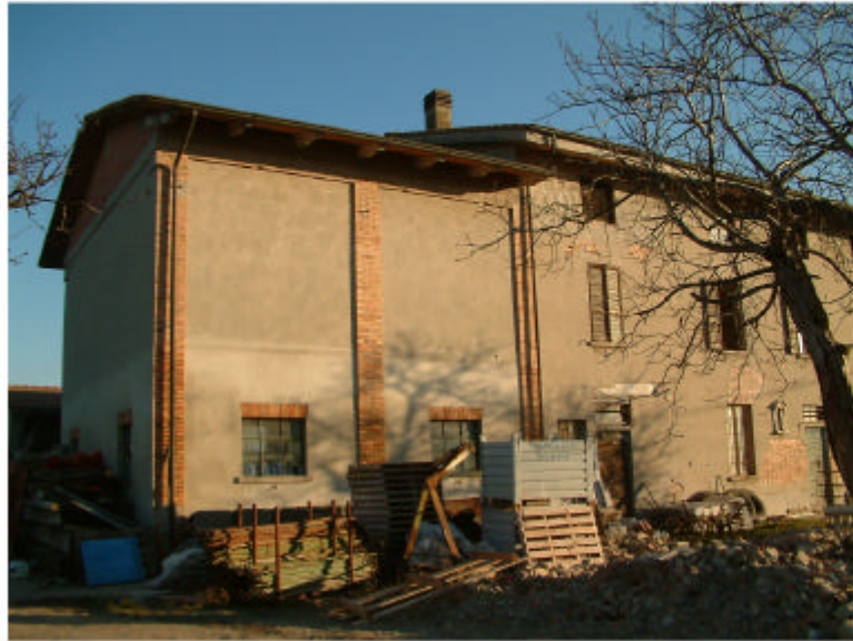
1. Edificio 1b-1c. Fronte sud