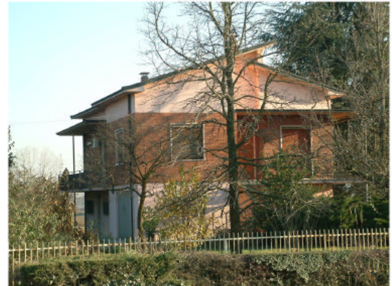
4. Edificio 3. Fronte ovest