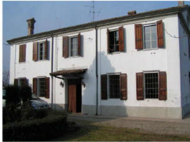
1. Edificio 1. Fronte sud