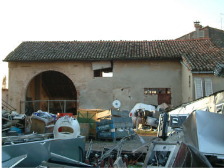
6. Edificio 2a e 2b. Fronte est