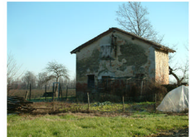
6. Edificio 3. Fronte ovest