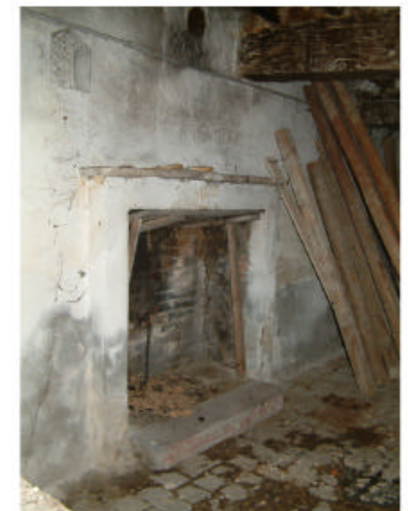
5. Edificio 1a. Interno