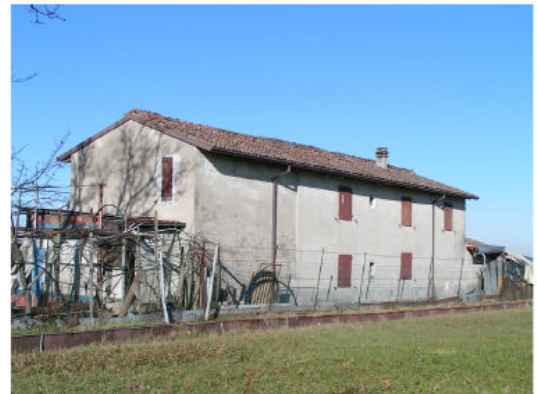
4. Fronte sud-est