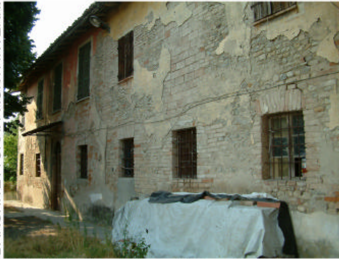
2. Edificio 1, parti 1c e 1d. Fronte sud.