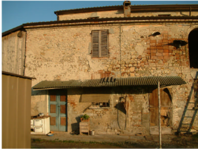
1. Edificio 1a. Fronte ovest