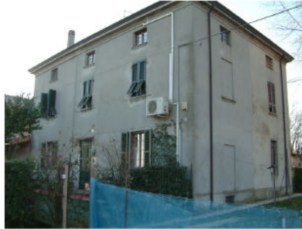
2. Edificio 1. Fronte nord-est