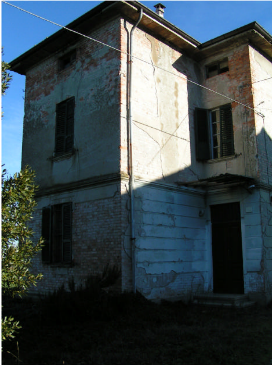
1. Fronte ovest