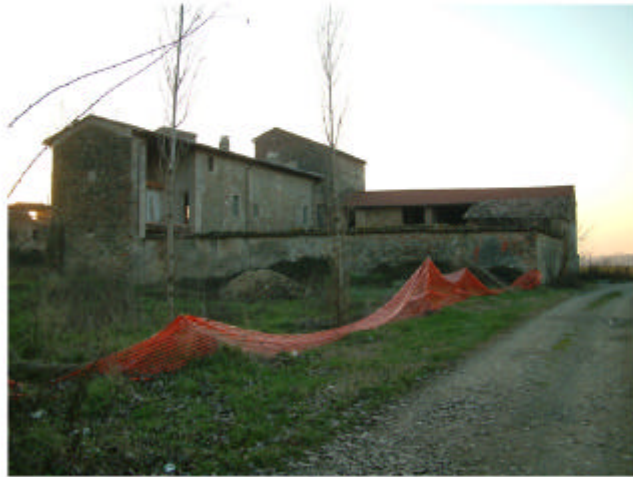
1. Vista del complesso da Est