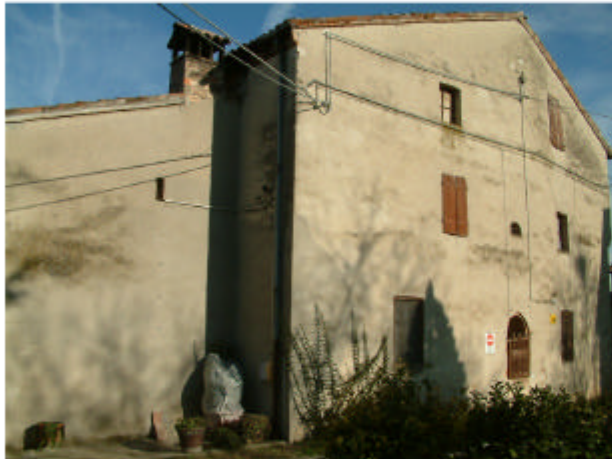
4. Edificio 2, parte 2a. Fronte sud