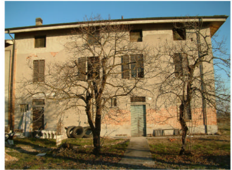
2. Edificio 1a. Fronte sud