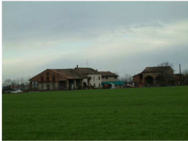
1. Vista del complesso da Ovest