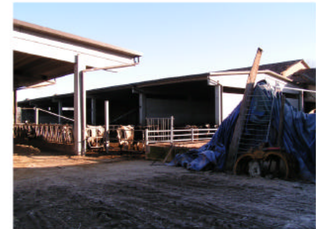
12. Edificio 4. Fronte nord