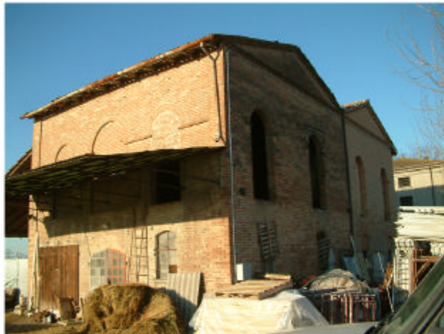
4. Edificio 2a. Fronti sud-est e nord-est