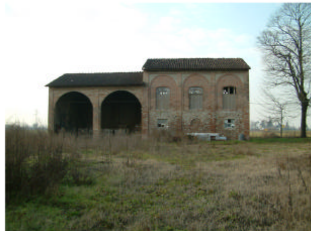
4. Edificio 2. Fronte est