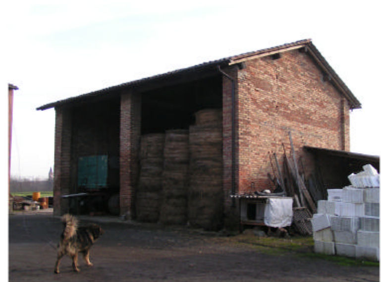
4. Edificio 3. Fronti nord e ovest