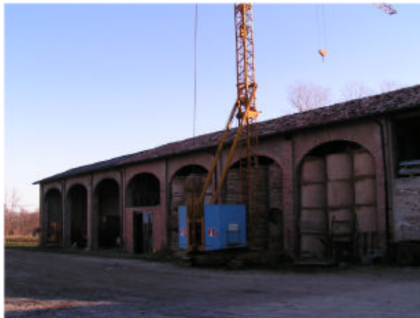
5. Edificio 2c. Fronte ovest