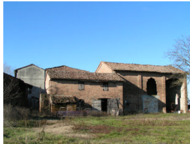
11. Edificio 6. Fronte est