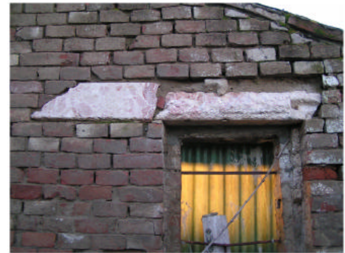
6. Edificio 2. Lastre marmo