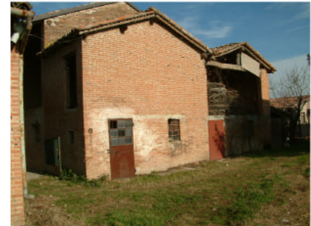
12. Edificio 5c-5d-5e. Fronte sud