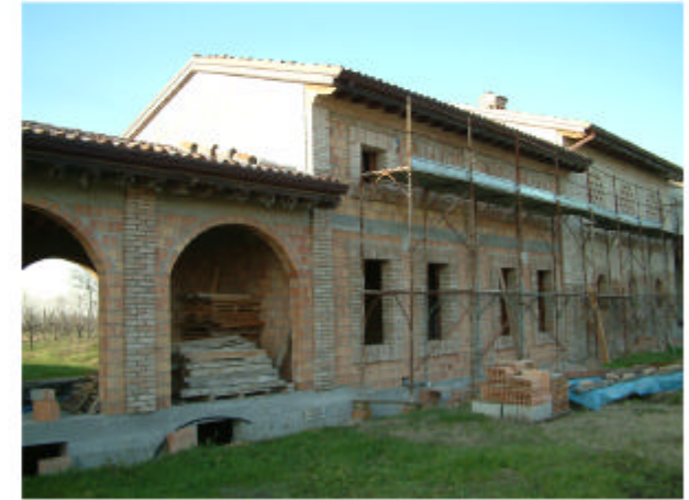
3. Edificio 2. Fronte est