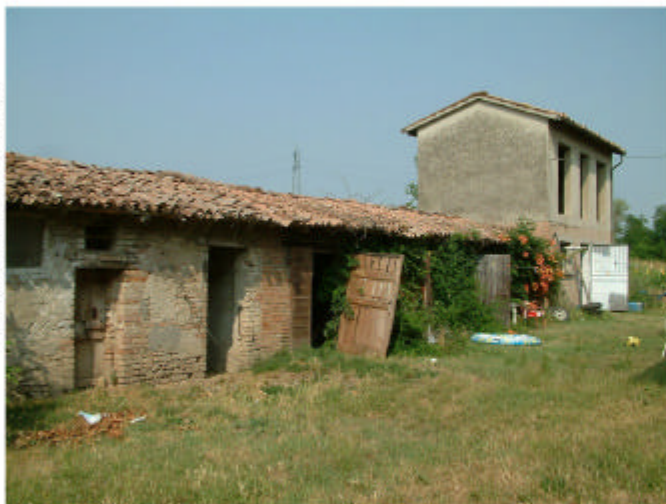
4. Edificio 2. Fronte sud.