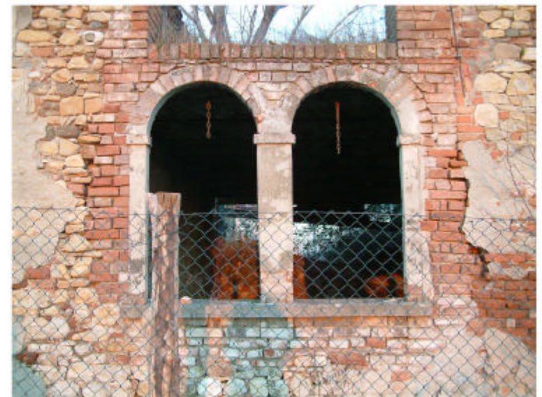
4. Edificio 1a. Bifora