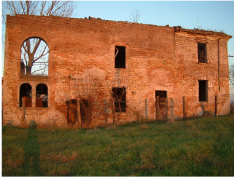
1. Edificio 1. Fronte sud-ovest