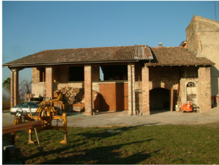
1. Edificio 1, parti 1a, 1b. Fronte sud