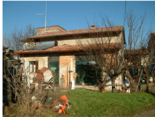
2. Edificio 2. Fronte sud