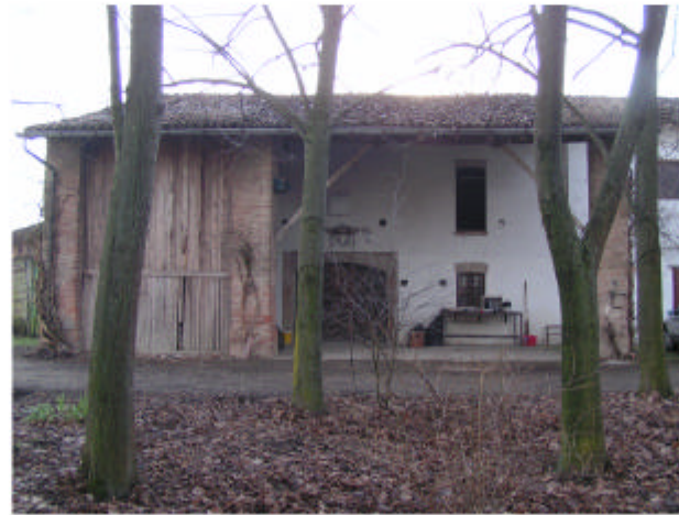
2. Edificio 1b. Fronte sud-est