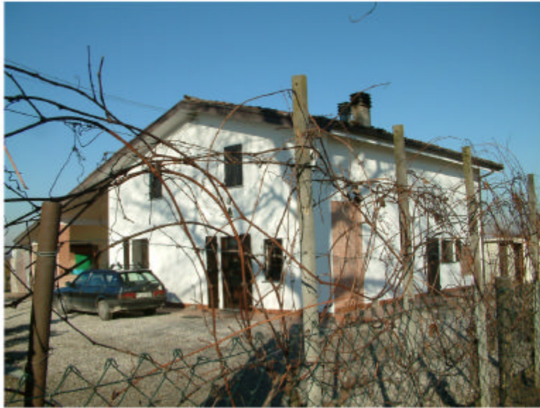
1. Edificio 1. Fronte sud-est