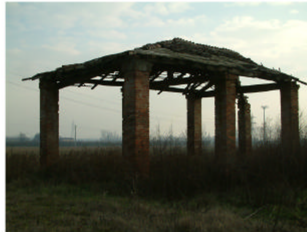
5. Edificio 3