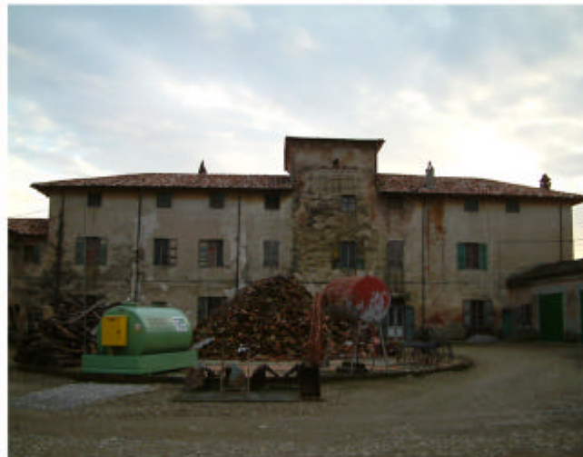
5. Edificio 1a. Fronte nord