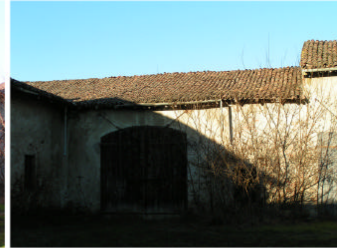
9. Edificio 1e. Fronte nord