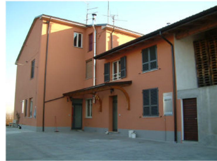
3. Edificio 1, parte 1d. Fronte nord