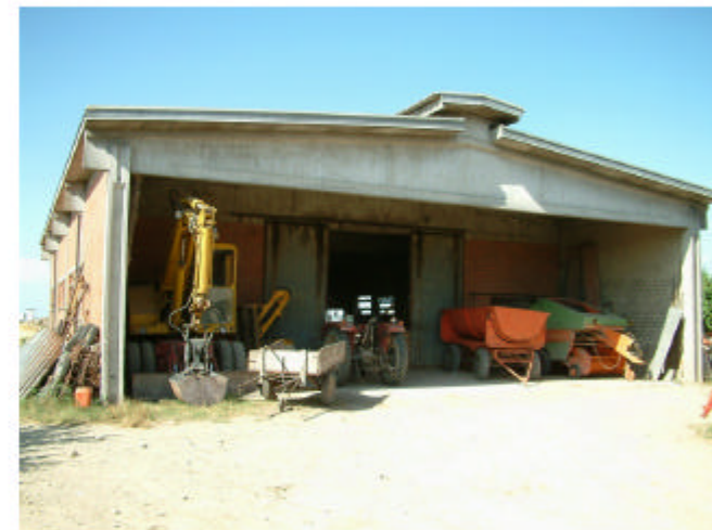
6. Edificio 3. Fronte sud