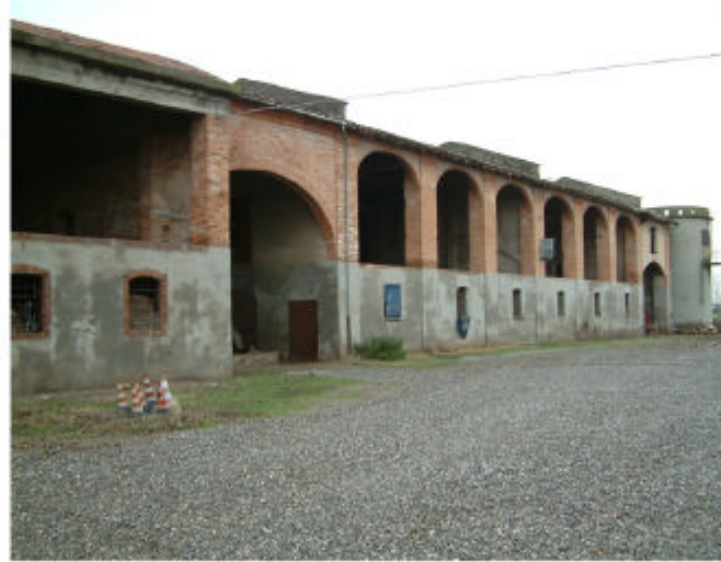
8. Edificio 2, parti 2a, 2b e 2c. Fronte sud.