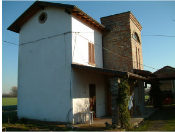
1. Edificio 1. Fronte sud-ovest