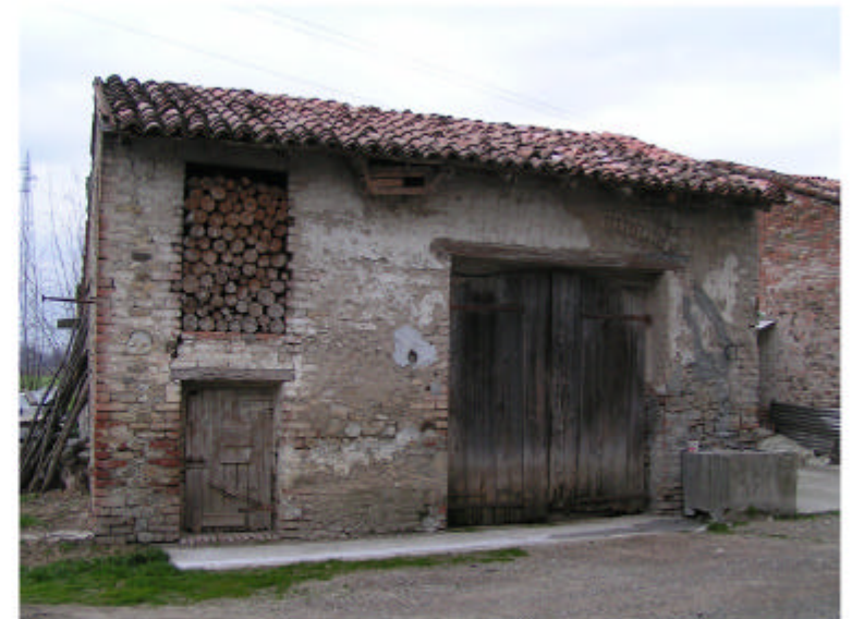
4. Edificio 3. Fronte est