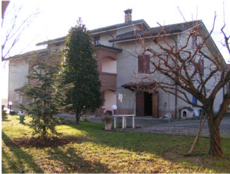
1. Edificio 1. Fronte est