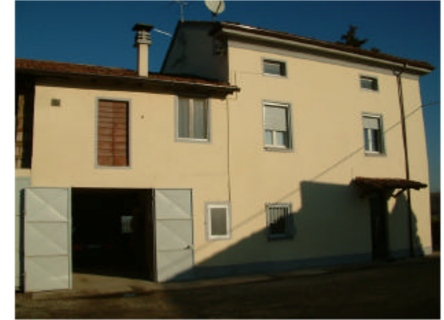
3. Edificio 1d-1e. Fronte sud