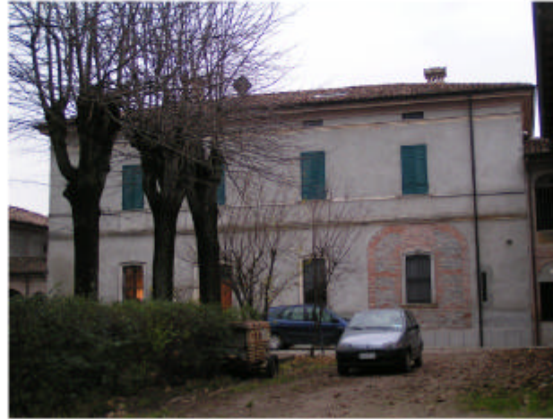
8. Edificio 6c. Fronte nord