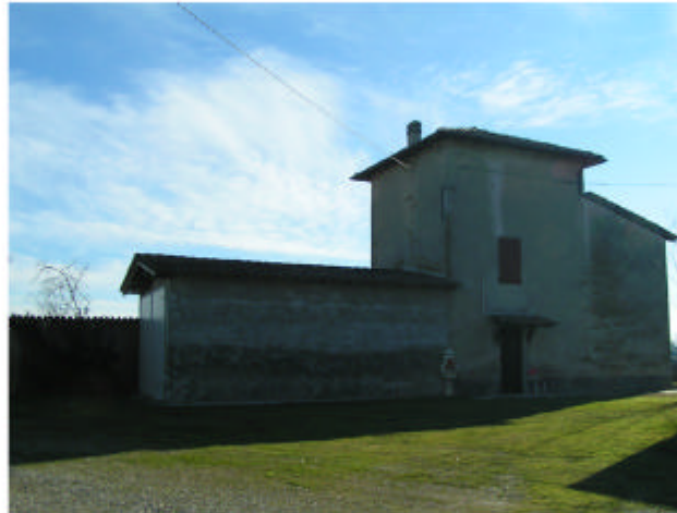
5. Edificio 3. Fronte ovest