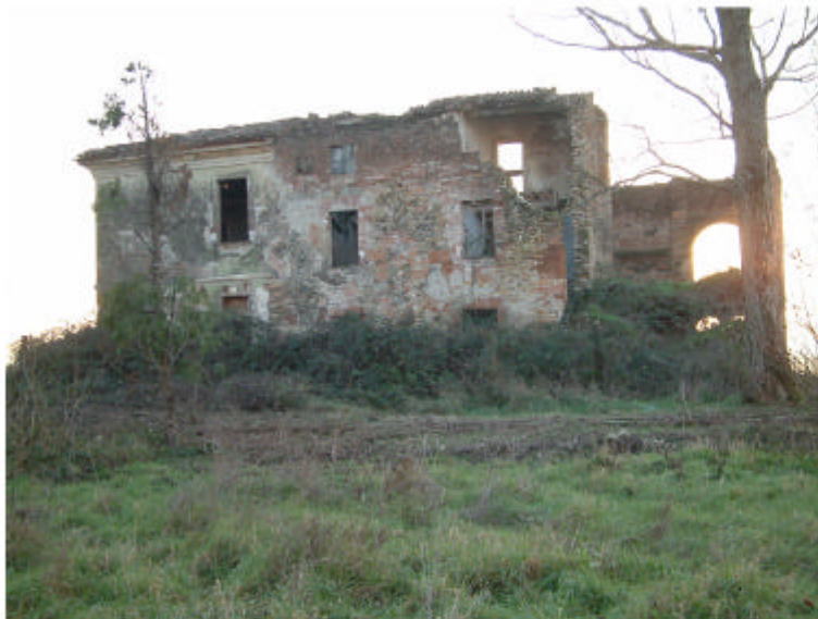
3. Edificio 1. Fronte nord-est