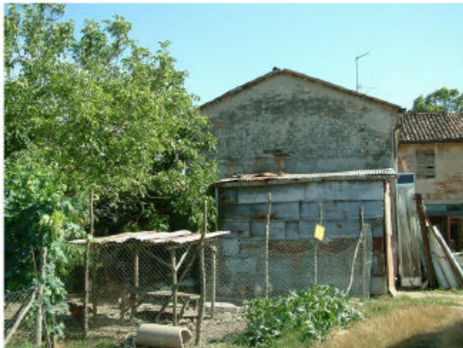
4. Edificio 1, parte 1f. Fronte nord