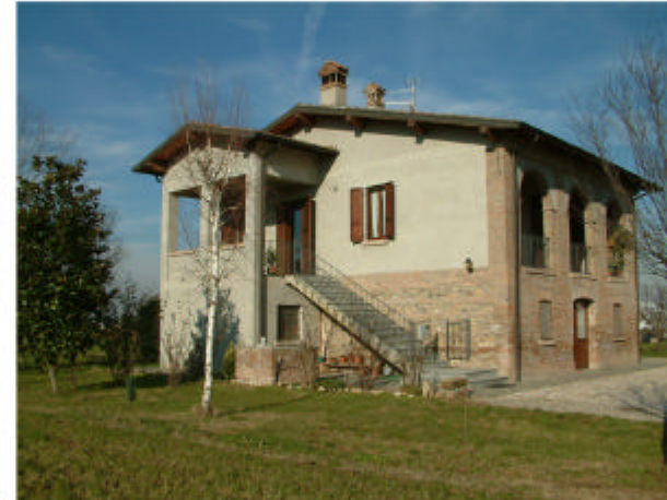
17. Edificio 10. Fronti sud ed est