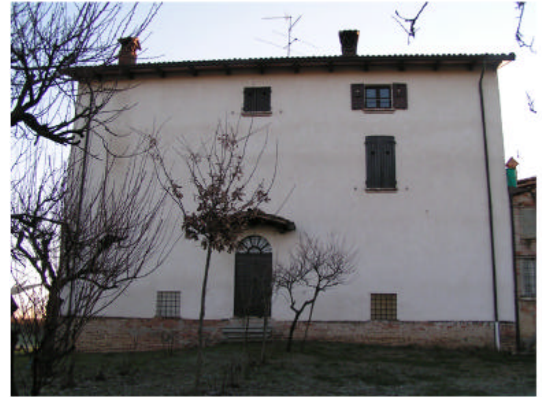
8. Edificio 1a. Fronte ovest