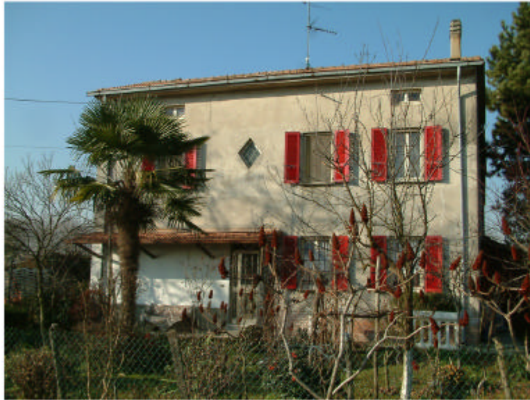
1. Edificio 1, parte 1a. Fronte est