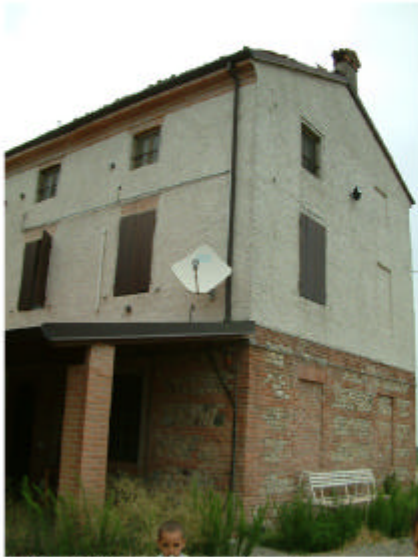
7. Edificio 1, parte 1a. Fronti sud ed est.