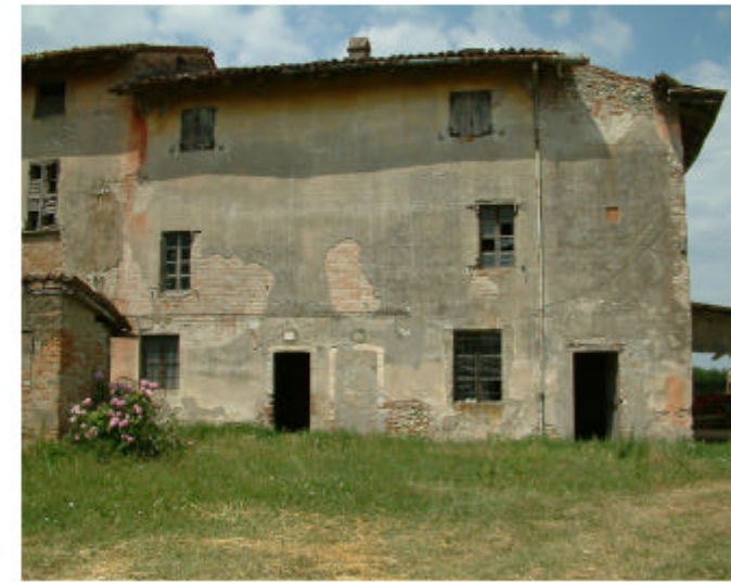
3. Edificio 1, parte 1c. Fronte est.