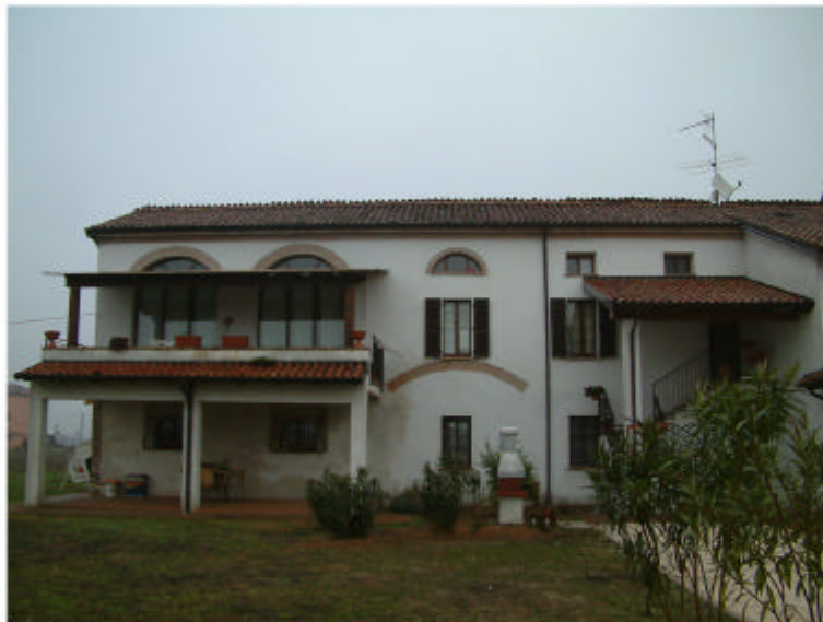
3. Edificio 1. Fronte sud