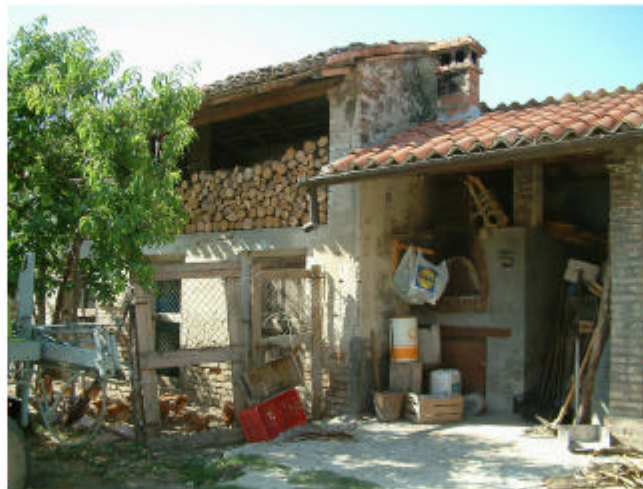
5. Edificio 2. Fronte sud.