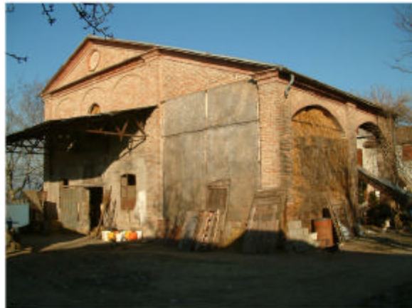
4. Edificio 1a. Fronti sud ed est