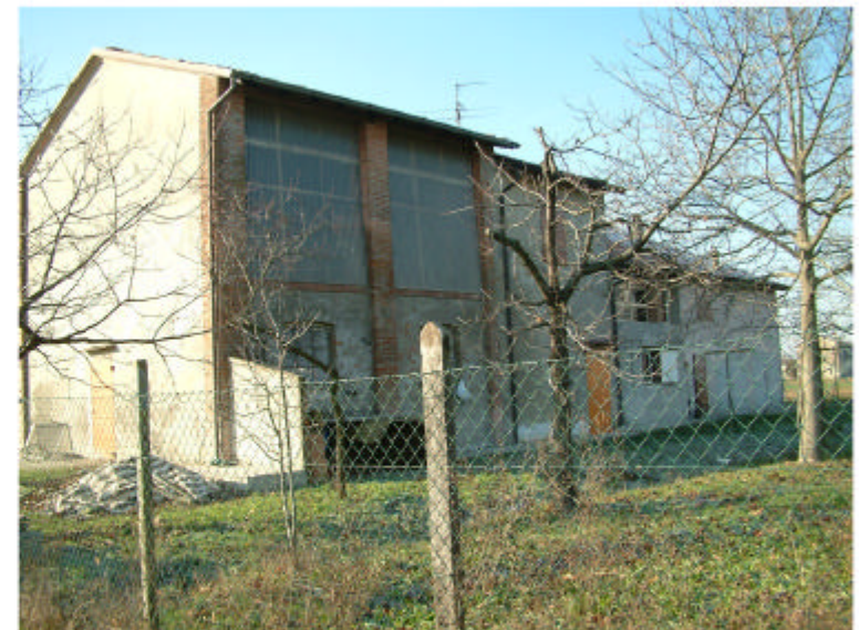
4. Edificio 1. Fronte nord