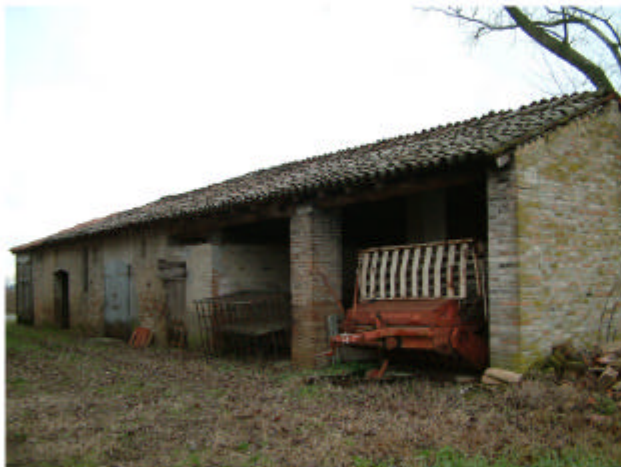
4. Edificio 2. Fronte ovest