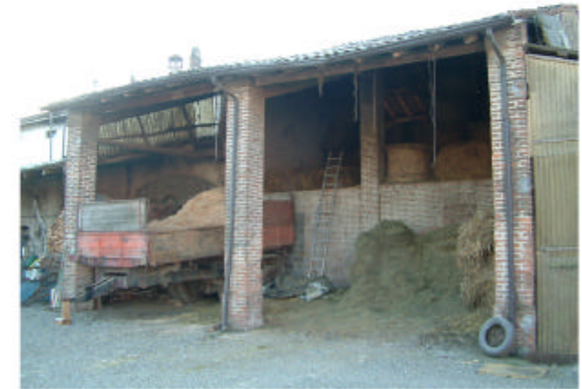
3. Edificio 1a. Fronte nord