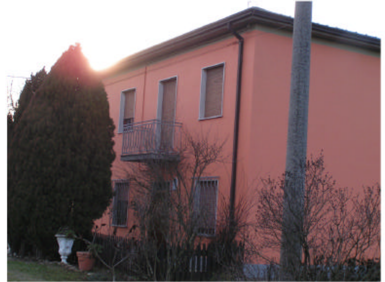
2. Edificio 1. Fronte est