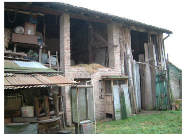
4. Edificio 2. Fronte nord