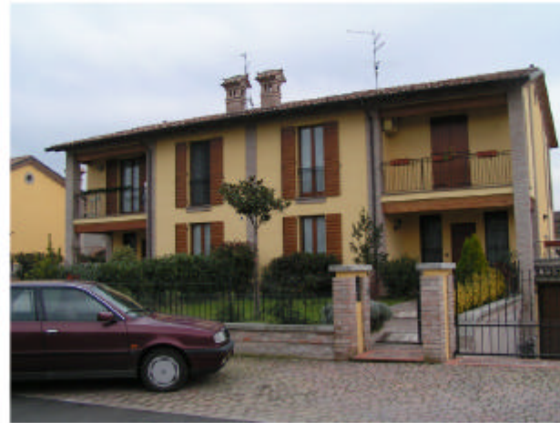
2. Edificio 2. Fronte ovest