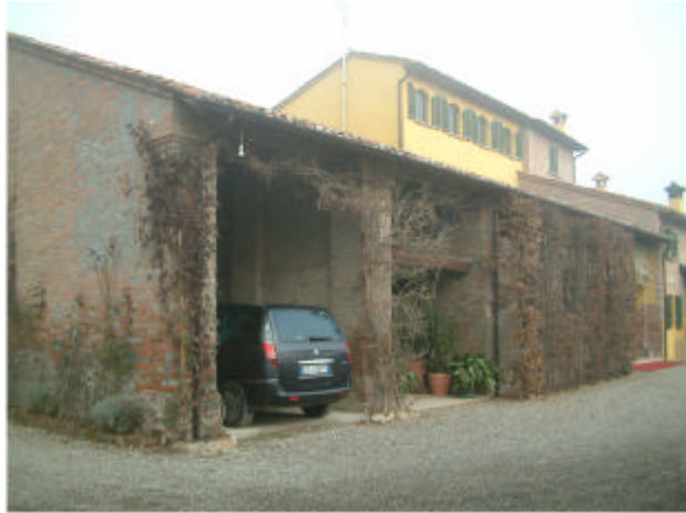
1. Edificio 1a. Fronte sud