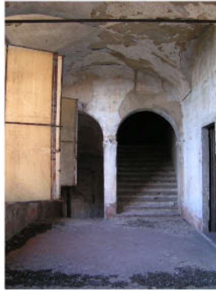
14. Edificio 1a. Loggiato