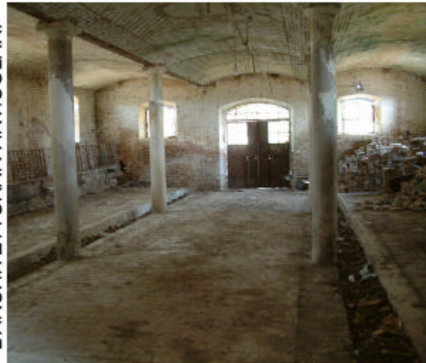
6. Edificio 1, parte 1a. Interno.