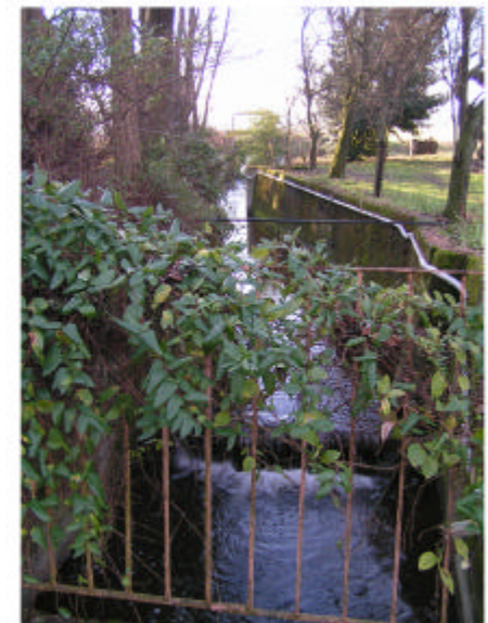
6. Canale della Sforzesca