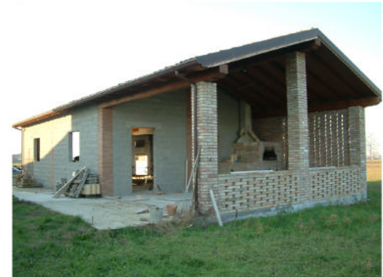
4. Edificio 2. Fronti sud ed est