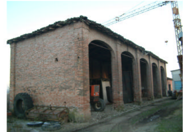
6. Edificio 3. Fronte ovest