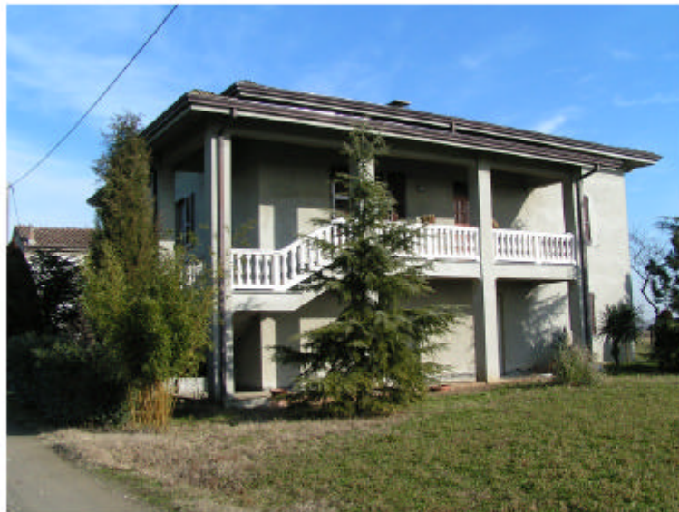
3. Edificio 2. Fronte sud