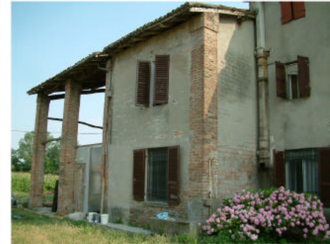
3. Edificio 1, parti 1b e 1c. Fronte nord.