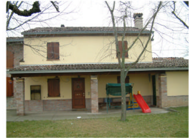
3. Edificio 1b. Fronte sud-ovest