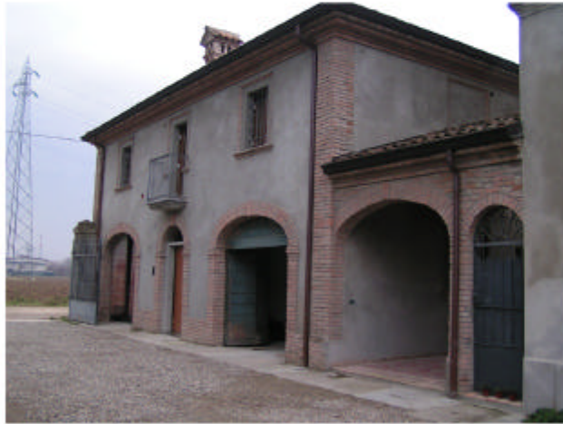
7. Edificio 6a-6b. Fronte nord