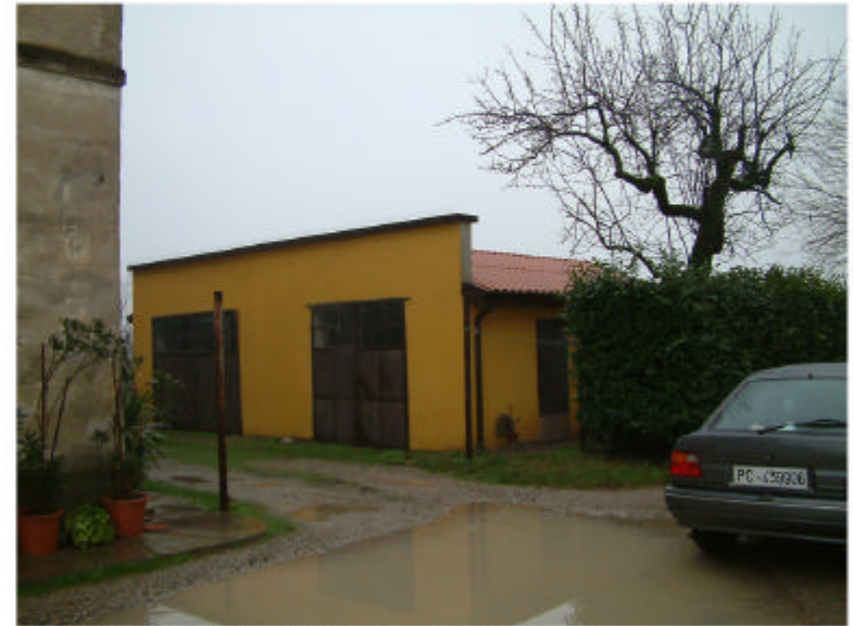
2. Edificio 2. Fronti nord e ovest.