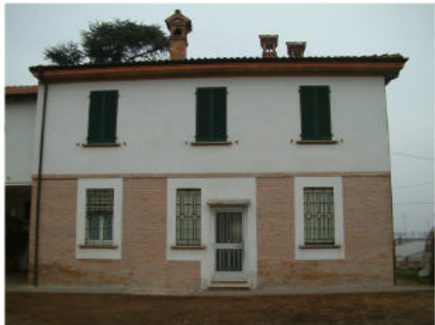
4. Edificio 1c. Fronte sud