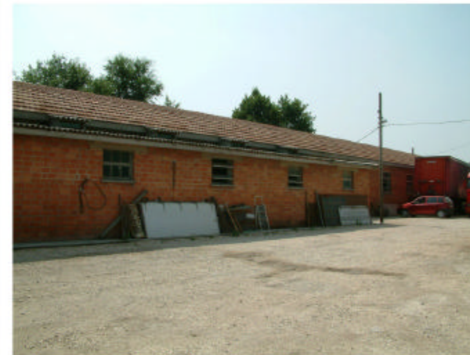
6. Edificio 2. Fronte ovest.