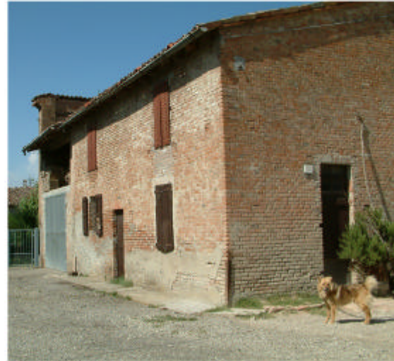
2. Edificio 1, parte 1a. Fronti ovest e sud.