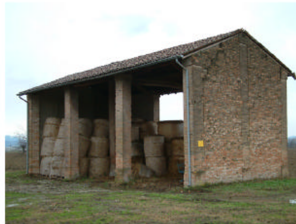
5. Edificio 3. Fronte est