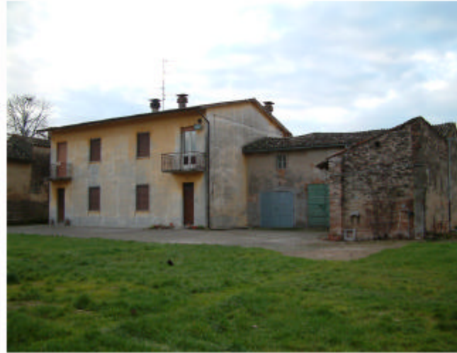
8. Edificio 3. Fronte est