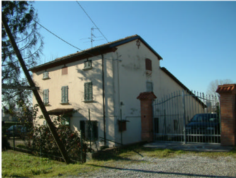
1. Edificio 1. Fronte nord-est