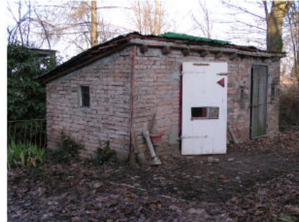
5. Edificio 3. Fronti sud ed est