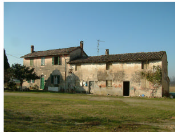
5. Edificio 2. Fronte est