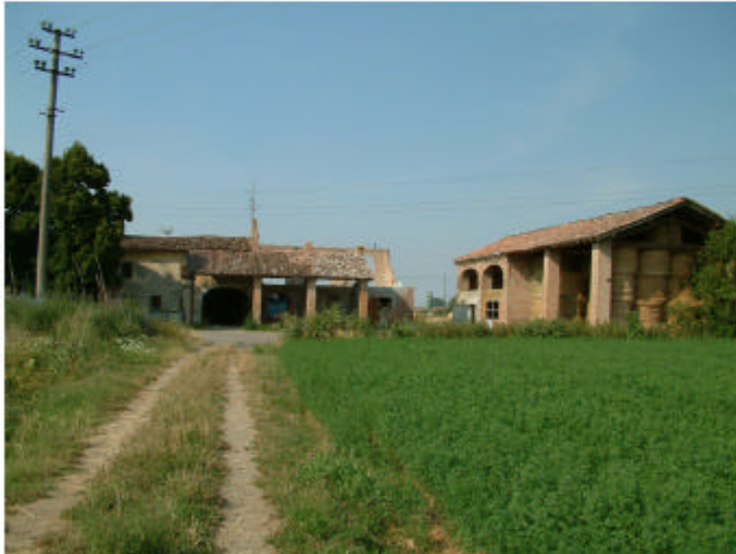
1. Vista del complesso da Sud.