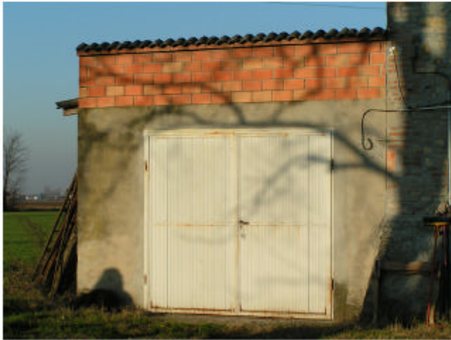
1. Edificio 1d. Fronte sud