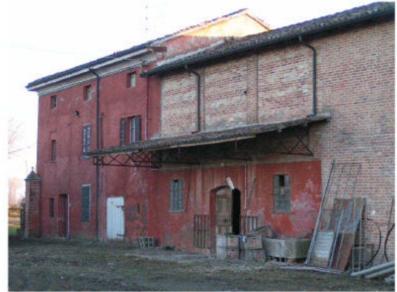
2. Edificio 1. Fronte nord