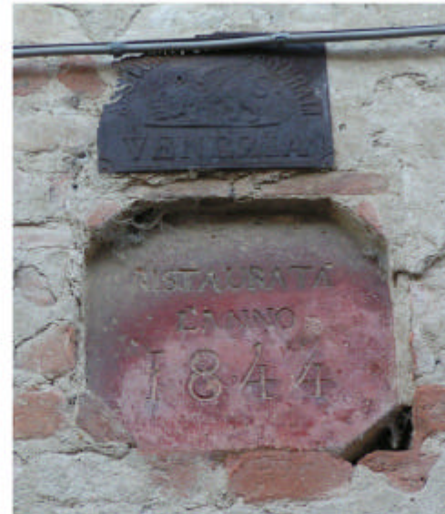
4. Edificio 1. Iscrizione