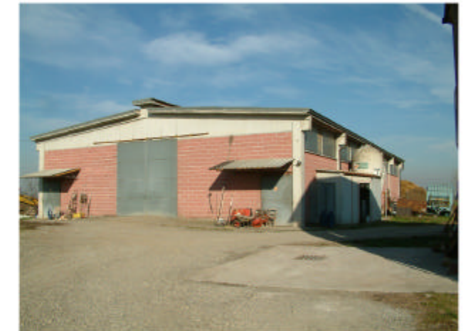
18. Edificio 11. Fronti sud ed est