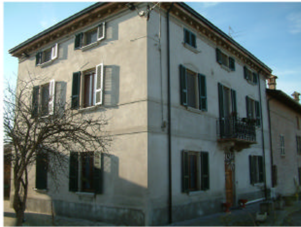
1. Edificio 1a. Fronti nord ed est