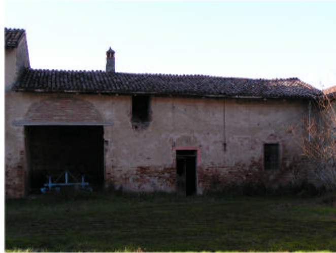
8. Edificio 1f-1g. Fronte est