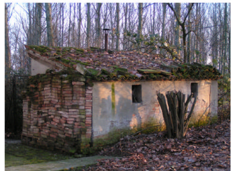
4. Edificio 2. Fronte ovest