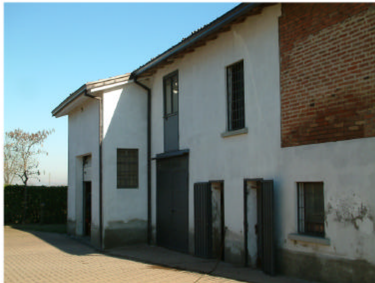
3. Edificio 2a-2b. Fronte ovest