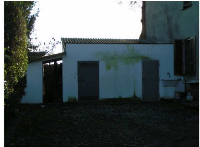
4. Edificio 1b. Fronte nord