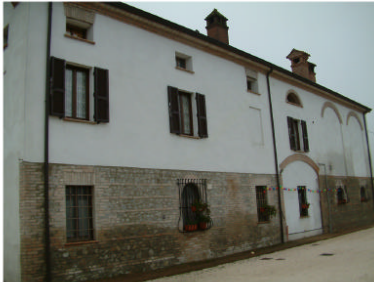
1. Edificio 1. Fronte nord