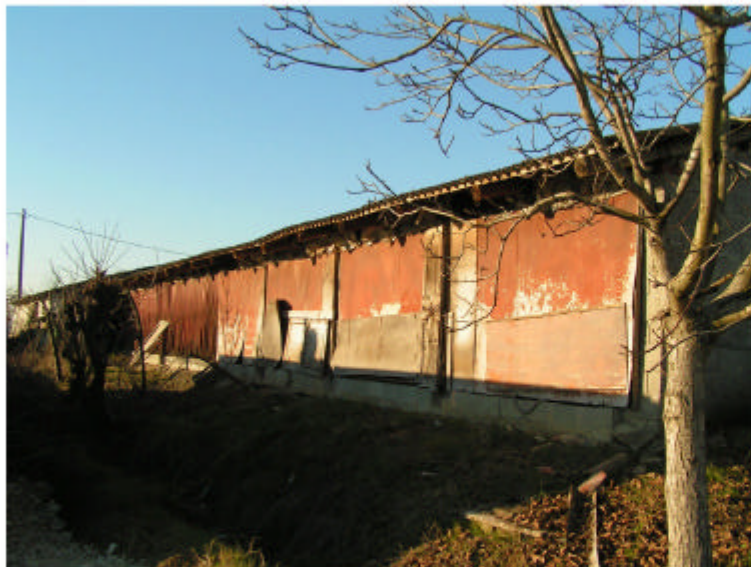
3. Edificio 2. Fronte sud