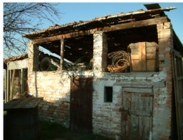
5. Edificio 3. Fronte sud