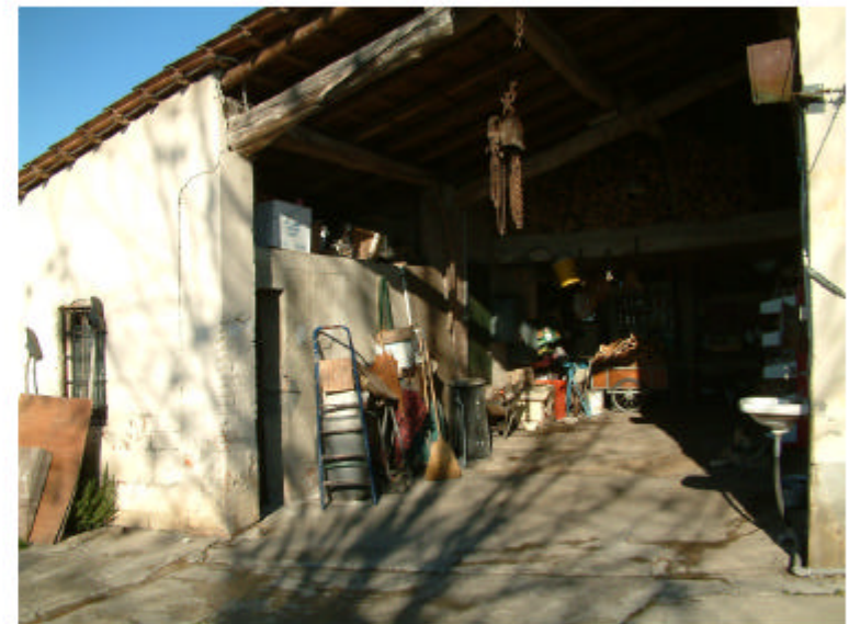
4. Edificio 1d. Fronte sud