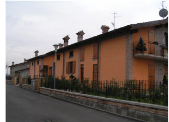
3. Edificio 3. Fronte nord