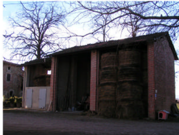
5. Edificio 3. Fronte nord