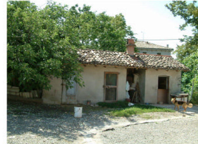
6. Edificio 3. Fronte est