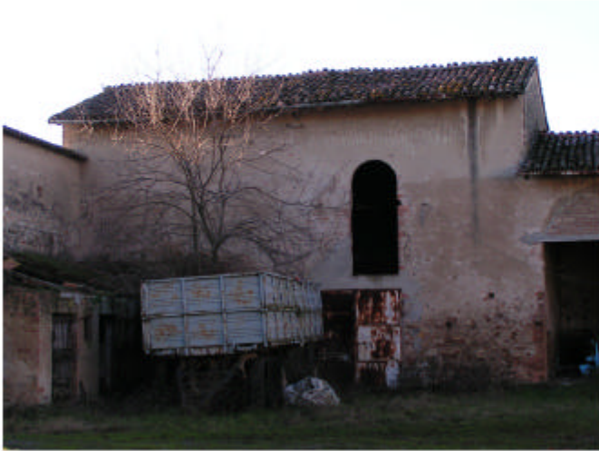
7. Edificio 1h. Fronte est