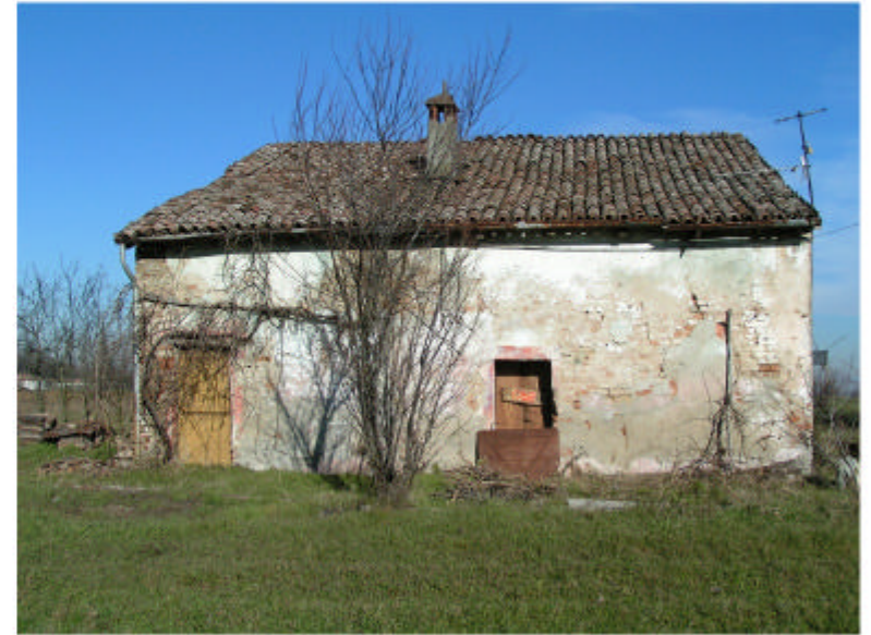
2. Fronte sud