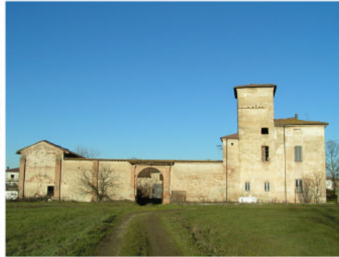
2. Vista del complesso da Sud