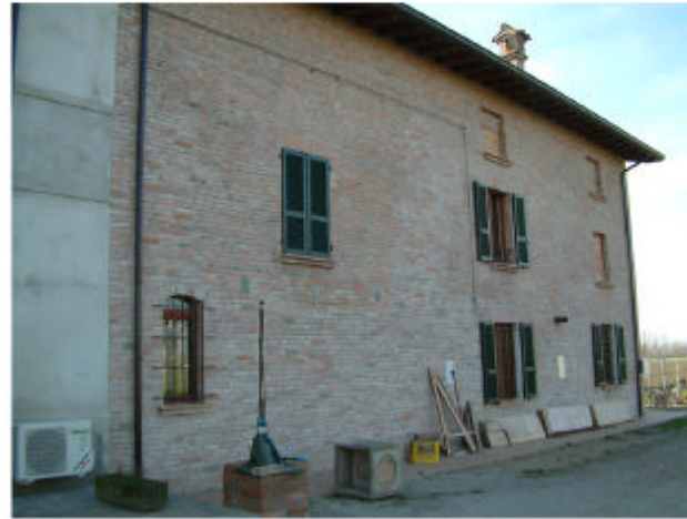
2. Edificio 1b. Fronte nord