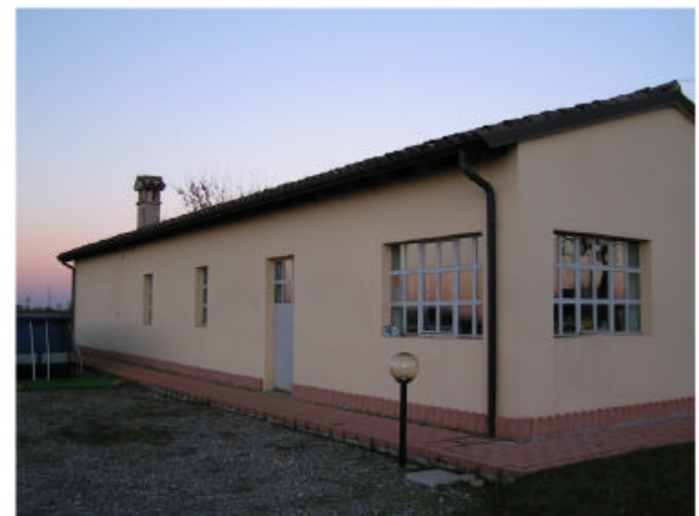
5. Edificio 2. Fronte ovest