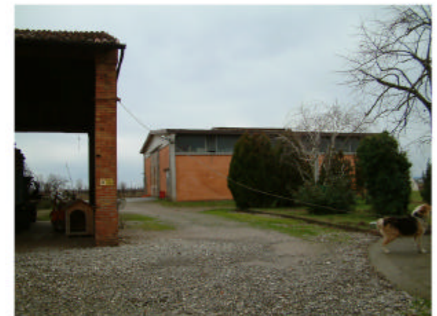
6. Edificio 5