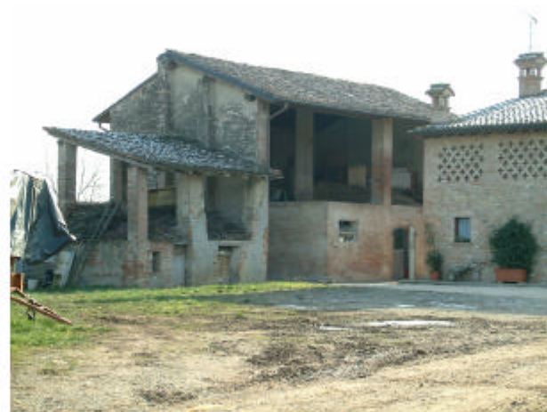
11. Edificio 5a-5b. Fronte ovest