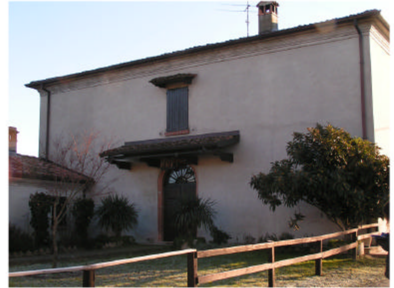
2. Edificio 1. Fronte ovest