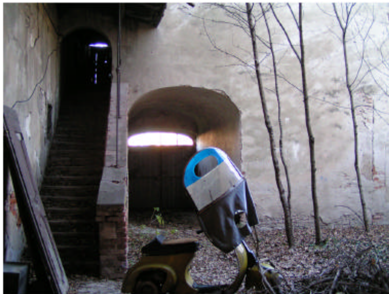
17. Edificio 1a. Cortile interno