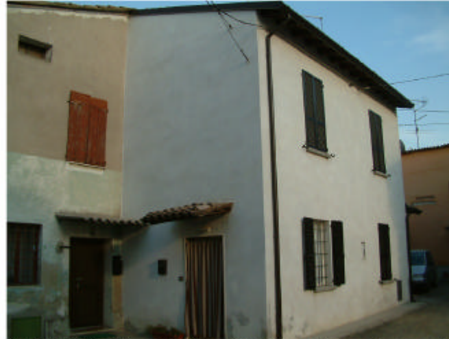
8. Edificio 2, parti 2a e 2c. Fronti ovest e sud.