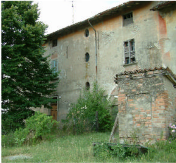
1. Edificio 1, parte1a. Fronte est.