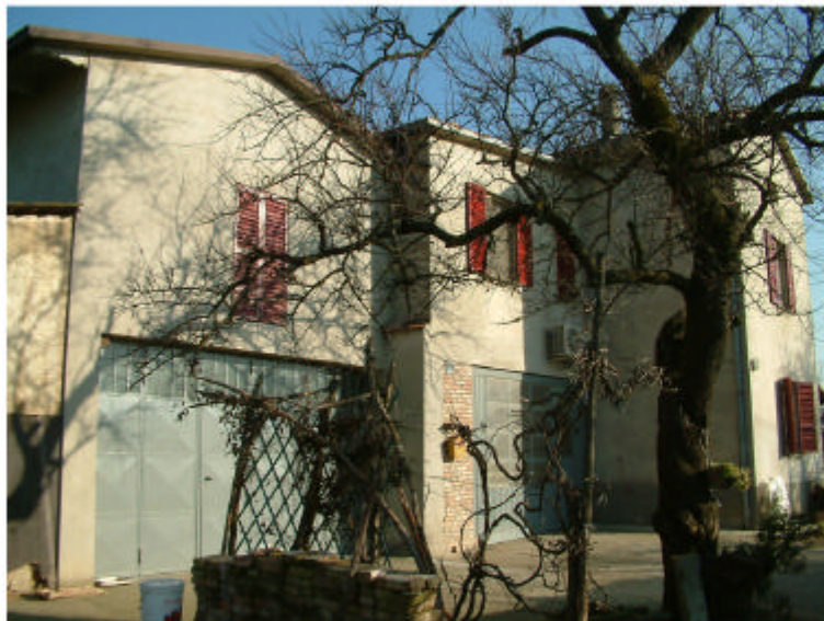
3. Edificio 1a-1b-1c. Fronte sud