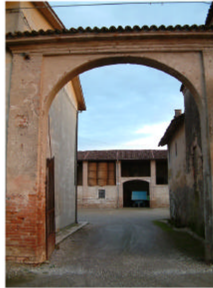
2. Ingresso 2d. Fronte ovest