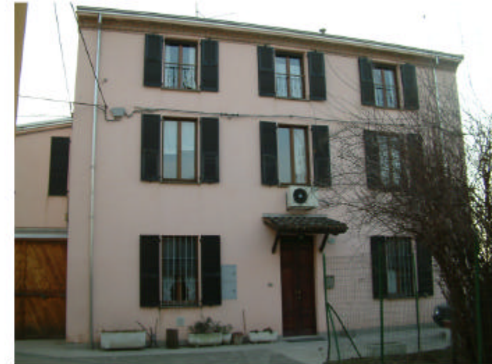
6. Edificio 1. Fronte nord