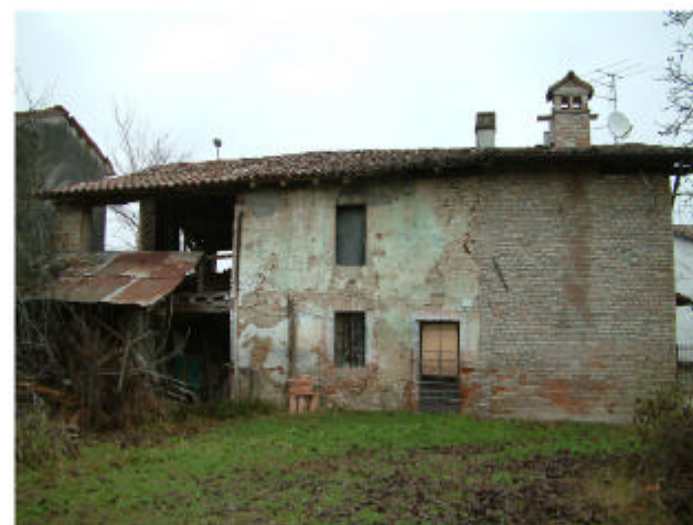
5. Edificio 3. Fronte sud