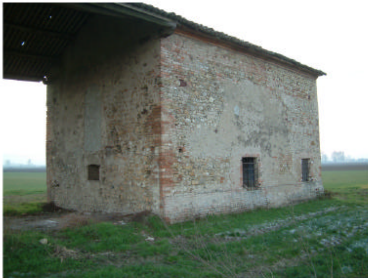
3. Edificio 1a-1b. Fronte nord