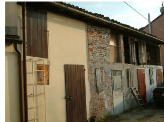
12. Edificio 3, parte 3c. Fronte ovest.