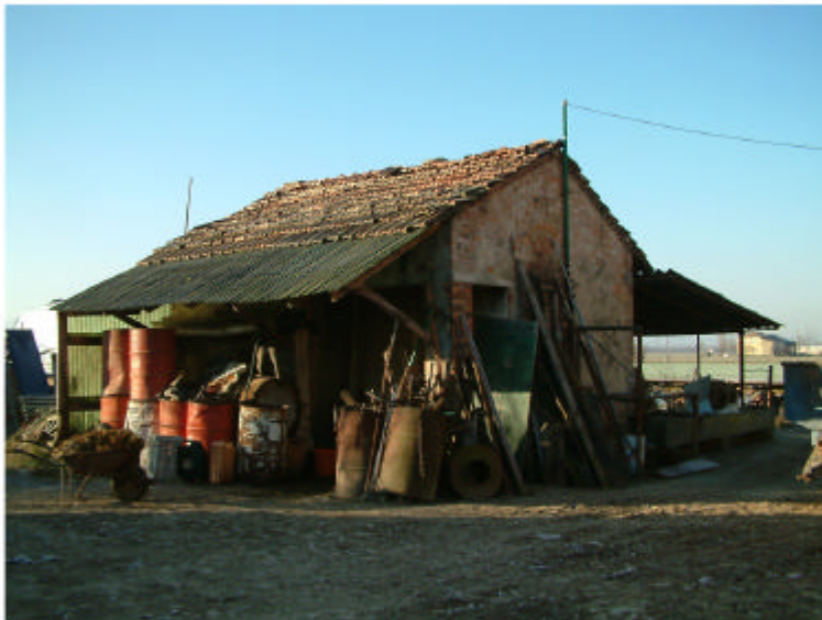
9. Edificio 2. Fronti est e nord