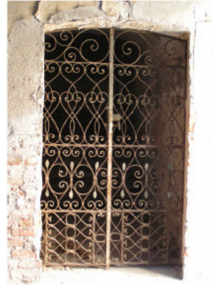
15. Edificio 1a. Porta p.t.