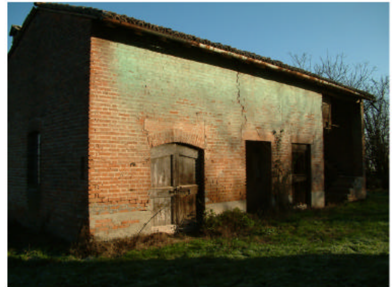
4. Edificio 3. Fronte sud