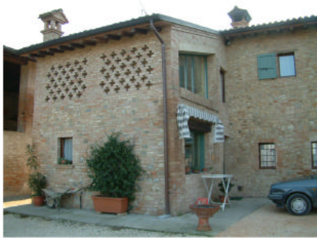
7. Edificio 3a. Fronte nord