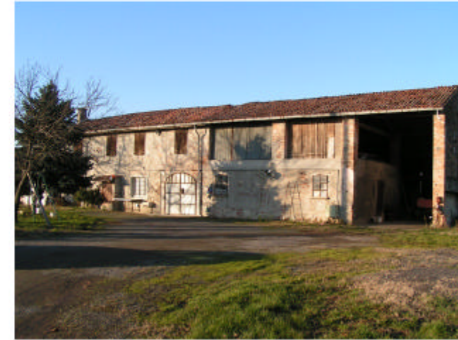
3. Edificio 1. Fronte sud