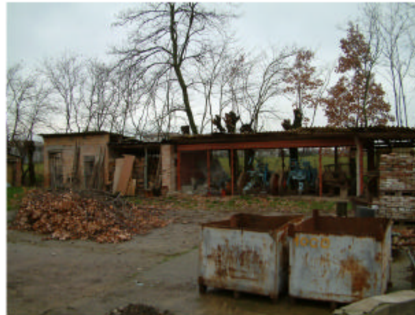
5. Edificio 3. Fronte sud