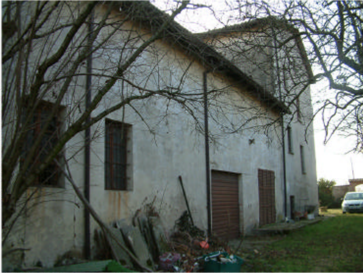
7. Edificio 4, parti 4c e 4b. Fronte nord.