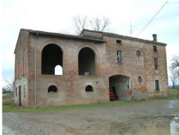
1. Edificio 1. Fronte ovest