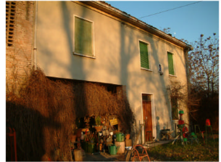
3. Edificio 1a. Fronte sud