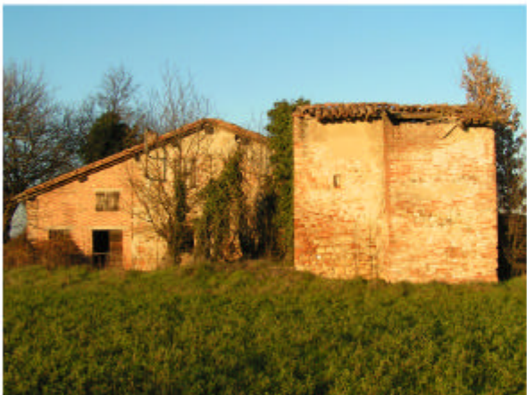
4. Edifici 1-2. Fronte sud