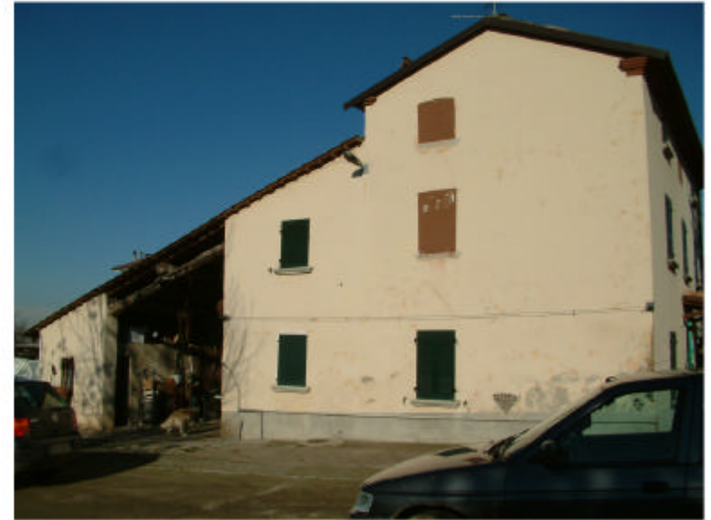
2. Edificio 1. Fronte sud