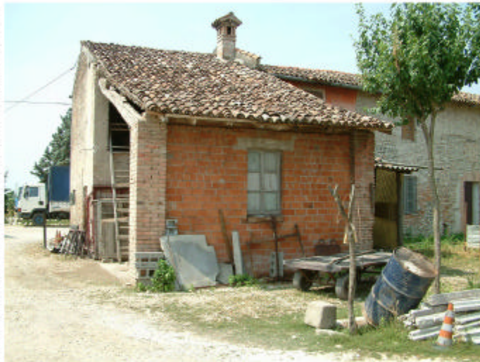
4. Edificio 1, parte 1b. Fronte nord.