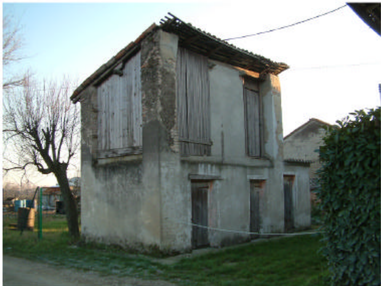
8. Edificio 3. Fronti nord e ovest