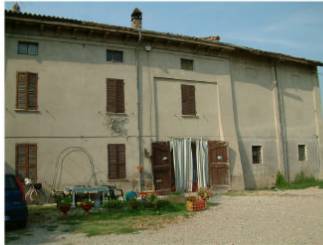
2. Edificio 1, parti 1b e 1c. Fronte sud.