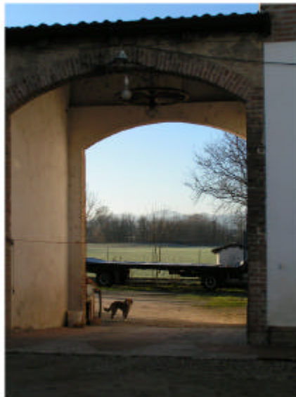
4. Edificio 1d. Fronte nord