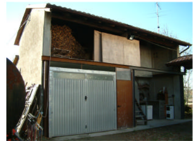
3. Edificio 2. Fronte nord