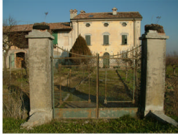
2. Edificio 1a. Accesso da Sud