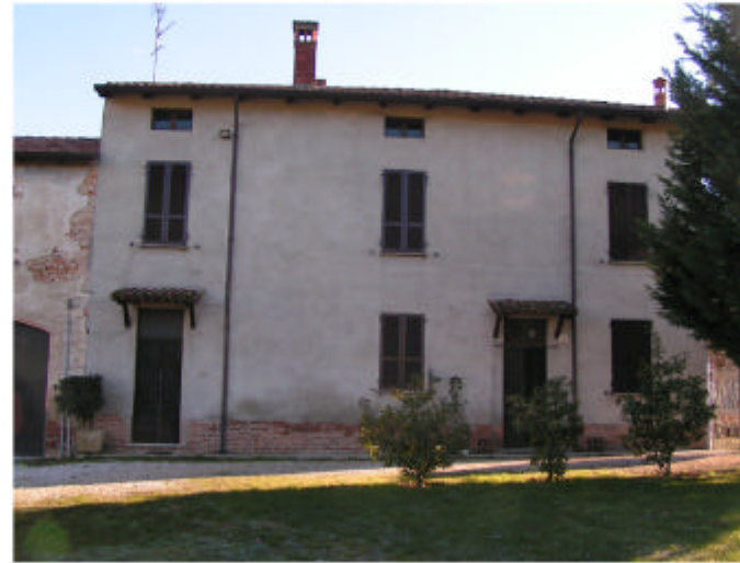
2. Edificio 1a, 1b. Fronte ovest