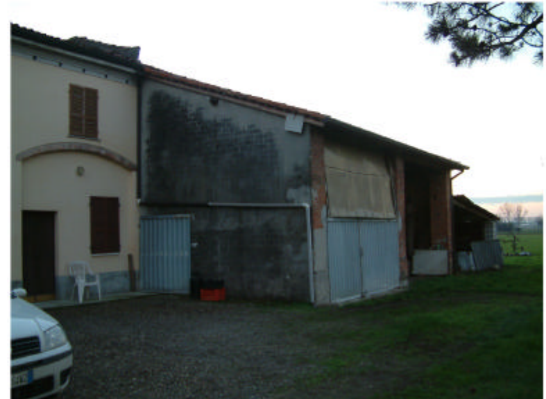
2. Edificio 1b-1c. Fronte nord