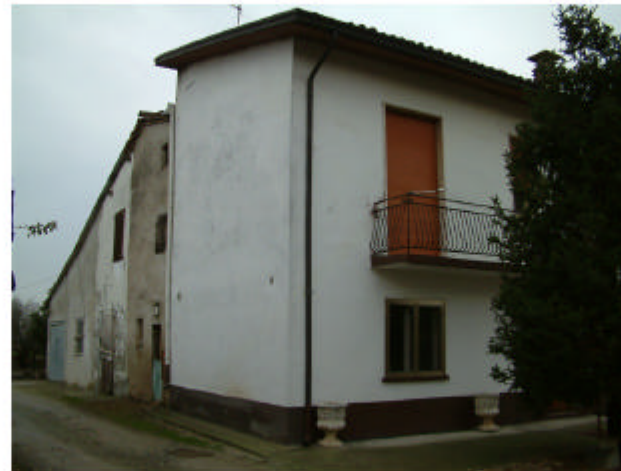
17. Edificio 12a-12b. Fronte ovest