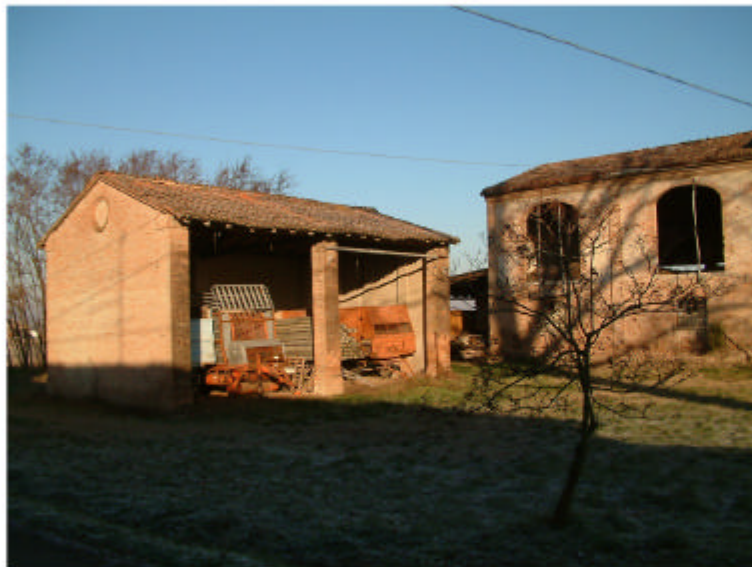
3. Edificio 2. Fronti sud ed est