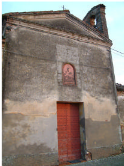
10. Edificio 2b. Fronte ovest