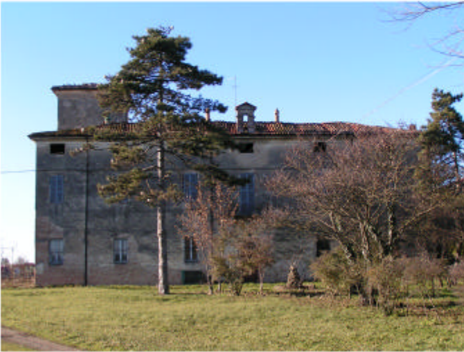
1. Edificio 1a. Fronte est