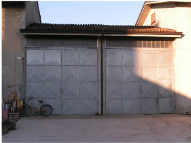
7. Edificio 4c. Fronte sud