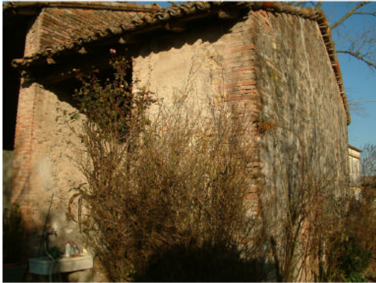
7. Edificio 1g. Fronte sud