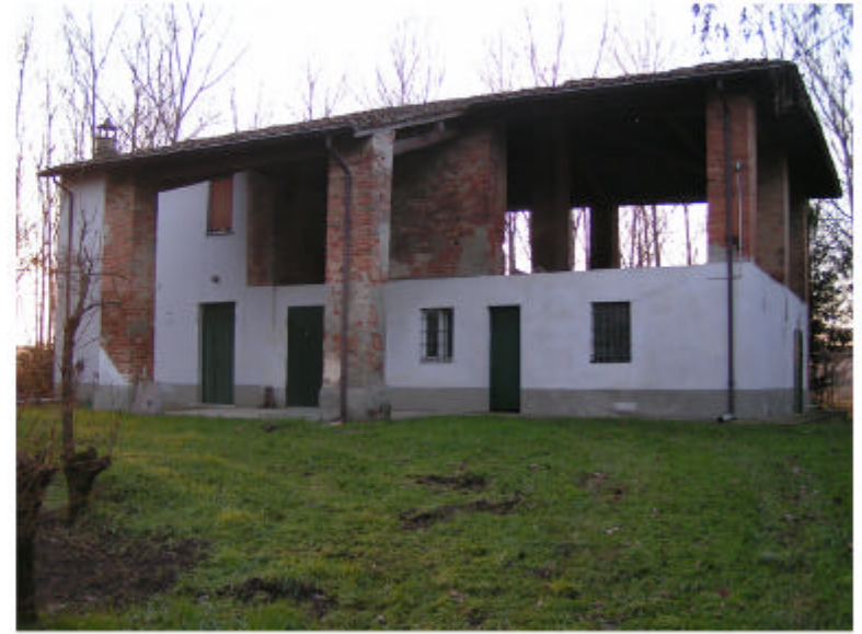
2. Edificio 1. Fronte est