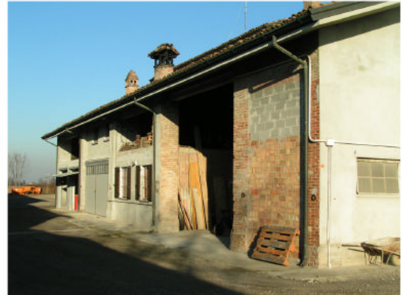
2. Edificio 1. Fronte ovest