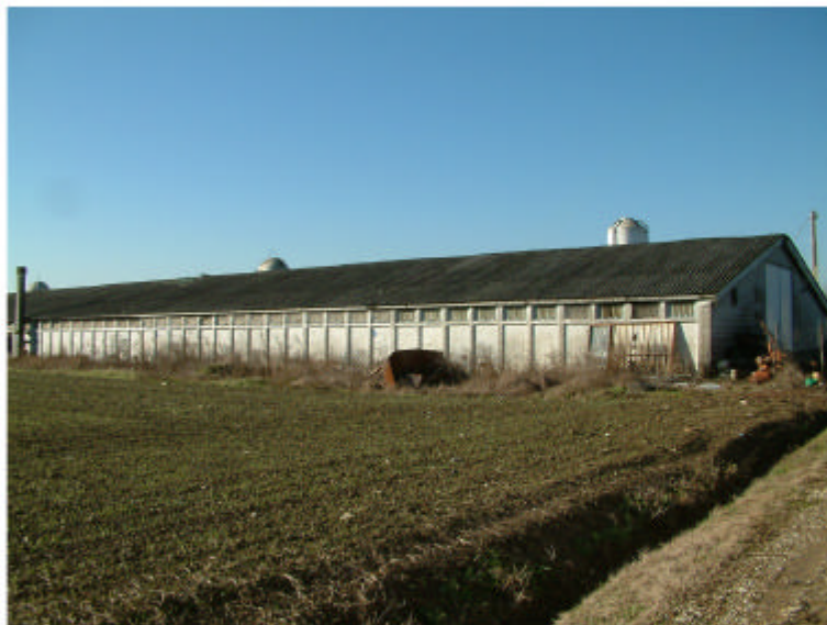
3. Edificio 3. Fronte est