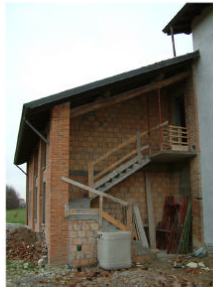
5. Edificio 1, parte 1b. Fronte sud.