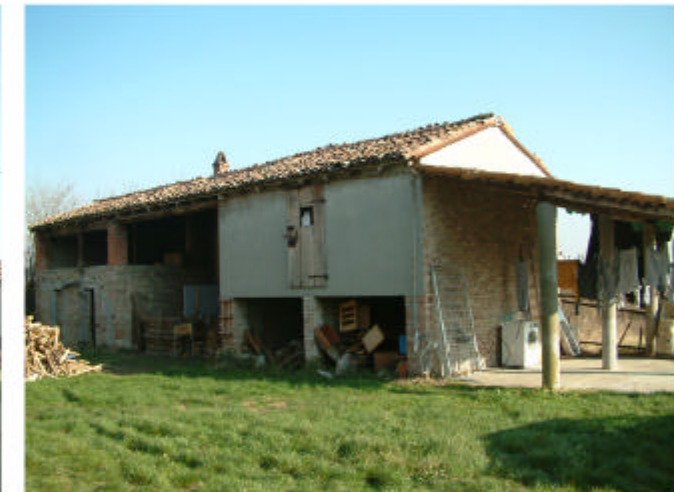
6. Edificio 3. Fronte ovest