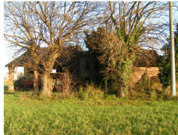
5. Edificio 1. Fronte ovest