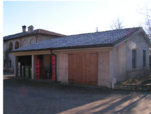
5. Edificio 3. Fronte nord-ovest