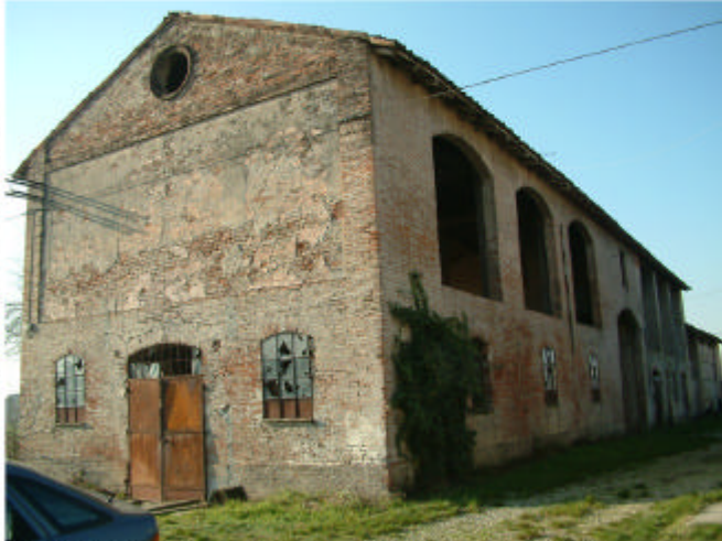
1. Edificio 2, parte 2a. Fronti est e nord.