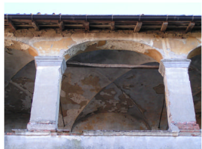
18. Edificio 1a. Loggiato