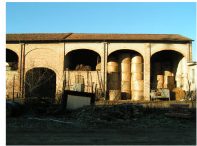
9. Edificio 3e-3f. Fronte est