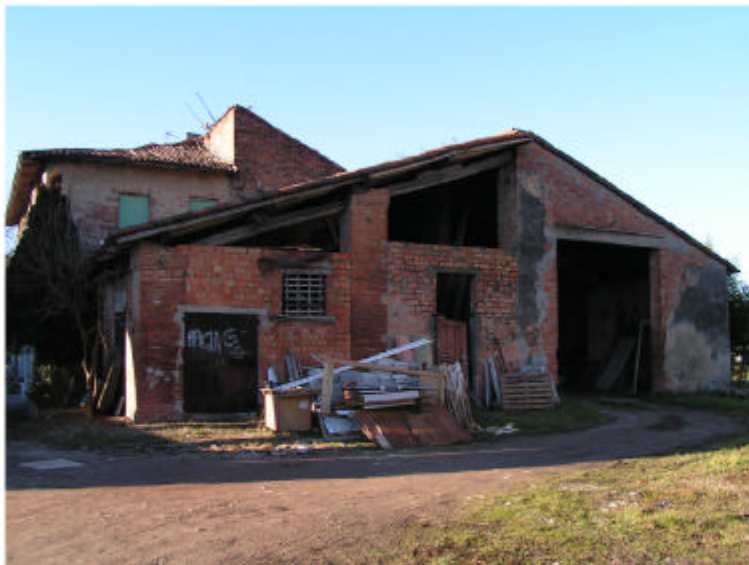
3. Edificio 1. Fronte est