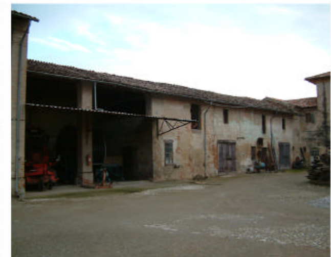
6. Edificio 1b, 1c, 1d. Fronte ovest