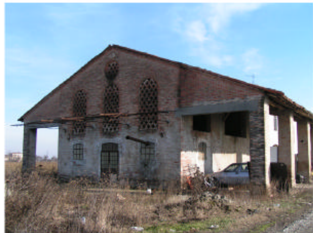
4. Edificio 1d. Fronte ovest