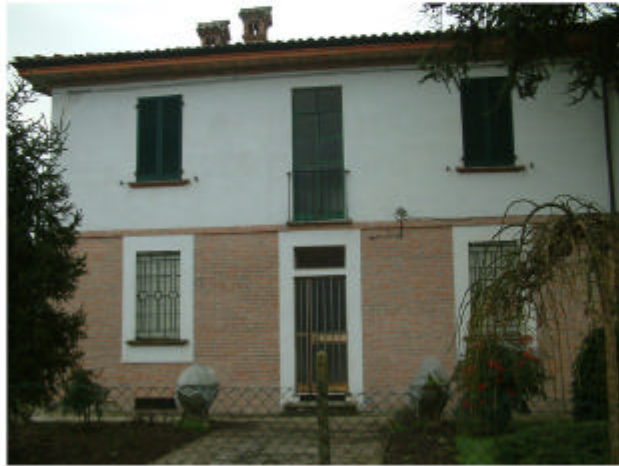
1. Edificio 1c. Fronte nord