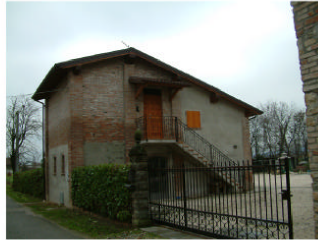
8. Edificio 6. Fronte ovest