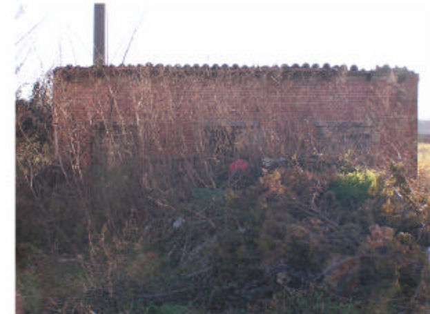
11. Edificio 5. Fronte nord