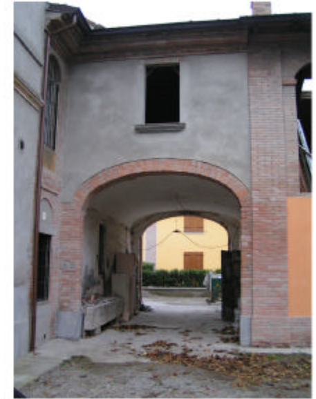
9. Edificio 6e. Fronte est