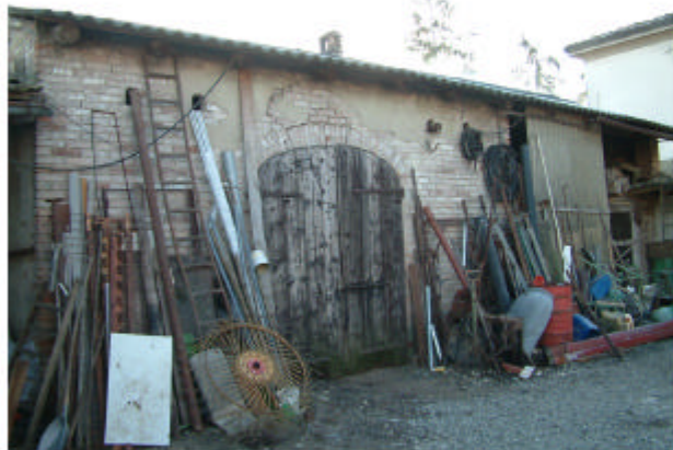
4. Edificio 1f. Fronte ovest