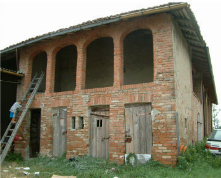
4. Edificio 2, parte 2c. Fronte est.