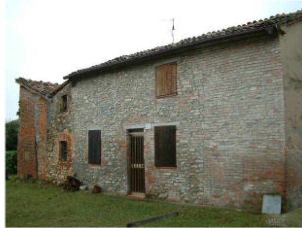
14. Edificio 11. Fronte ovest