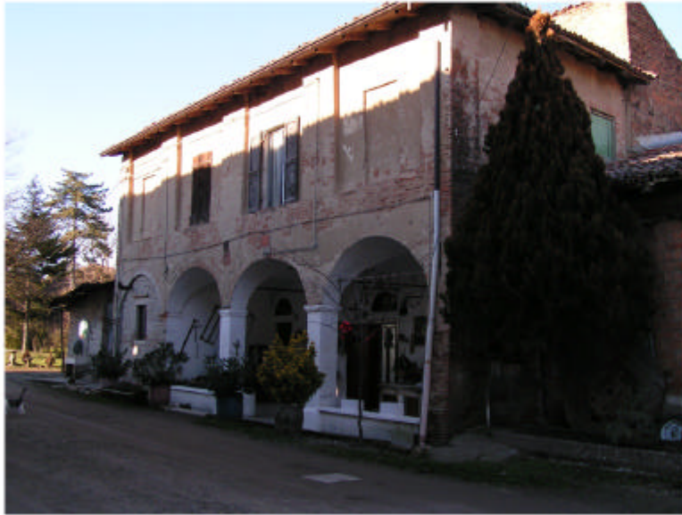
1. Edificio 1. Fronte sud