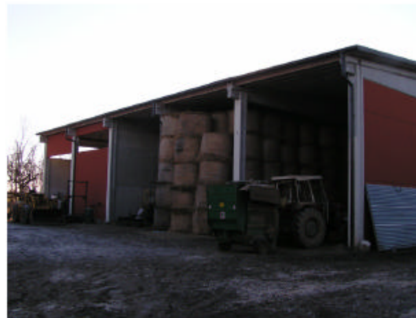
11. Edificio 5. Fronte nord