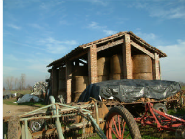
14. Edificio 7. Fronti ovest e sud