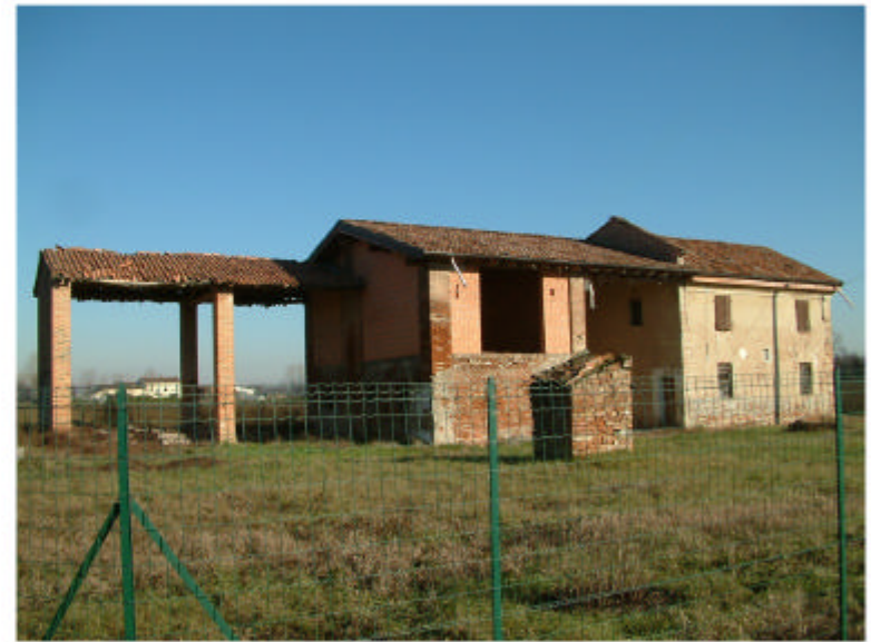
2. Edificio 1. Fronte sud