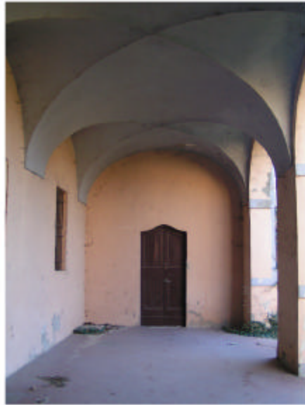
13. Edificio 1a. Portico piano terra