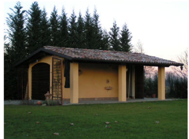
4. Edificio 2. Fronte sud-ovest