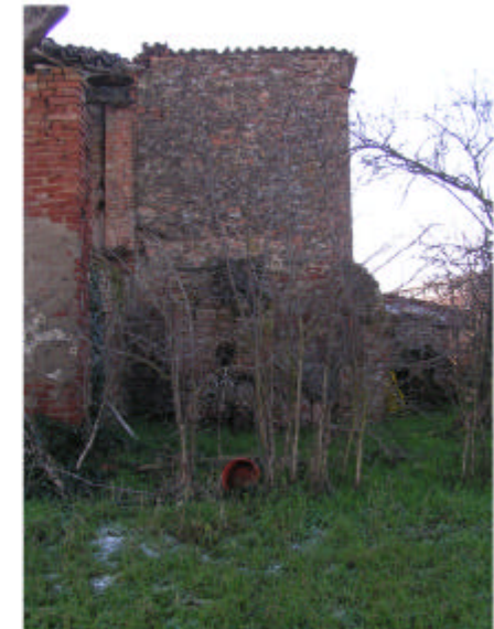
5. Fronte nord