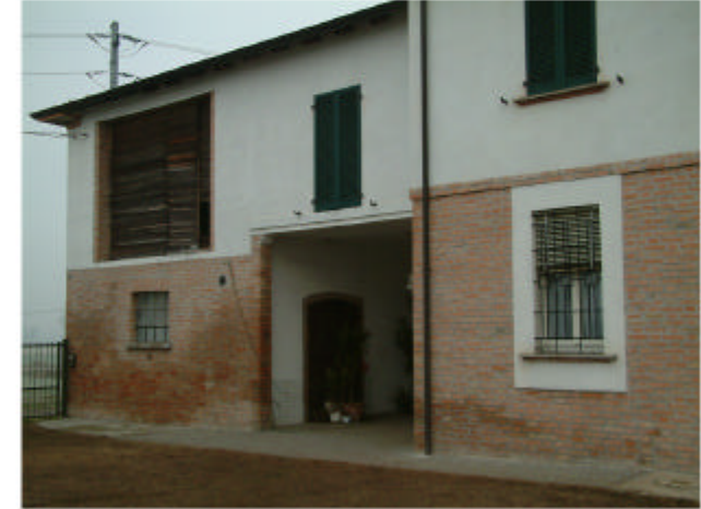
3. Edificio 1a-1b. Fronte sud