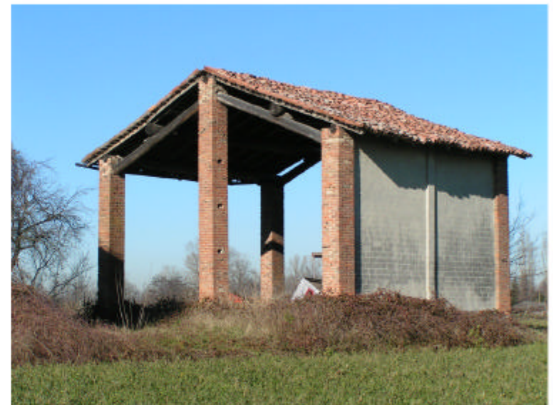
4. Edificio 2. Fronti sud ed est