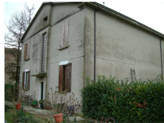
12. Edificio 4. Fronti nord e ovest.