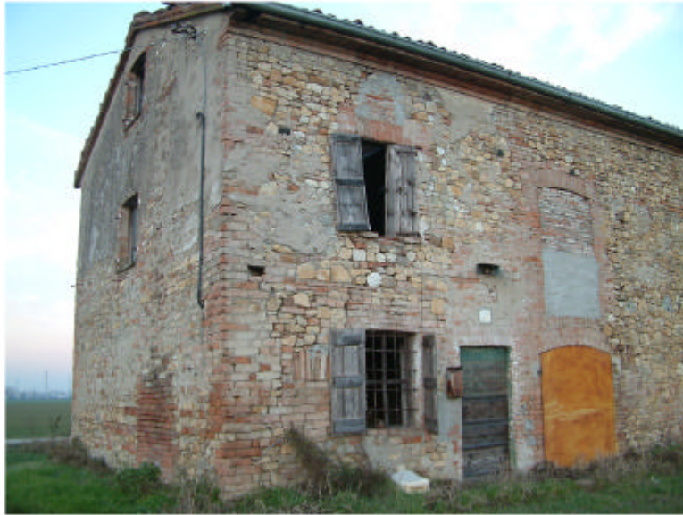
1. Edificio 1a-1b. Fronte sud