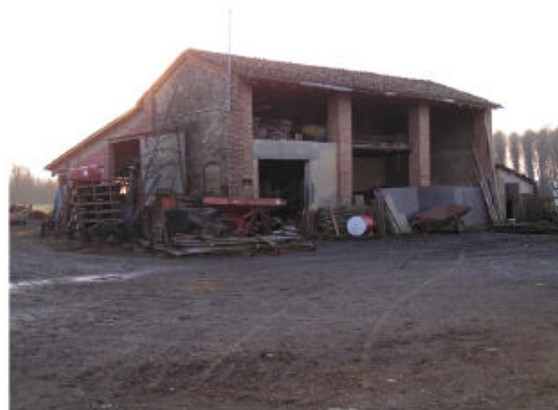
5. Edificio 3. Fronti est e nord