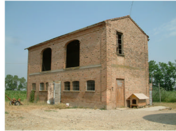
15. Edificio 4. Fronti sud ed est.