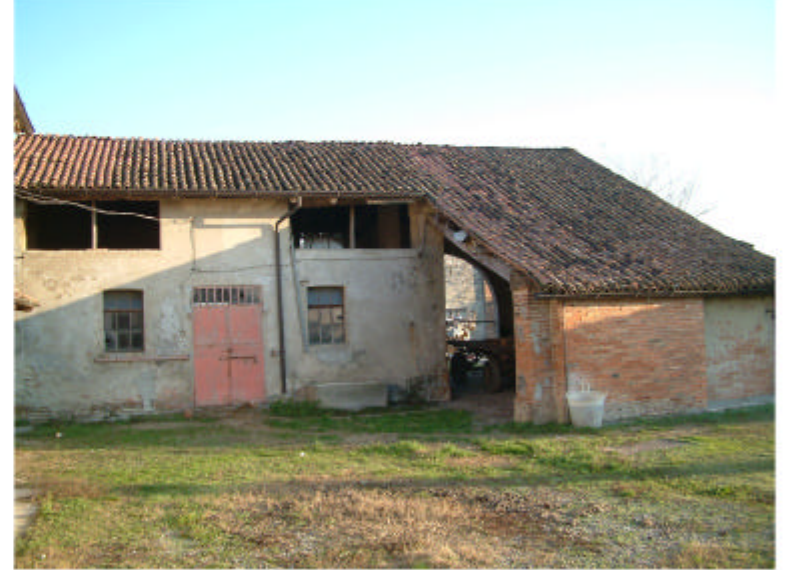
7. Edificio 2a e 2b. Fronte ovest