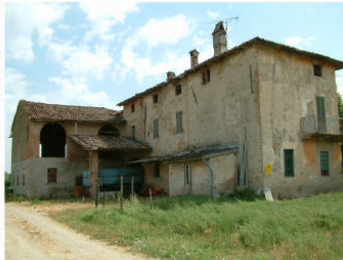
5. Edificio 1, parti 1d, 1e e 1a. Fronti sud e ovest.