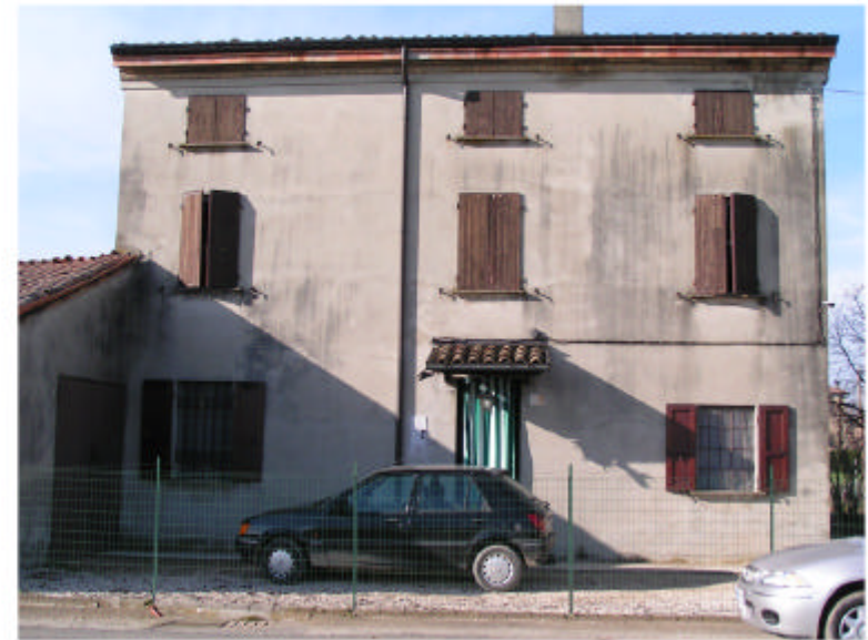
2. Edificio 1a. Fronte est