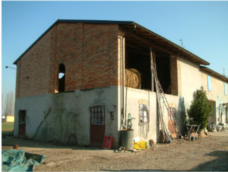
1. Edificio 1. Fronti ovest e sud