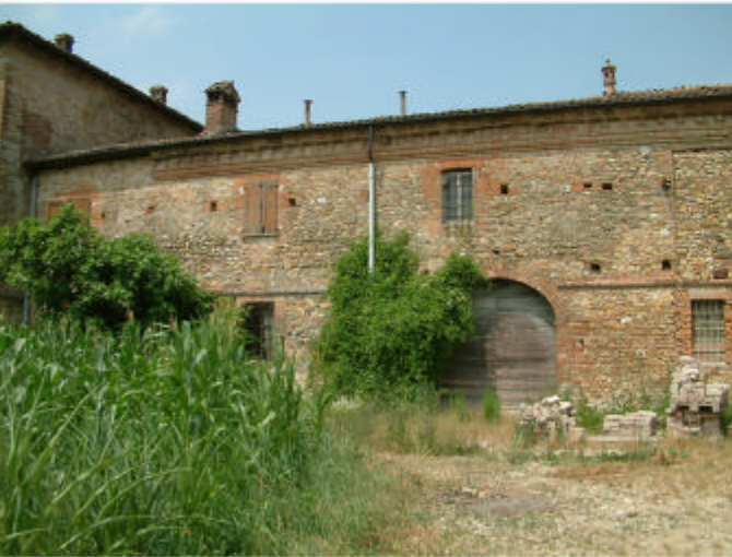
1. Edificio 1, parti 1i, 1f e 1c. Fronte est