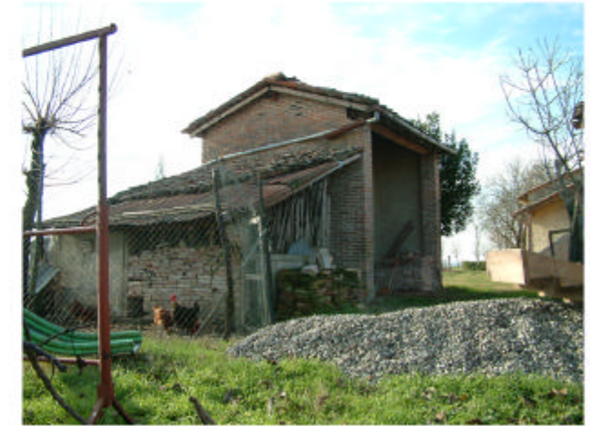
15. Edificio 8. Fronti est e nord