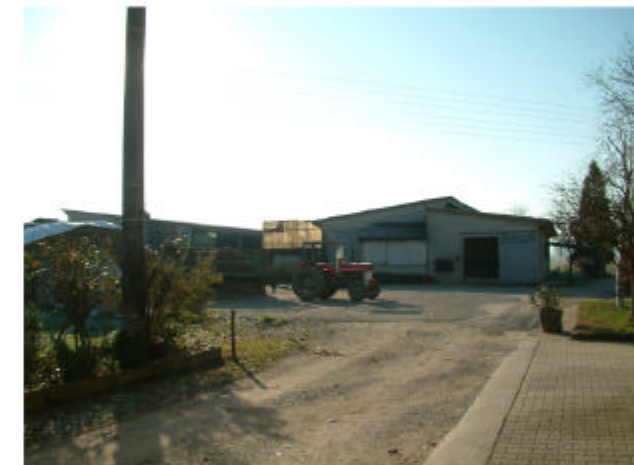
6. Edificio 4