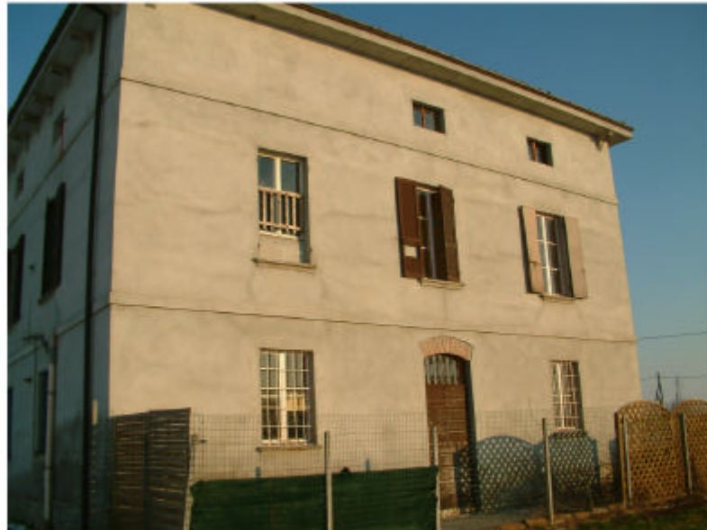
3. Edificio 1. Fronte ovest