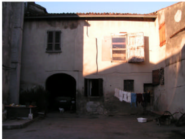
10. Edificio 4f. Fronte sud