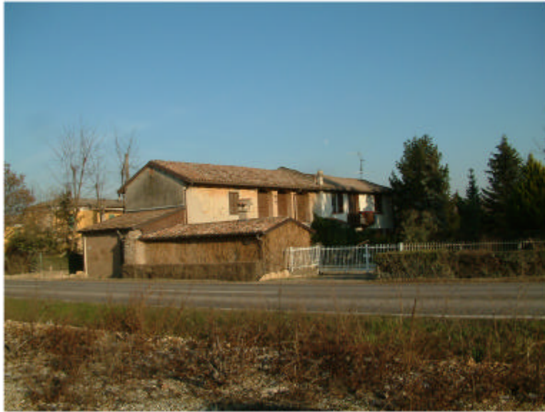
1. Vista generale da Ovest