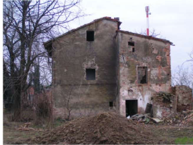
2. Edificio 1, parte 1a. Fronte nord.