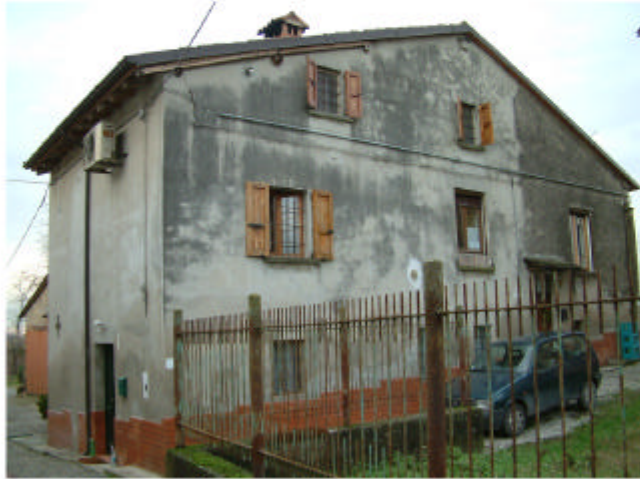
1. Edificio 1a. Fronte sud-est