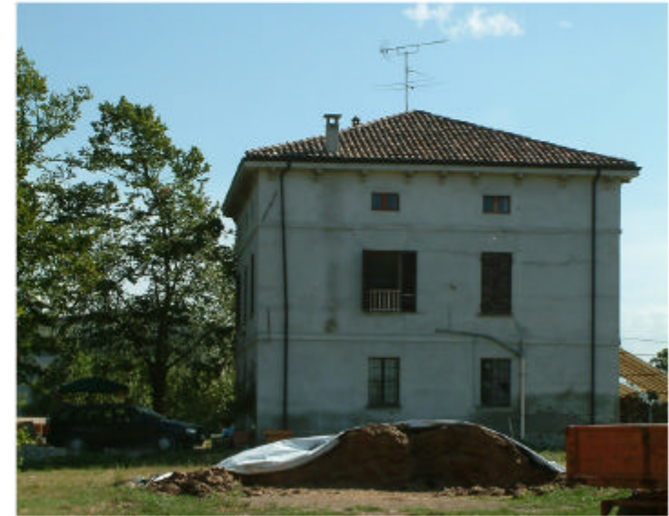
2. Edificio 1. Fronte nord