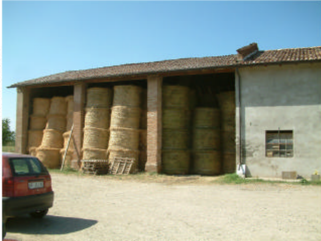
1. Edificio 1, parte 1d. Fronte sud.