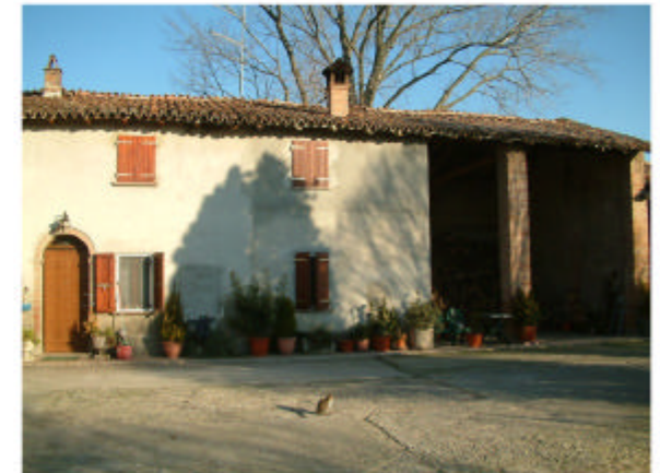
6. Edificio 1e-1f. Fronte sud