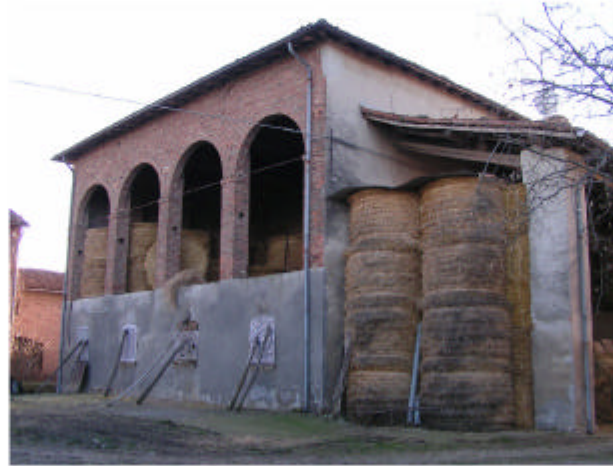
2. Edificio 1. Fronte nord