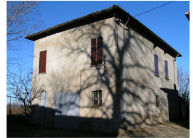
3. Edificio 2a. Fronte sud