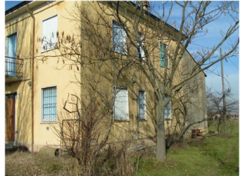
2. Edificio 1. Fronte est