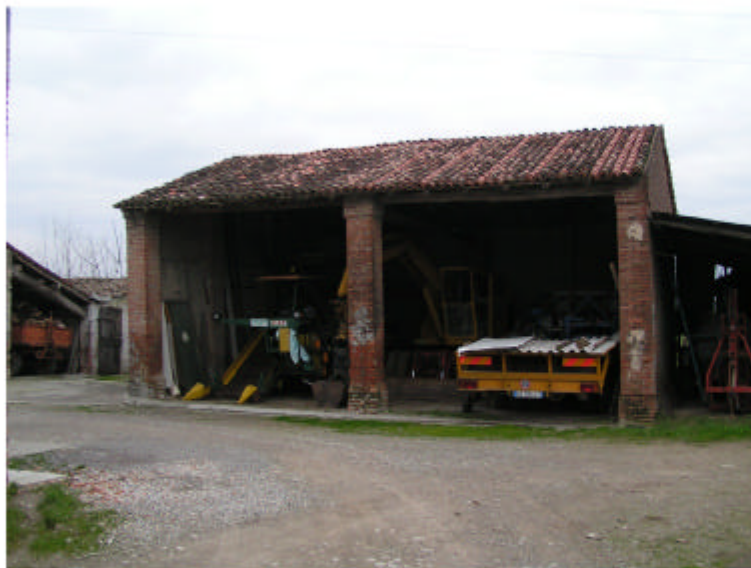
3. Edificio 2. Fronte est