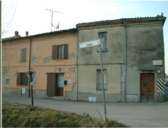
2. Edificio 2, parti 2f e 2e. Fronte est.