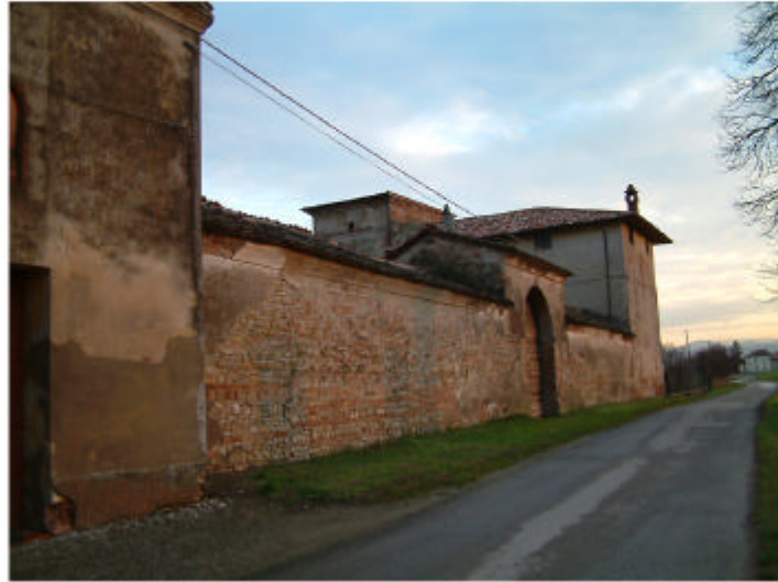
1. Corte principale. Fronte ovest