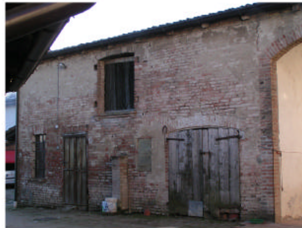
5. Edificio 1e. Fronte nord