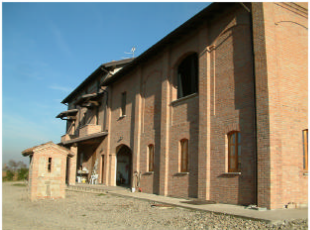
4. Edificio 1c. Fronte sud-ovest