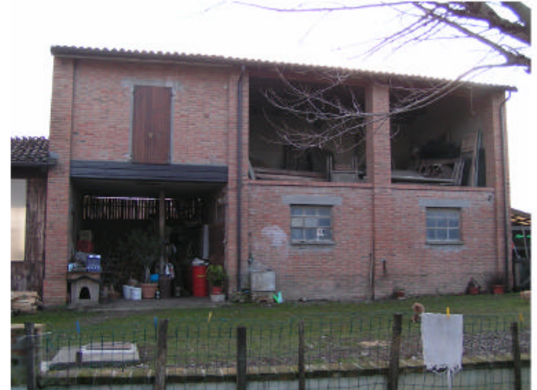
4. Edificio 2b. Fronte nord