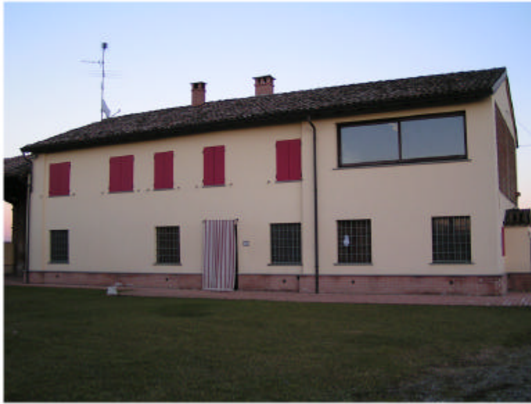
1. Edificio 1. Fronte ovest