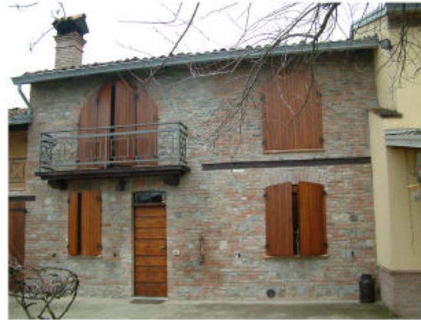
2. Edificio 1c. Fronte sud-ovest