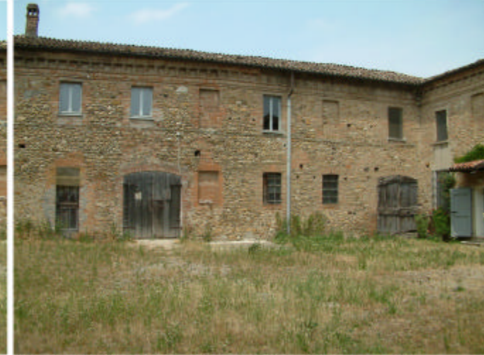
10. Edificio 1, parti 1e e 1d. Fronte est.