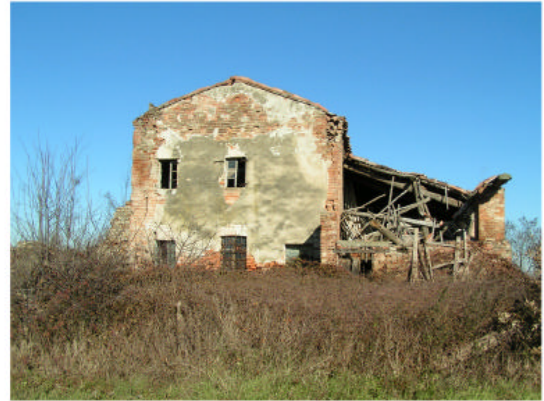
2. Edificio 1. Fronte sud