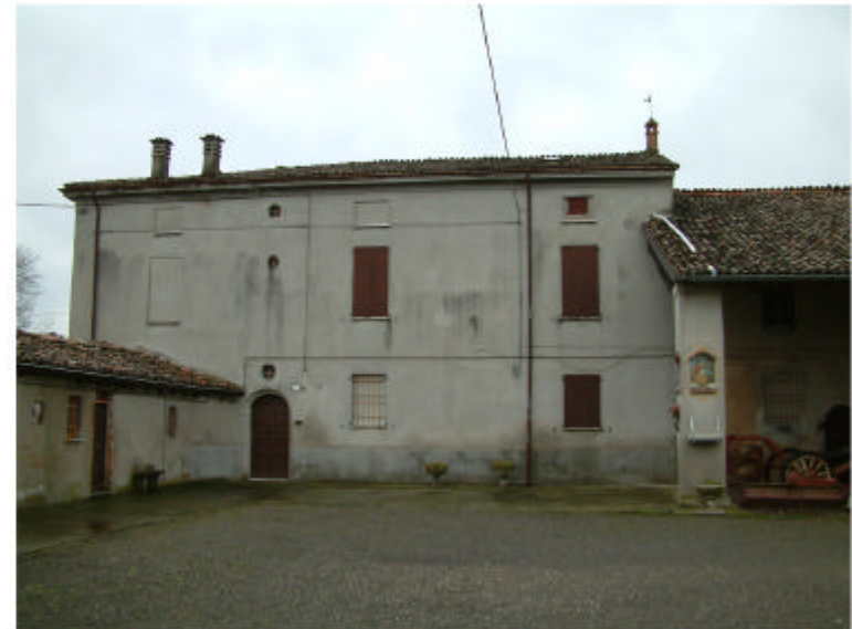
4. Edificio 1b. Fronte est