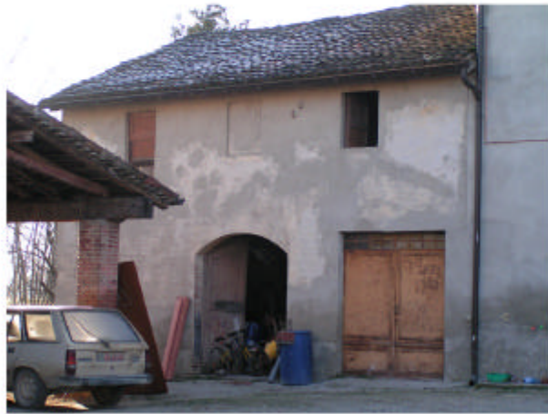
1. Edificio 1a. Fronte nord