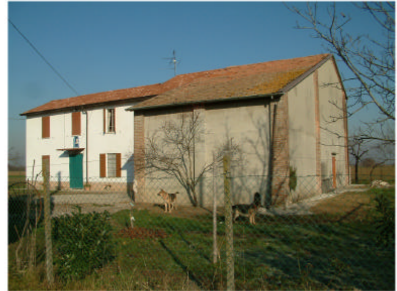
2. Edificio 1. Fronte sud