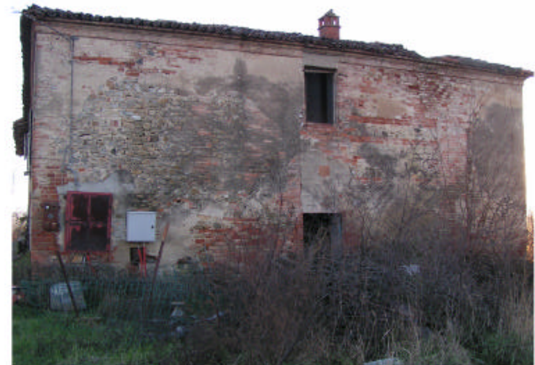
5. Parte 1a. Fronte nord