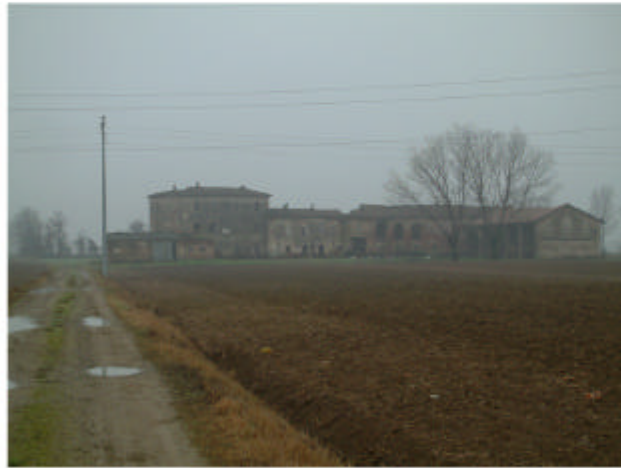
1. Vista generale da nord