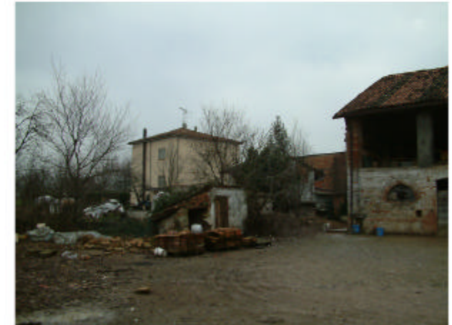
21. Edificio 14. Fronte ovest