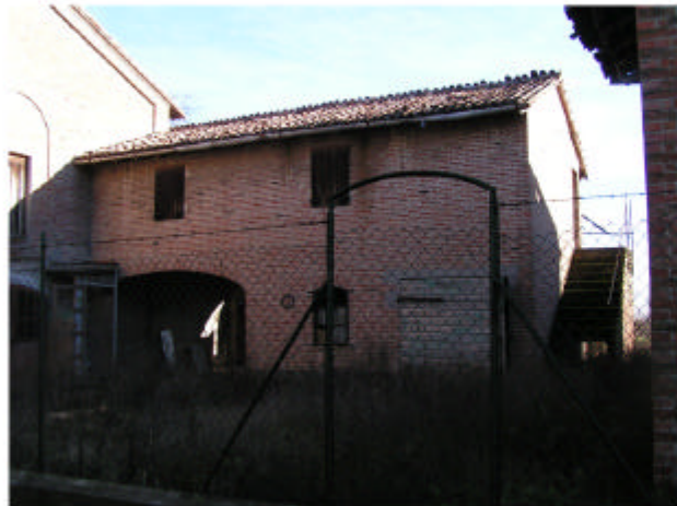
10. Edificio 6a, 6b. Fronte ovest