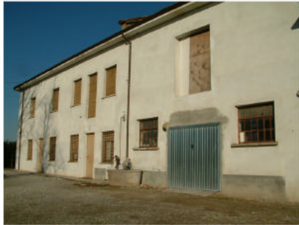
1. Edificio 1a-1b. Fronte sud