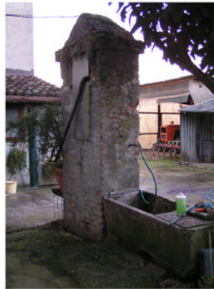
5. Pozzo con abbeveratoio