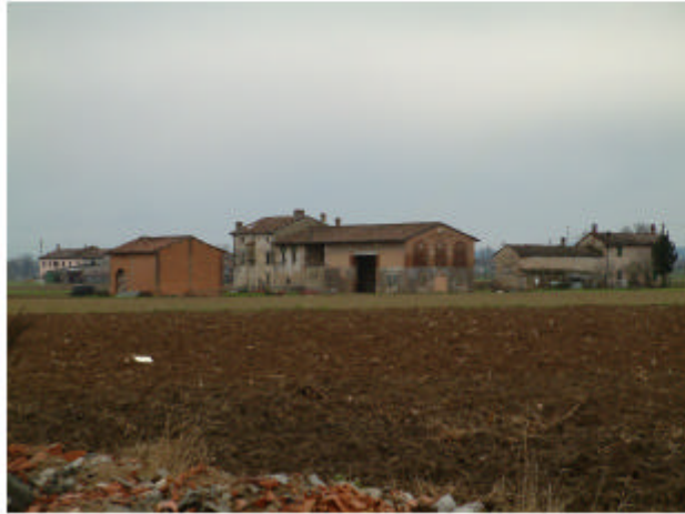
1. Vista generale da nord