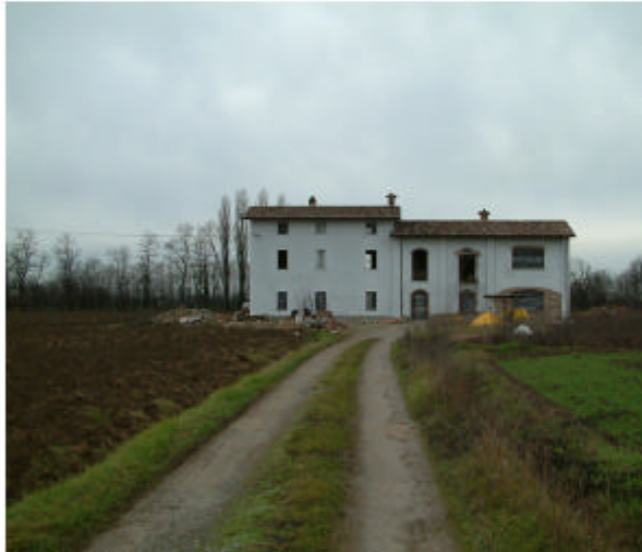
1. Edificio 1. Fronte est.