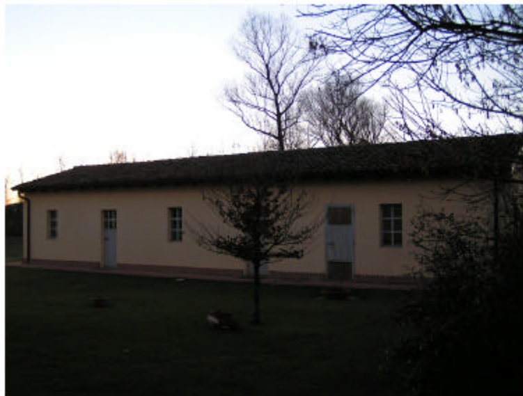
4. Edificio 2. Fronte est