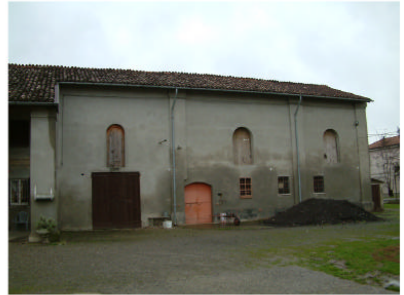
6. Edificio 1d. Fronte ovest