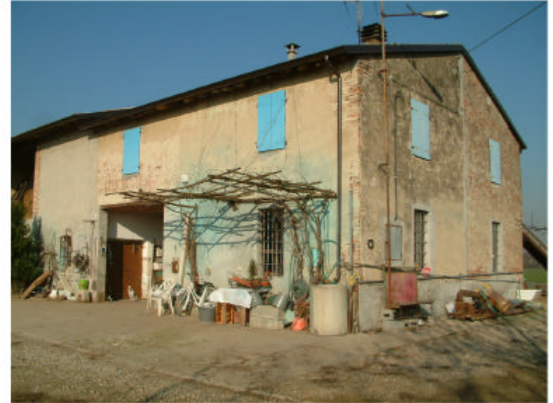
2. Edificio 1a-1b. Fronte sud-est