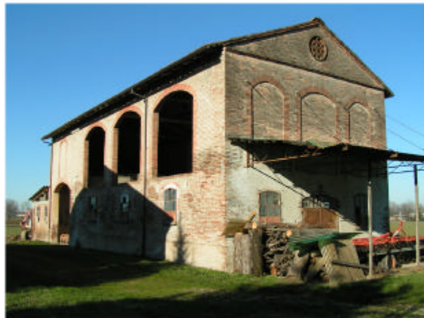
4. Edificio 2. Fronti sud ed est