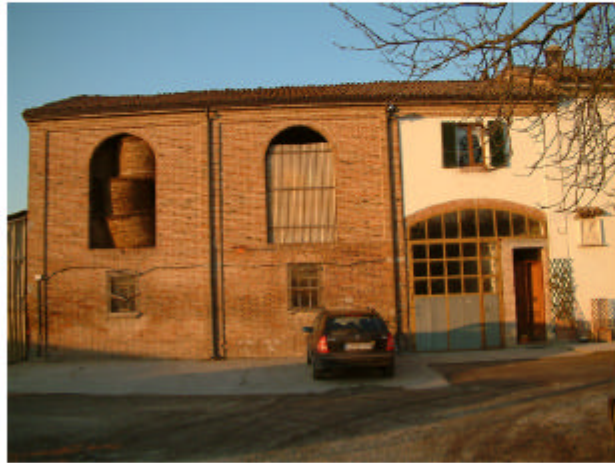
1. Edificio 1a, 1b. Fronte sud