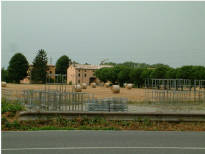
1. Complesso visto da Nord-Est.