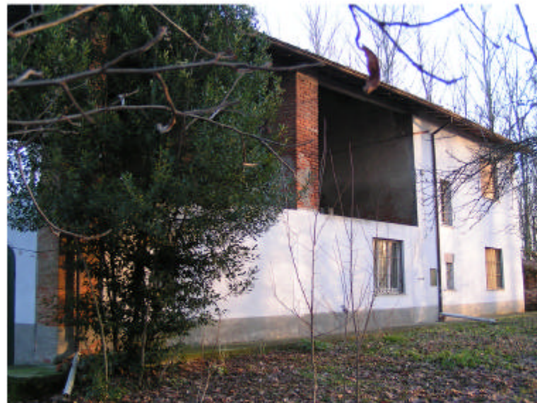
3. Edificio 1. Fronte ovest