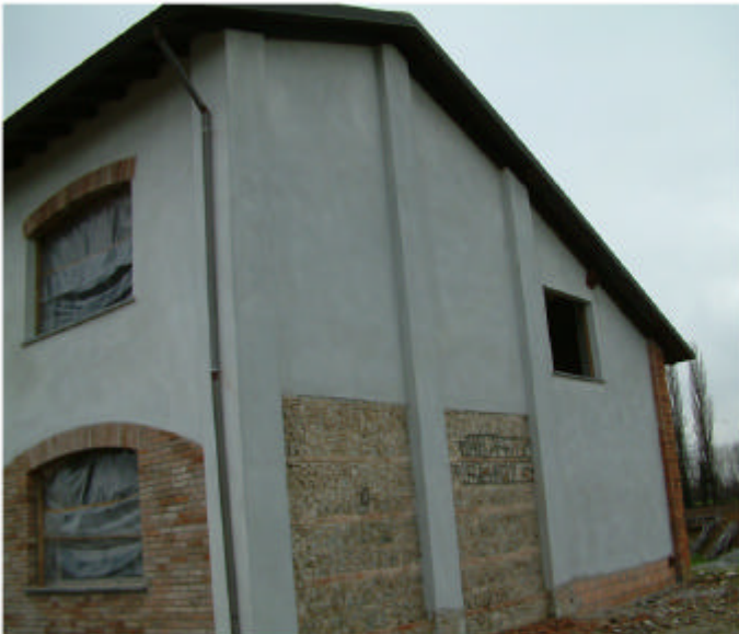
4. Edificio 1, parte 1b. Fronte nord.