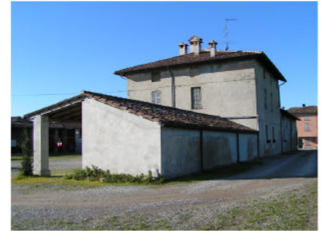
3. Edificio 1. Fronte nord-est