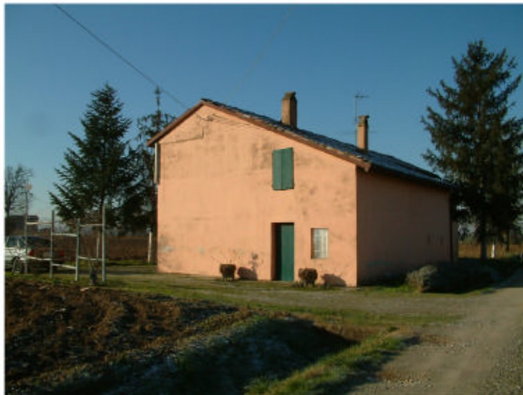
3. Edificio 1c. Fronte est