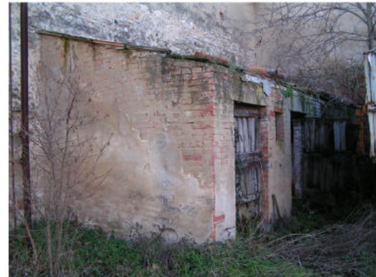
6. Edificio 1i. Fronti est e nord