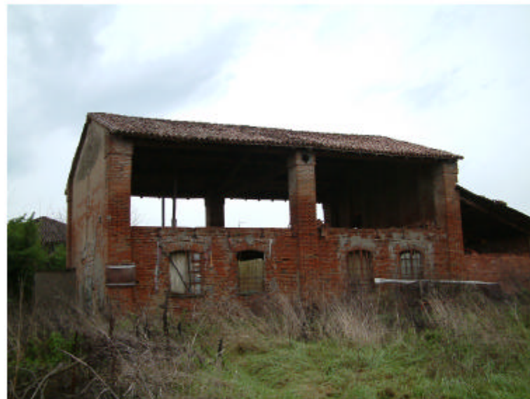
3. Edificio 2. Fronte ovest