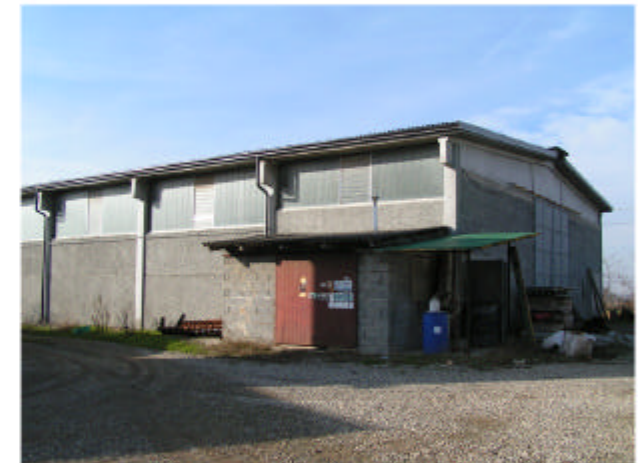
6. Edificio 4. Fronte sud-est e nord-est