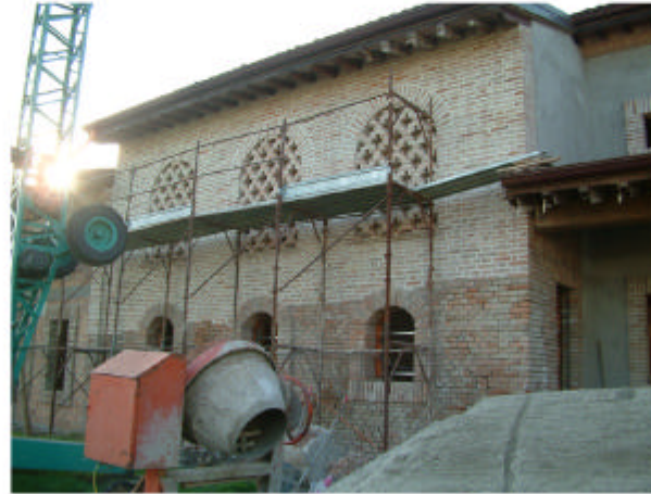
2. Edificio 2a. Fronte est