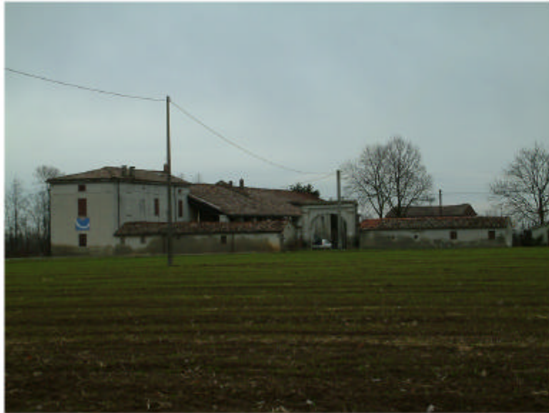
1. Vista del complesso da sud