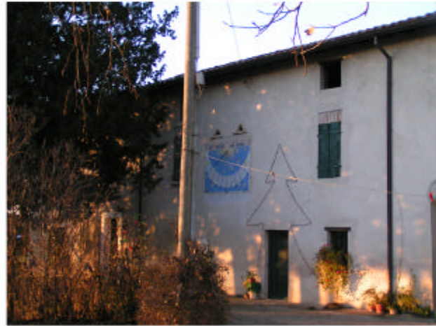
1. Edificio 1, parte 1a. Fronte sud