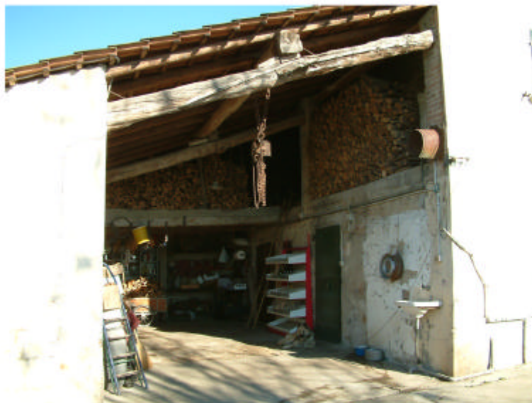
3. Edificio 1b-1c. Fronte sud