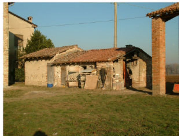
5. Edificio 3. Fronti ovest e sud