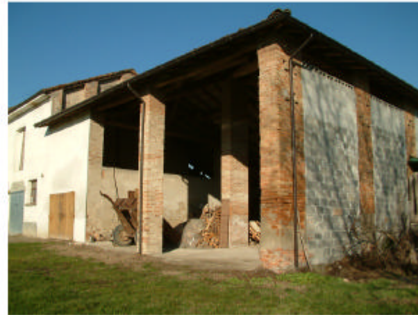
2. Edificio 1c. Fronti sud ed est