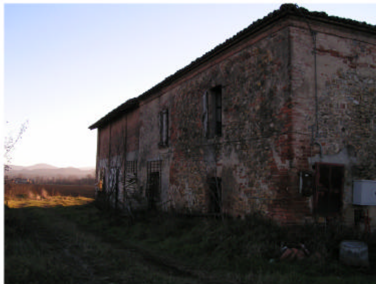
4. Edificio 1. Fronte est