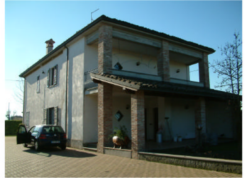
2. Edificio 1. Fronte nord-est