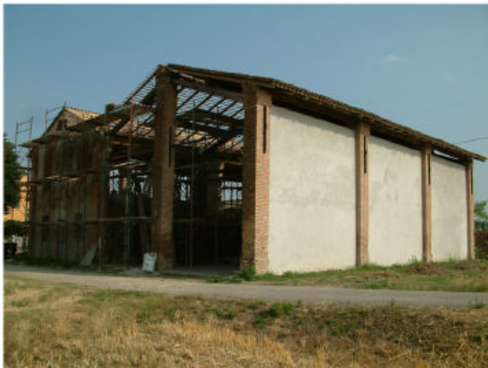
4. Edificio 2. Fronti nord e ovest.