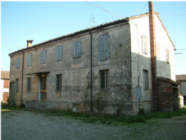
5. Edificio 1. Fronti ovest e sud.