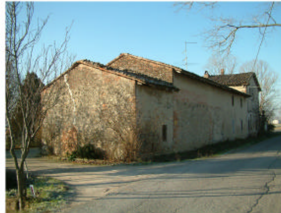
2. Ingresso nord attuale ed edificio 1