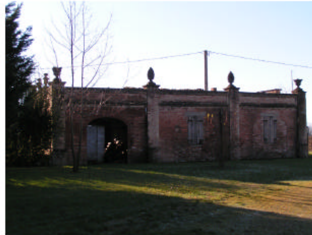
5. Edificio 3. Fronte nord