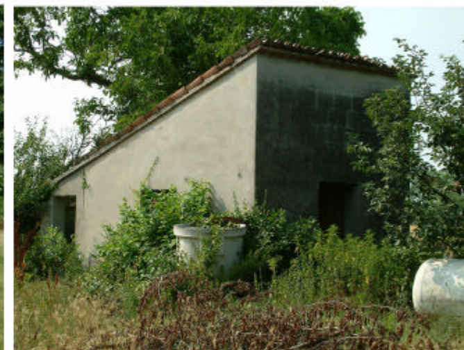
6. Edificio 4. Fronti ovest e sud.