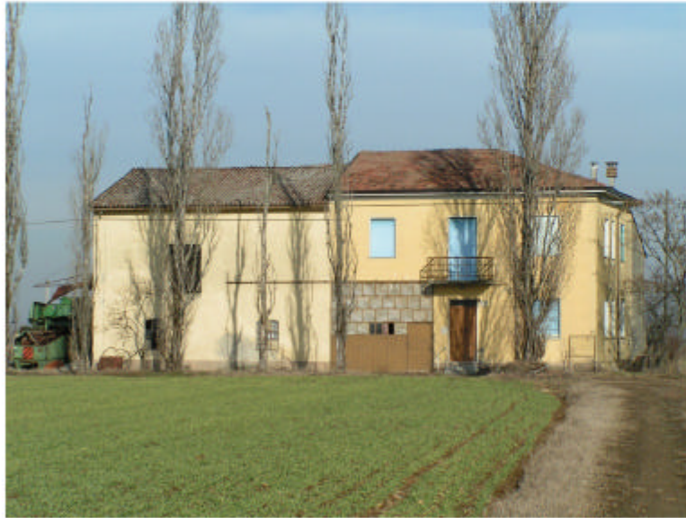
1. Edificio 1. Fronte sud