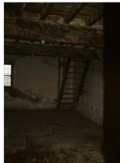
4. Edificio 1a. Interno