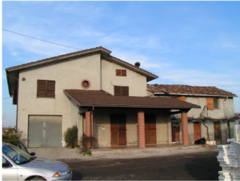
1. Edificio 1. Fronte sud