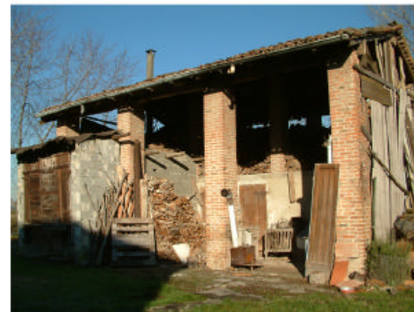
5. Edificio 2. Fronte sud