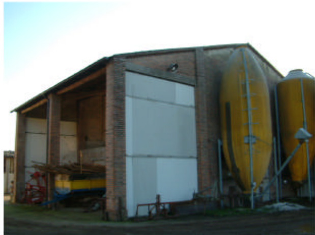
4. Edificio 2, parte 2a. Fronti nord e ovest