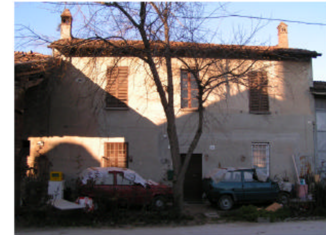
6. Edificio 4b. Fronte sud