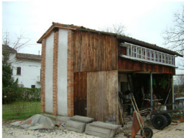
10. Edificio 8