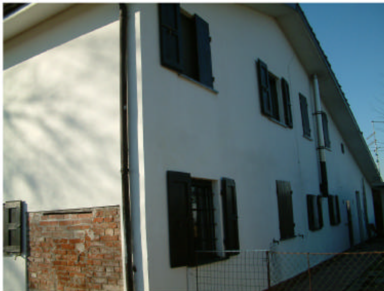
3. Edificio 1. Fronte nord