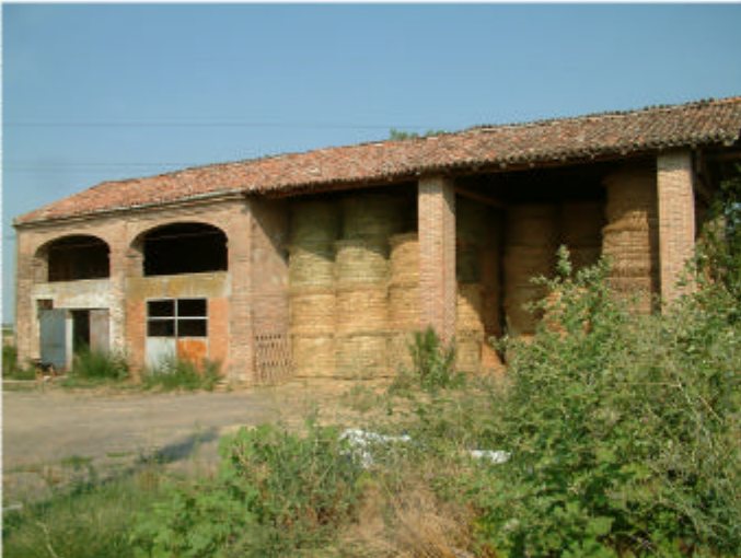
4. Edificio 2. Fronte ovest.