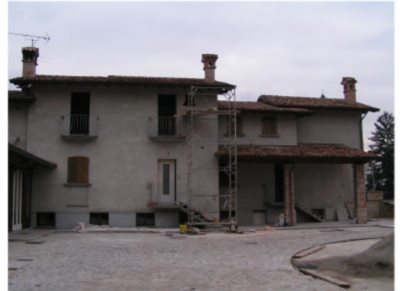
2. Edificio 1a. Fronte ovest