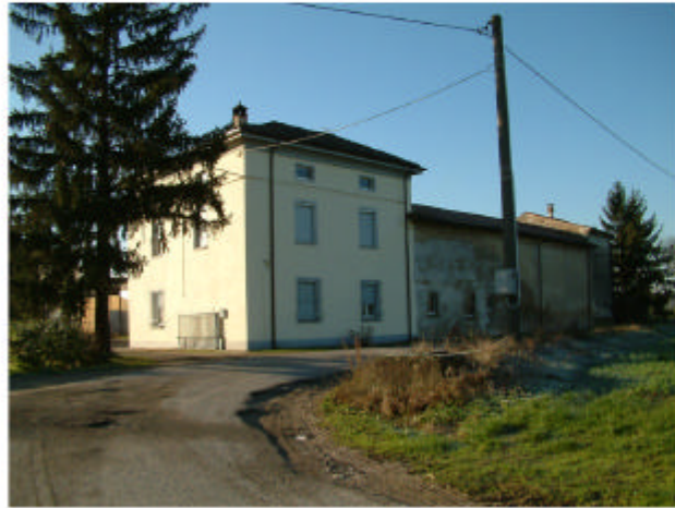
1. Vista dalla strada da Nord-Est