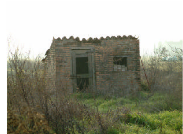
6. Edificio 4