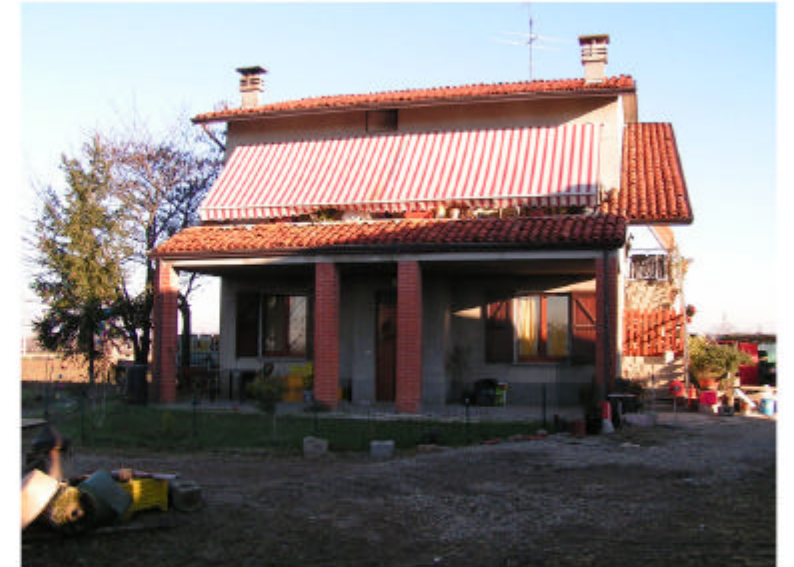
4. Edificio 3. Fronte ovest