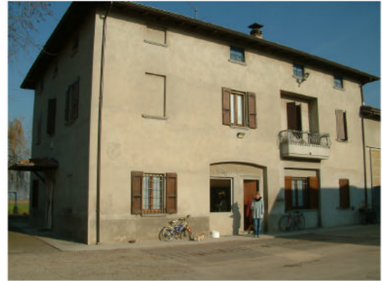
2. Edificio 1a-1b-1c. Fronte sud