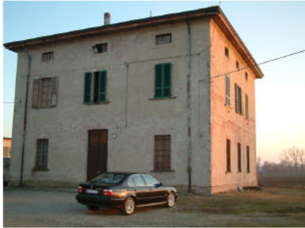
1. Edificio 1. Fronti nord e ovest