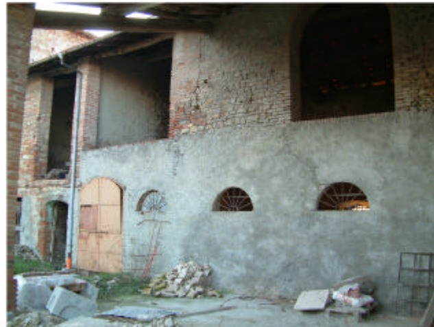
4. Edificio 1b-1c. Fronte est interno