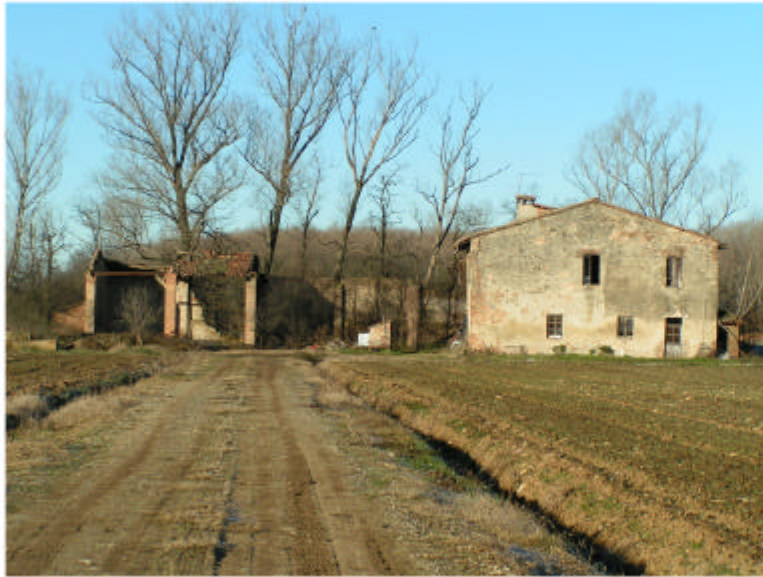
1. Vista da est