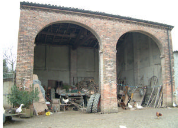
20. Edificio 13. Fronte est