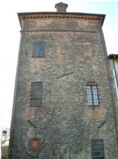
10. Edificio 4, parte 4a. Fronte est.