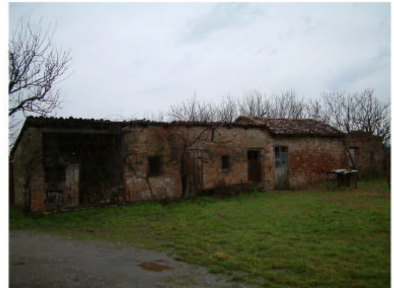
4. Edificio 3. Fronte ovest