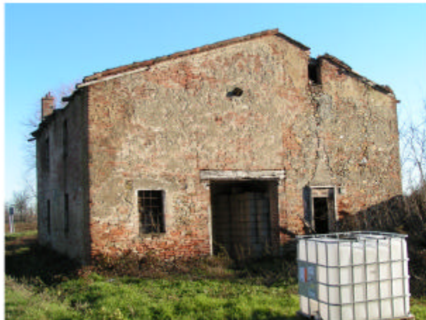
9. Edificio 3. Fronte ovest