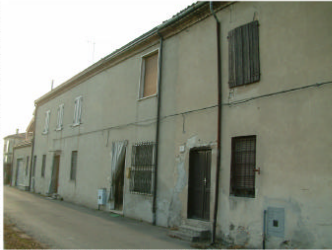
1. Edificio 2, parti 2m, 2l, 2i, 2g. Fronte est.