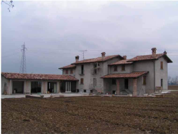
1. Vista generale