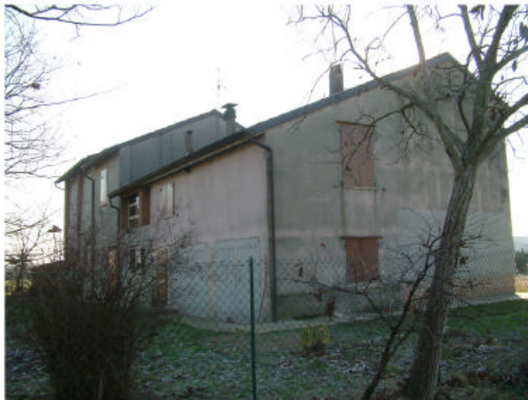
3. Edificio 1a. Fronti nord e ovest