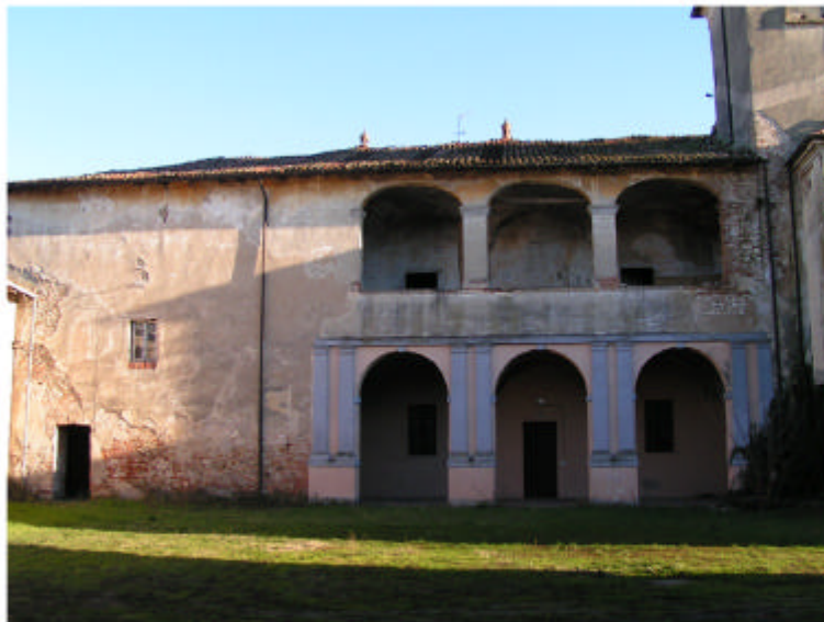
4. Edificio 1a. Fronte ovest