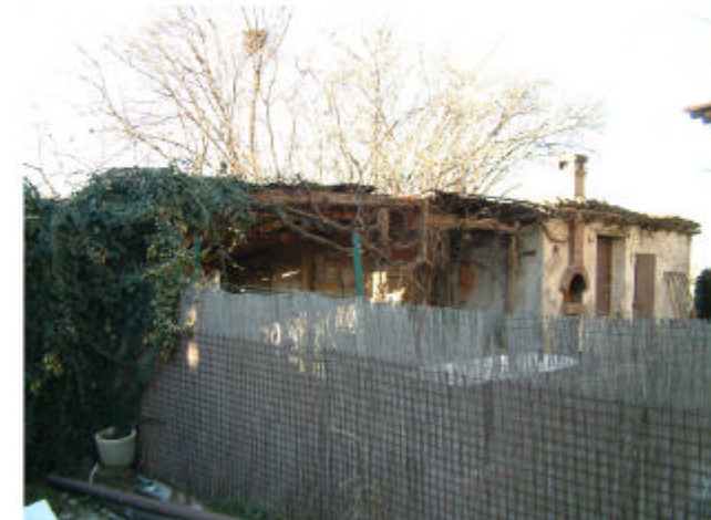
6. Edificio 3, Fronte nord-est