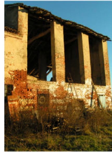
2. Edificio 1, parte 1b. Fronte ovest