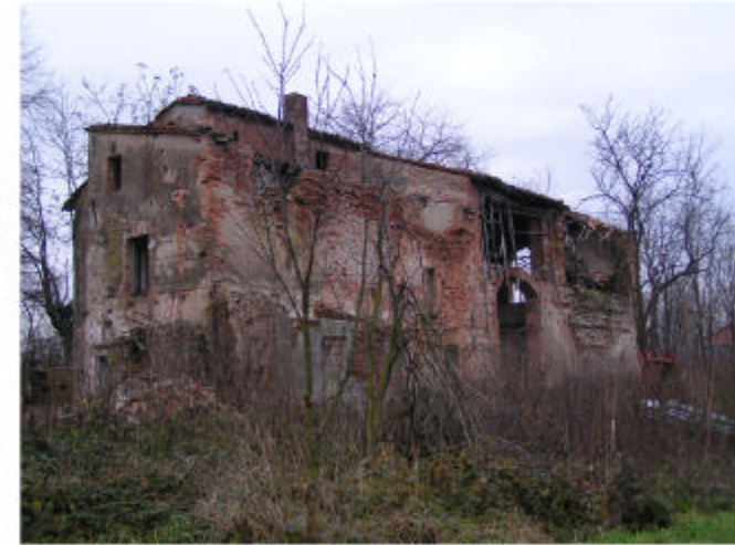
3. Edificio 1. Fronti nord e ovest.