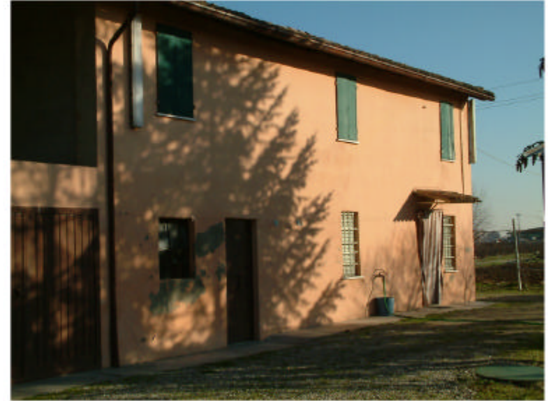
2. Edificio 1c. Fronte sud