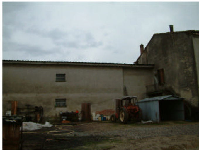
10. Edificio 1, parti 1a e 1b. Fronte nord.