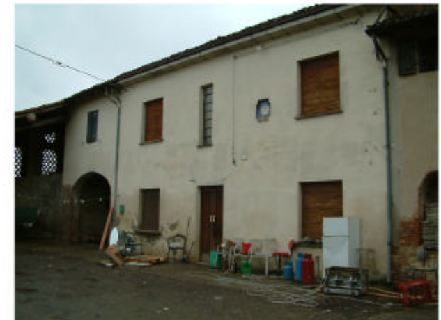
3. Edificio 1b. Fronte sud