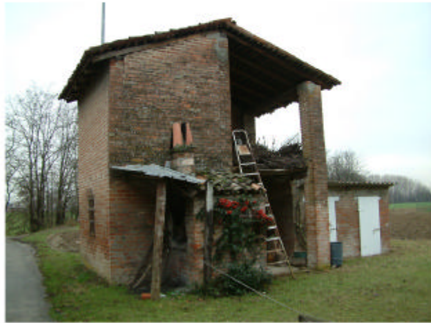
13. Edificio 10. Fronte est