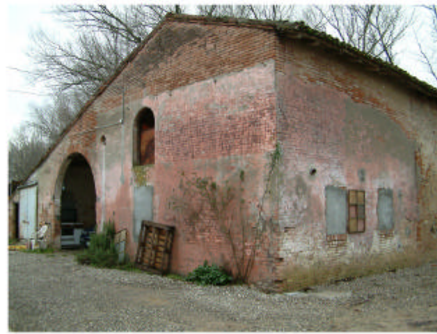
2. Edificio 2a. Fronte nord-est