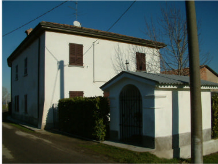
1. Edificio 1. Fronte sud-ovest