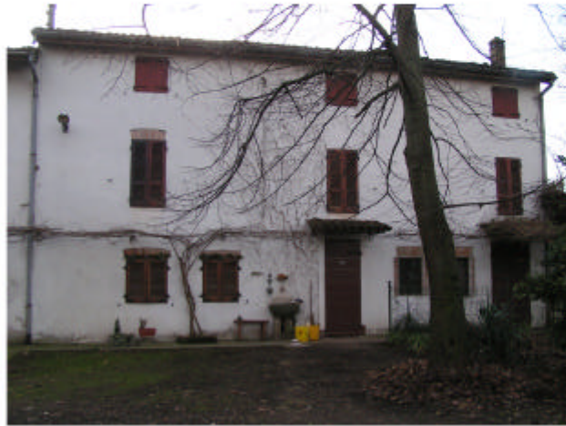
1. Edificio 1a. Fronte sud-est