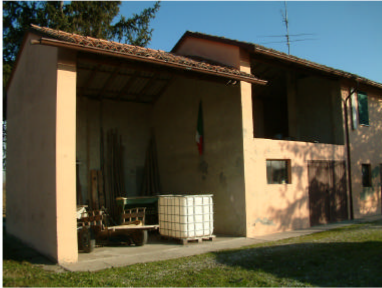
1. Edificio 1a-1b. Fronte sud