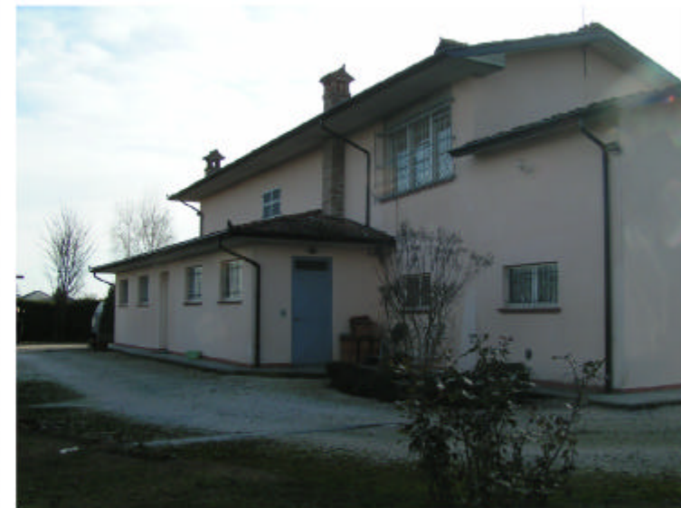
4. Fronte nord