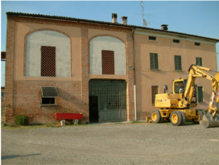
1. Edificio 1. Fronte sud.