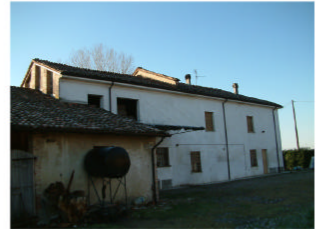
3. Edificio 1. Fronte nord