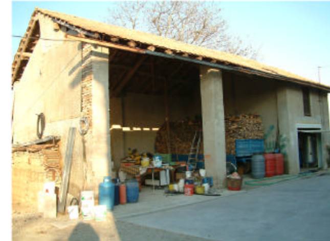
6. Edificio 4. Fronti ovest e sud