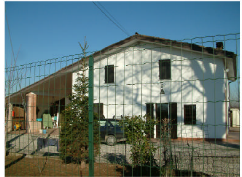
2. Edificio 1. Fronte sud