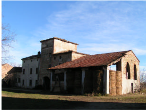
7. Edificio 5. Fronte ovest