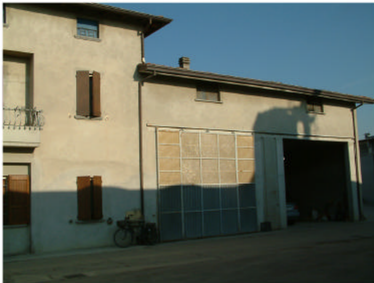
3. Edificio 1d. Fronte sud