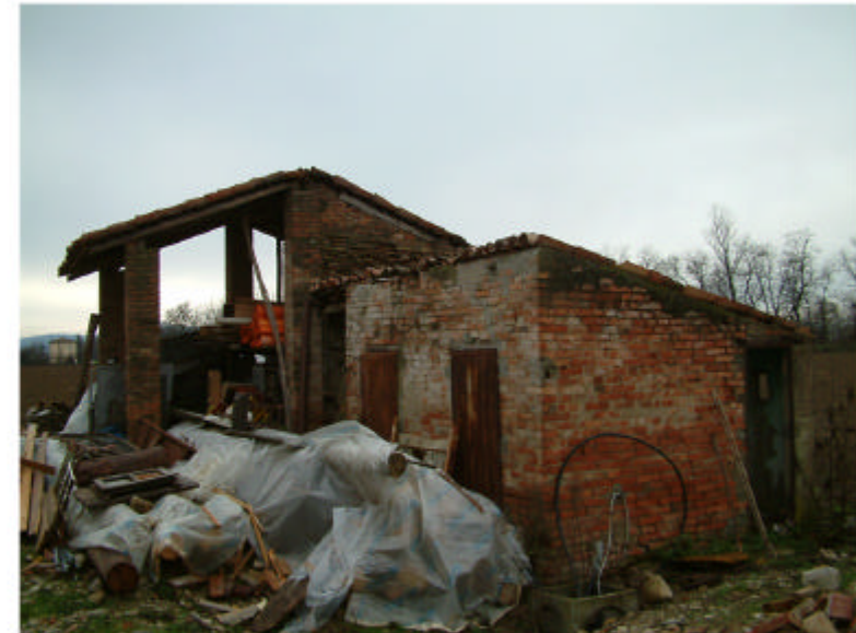
6. Edificio 2. Fronti est e nord.