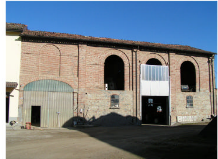
3. Edificio 1c-1d. Fronte sud