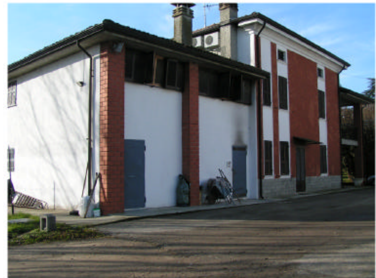
4. Edificio 2. Fronte nord