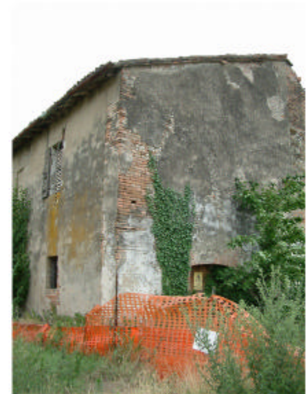
6. Edificio 3, parte 3a.