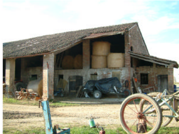
5. Edificio 2, parte 2b. Fronte est