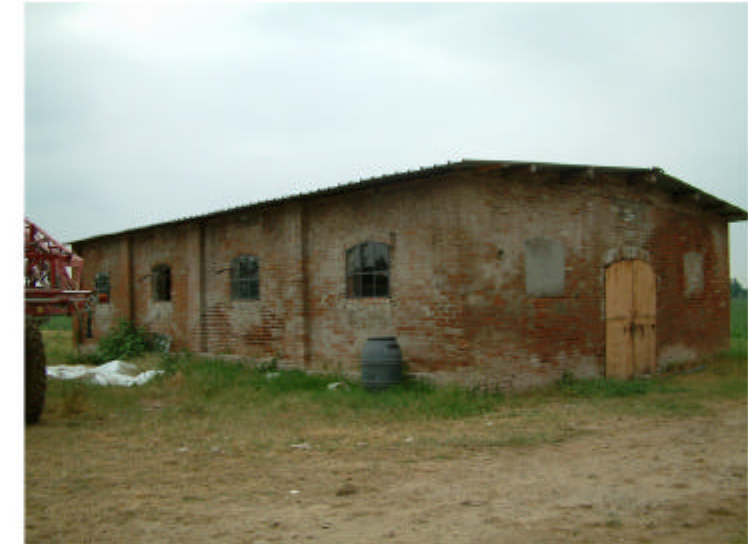
12. Edificio 4 Fronti sud ed est.