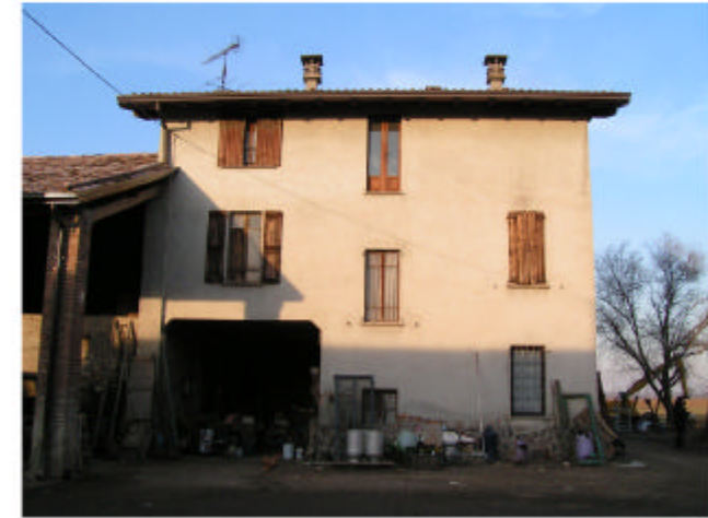
3. Edificio 1a-1b. Fronte sud