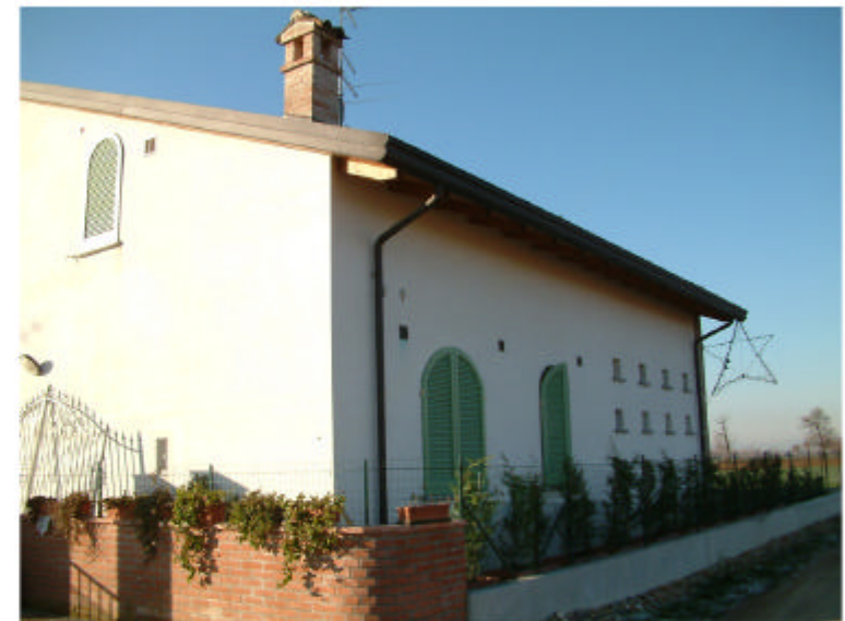
4. Edificio 1c. Fronte nord