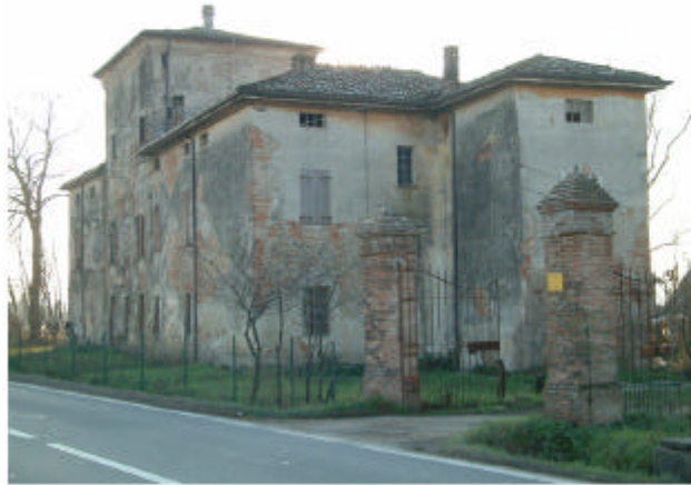
1. Edificio 1. Fronti est e nord. Vista dell'accesso