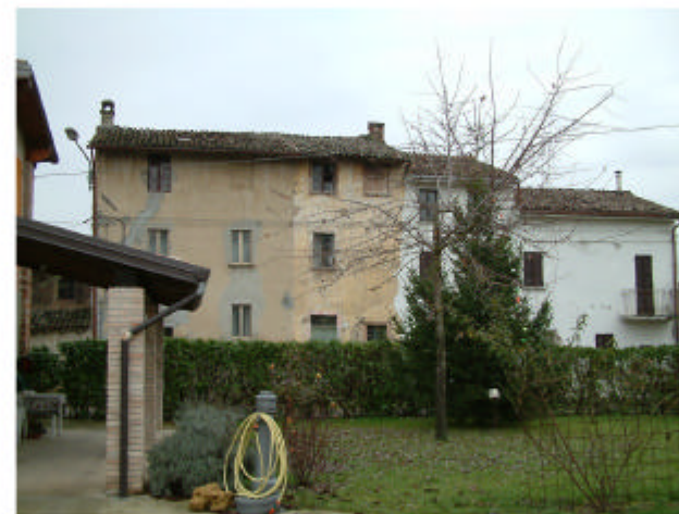
11. Edificio 9. Fronte sud