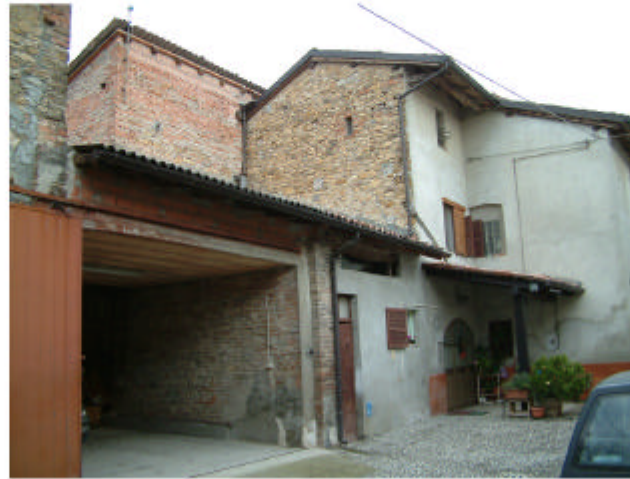
2. Edificio 1a-1b. Fronte sud