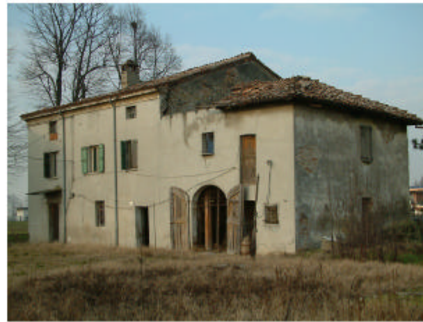
2. Edificio 1. Fronte sud