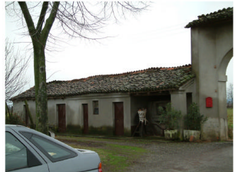
8. Edificio 3. Fronte nord