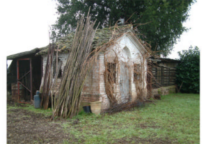
6. Edificio 3. Fronti nord e ovest