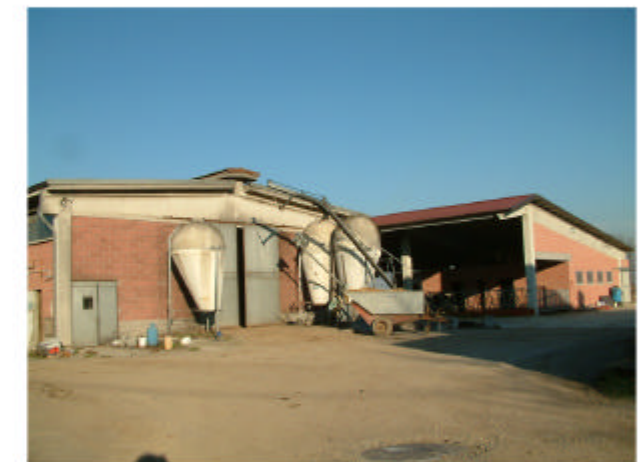
6. Edificio 3-4