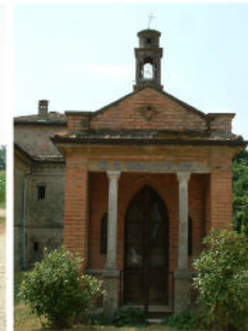
18. Edificio 7.