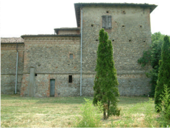
4. Edificio 1, partl 1e e 1h. Fronte ovest