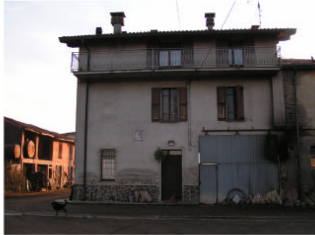
1. Edificio 1a. Fronte nord