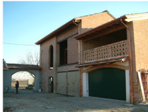
5. Edificio 2. Fronte sud-ovest