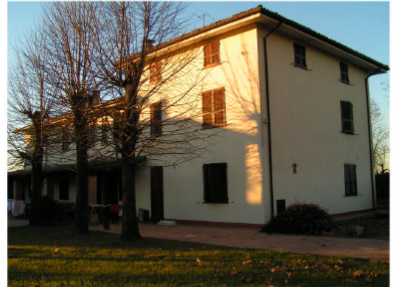
2. Edificio 1. Fronte sud-est