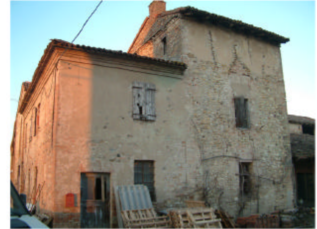
3. Edificio 2b. Fronte sud