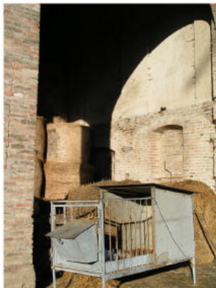
10. Edificio 3f. Parete interna