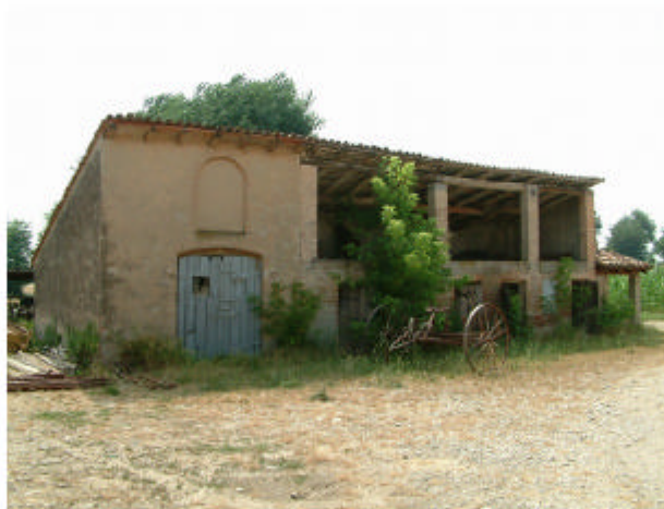
17. Edificio 5. Fronti nord e ovest