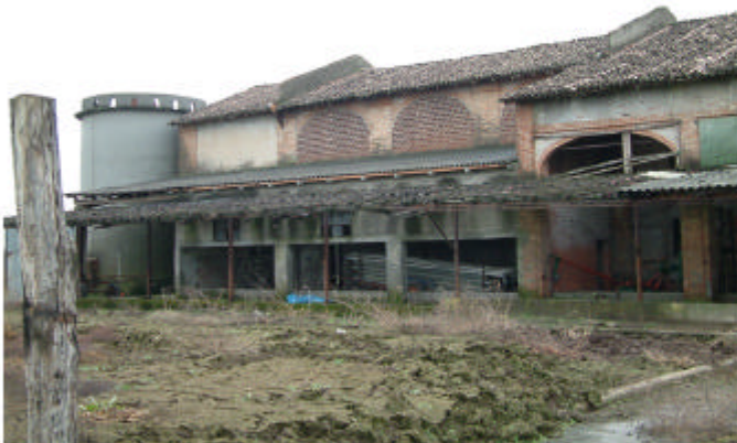
4. Edificio 2, parte 2a. Fronte nord.