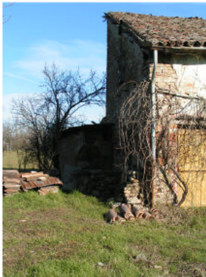
3. Fronte ovest