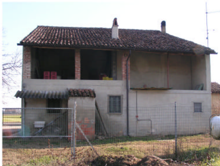
3. Edificio 1b. Fronte ovest