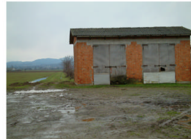
6. Edificio 4. Fronte nord