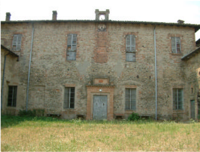
8. Edificio 1, parte 1h. Fronte nord