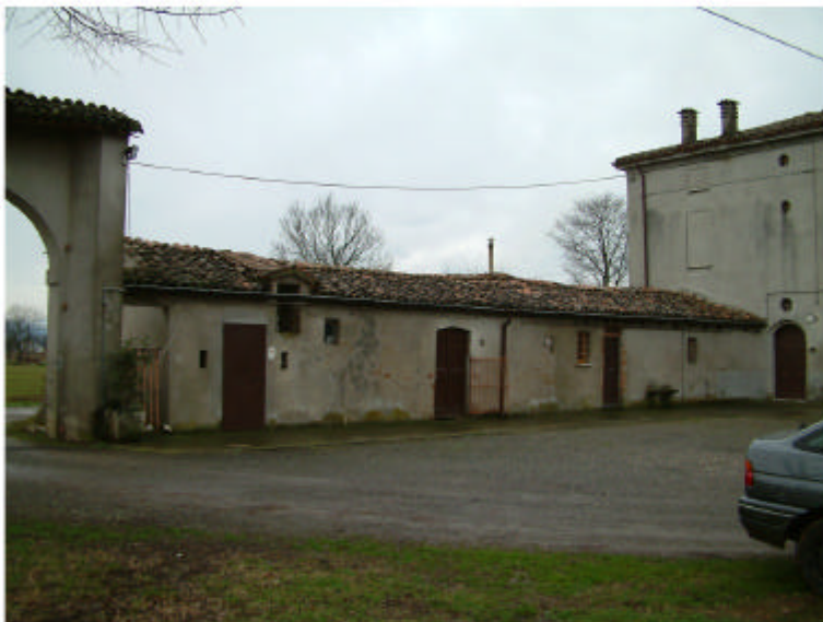
3. Edificio 1a. Fronte nord