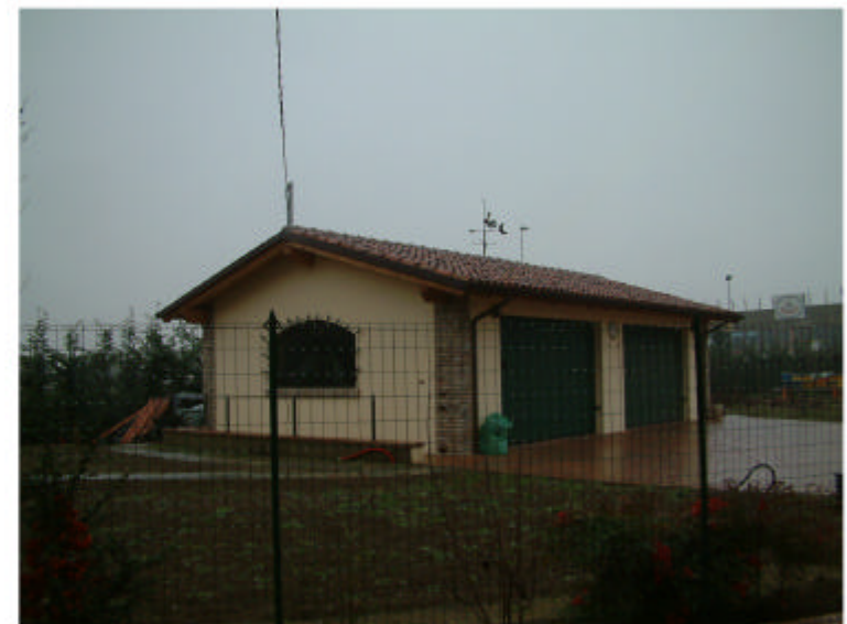
4. Edificio 4. Fronti sud ed est.