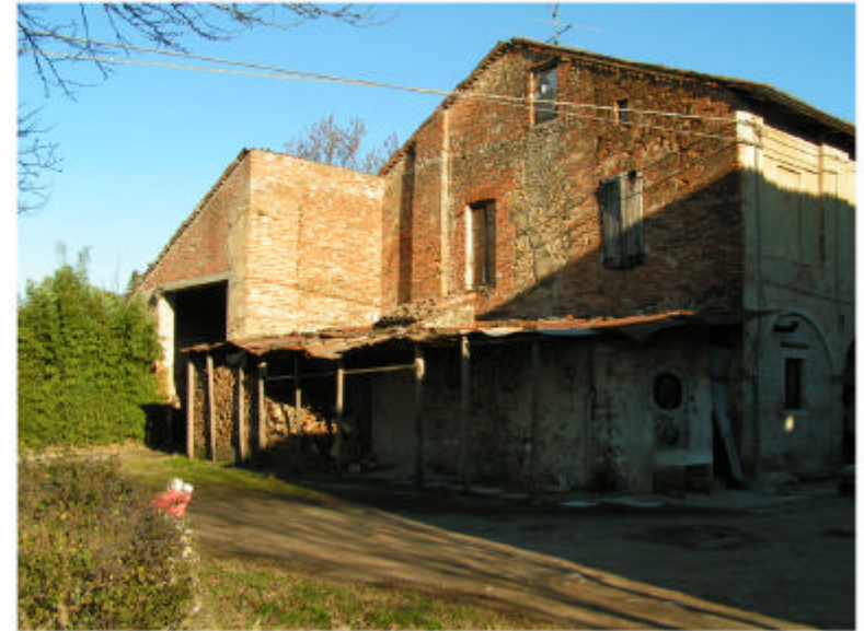
2. Edificio 1. Fronte ovest