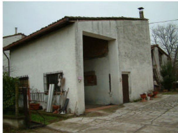
22. Edificio 15. Fonte sud-est