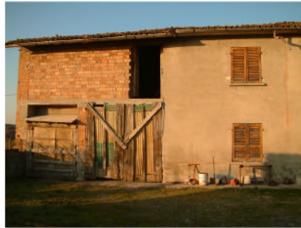
2. Edificio 1. Fronte sud