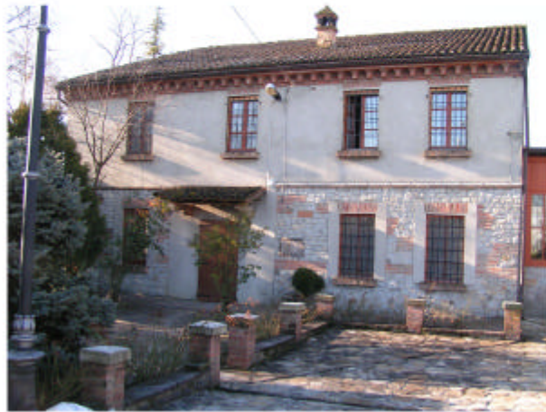
1. Edificio 1a. Fronte nord-est