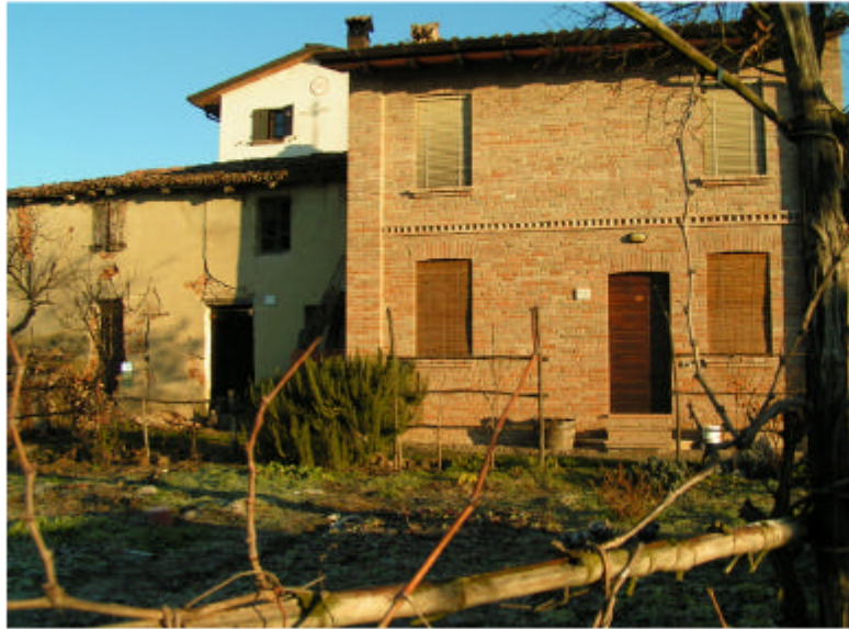
7. Edifici 1b-1c. Fronte sud