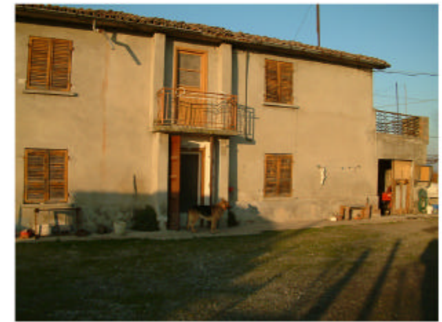
3. Edificio 1. Fronte sud