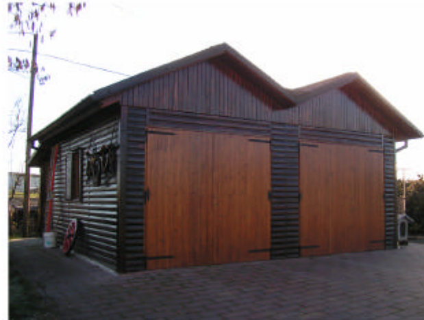
5. Edificio 3. Fronte nord