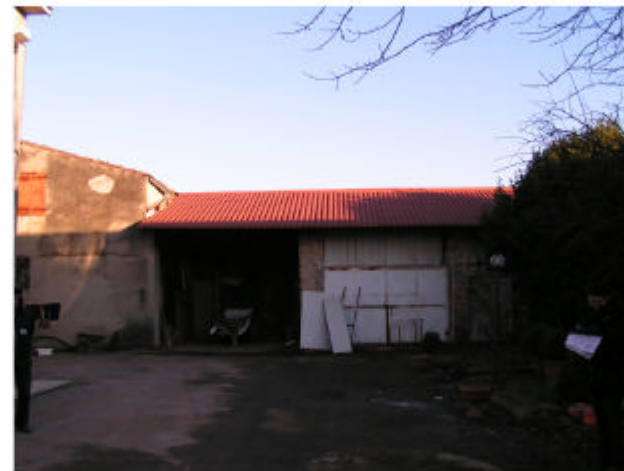
11. Edificio 4g, 4h. Fronte ovest