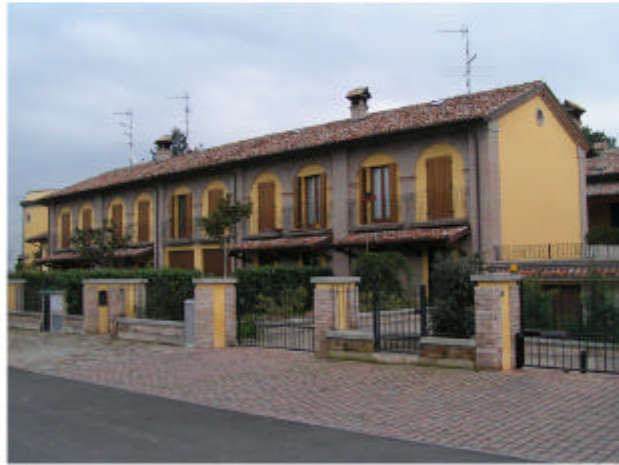
1. Edificio 1. Fronte ovest