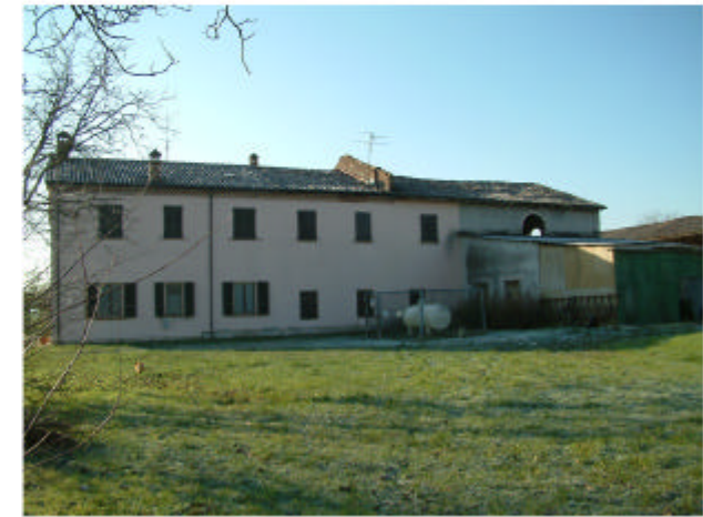
3. Edificio 1. Fronte nord