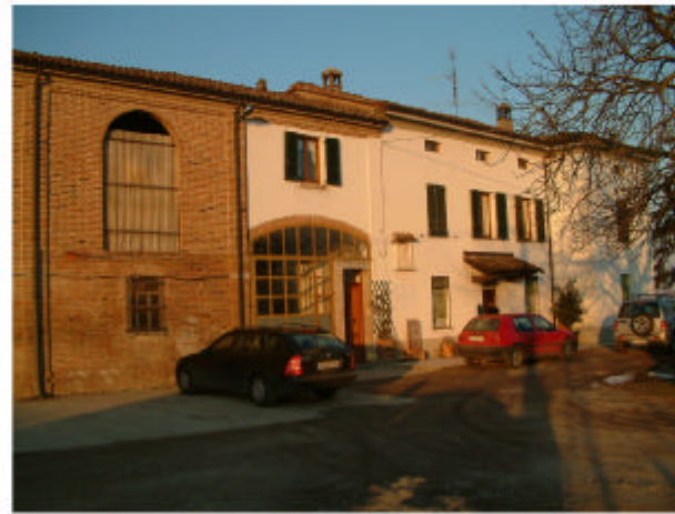
2. Edificio 1b, 1c. Fronte sud