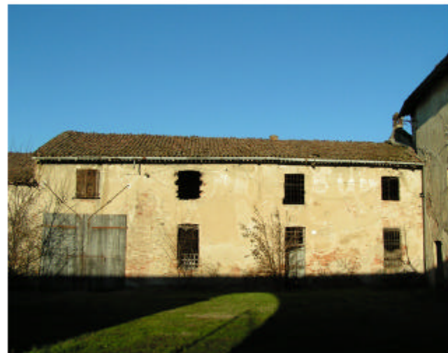
10. Edificio 1c-1d. Fronte sud