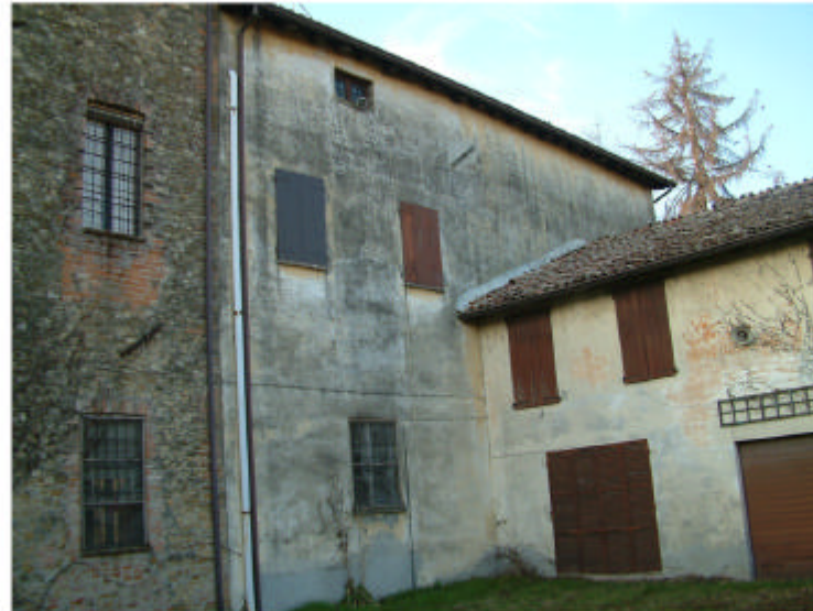
11. Edificio 4. Fronti est e sud.