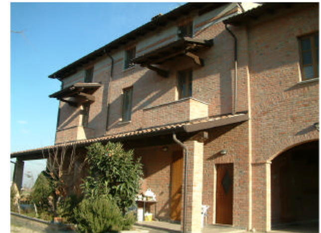
3. Edificio 1a. Fronte sud-ovest