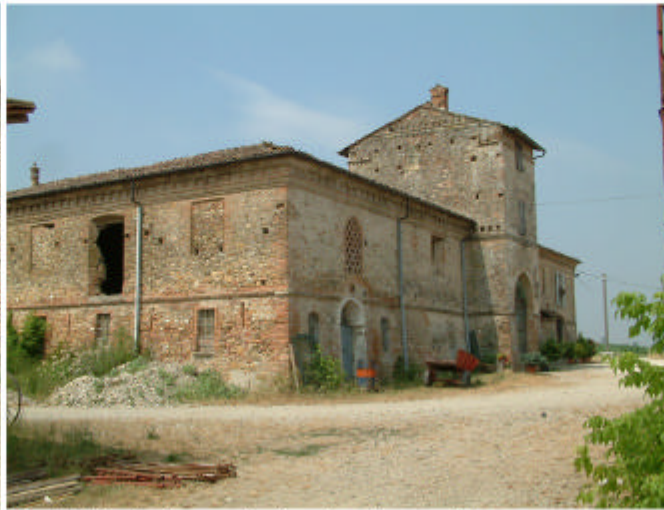
2. Edificio 1, parti 1c, 1a, 1g e 1b. Fronti est e nord