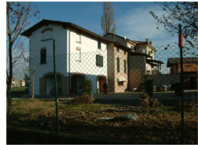
3. Edificio 1b. Fronti ovest e sud