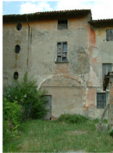
2. Edificio 1, parte 1b. Fronte est.