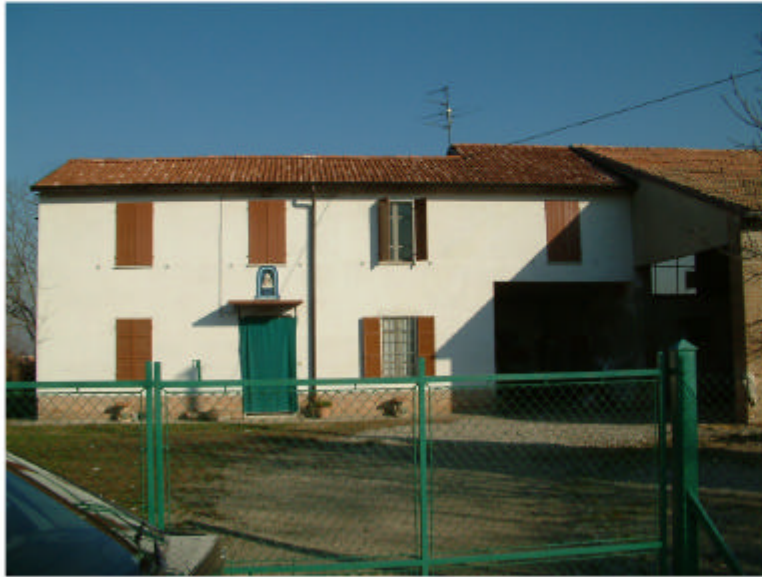
1. Edificio 1a-1b. Fronte sud