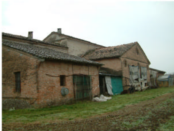
4. Edificio 2. Fronte ovest