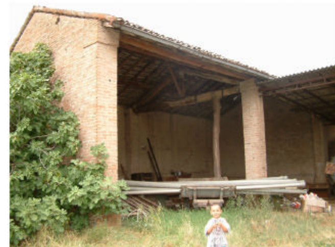
3. Edificio 2, parte 2a. Fronte est.