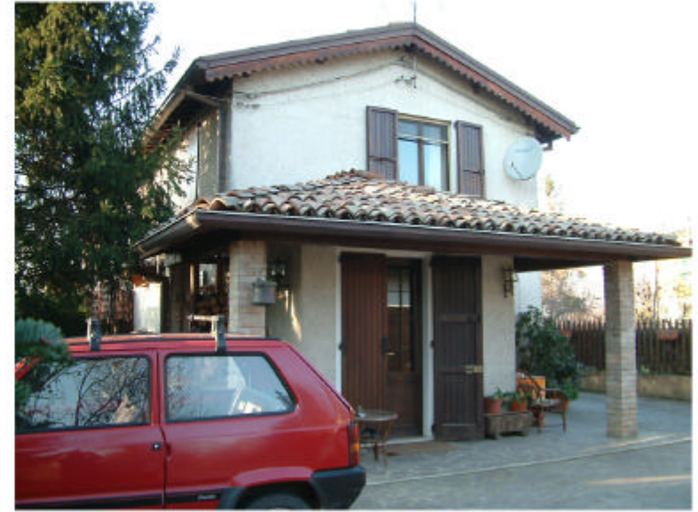
2. Edificio 1d. Fronte est