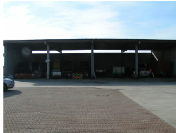
5. Edificio 3. Fronte nord-est