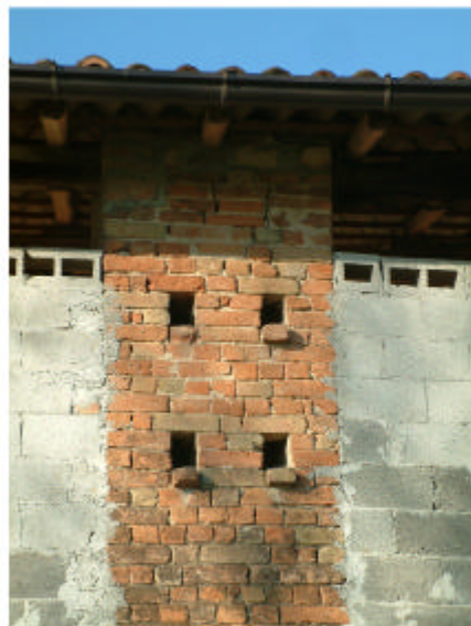
4. Edificio 1c. Particolare pilastro