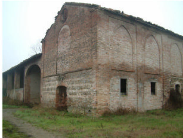
5. Edificio 1c-1d. Fronte sud-ovest