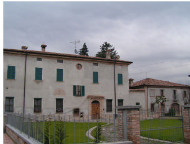
11. Edificio 6c. Fronte sud