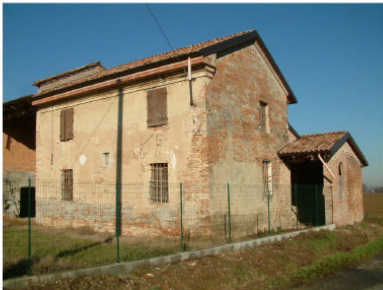
3. Edificio 1. Fronti sud ed est