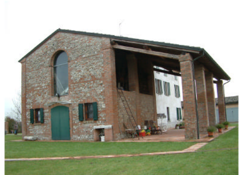
2. Edificio 1a. Fronte nord