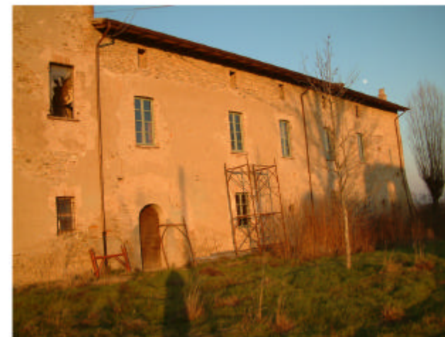
5. Edificio 1a. Fronte sud esterno