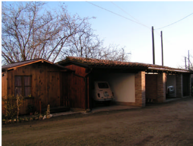
9. Edificio 2. Fronte sud