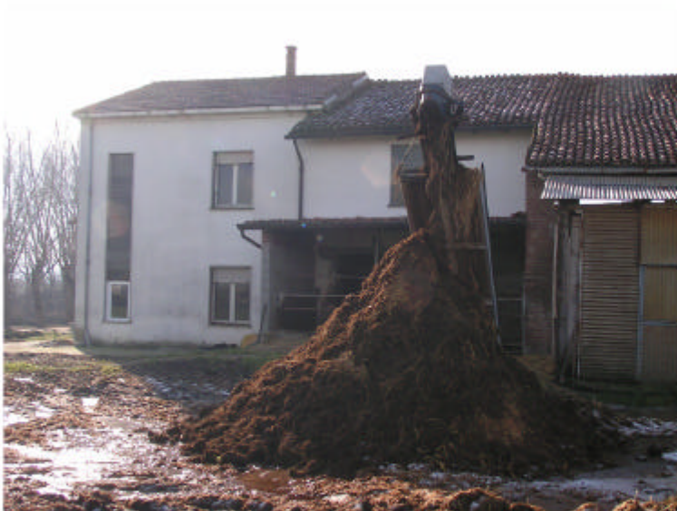
3. Edificio 1, parti 1c, 1b. Fronte nord