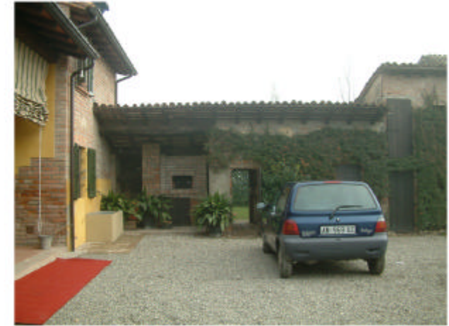
3. Edificio 1d. Fronte ovest