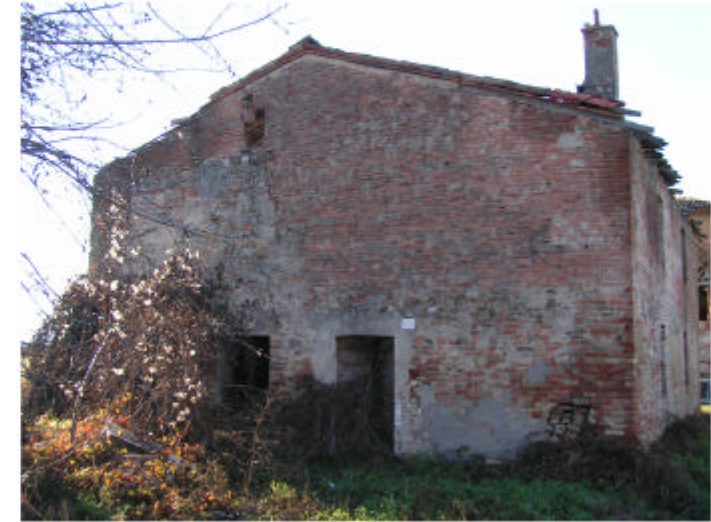
8. Edificio 3. Fronte est