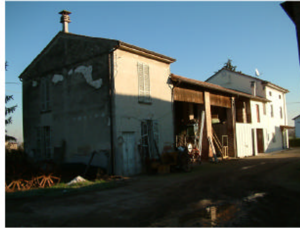
2. Edificio 1. Fronte sud-est