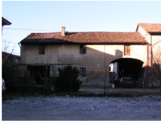
7. Edificio 3a-3b. Fronte est