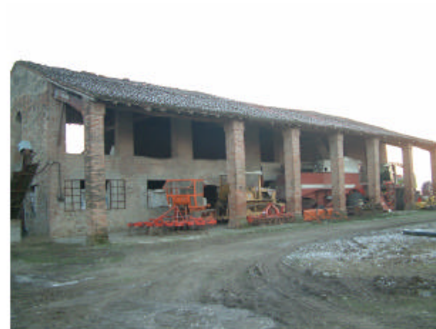
5. Edificio 2a. Fronte nord