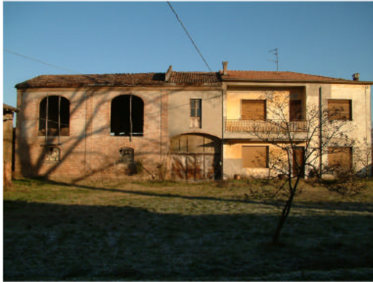
1. Edificio 1. Fronte sud