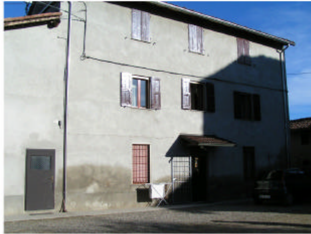
1. Edificio 1a. Fronte sud