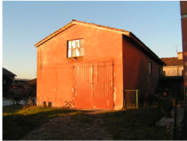
13. Edificio 5b. Fronte sud