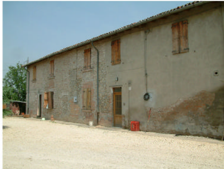
2. Edificio 1, parte 1a. Fronte sud.