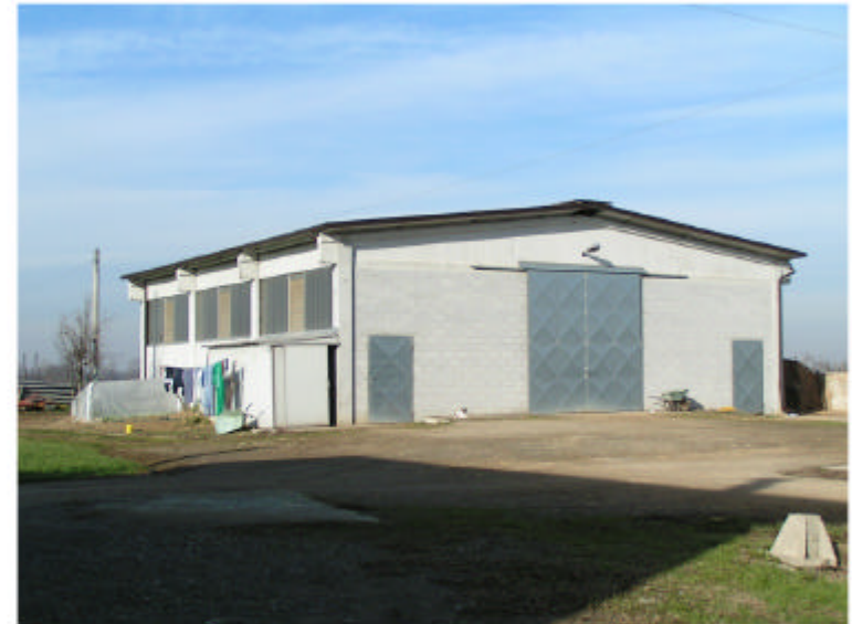
4. Edificio 3. Fronte est