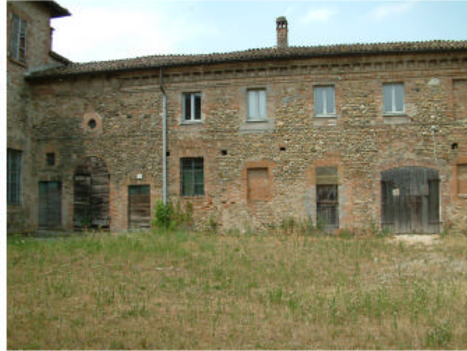
9. Edificio 1, parti 1h e 1e. Fronte est.