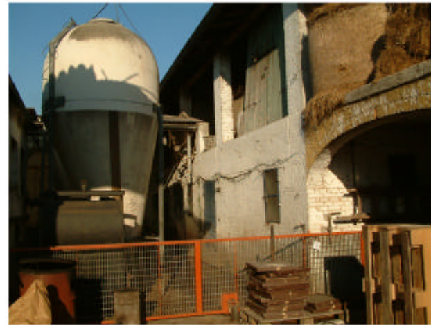
5. Edificio 3a. Fronte ovest