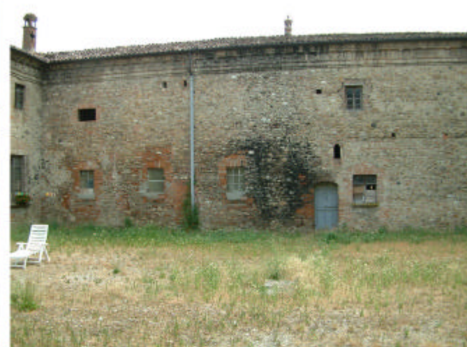
12. Edificio1, parti 1c e 1f. Fronte ovest