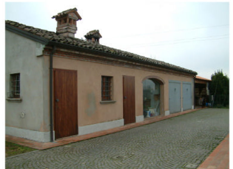
4. Edificio 2. Fronte nord