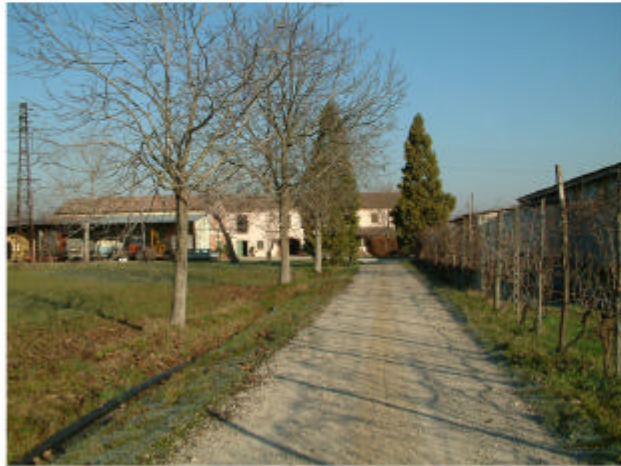
1. Accesso da sud