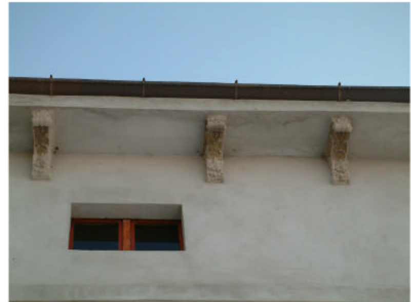
4. Edificio 1. Particolare cornicione