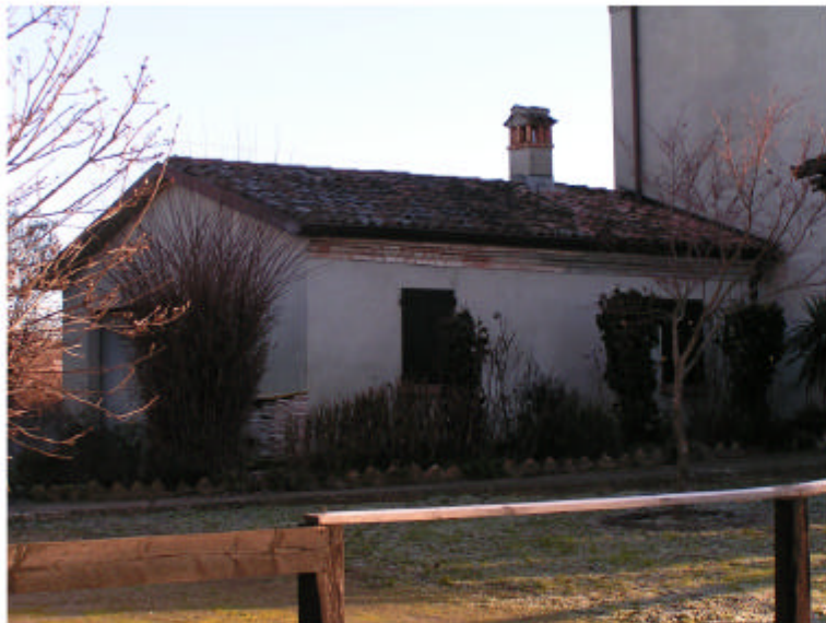
3. Edificio 1. Fronte sud-ovest