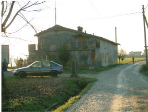
1. Vista da est