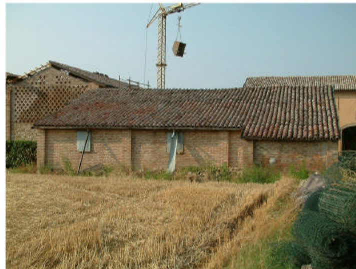
5. Edifici 3. Fronte sud