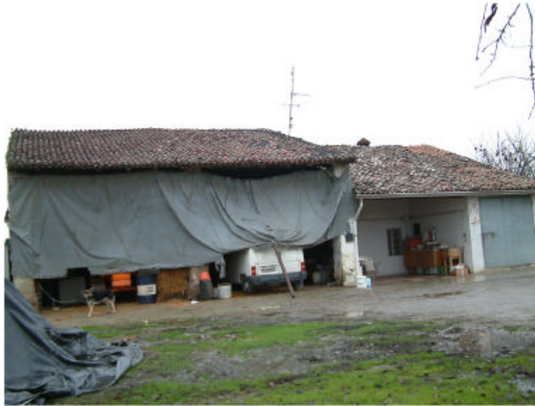
1. Edificio 1. Fronte sud