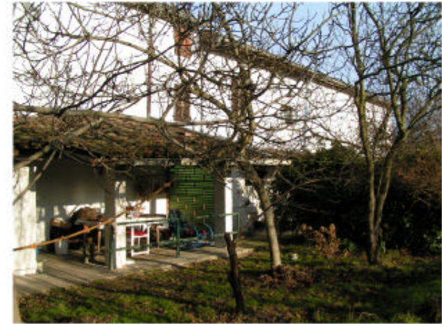
3. Edificio 1. Fronte nord-ovest