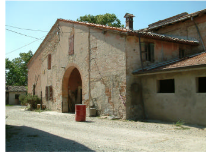
3. Edificio 1, parti 1a, 1b, 1c, 1d e 1e. Fronte sud