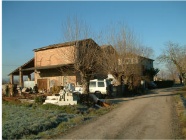
1. Accesso dalla strada di S. Chiara