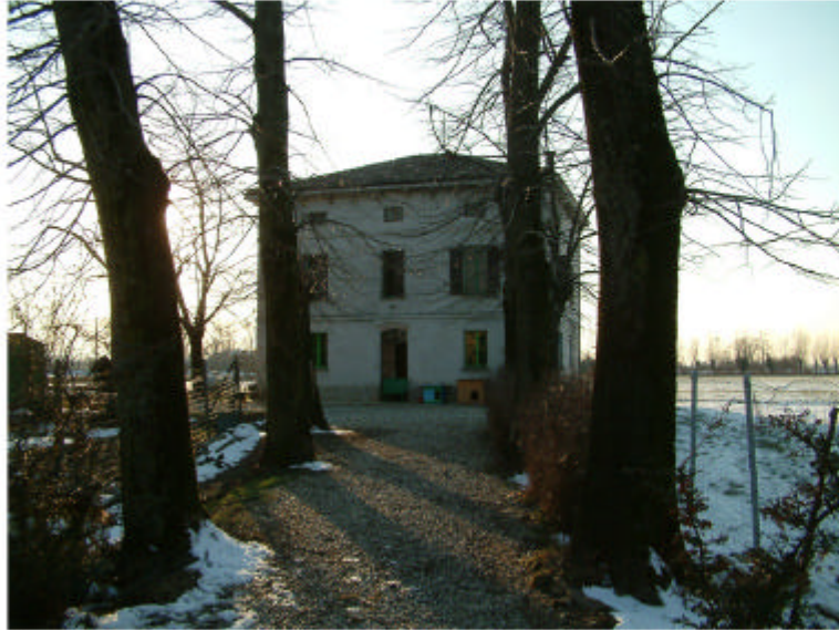
1. Edificio 1 visto dalla strada di accesso a Est