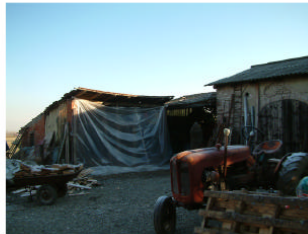
5. Edificio 2