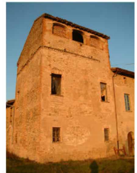
6. Edificio 1a. Fronti ovest e sud esterni