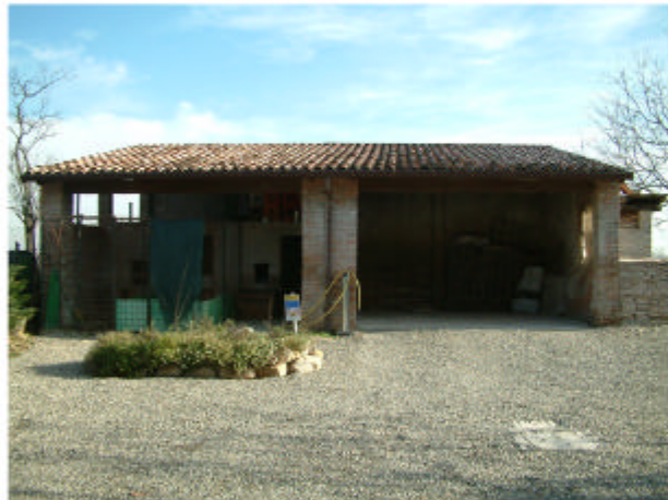
16. Edificio 9. Fronte ovest