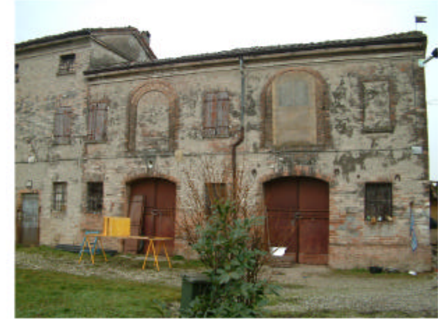
3. Edificio 2a. Fronte est