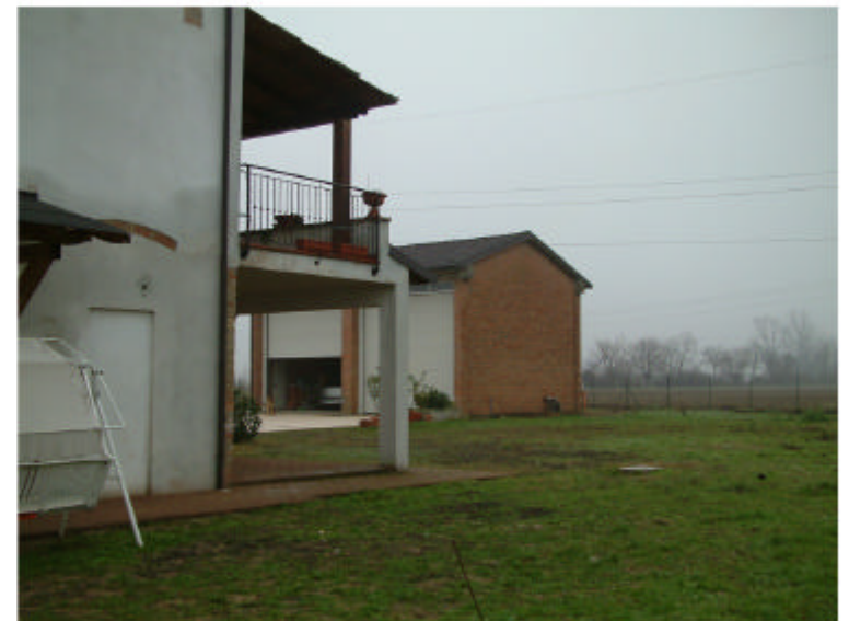
4. Edificio 2. Fronte nord