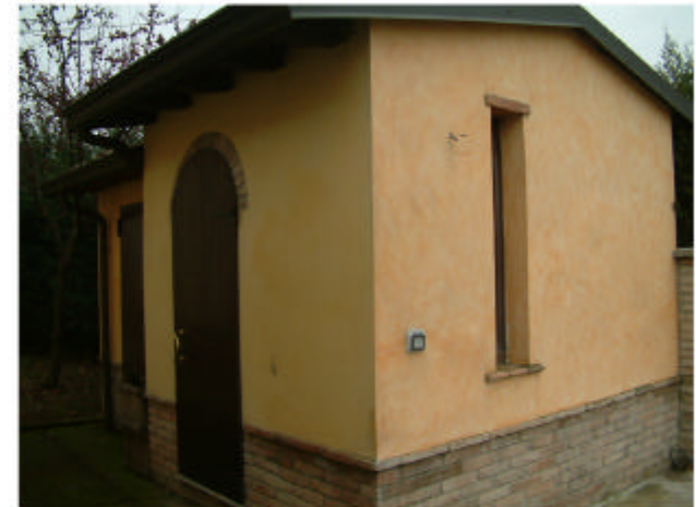
6. Edificio 3. Fronti sud-ovest e sud-est