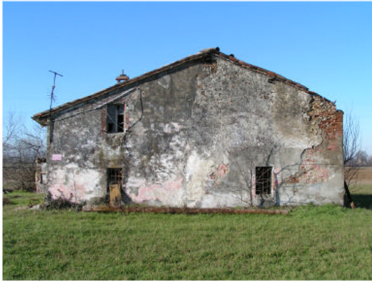
1. Fronte est