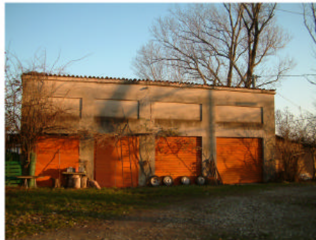
5. Edificio 3. Fronte ovest