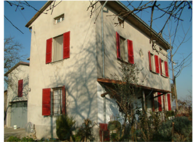
2. Edificio 1a. Fronti sud ed est