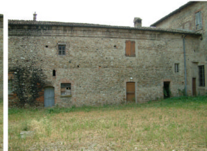
13. Edificio 1, parti 1f e 1i. Fronte ovest.