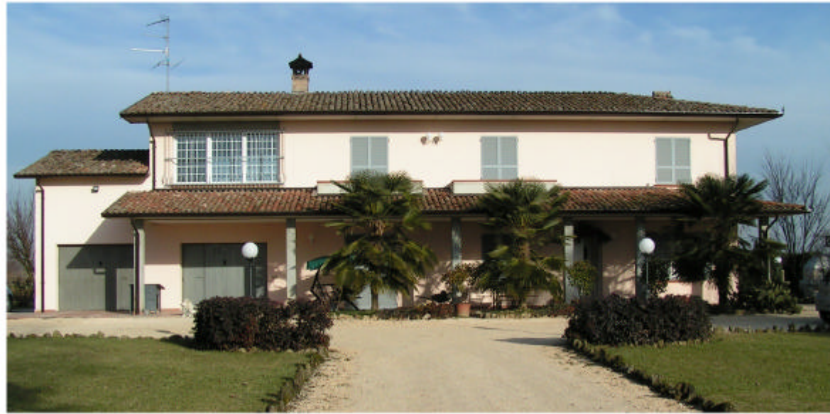
1. Fronte sud