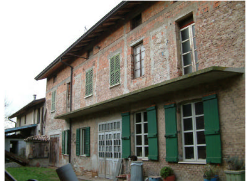
2. Edificio 1. Fronte sud