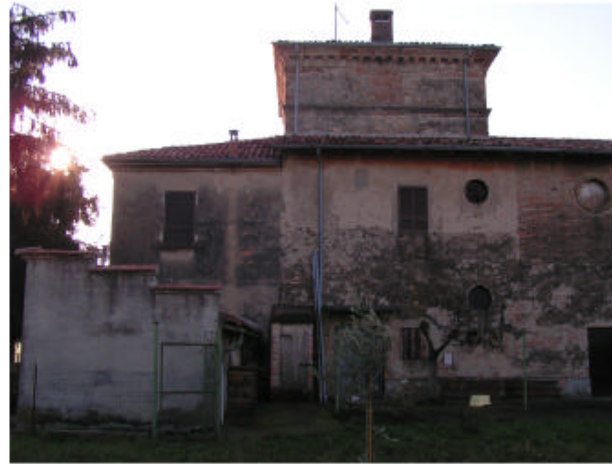
6. Edificio 1, parti 1a e 1b. Fronte nord.