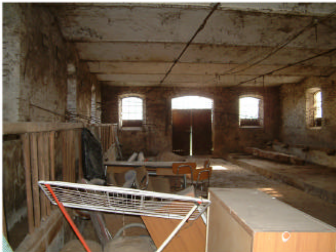
4. Edificio 2, parte 2a. Interno.