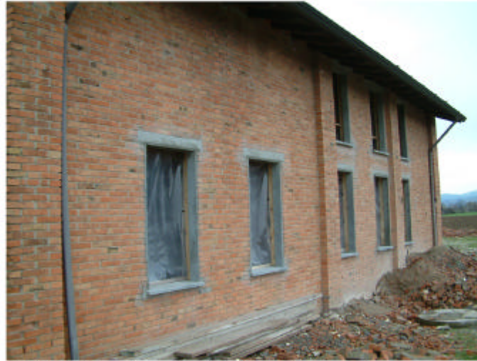
2. Edificio 1, parte 1b. Fronte ovest.