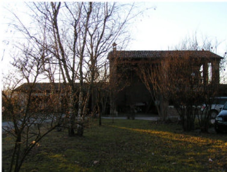
3. Edificio 2. Fronte est