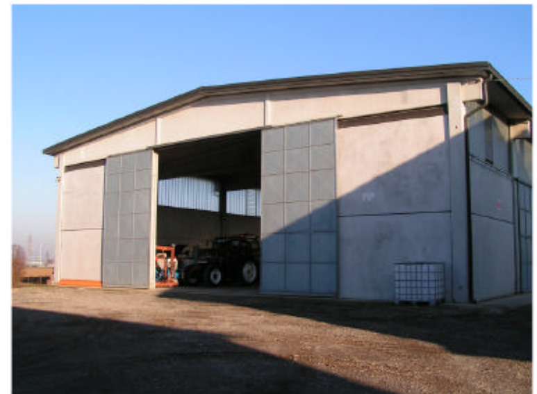
4. Edificio 4. Fronte ovest