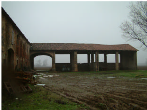
4. Edificio 1. Fronte est