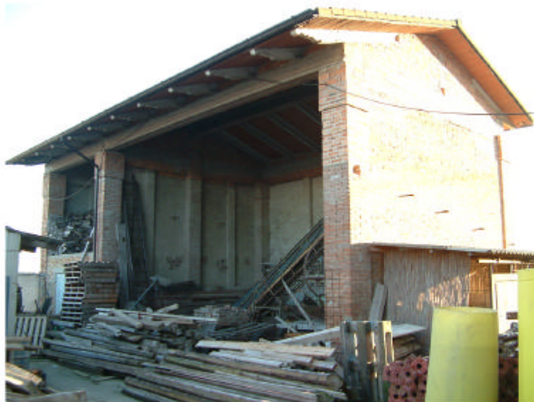
3. Edificio 2. Fronte ovest