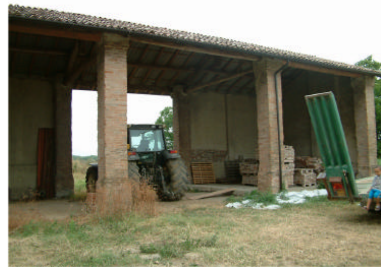
9. Edificio 2, parte 2d. Fronte nord.