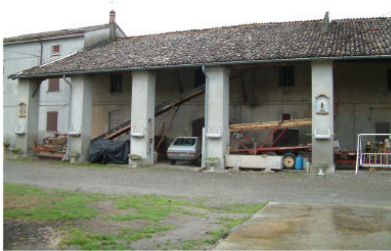
5. Edificio 1c. Fronte est