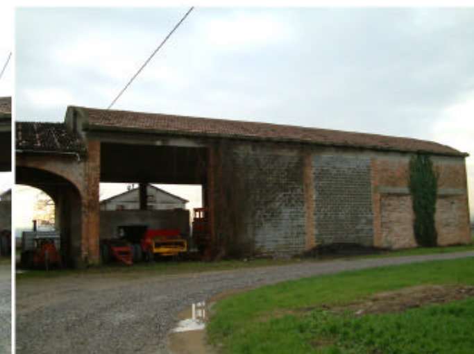
6. Edificio 2, parte 2d. Fronte nord.