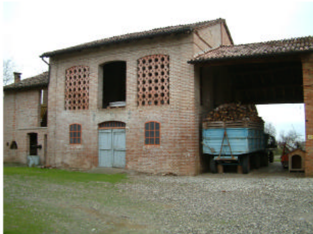
4. Edificio 2. Fronte ovest