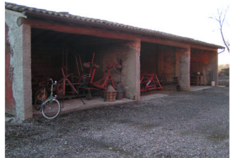
4. Edificio 3. Fronte nord