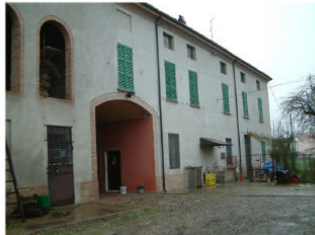
4. Edificio 1. Fronte sud