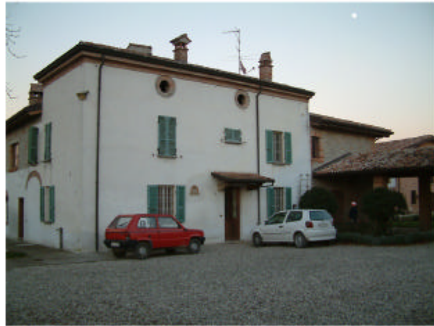
1. Edificio 1a-1c. Fronte sud