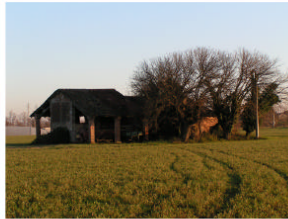
2. Vista da Nord-Ovest