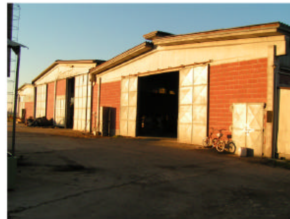
17. Edificio 9