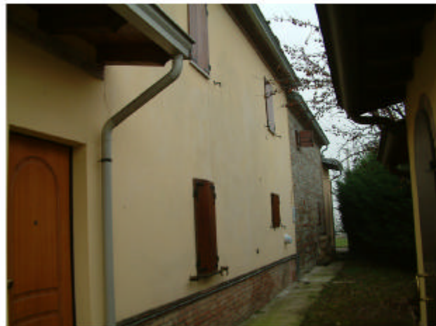
4. Edificio 1. Fronte nord-est