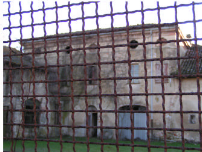
11. Edificio 1a. Fronte nord