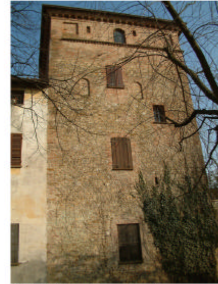
9. Edificio 4, parte 4a. Fronte ovest.