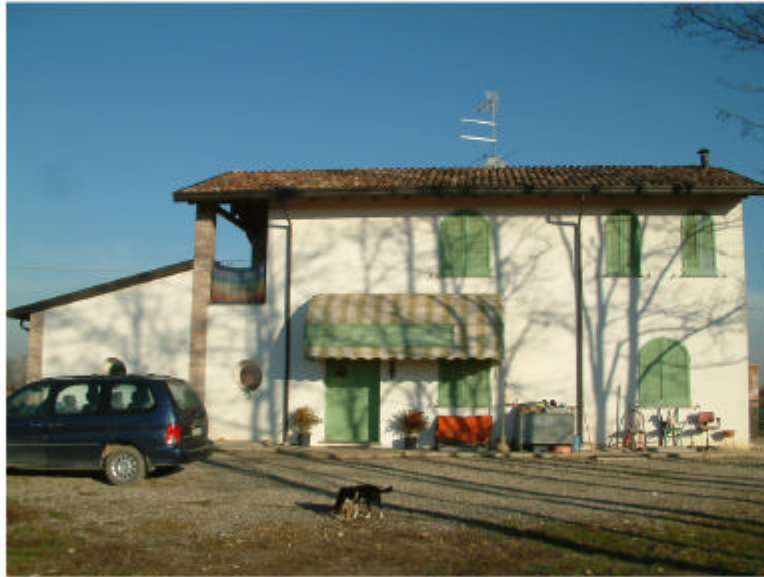
1. Edificio 1. Fronte sud