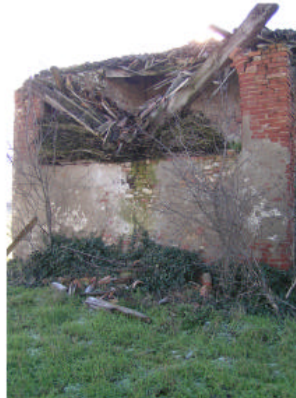
4. Fronte nord