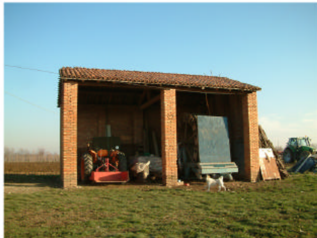
4. Edificio 2. Fronte ovest