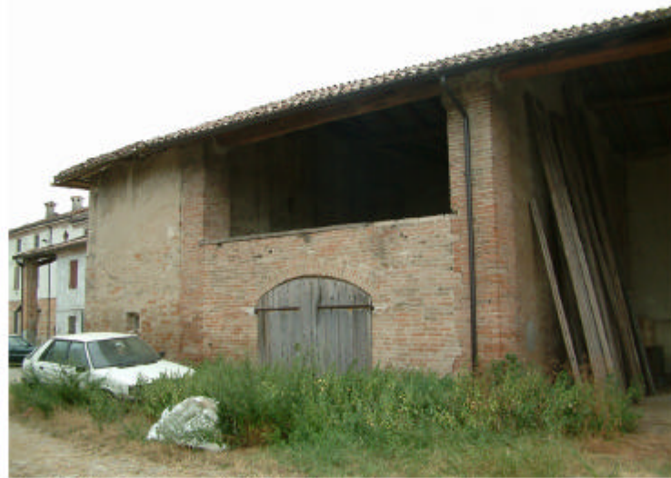
8. Edificio 2, parte 2d. Fronte nord.