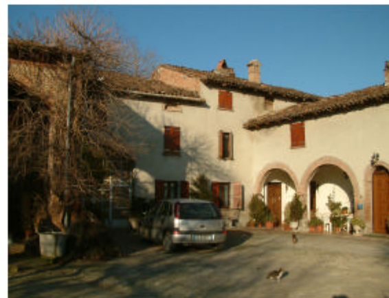
5. Edifici 1b-1c-1d-1e. Fronti sud ed est