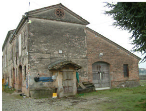
5. Edificio 2. Fronte nord