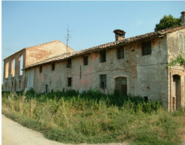
5. Edificio 1. Fronte nord