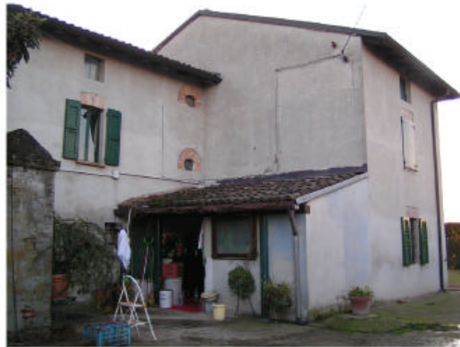
4. Edificio 1, parte 1a. Fronti nord e est