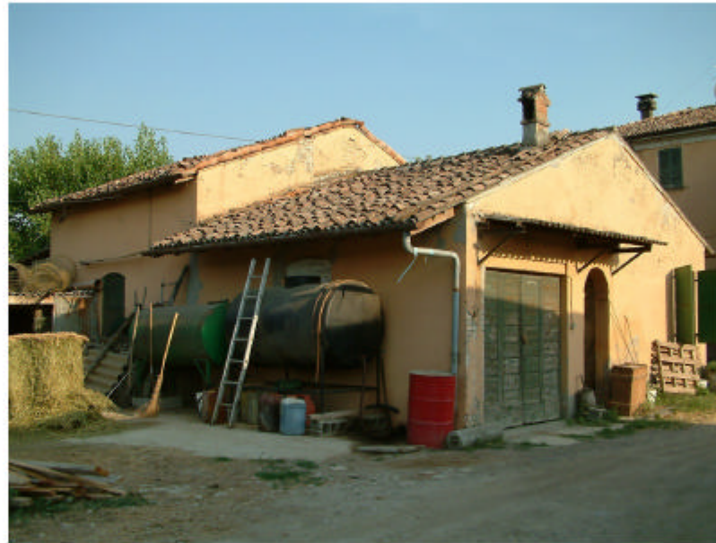
5. Edifici 2. Fronti nord e ovest