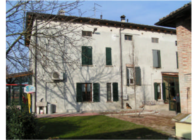
3. Edificio 1a. Fronte est