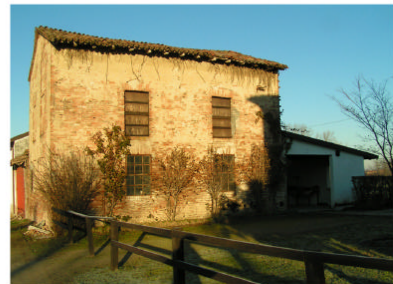
4. Edificio 2. Fronte est