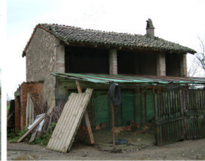
9. Edificio 3. Fronte ovest.