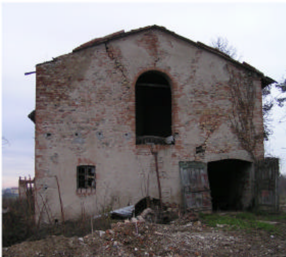
4. Edificio 1, parte 1c. Fronte sud.