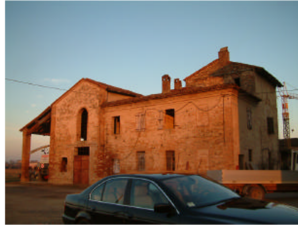
2. Edificio 2. Fronte ovest