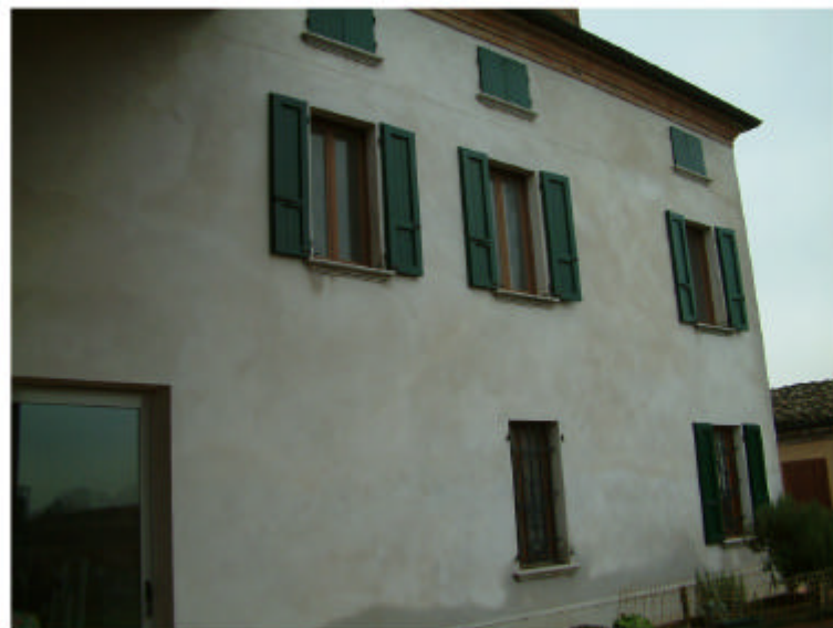
3. Edificio 1c. Fronte ovest