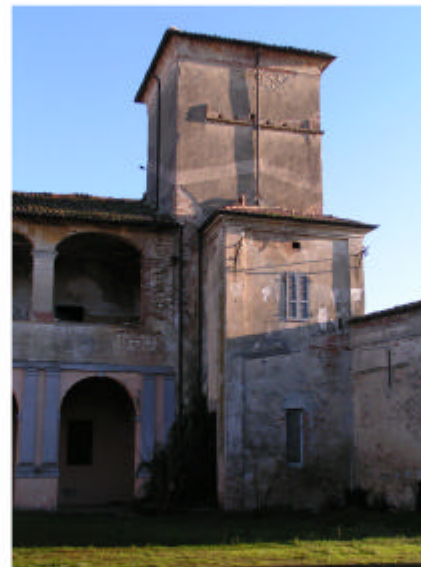
5. Edificio 1a. Fronte ovest