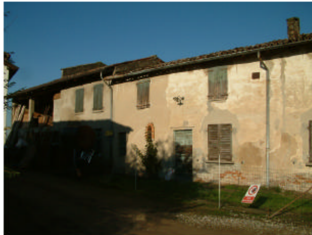
4. Edificio 3a-3b. Fronte sud