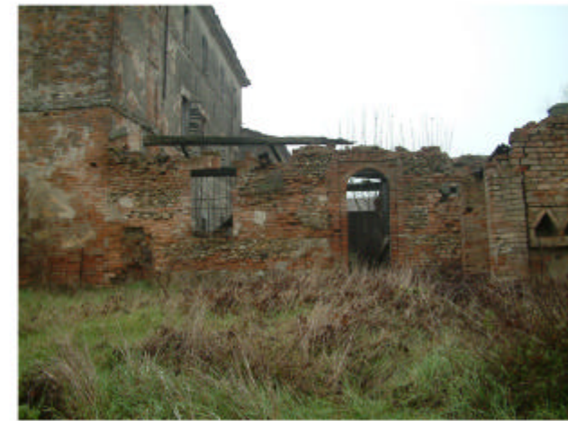
9. Edificio 1h. Fronte est