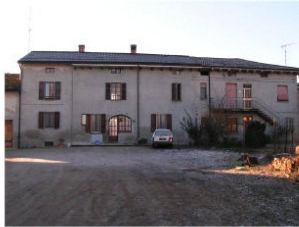
2. Edificio 1b-1c. Fronte nord