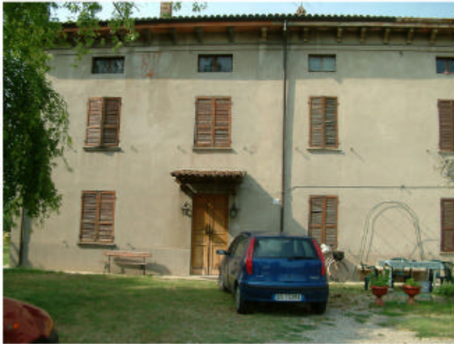
1. Edificio 1, parte 1a. Fronte sud.