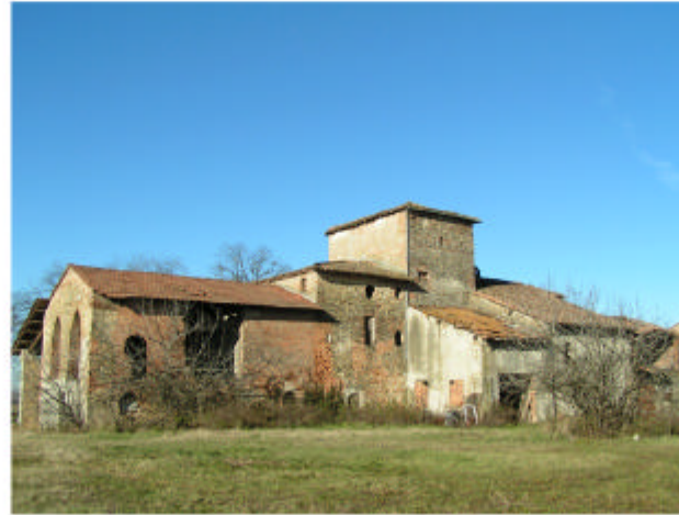
8. Edificio 5. Fronte est