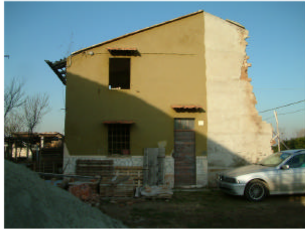
1. Edificio 1. Fronte sud