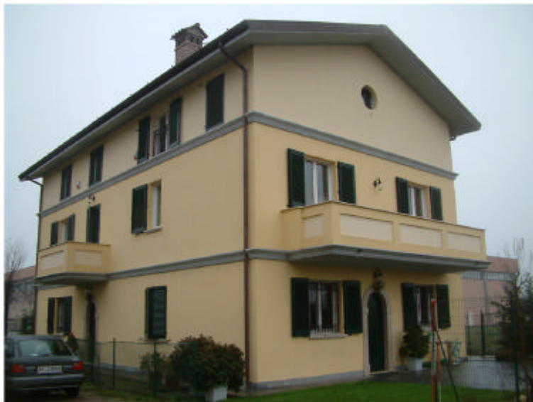
3. Edificio 3. fronti est e nord.