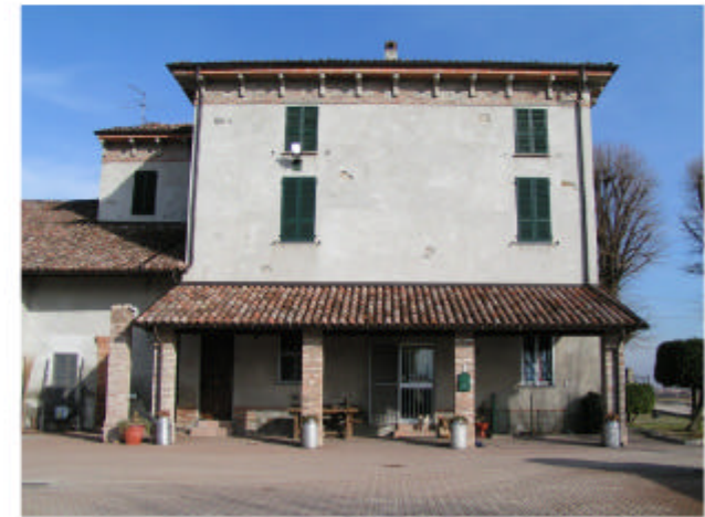
3. Edificio 1a. Fronte sud-ovest