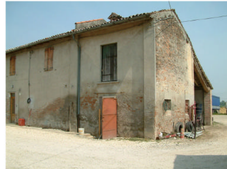
3. Edificio 1, parte 1b. Fronte sud.