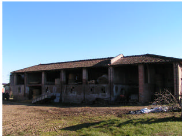
4. Edificio 3. Fronte ovest