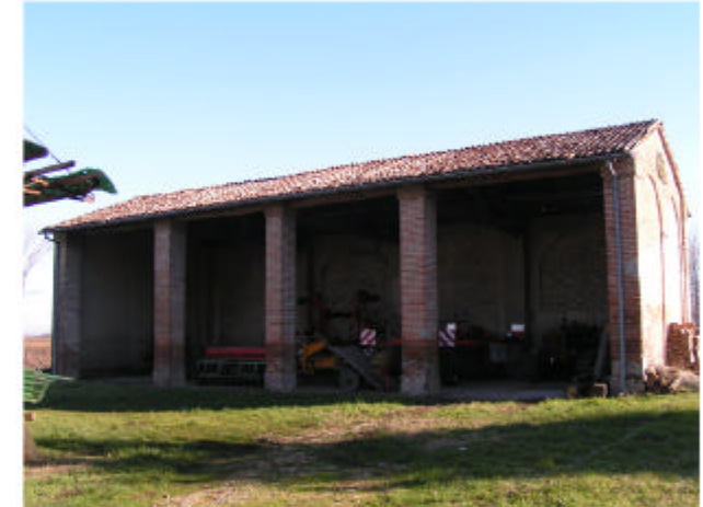
6. Edificio 4. Fronte ovest