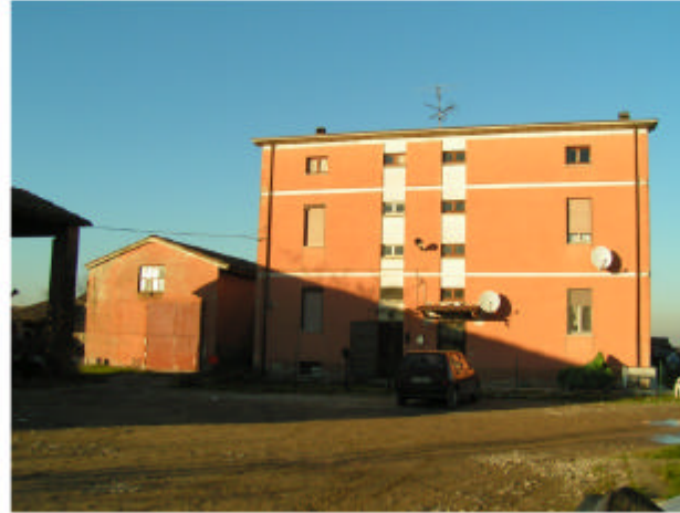
2. Edificio 1. Fronte sud