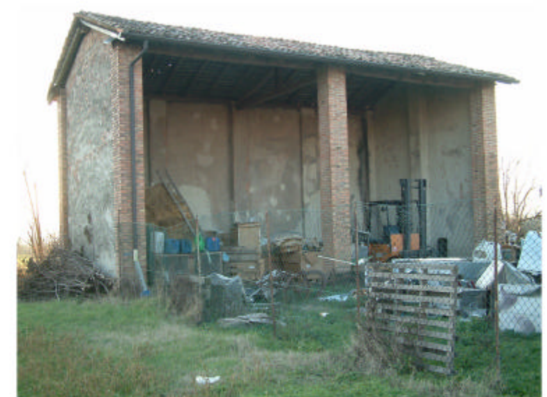
9. Edificio 5. Fronte nord