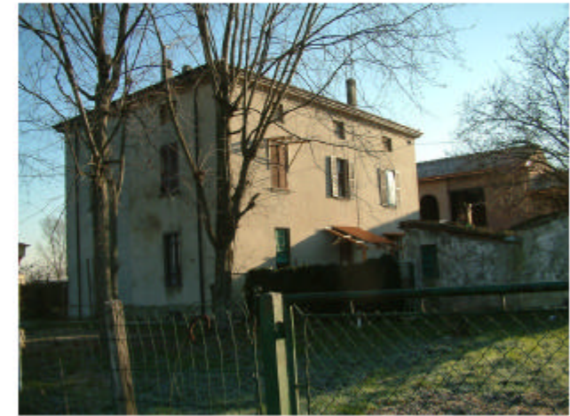
3. Edificio 1. Fronte sud-ovest