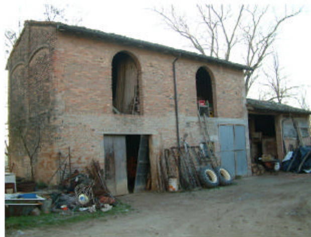
5. Edificio 3. Fronti est e nord