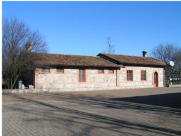
4. Edificio 2. Fronte nord-ovest