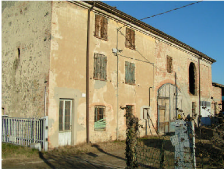
1. Edificio 1. Fronte sud