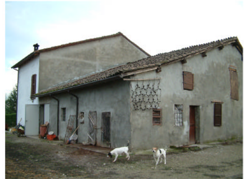
2. Edificio 1. Fronti nord e ovest