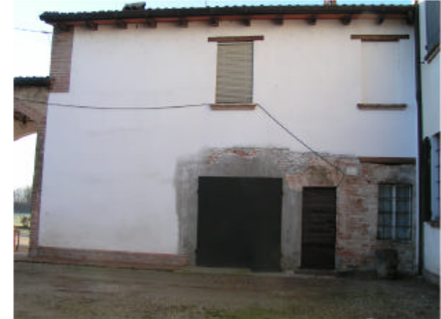
3. Edificio 1c. Fronte nord