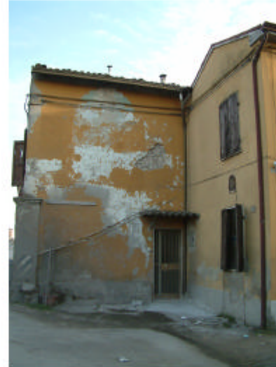
5. Edificio 2, parte 2a. Fronti ovest e nord.