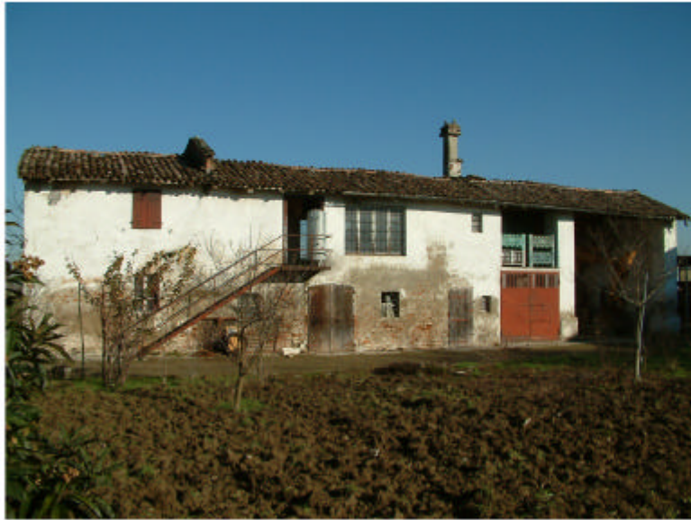
1. Edificio 1. Fronte sud