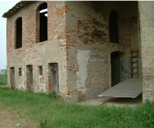
10. Edificio 3, parte 3c. Fronte ovest.