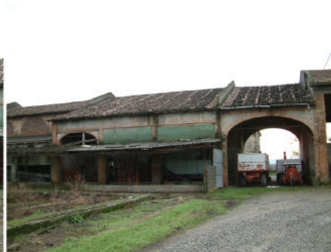
5. Edificio 2, parti 2b e 2c. Fronte nord.