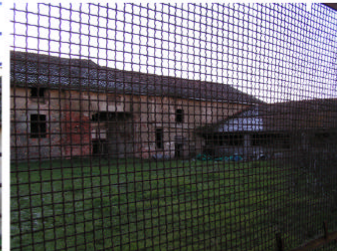
12. Edificio 1b-1d-1e-1l. Fronte nord