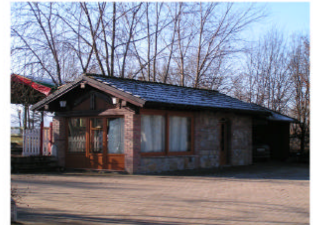
6. Edificio 4