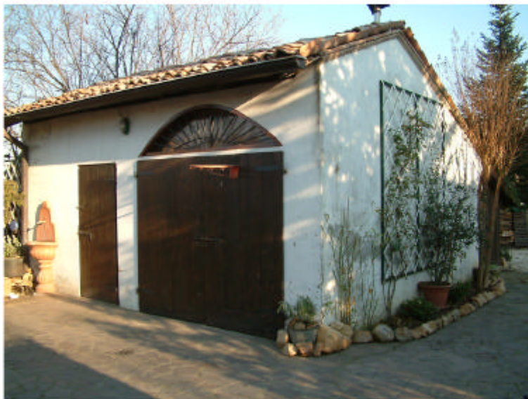
3. Edificio 2. Fronte sud-ovest