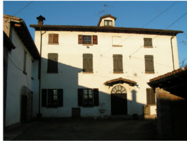
2. Edificio 1a. Fronte est