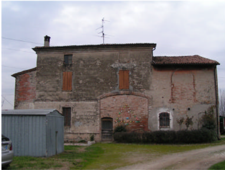
1. Edificio 1. Fronte est