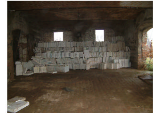
6. Edificio 1c