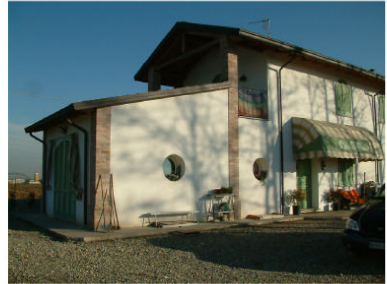
2. Edificio 1. Fronte sud-ovest