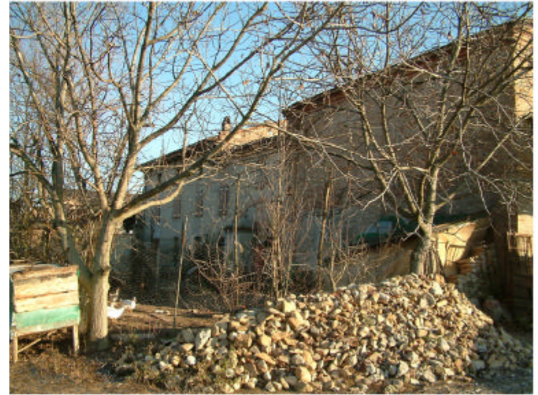
8. Edificio 1. Fronte ovest