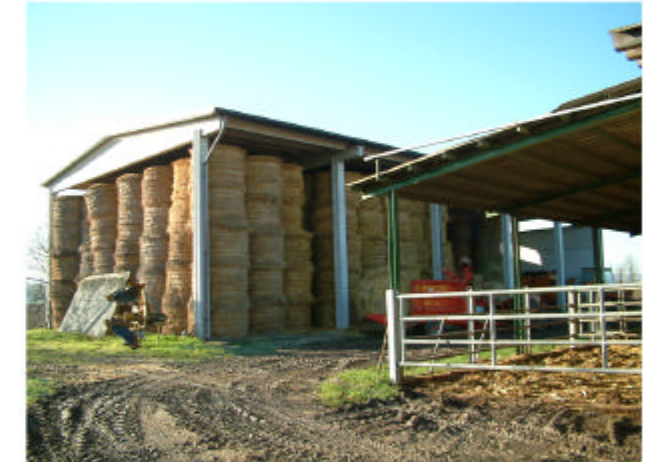
6. Edificio 4