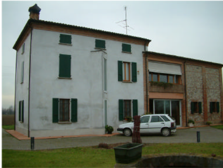
1. Edificio 1. Fronte est