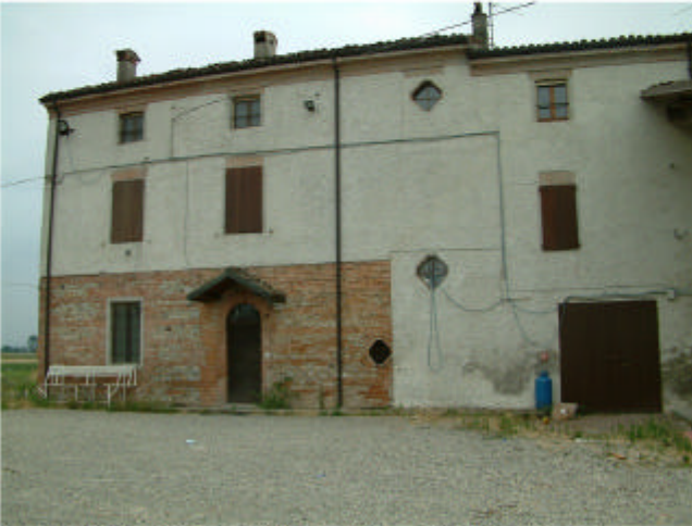
1. Edificio 1, parti 1a e 1b. Fronte nord.