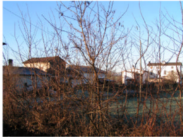
1. Vista generale da est