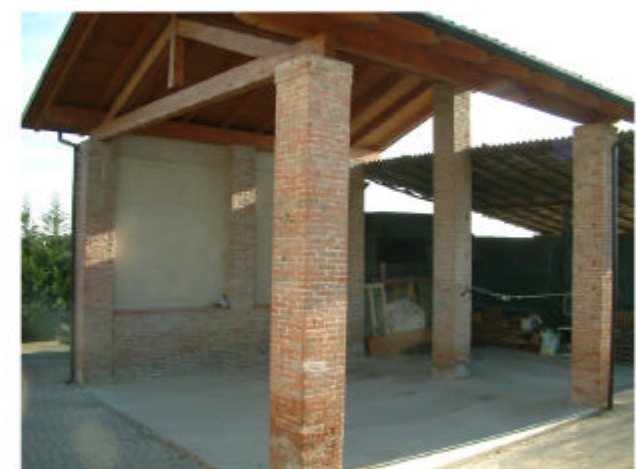
6. Edificio 4. Fronti nord e ovest