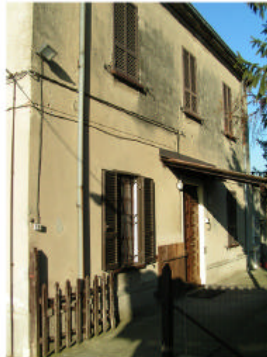
5. Edificio 1, parte 1b. Fronte est.