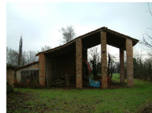
6. Edificio 4