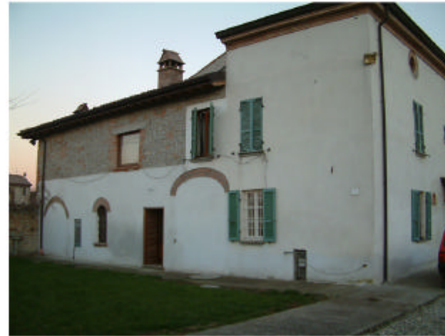
2. Edificio 1a-1b. Fronte ovest