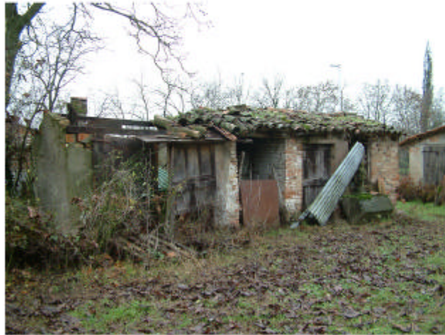
7. Edificio 5. Fronte ovest.