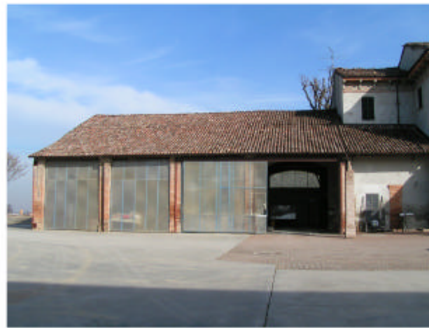
2. Edificio 1b-1c. Fronte sud-ovest