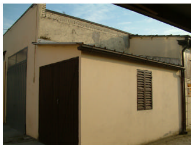
11. Edificio 3, parti 3a e 3b. Fronti nord e ovest.