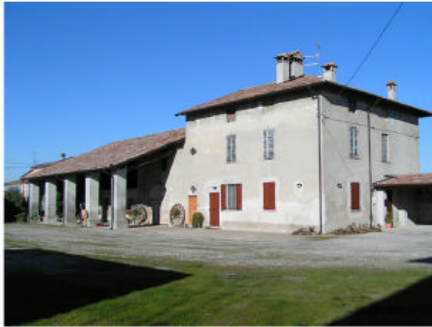
1. Edificio 1. Fronte sud