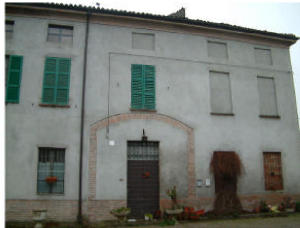
2. Edificio 1b-1c. Fronte nord