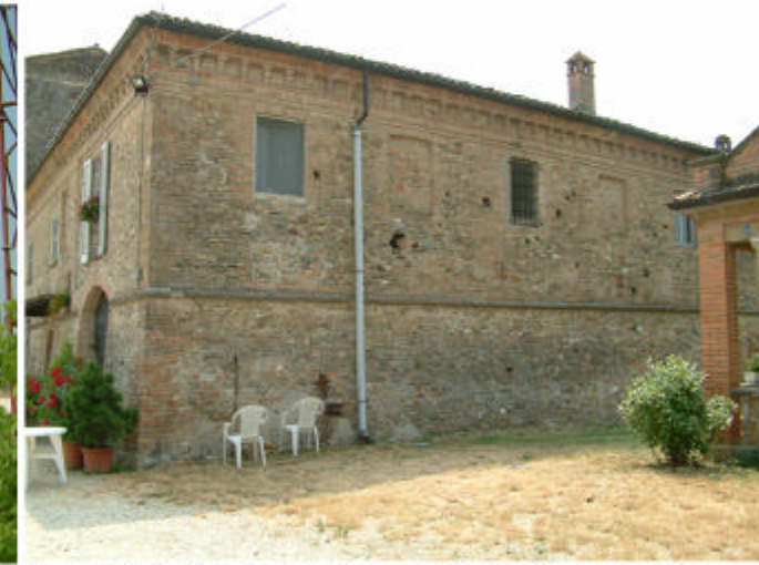
3. Edificio 1, parte 1d. Fronti nord e ovest.