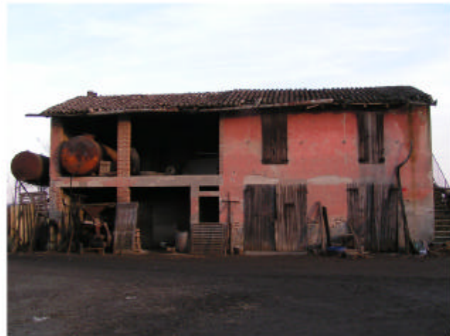
4. Edificio 2. Fronte est