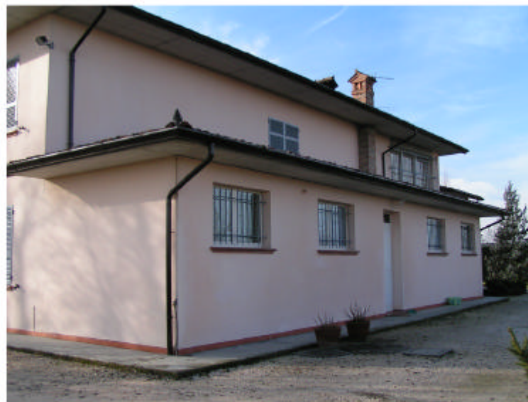
3. Fronte nord