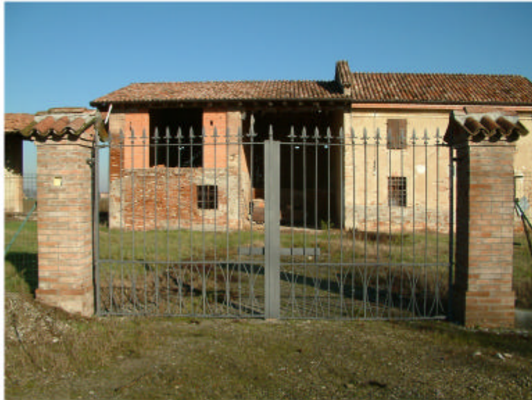
1. Ingresso da sud