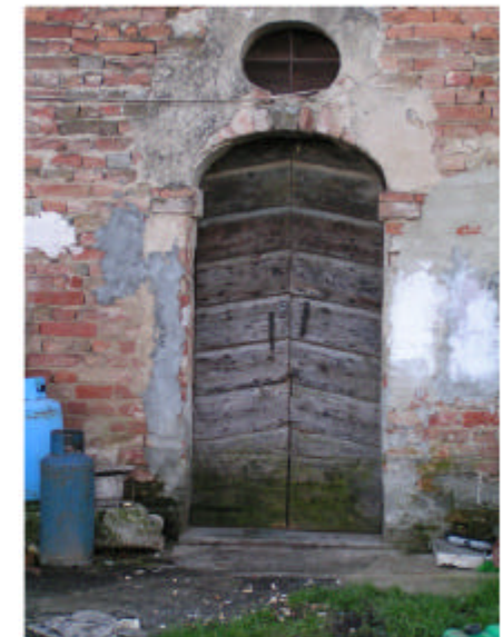
18. Edificio 4f. Porta fronte nord