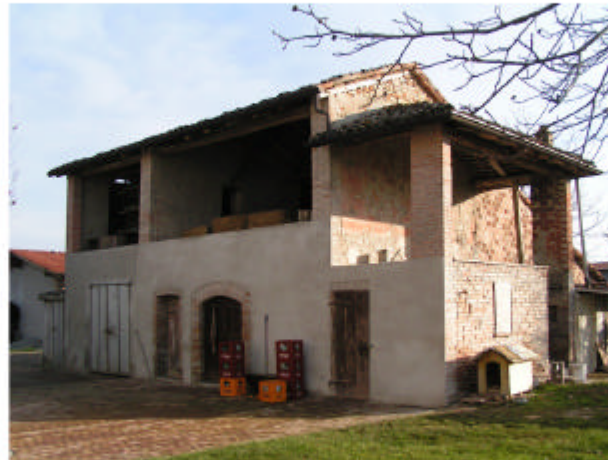
5. Edificio 2. Fronte ovest