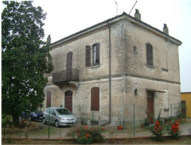
1. Edificio 1. Fronti nord e ovest.