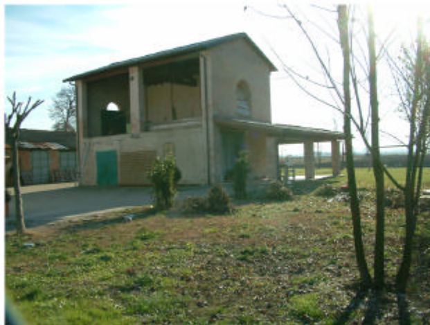
4. Edificio 2. Fronti nord e ovest