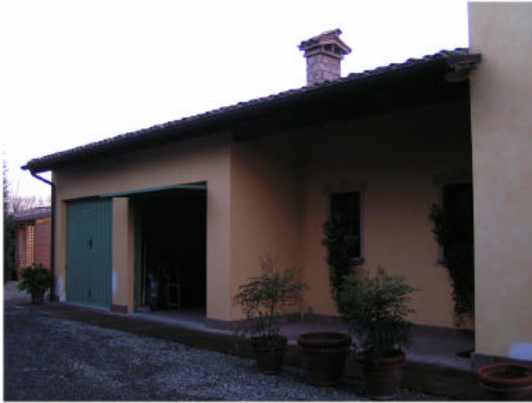
1. Edificio 1b. Fronte nord