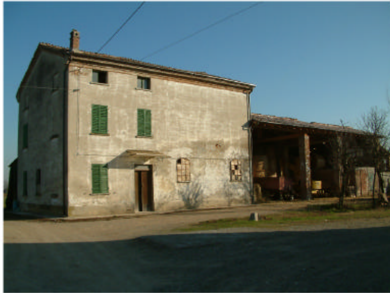
1. Edificio 1. Fronte sud