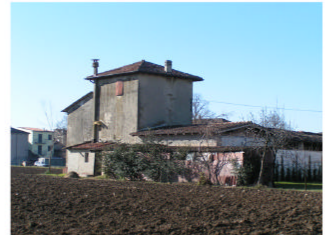
6. Edificio 3. Fronte est