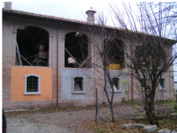
10. Edificio 6f. Fronte est