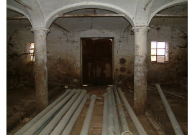
3. Edificio 1, parte 1c. Interno stalla