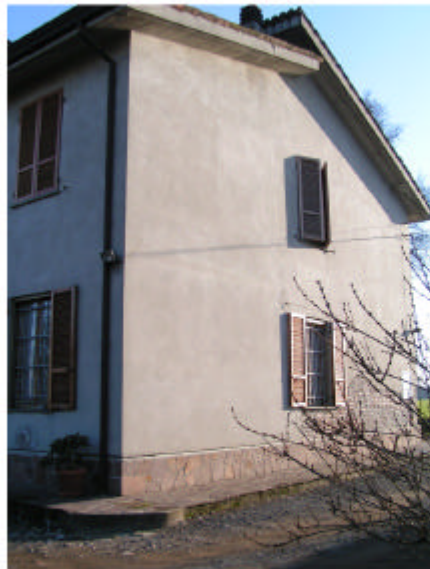
3. Edificio 1a. Fronte ovest