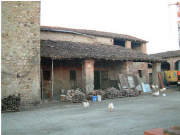
4. Edificio 2c. Fronte sud