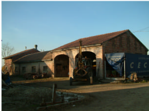
4. Edificio 2. Fronti sud ed est