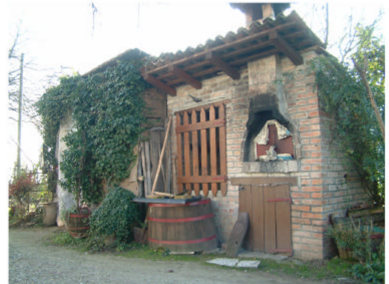
4. Edificio 2. Fronte nord