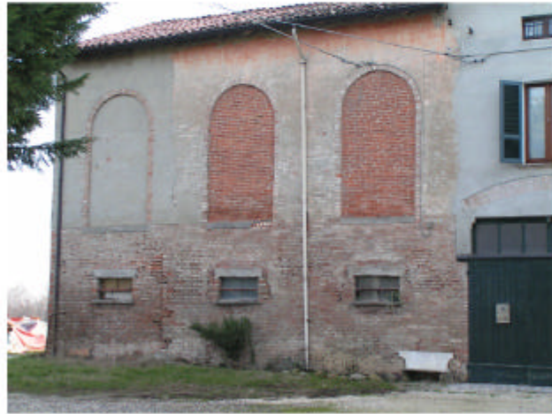
1. Edificio 1c. Fronte ovest