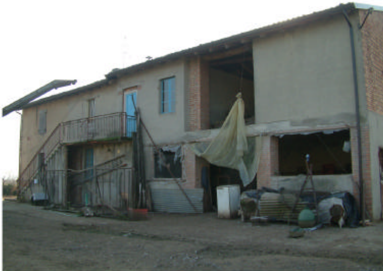
3. Edificio 1. Fronte nord