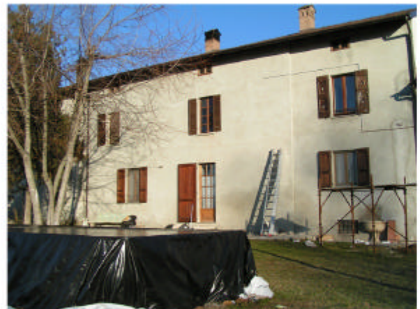
4. Edificio 1b. Fronte sud