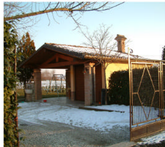
5. Edificio 2. Fronti nord-est e nord-ovest