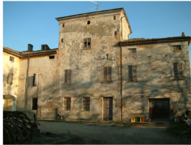
2. Edificio 1. Fronte ovest