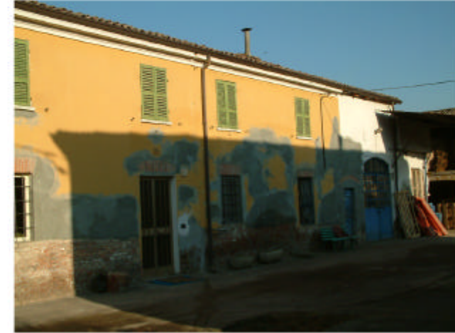
3. Edificio 2. Fronte sud