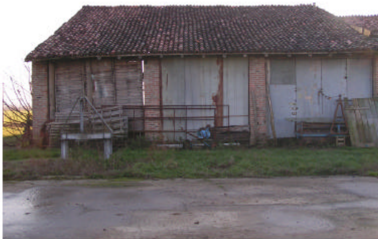
4. Edificio 1a. Fronte nord