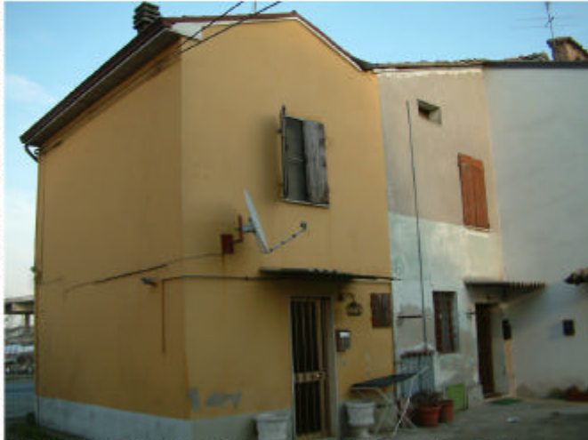
7. Edificio 2, parte 2a. Fronti ovest e sud.