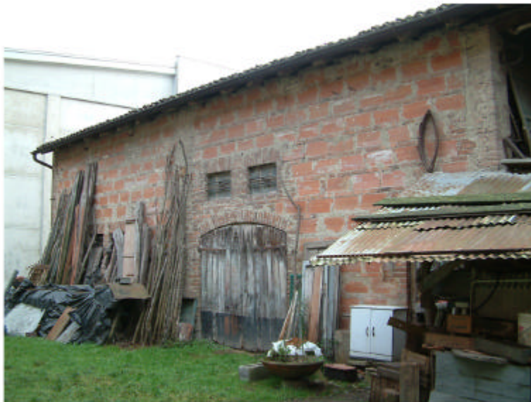
3. Edificio 2. Fronte nord