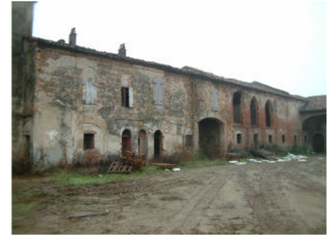
3. Edificio 1. Fronte nord