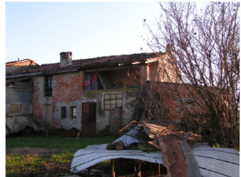
5. Edificio 1c-1d. Fronte nord