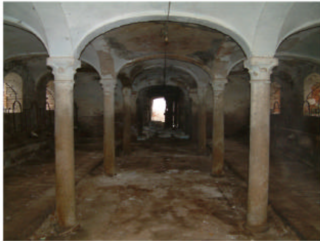
7. Edificio 1d. Interno stalla