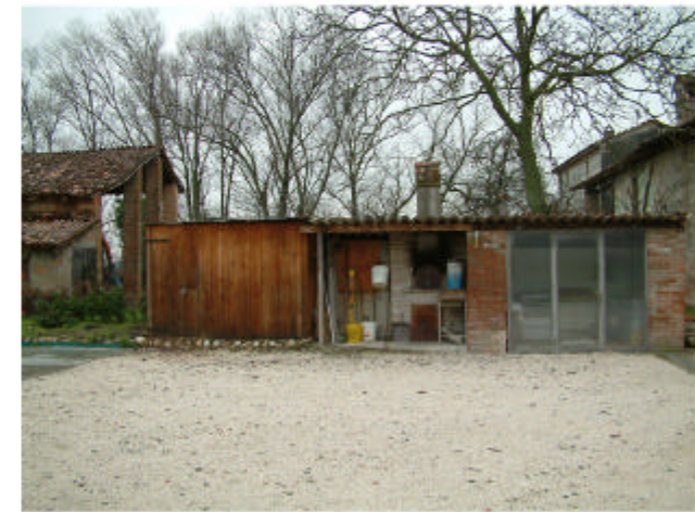
9. Edificio 7. Fronte est