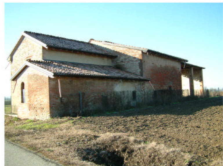
4. Edificio 1. Fronti est e nord