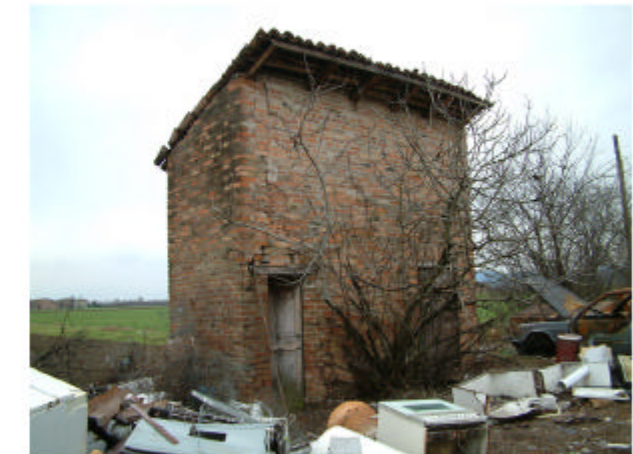
6. Edificio 3. Fronte Ovest