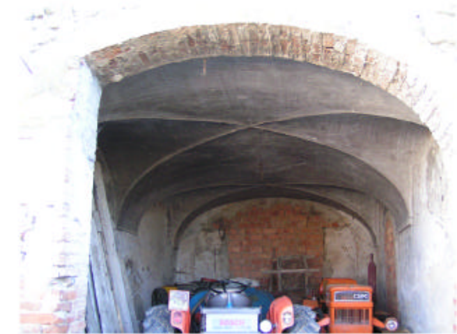
9. Edificio 5c. Piano terra