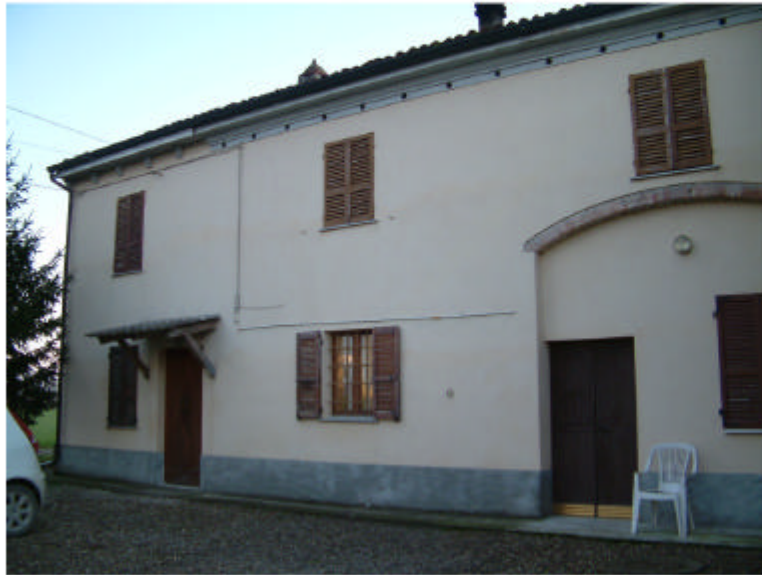
1. Edificio 1a-1b. Fronte nord