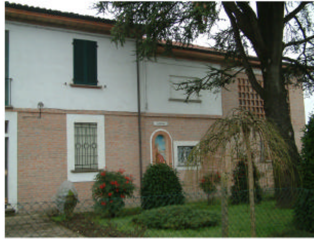
2. Edificio 1b-1a. Fronte nord