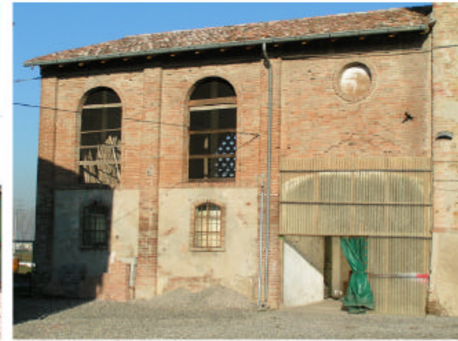
3. Edificio 1, parti 1c e 1d. Fronte sud.