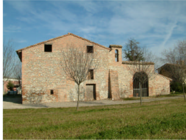
2. Edificio 1, parti 1c, 1d, 1e. Fronte sud