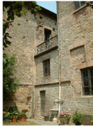
5. Edificio1, parte 1h. Fronte sud