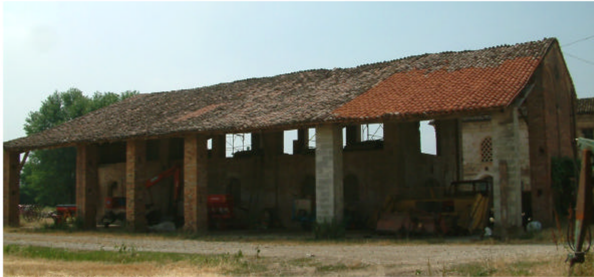
14. Edificio 3. Fronte nord