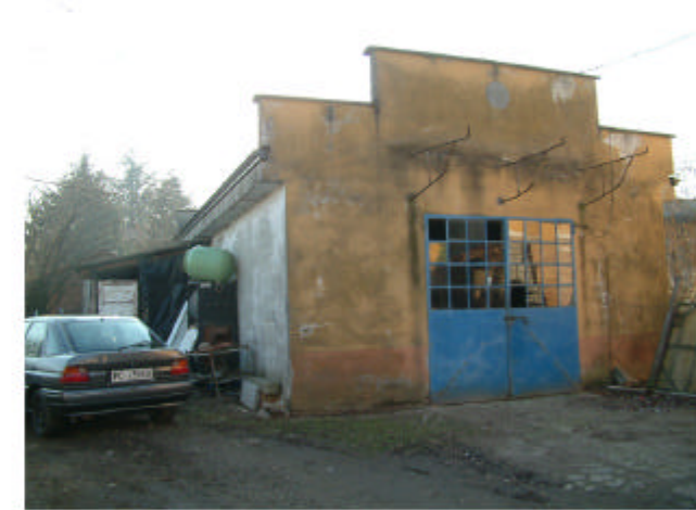
6. Edificio 4. Fronte nord