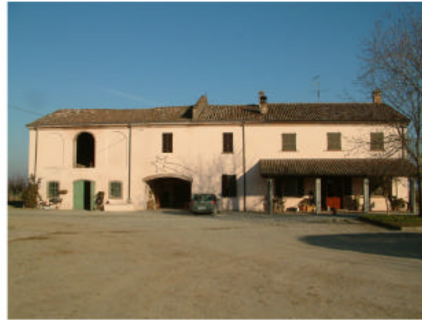
2. Edificio 1. Fronte sud