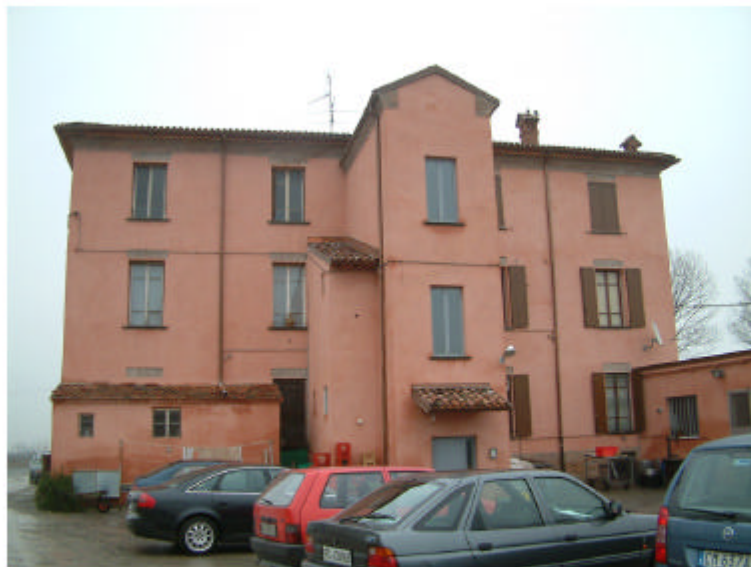
3. Edificio 1a. Fronte sud