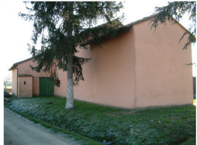
4. Edificio 1. Fronte nord