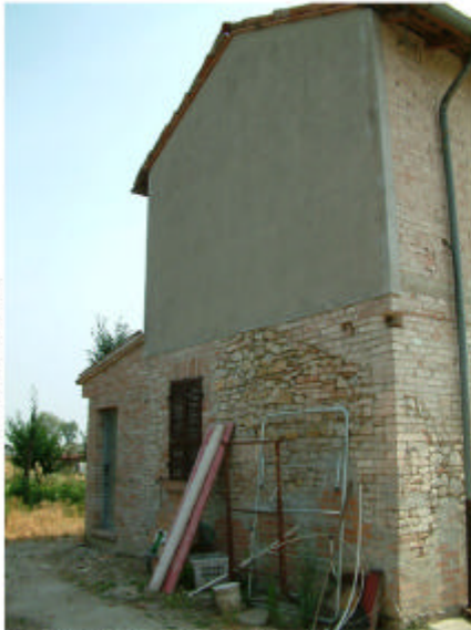
1. Edificio 1, parte 1a. Fronte ovest.