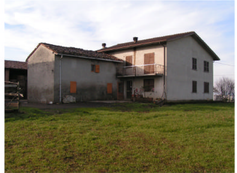
2. Edificio 1. Fronti est e nord