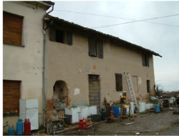
2. Edificio 1a. Fronte sud