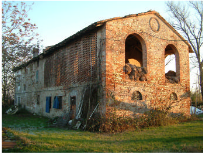
1. Edificio 1. Fronte nord-ovest