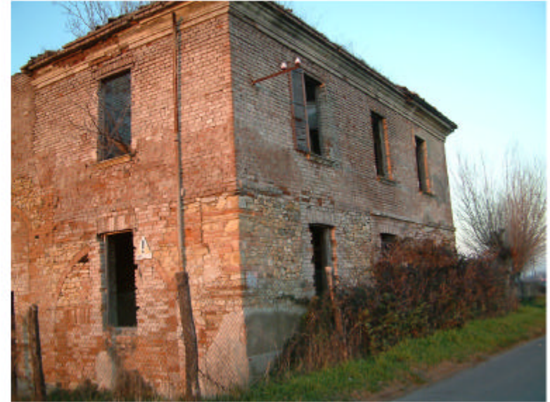
2. Edificio 1b. Fronti sud-ovest e sud-est