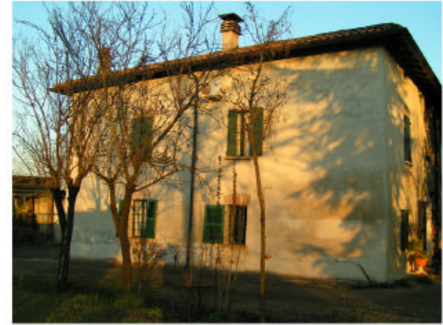
3. Edificio 1, parte 1a. Fronte ovest