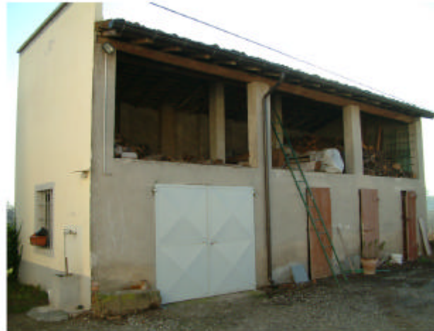
5. Edificio 3. Fronte ovest