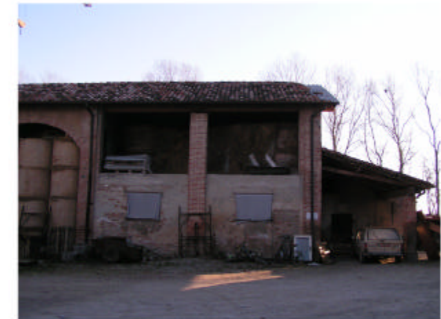
6. Edificio 2a-2b. Fronte ovest