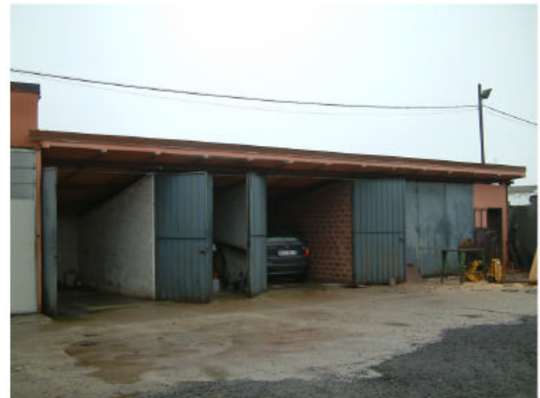
4. Edificio 1b. Fronte ovest