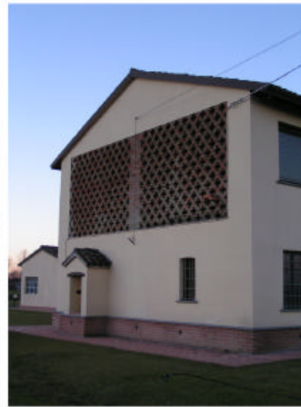
2. Edificio 1. Fronte sud