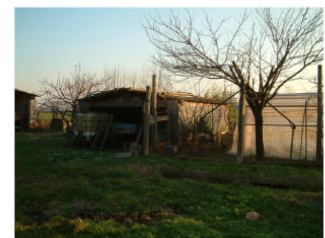
6. Edificio 4. Fronti nord e ovest