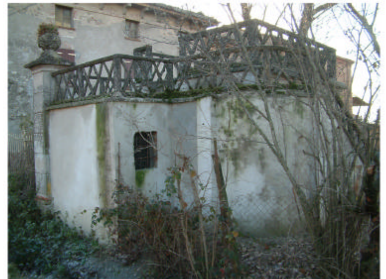
10. Edificio 3. Fronti nord e ovest