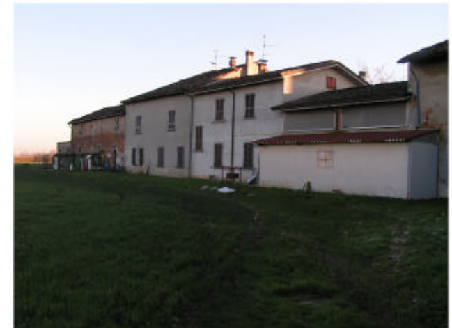
12. Edificio 4. Fronte nord