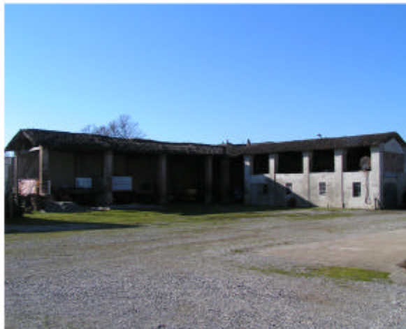
4. Edificio 2. Fronti nord ed est