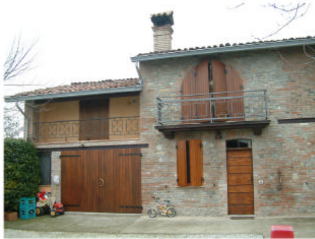
1. Edificio 1d. Fronte sud-ovest