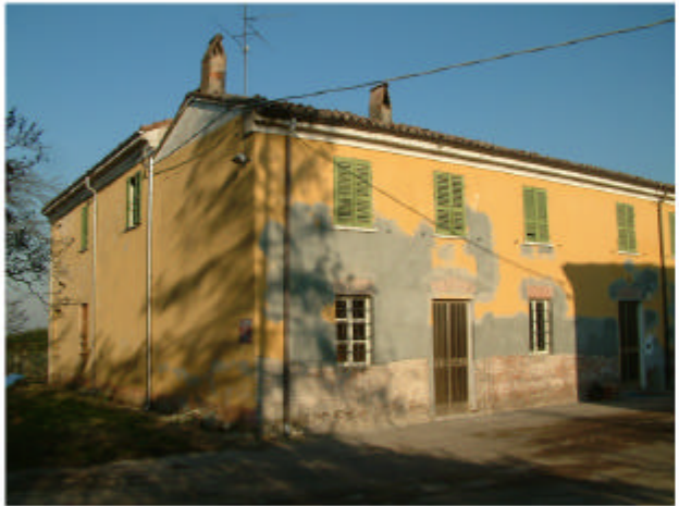
4. Edificio 2a-2c. Fronte sud-ovest