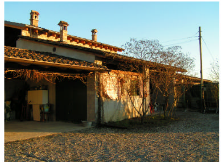
4. Edificio 2. Fronte ovest