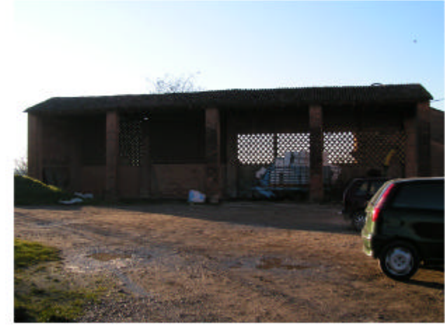
3. Edificio 2. Fronte est