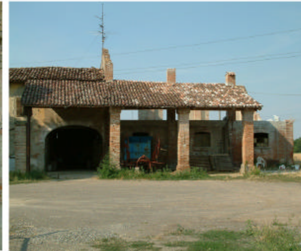
3. Edificio 1, parti 1a e 1b. Fronte sud.