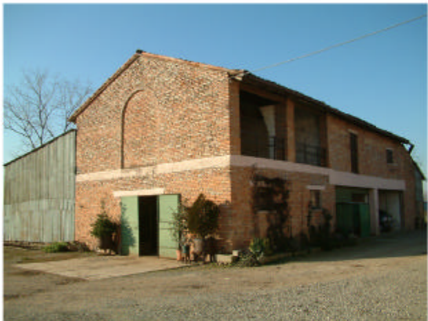
4. Edificio 2. Fronte nord-est