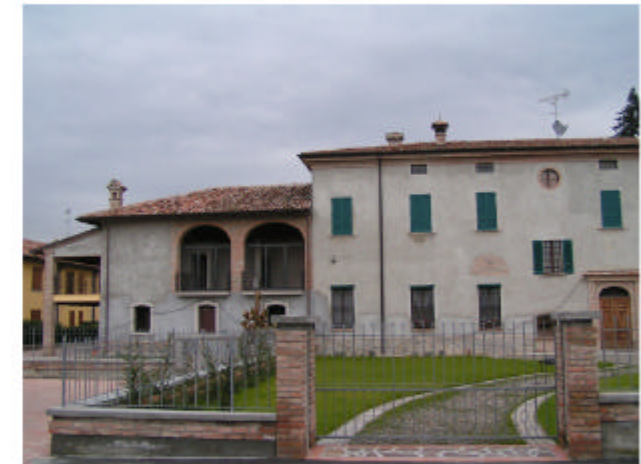
12. Edifici 6c-6d. Fronte sud