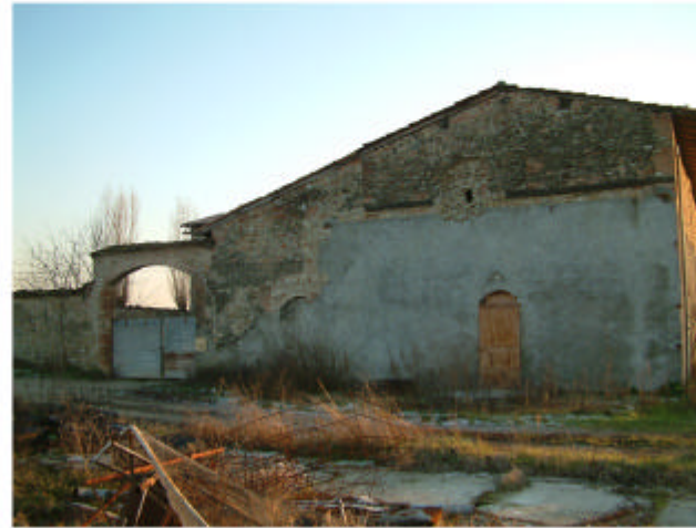
2. Ingresso nord