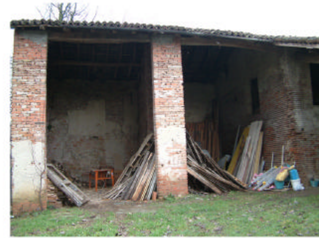
3. Edificio 2b. Fronte sud