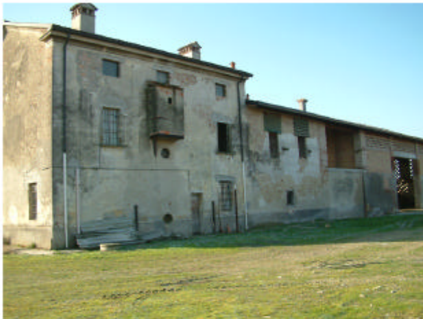
4. Edificio 1. Fronte nord