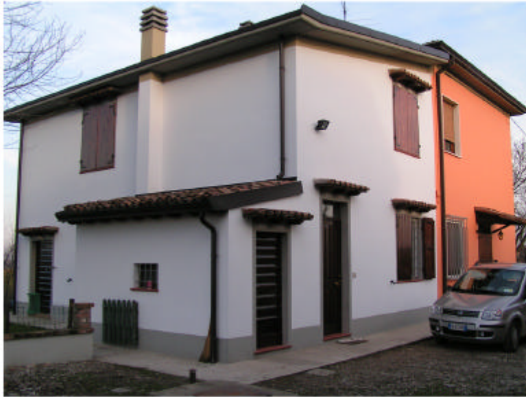
1. Edificio 1. Fronte sud-ovest