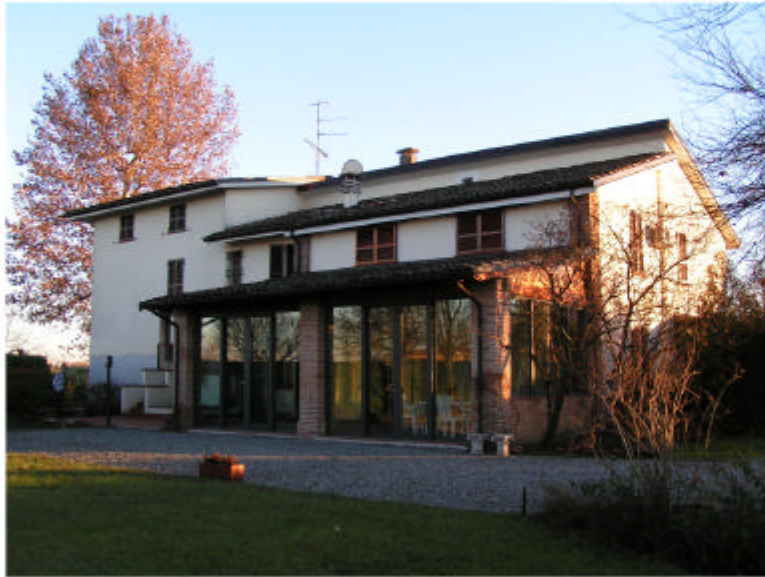
1. Edificio 1. Fronte nord