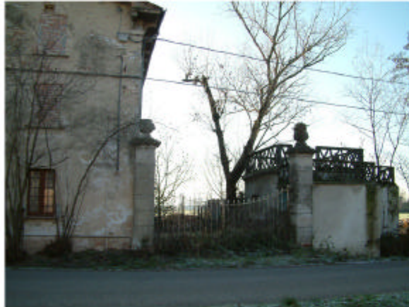
1. Ingresso nord originario