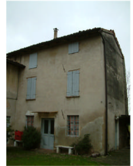
3. Edificio 1b. Fronte sud