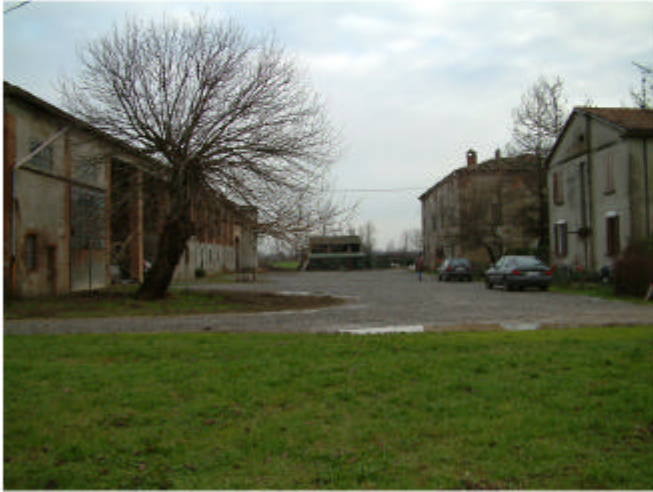
1. Vista della corte da Ovest.