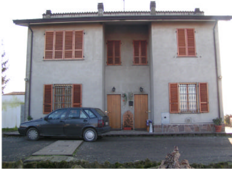
1. Edificio 1a. Fronte nord