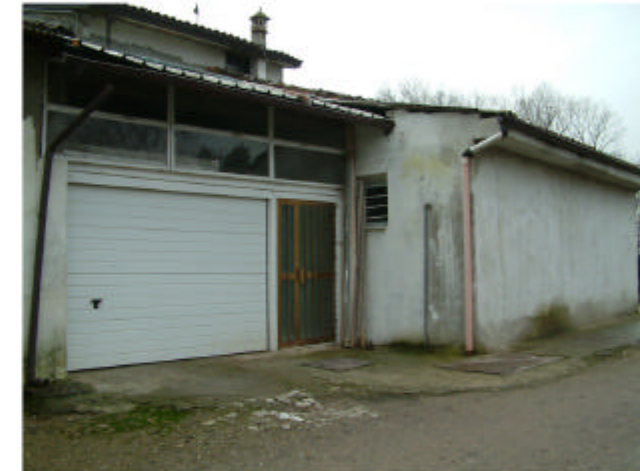
18. Edificio 12b. Fronte nord