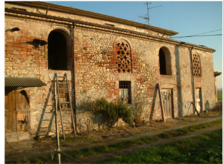
2. Edificio 1b. Fronte ovest