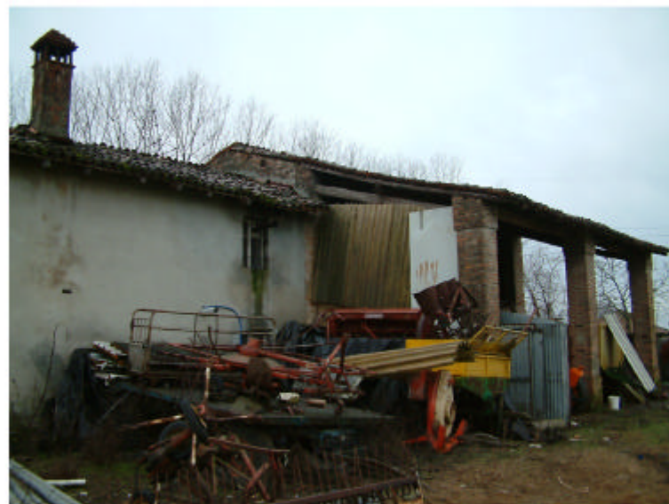
3. Edificio 1. Fronte nord