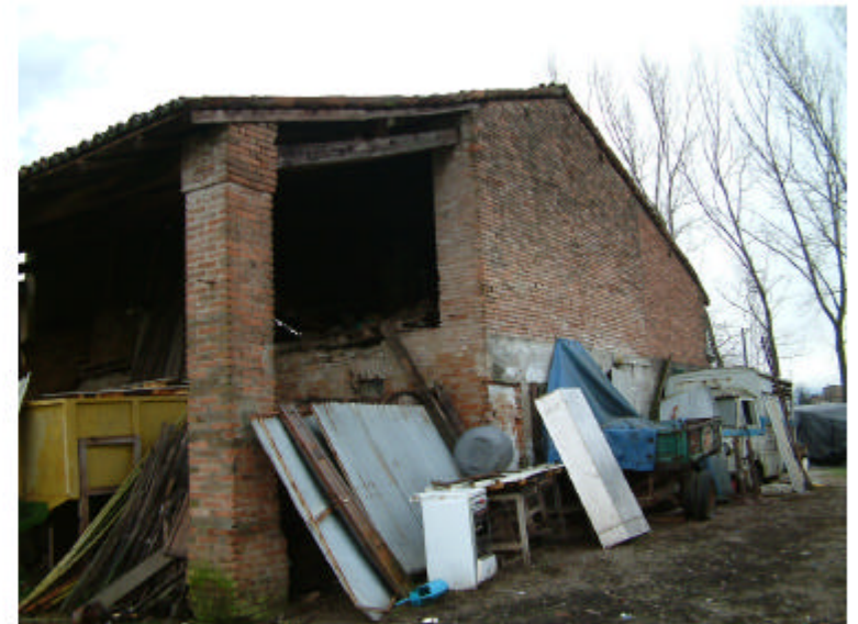
4. Edificio 1. Fronte ovest