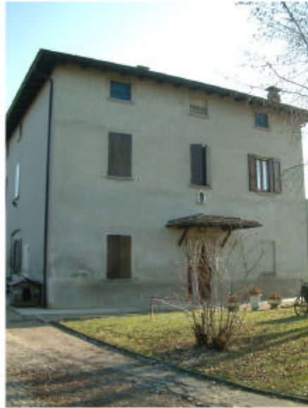
1. Edificio 1a. Fronte ovest