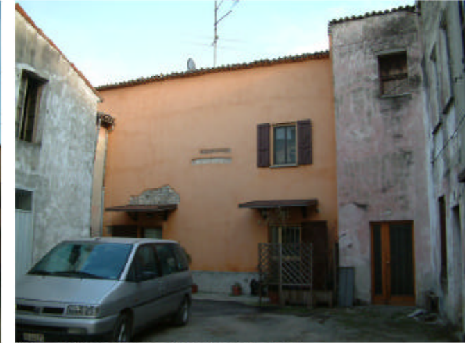
9. Edificio 2, parti 2d, 2f e 2g. Fronti sud, ovest e nord.