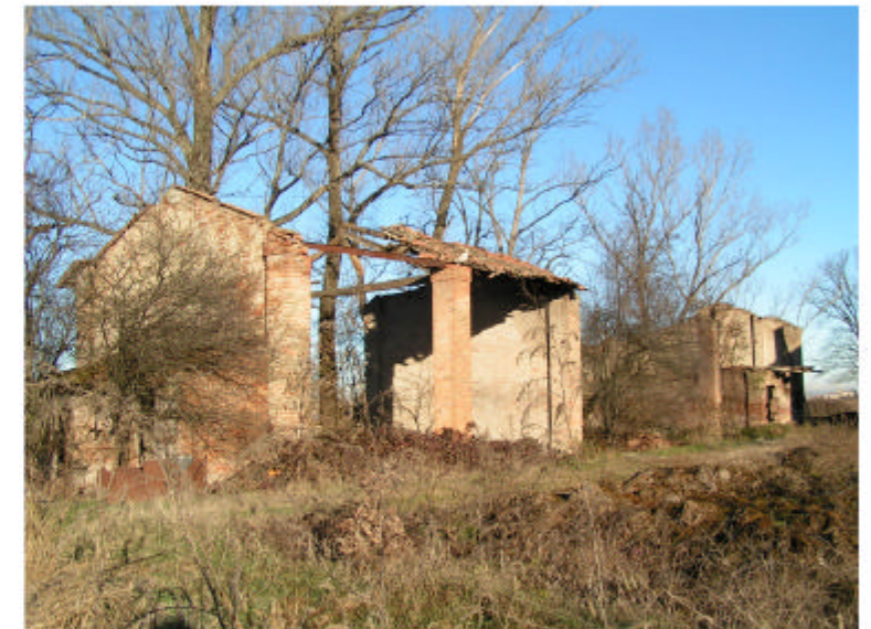
4. Edificio 2. Fronte est