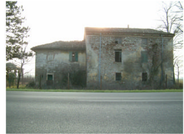
3. Edificio 1. Fronte nord