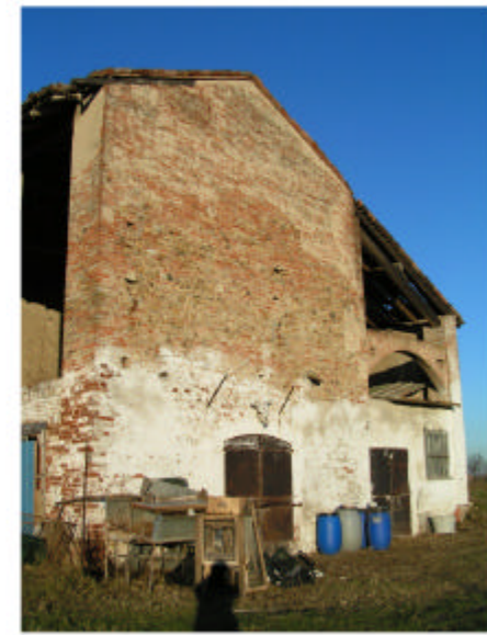
3. Parte 1b. Fronte sud