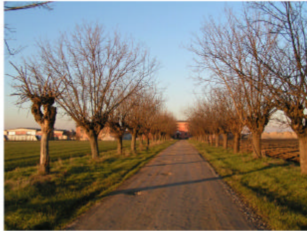
1. Viale d'accesso