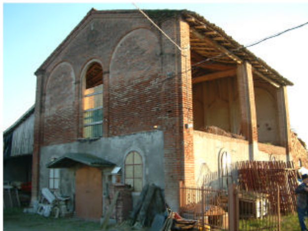
4. Edificio 2. Fronti nord e ovest