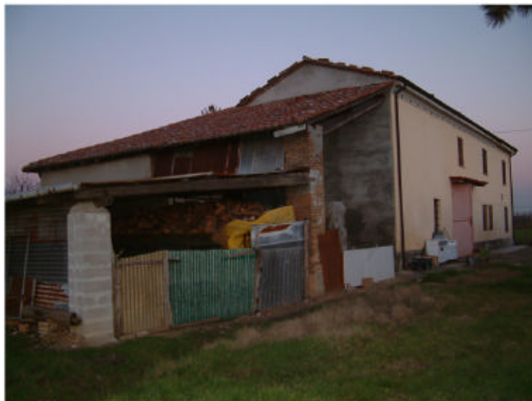
3. Edificio 1. Fronte sud