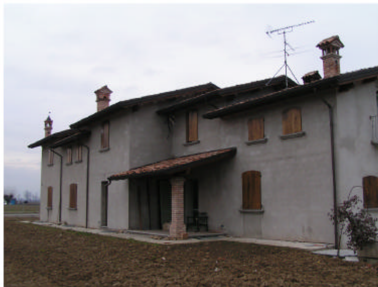
3. Edificio 1a. Fronte est