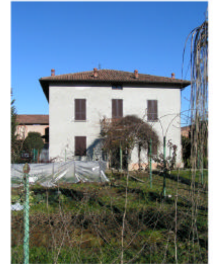
3. Edificio 1a. Fronte sud