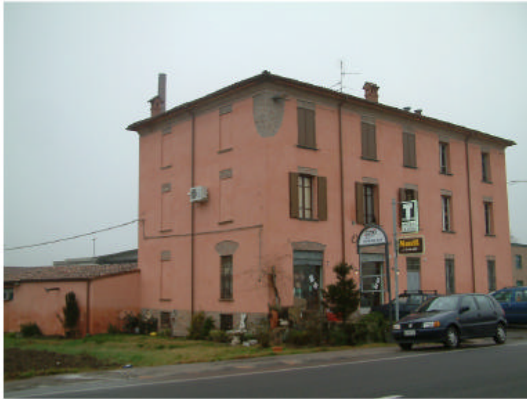
1. Edificio 1a. Fronte nord-est