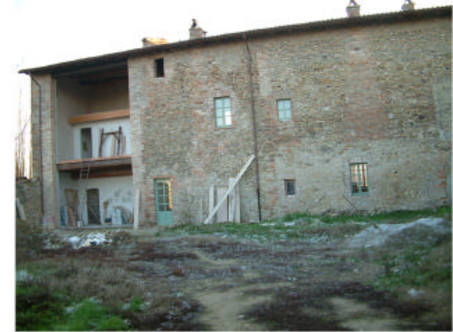
3. Edificio 1a. Fronte nord interno