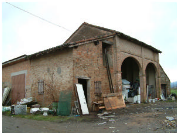
5. Edificio 2. Fronte nord-est