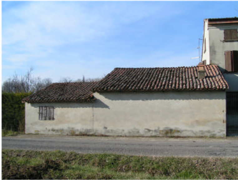
1. Edificio 1c. Fronte est