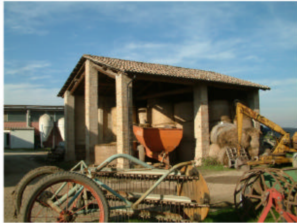
13. Edificio 6. Fronti sud ed est