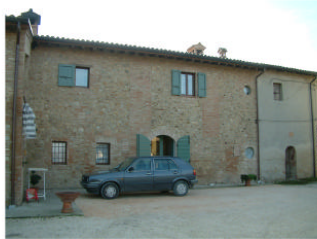
8. Edificio 3, parti 3c, 3d. Fronte nord