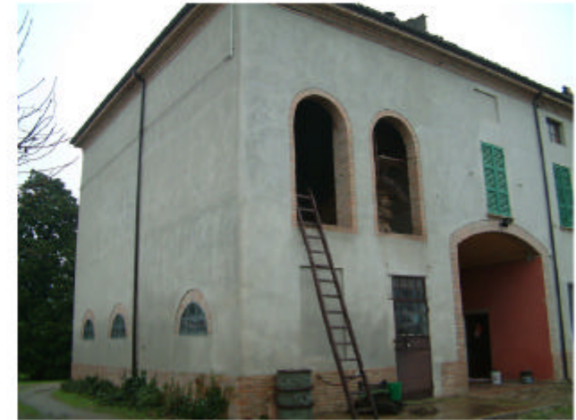
3. Edificio 1b-1c. Fronte sud