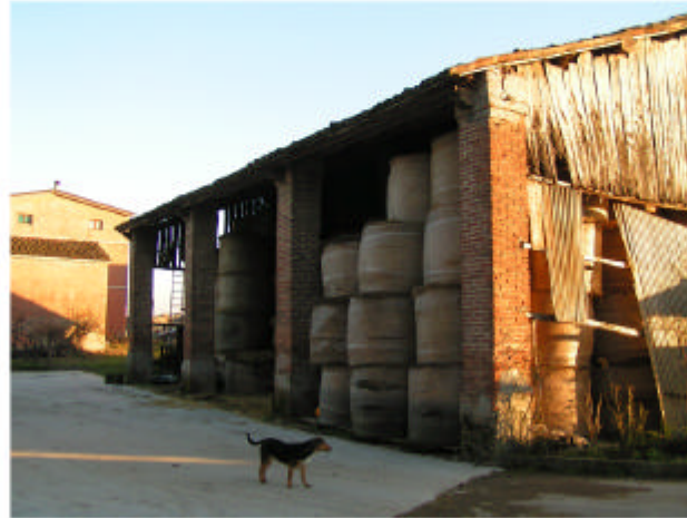
14. Edificio 6. Fronte nord