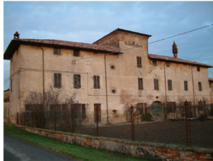
11. Edificio 1a. Fronte sud