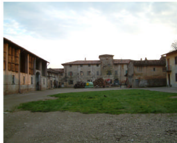
4. Vista delle corti da Nord