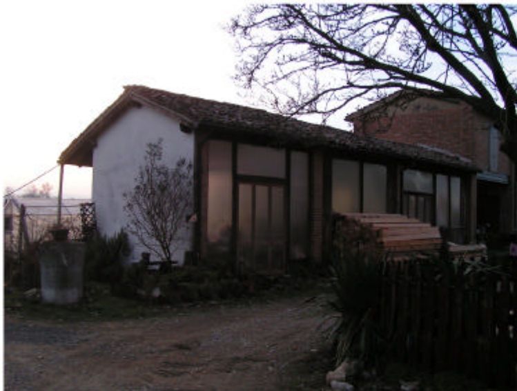
3. Edificio 2a. Fronte nord