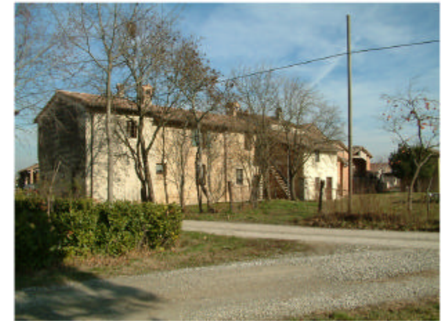
9. Edificio 3. Fronte sud