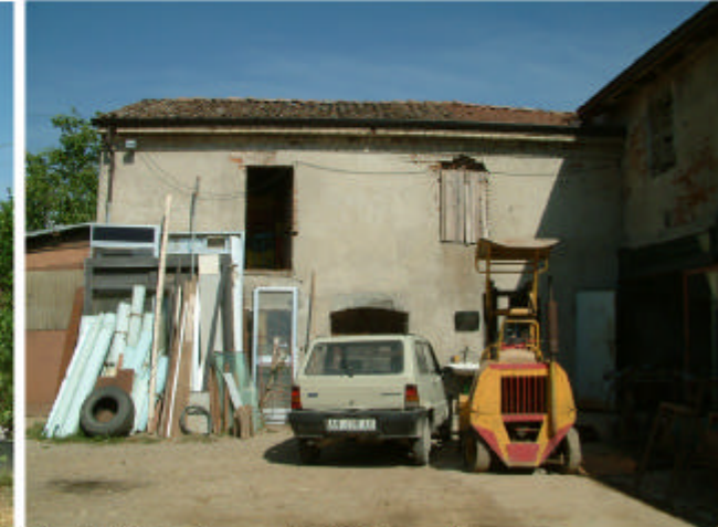
3. Edificio 1, parti 1f, 1e e 1b. Fronti ovest e nord.