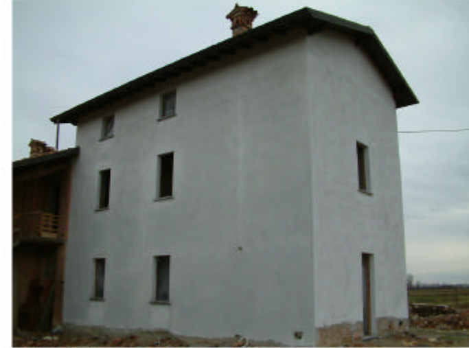
3. Edificio 1, parte 1a. Fronti ovest e sud.