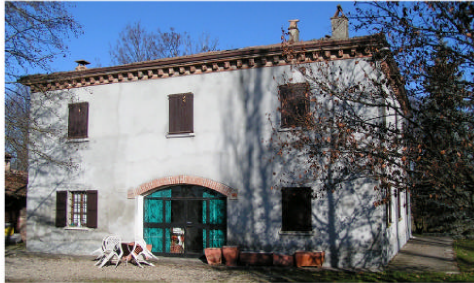
1. Edificio 1. Fronte sud