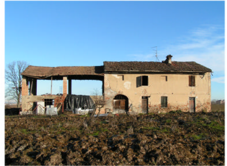
2. Edificio 1. Fronte sud