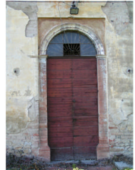
16. Edificio 1a. Porta d'ingresso