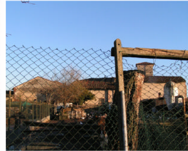
3. Fronte ovest