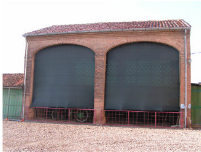
2. Edificio 2, parte 2a. Fronte est.