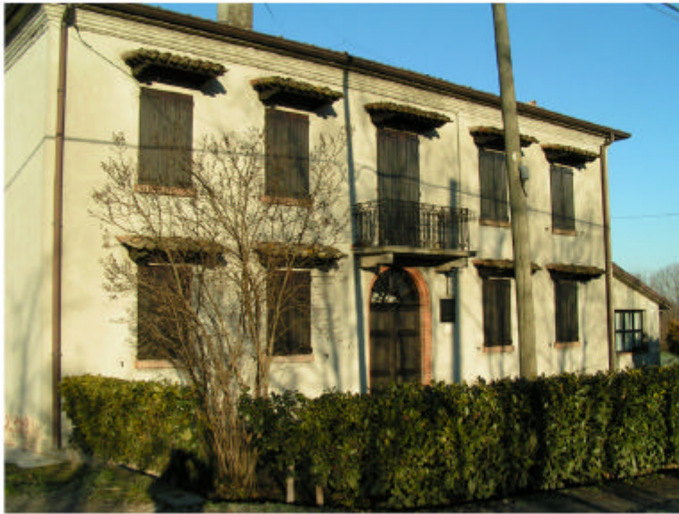
1. Edificio 1. Fronte est