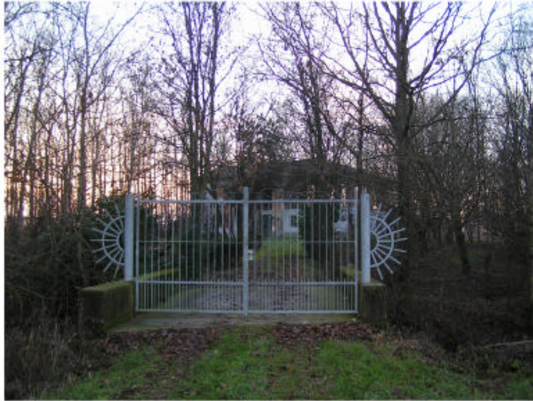
1. Accesso da est, sul ponticello