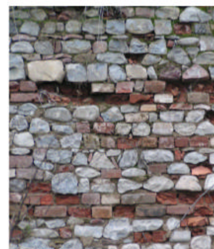
7. Edificio 1, parte 1c. Muratura.