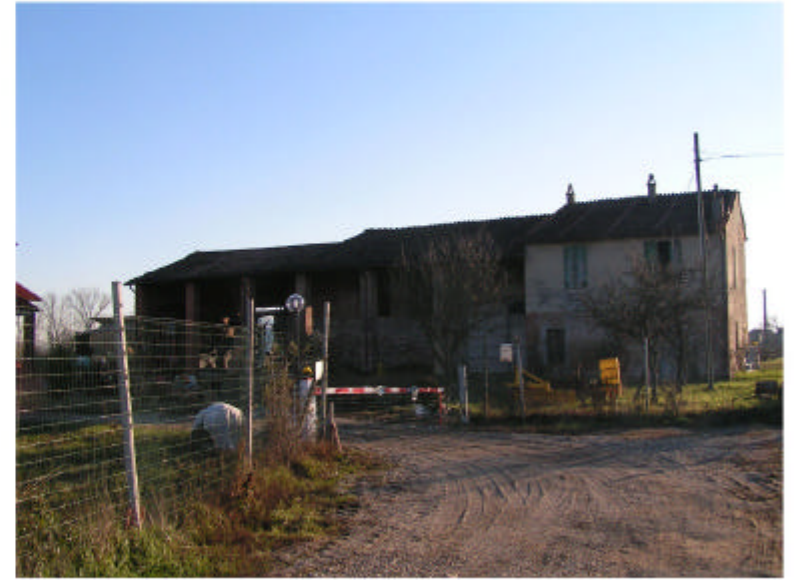
2. Edificio 1. Fronte nord