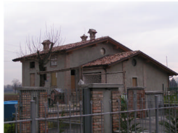
4. Edificio 4. Fronte nord