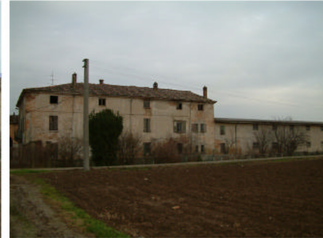
3. Edificio 1. Fronte sud.