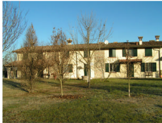
2. Edificio 1a. Fronte sud