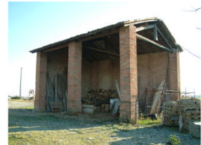
6. Edificio 3. Fronte nord-ovest