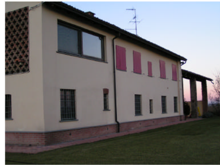
3. Edificio 1. Fronte est