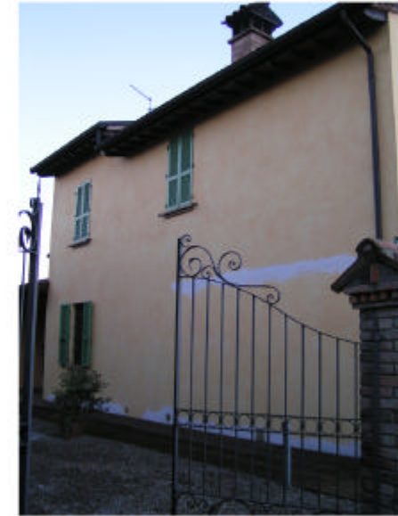
2. Edificio 1a. Fronte nord