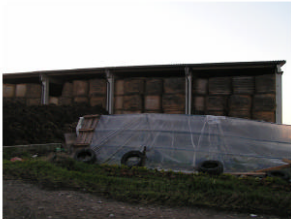
16. Edificio 8