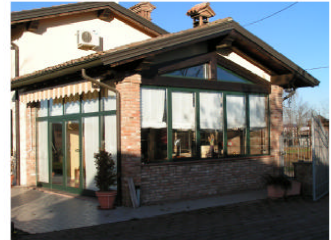
3. Edificio 1b. Fronte sud-est