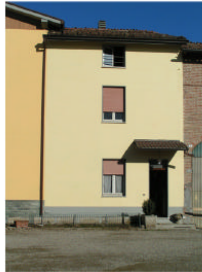
2. Edificio 1b. Fronte sud