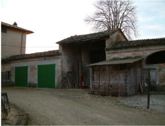
7. Edifici 1h-1i-2a. Fronte est