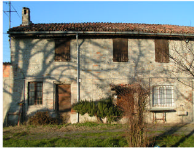
2. Edificio 1, parte 1c. Fronte sud