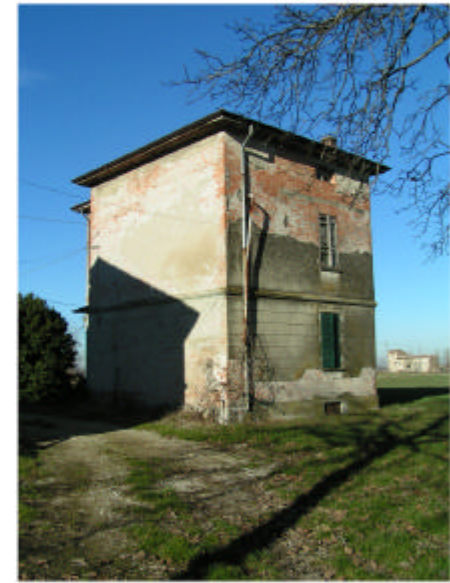
2. Fronte sud e ovest