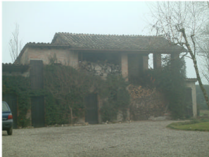
4. Edificio 1d. Fronte ovest