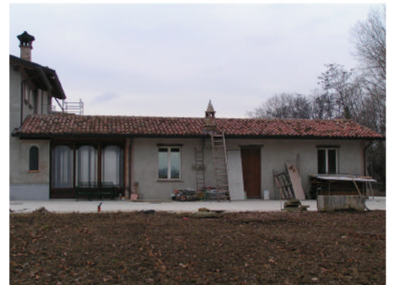
4. Edificio 1b. Fronte nord