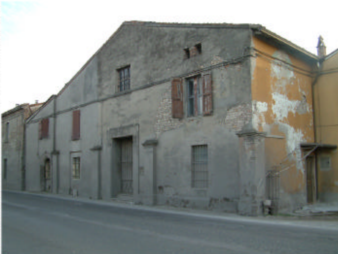
4. Edificio 2, parti 2d, 2b, 2a. Fronte nord, sulla Via Emilia.