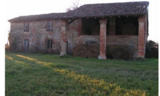
3. Edificio 1. Fronte est