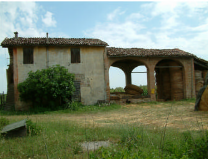
4. Edificio 2. Fronte sud