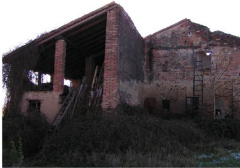
1. Edificio 1. Fronte nord