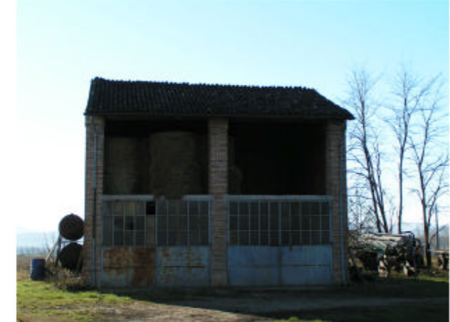
6. Edificio 4. Fronte nord