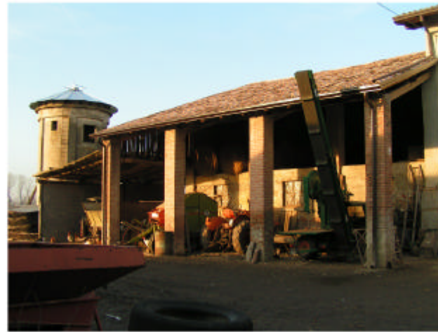
2. Edificio 1c. Fronte sud