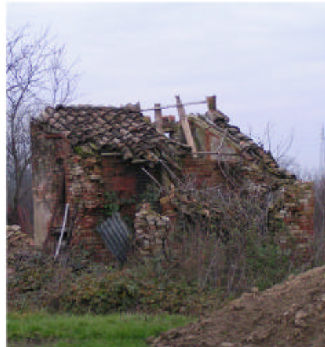
5. Edificio 2. Fronti est e nord