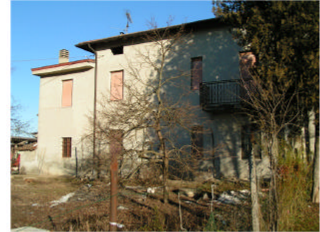
3. Edificio 1c-1d. Fronte sud