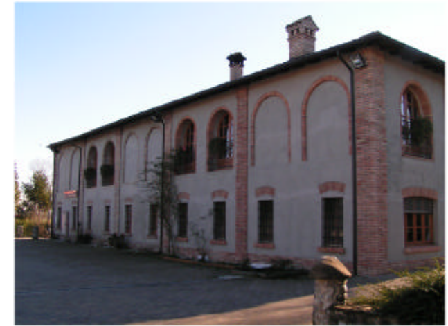
3. Edificio 1c. Fronte nord-ovest