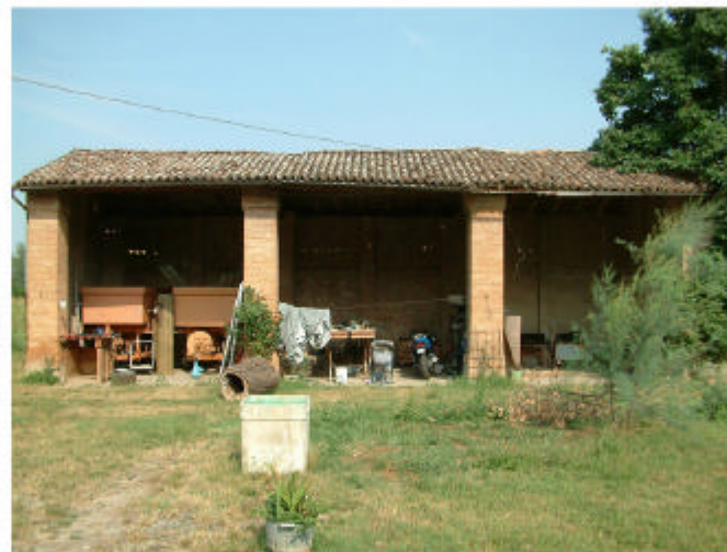
5. Edificio 3. Fronte ovest.