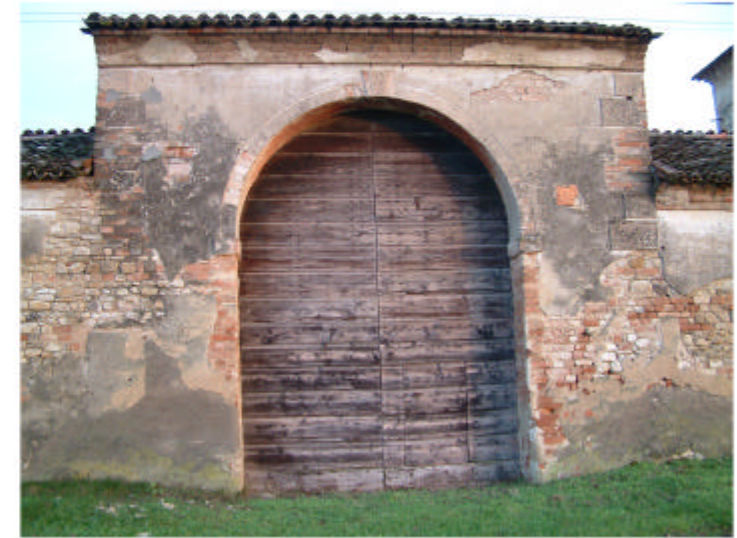
3. Ingresso 1i. Fronte ovest