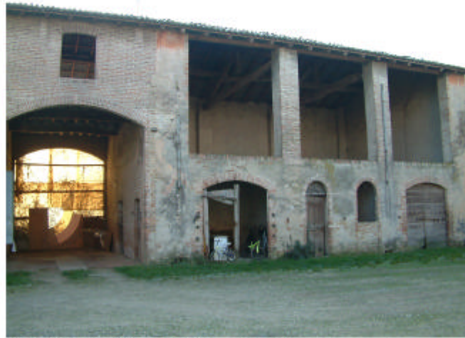
2. Edificio 2, parti 2b e 2c. Fronte nord.