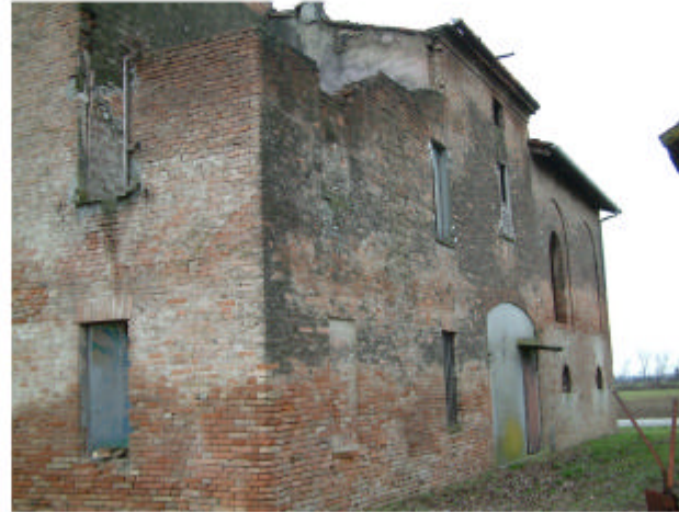
2. Edificio 1. Fronte est