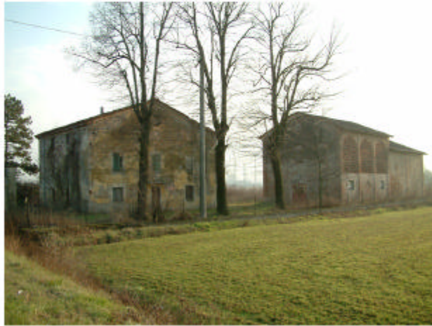
1. Vista generale da nord