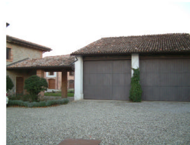
5. Edificio 2. Fronte ovest