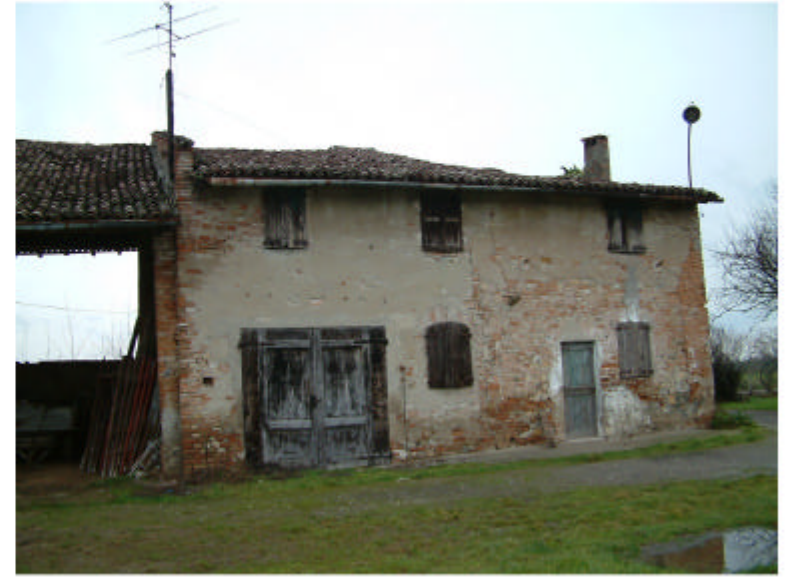
2. Edificio 1a. Fronte sud