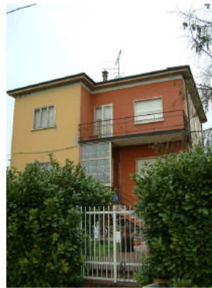
23. Edificio 16. Fronte sud