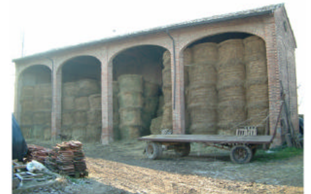
6. Edificio 4. Fronte est