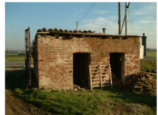
6. Edificio 4. Fronte ovest