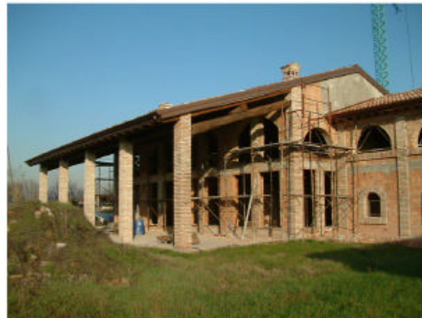
4. Edificio 2. Fronte ovest