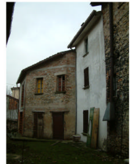
12. Edificio 9. Fronte nord