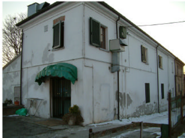
4. Edificio 3a. Fronti est e nord