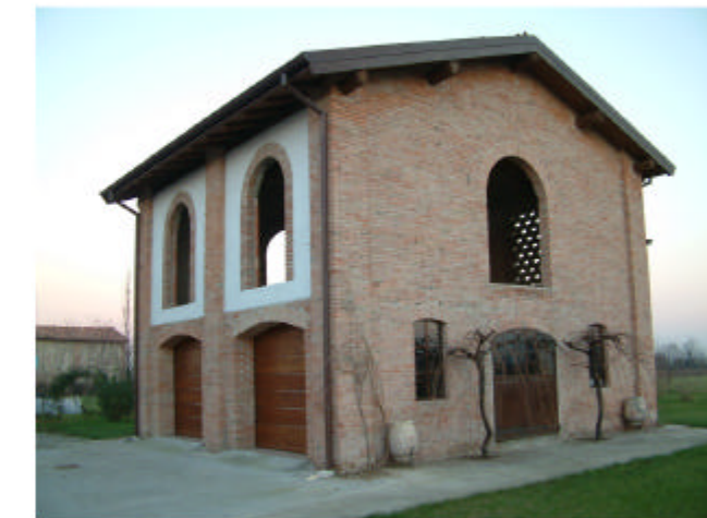
6. Edificio 3. Fronte sud-ovest