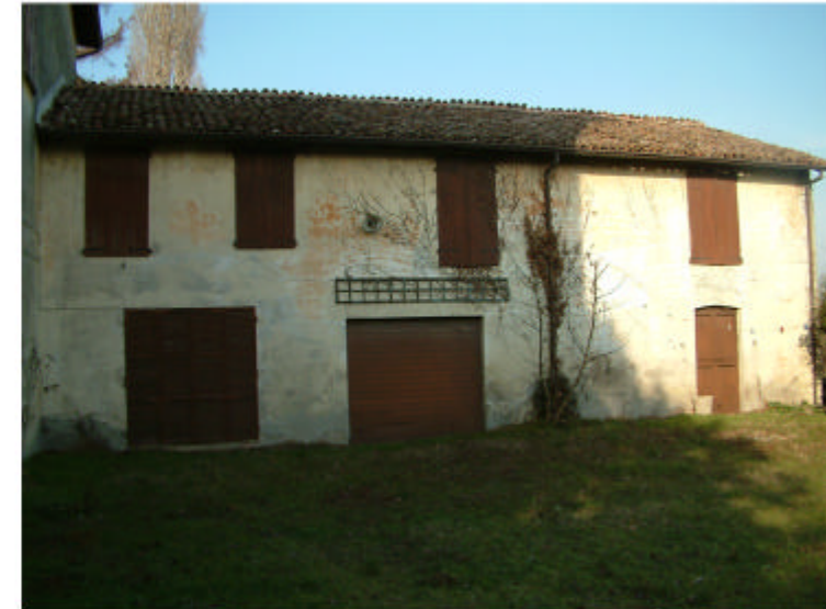
12. Edificio 4, parte 4c. Fronte sud.