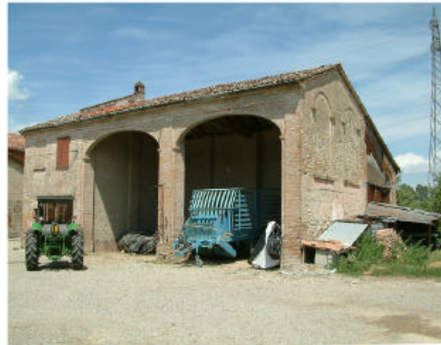
5. Edificio 2. Fronti ovest e sud