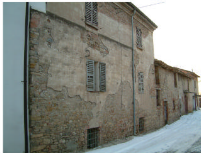
5. Edificio 3b. Fronte nord