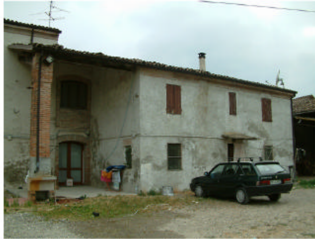
2. Edificio 1, parte 1c. Fronte nord.