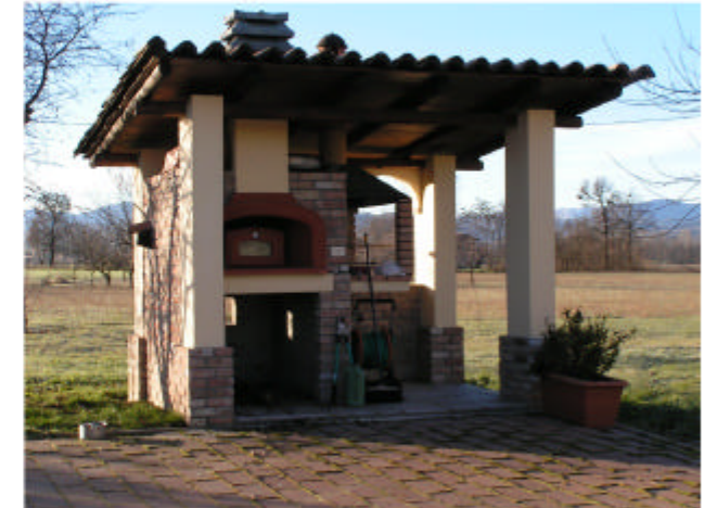
6. Edificio 4. Fronte nord