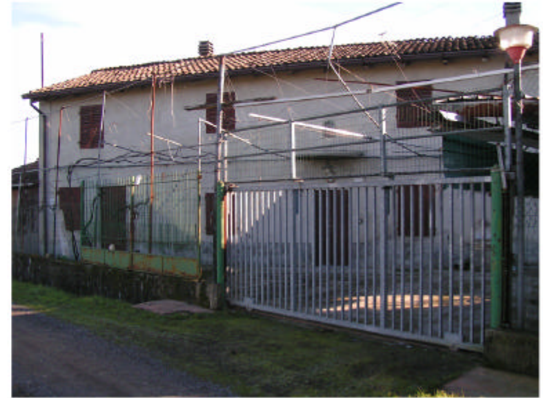
2. Fronte ovest