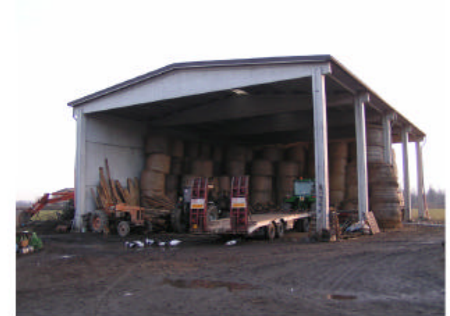
6. Edificio 4. Fronti nord e ovest