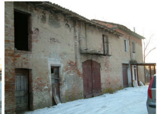
6. Edificio 3c e 3d. Fronti nord