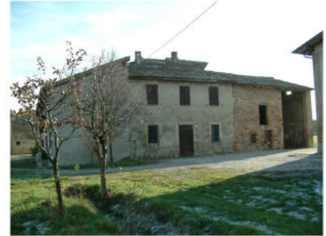
3. Edificio 1, parti 1a, 1b, 1c. Fronte ovest